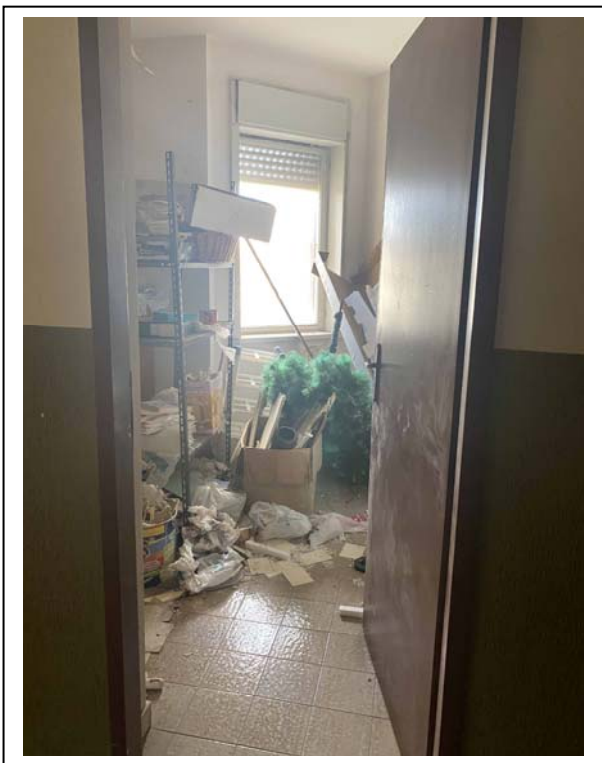
Fotografia n. 10 – Interno – cantina