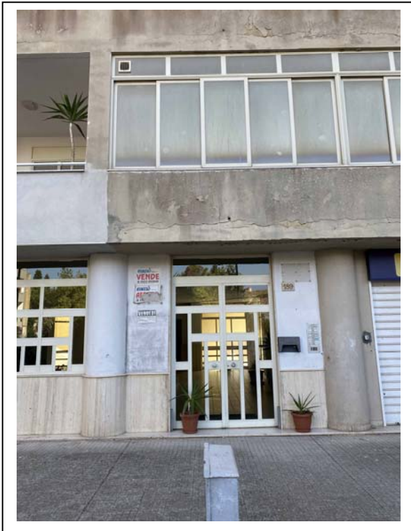
Fotografia n. 2 – Esterno Civico N. 189 - Scala B