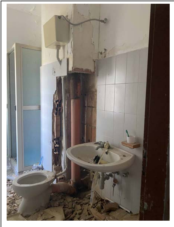
Fotografia n. 8 – Interno - bagno