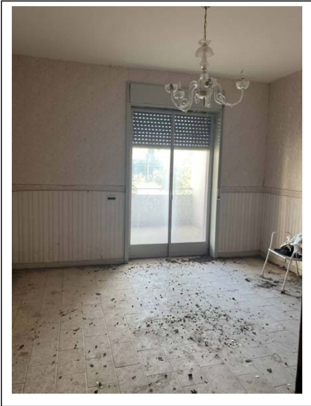
Fotografia n. 7 – Interno - letto#