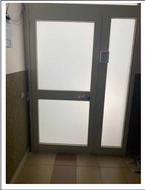
Fotografia n. 3 – Interno – infisso collocato su ballatoio condominiale#