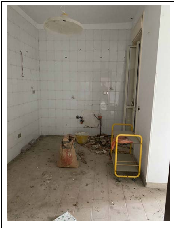
Fotografia n. 6 – Interno - cucina