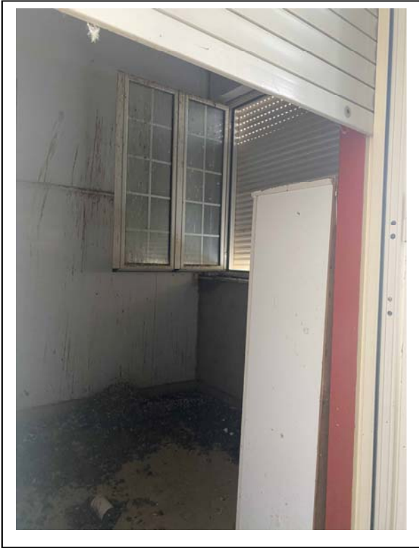
Fotografia n. 9 – Interno – balcone a loggia