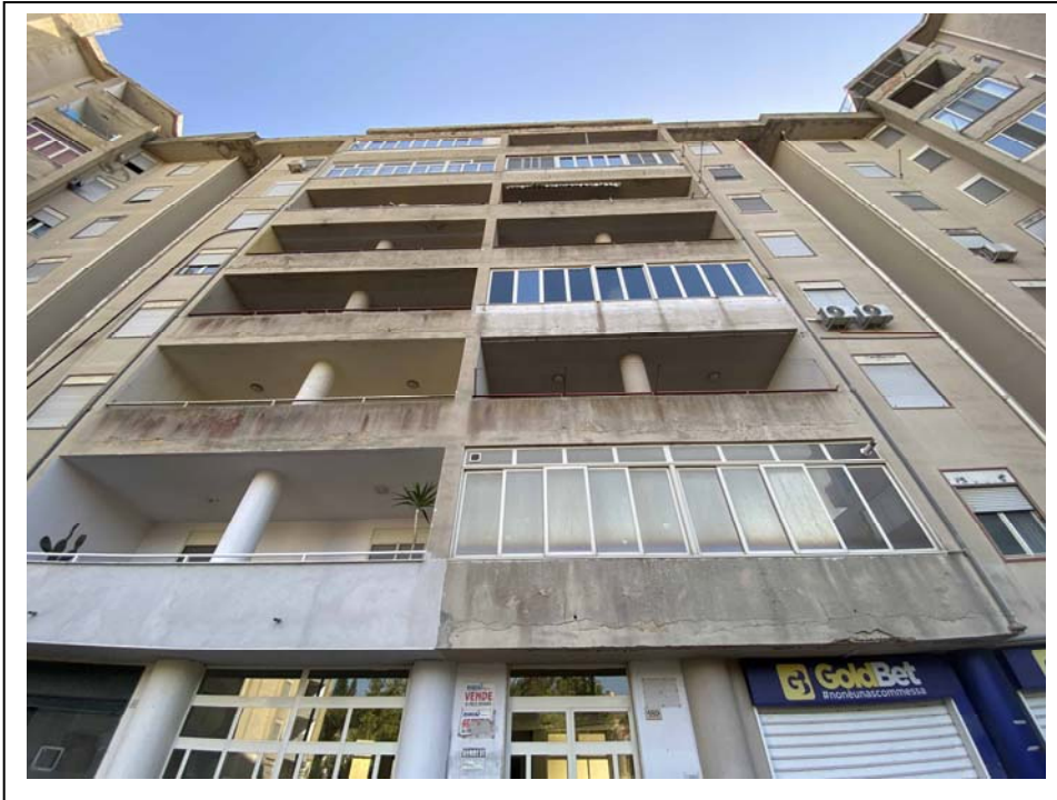
Fotografia n. 1 – Esterno Civico N. 189 - Scala B