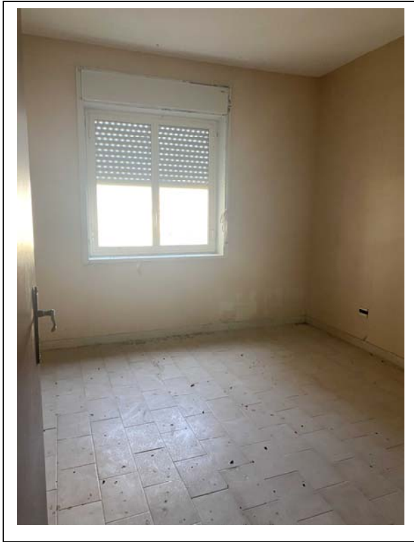
Fotografia n. 5 – Interno - letto#