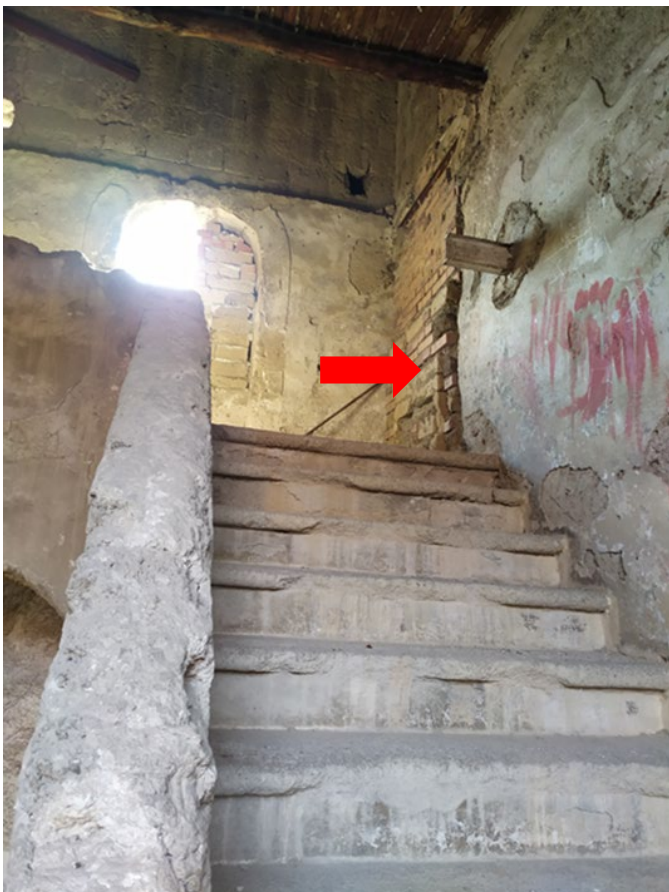
Foto n.13: Pianerottolo del terzo piano → Vano porta murato ex accesso al sottotetto