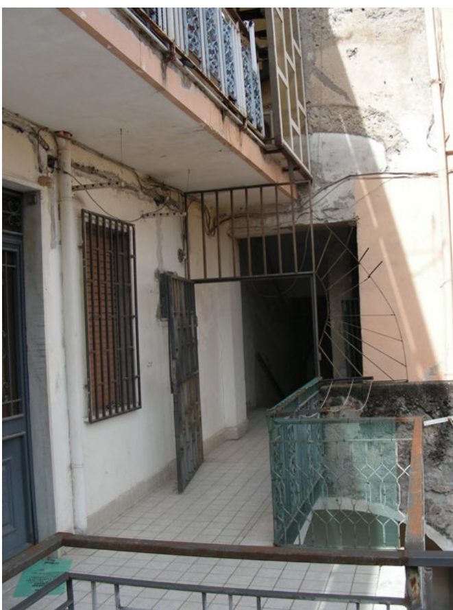
Foto n.16: Uscita dal ballatoio comune di accesso posto al primo piano