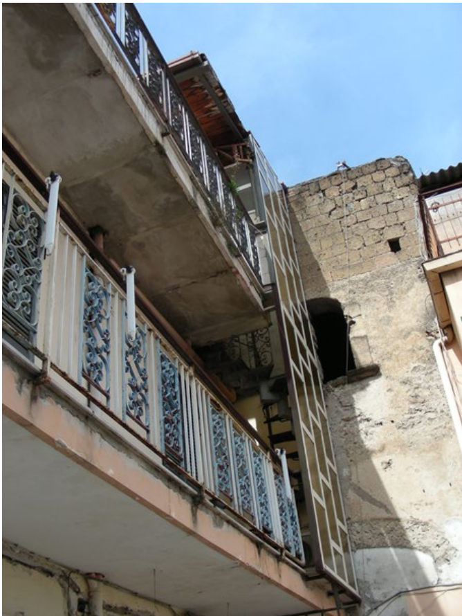
Foto n.35: Balcone dell'appartamento con scala in ferro per accedere al terzo piano