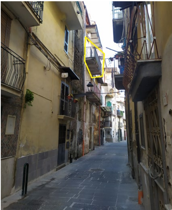
Foto n.34: Balcone della camera da letto con affaccio su via Filomarini