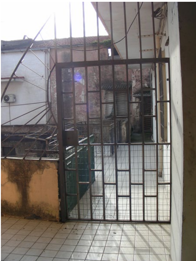
Foto n.15: Ingresso al ballatoio comune di accesso posto al primo piano