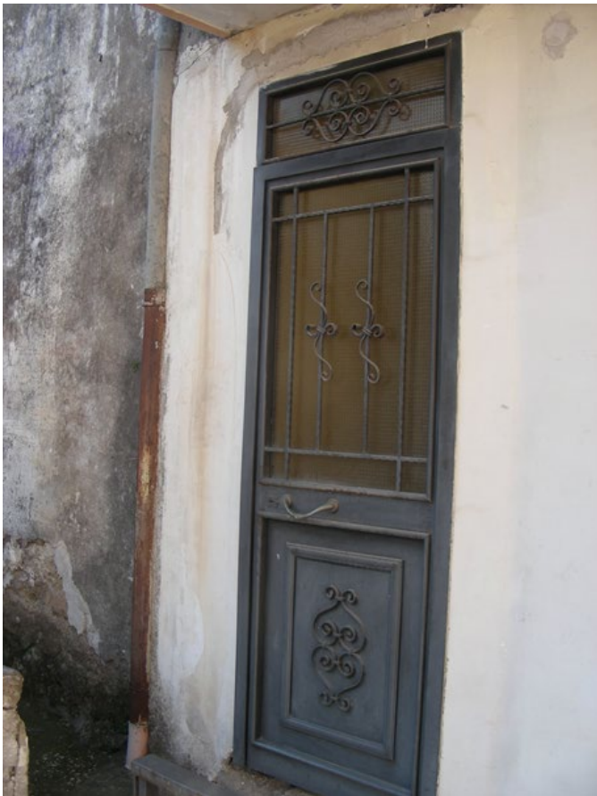
Foto n.17: Portoncino d'ingresso all'appartamento posto al primo piano