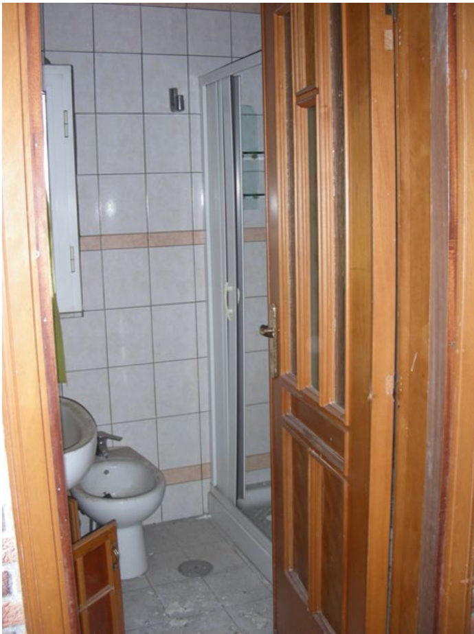
Foto n.47: Porta d'ingresso al bagno a servizio del vano sottotetto