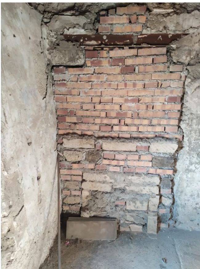
Foto n.14: Vano porta murato ex accesso al sottotetto e al terrazzo di copertura