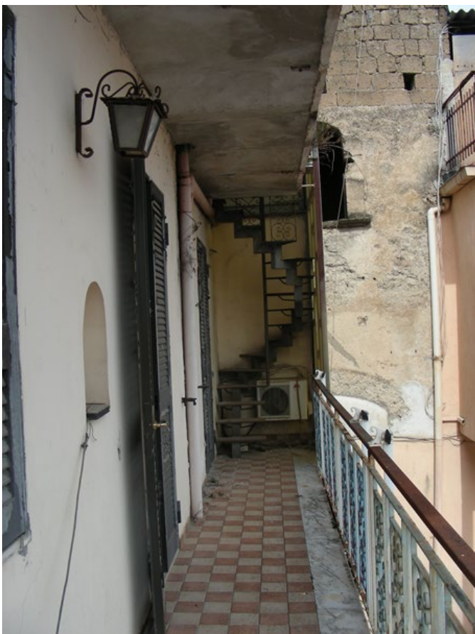
Foto n.36: Balcone dell'appartamento con scala in ferro secondo piano