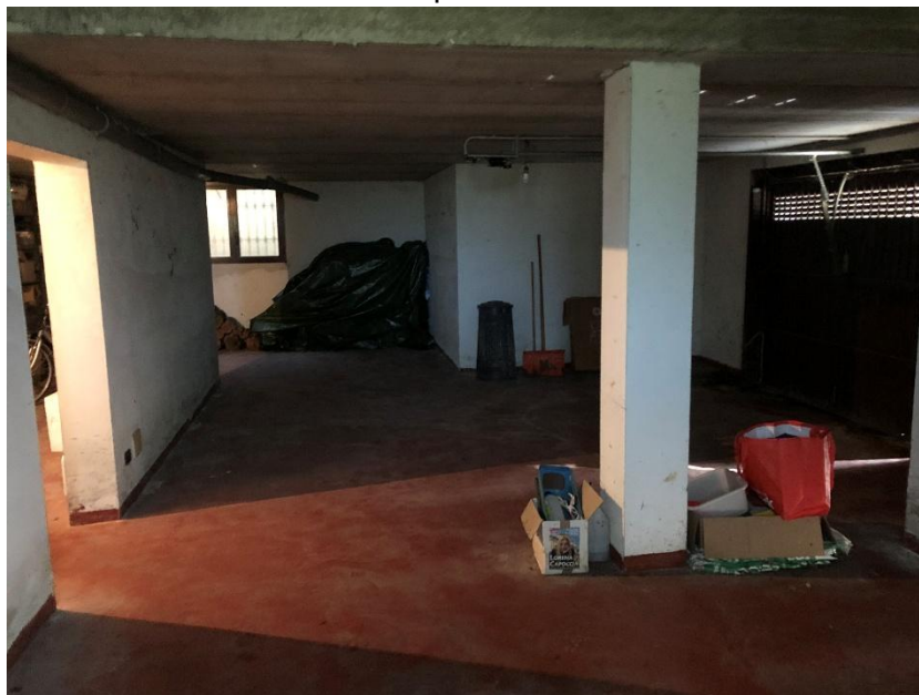
Box autorimessa pertinenziale