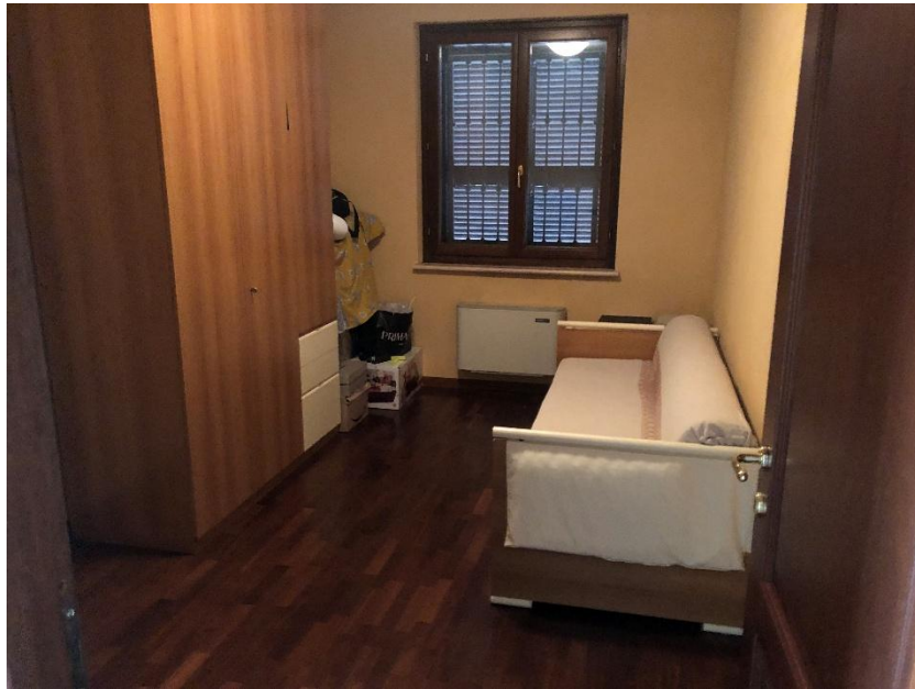
Camera singola (in planimetria cucina)