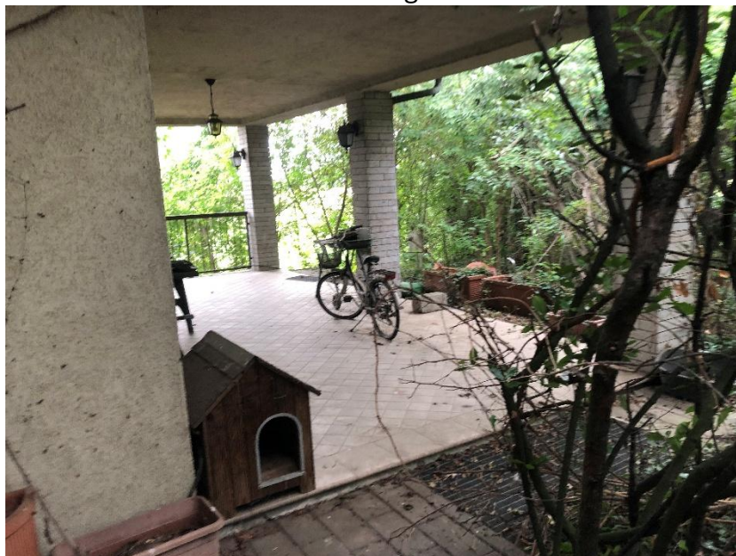
Porticato lato est