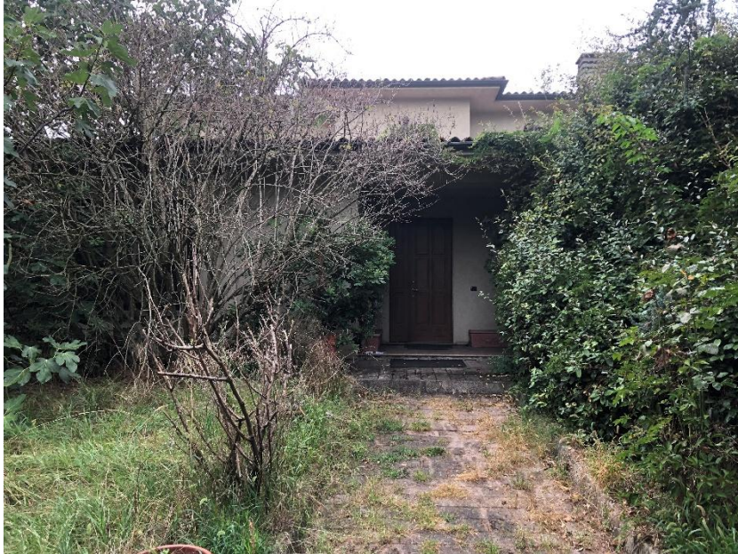
Prospetto lato ingresso