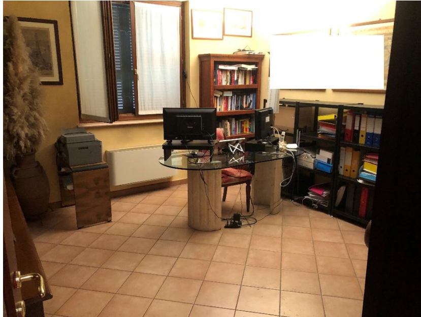
Camera (adibita a studio)