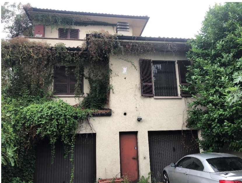
Prospetto lato ovest