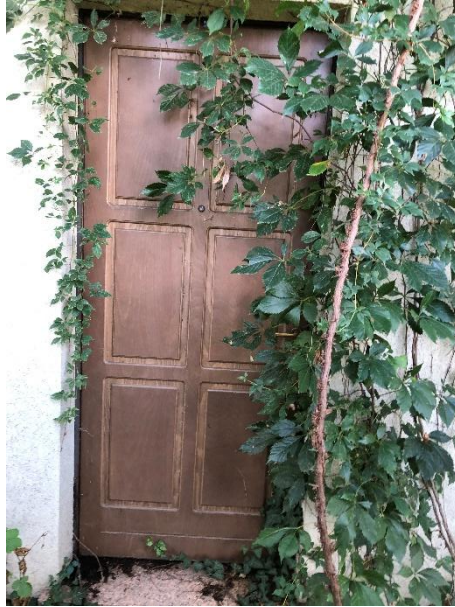
Portoncino esterno di accesso (lato nord)