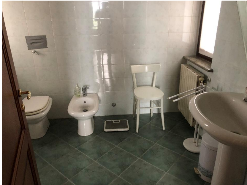
Bagno di servizio