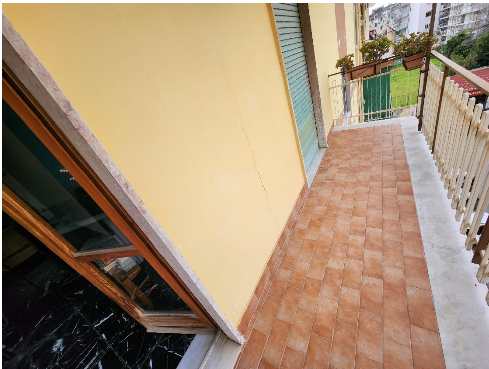
Foto del lato opposto, del Terrazzino 1.