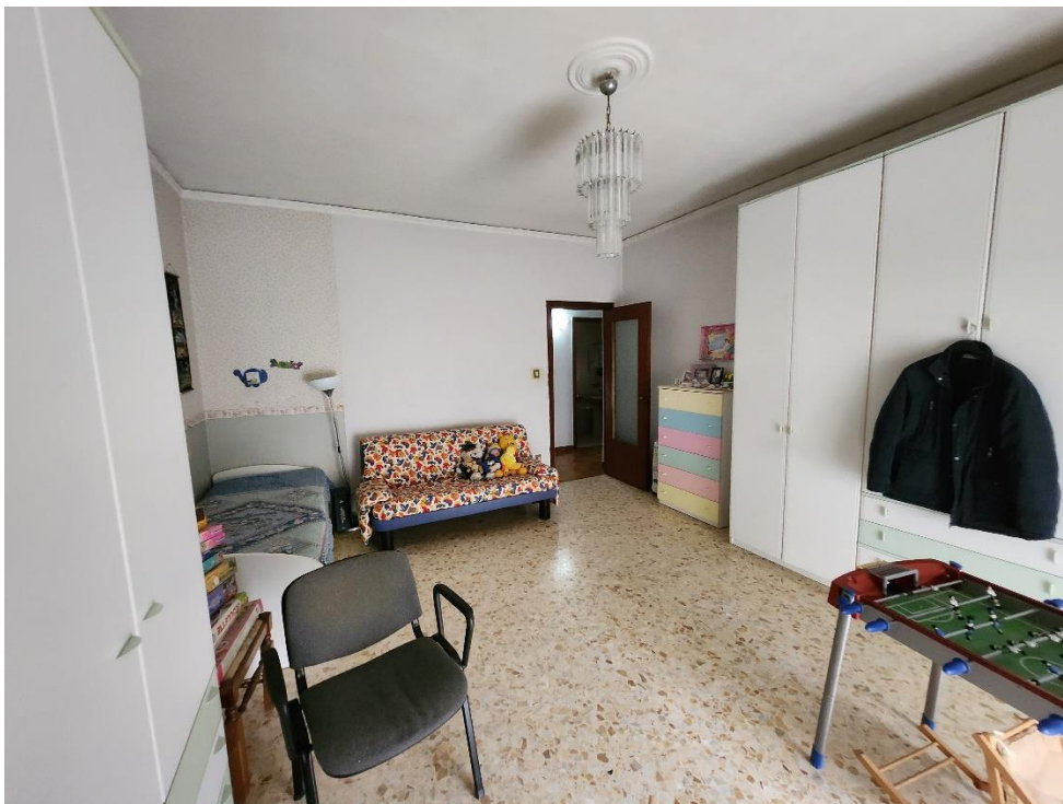
Foto della Camera 1, dal lato opposto rispetto alla foto precedente, guardando verso l'infisso interno che si apre sul corridoio.