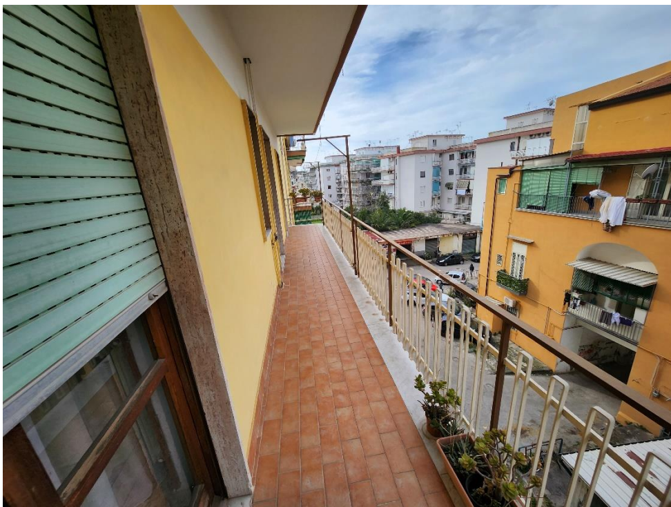
Vista dell'intero Terrazzino 1.