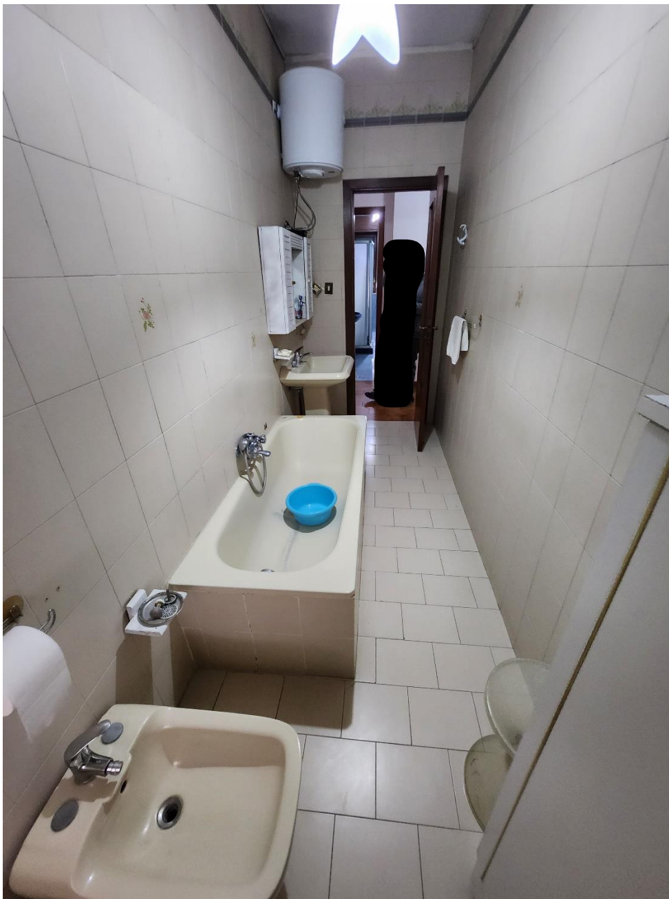
Bagno 2, dotato di vasca e scaldabagno.