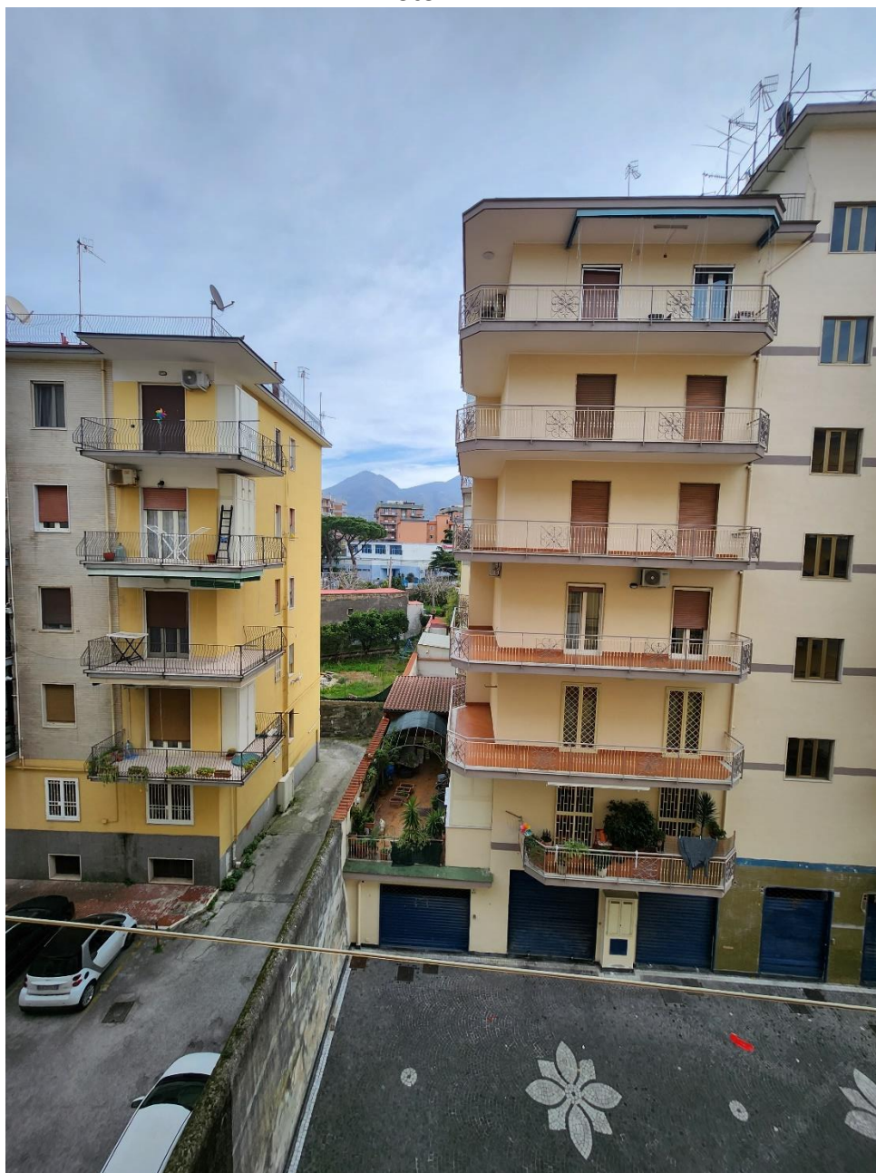
Vista dal lato nord dell'appartamento.