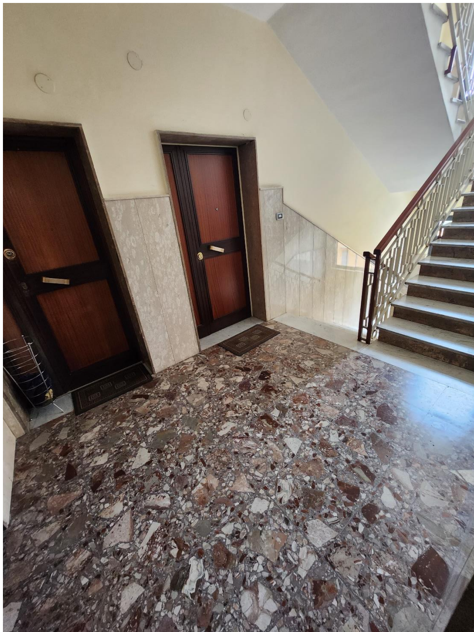
Pianerottolo del terzo piano sul quale vi è il cespite in esame.