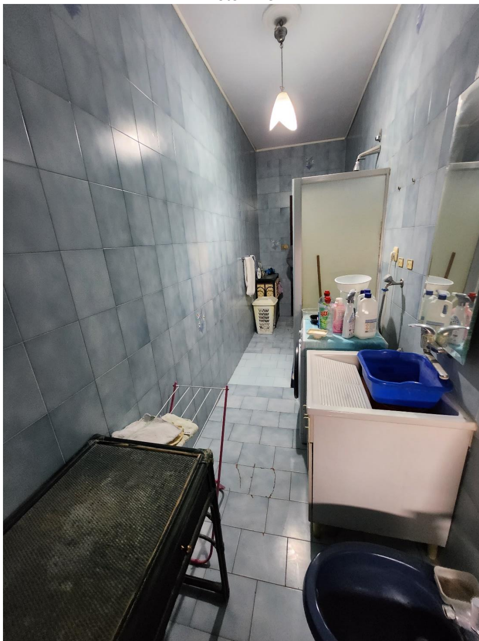
Bagno 1, dotato di doccia e lavatrice.