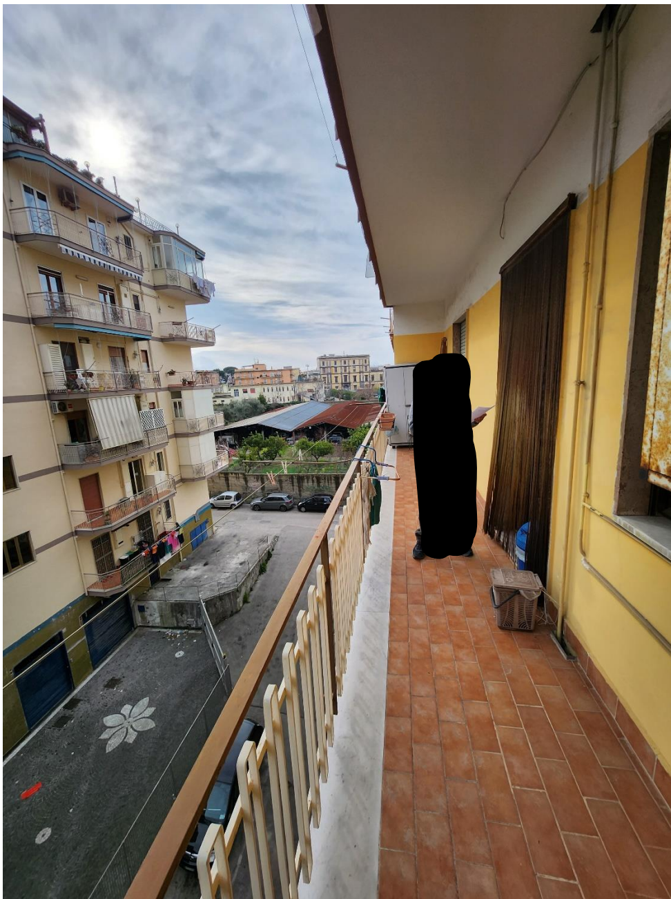
Vista dal lato opposto del Terrazzino 2, con pavimenti realizzati con mattonelle 10x20 cm in cotto.