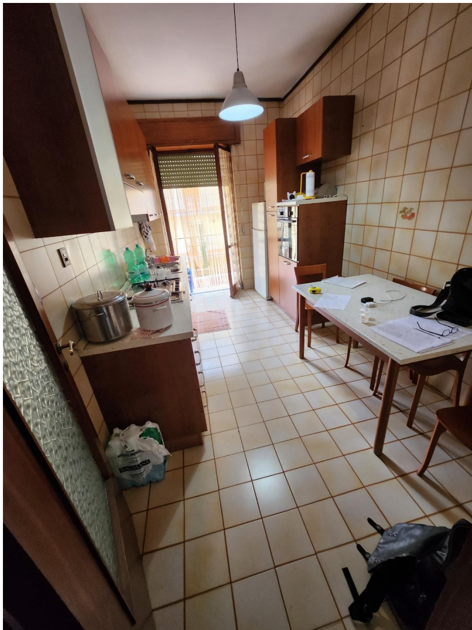
Ambiente della Cucina, illuminato da una porta-finestra che affaccia sul Terrazzino 2.