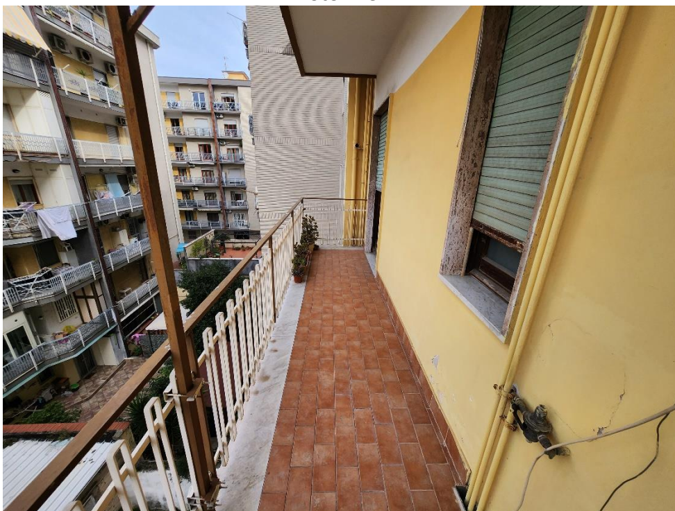
Foto del Terrazzino 1.