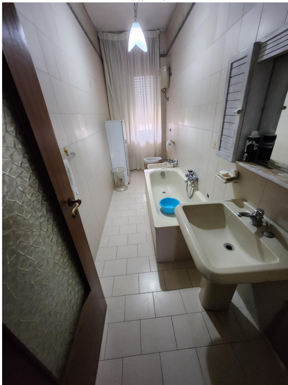
Bagno 2, illuminato da una finestra.