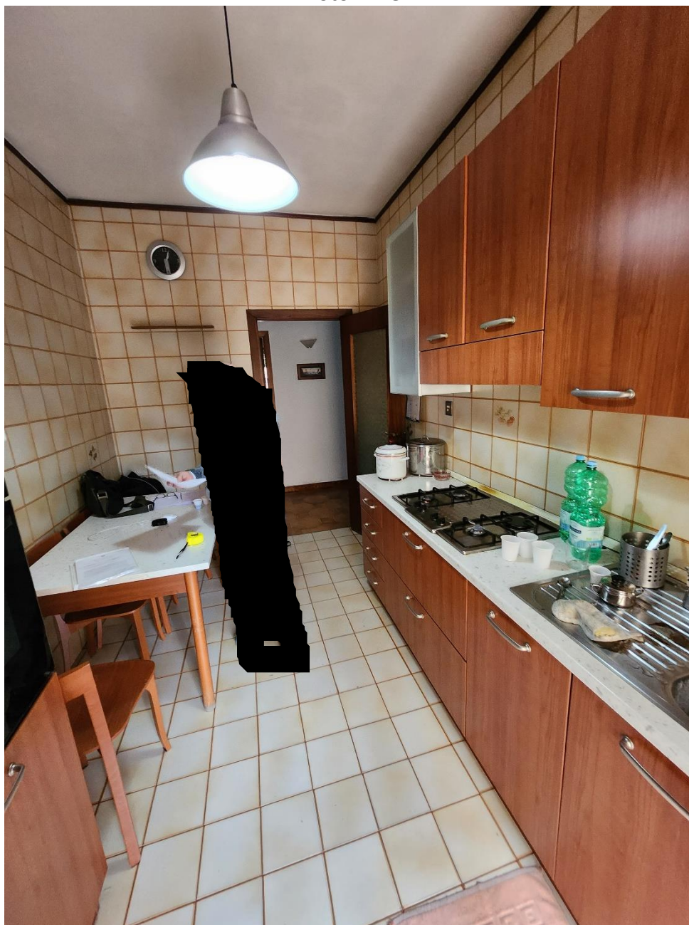
Cucina in legno, con impianto a norma e con rivestimenti in grès a tutta altezza.