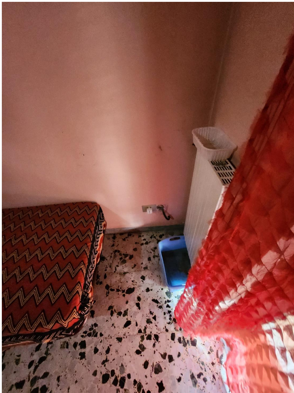
Foto in cui si evidenzia un problema al termosifone.