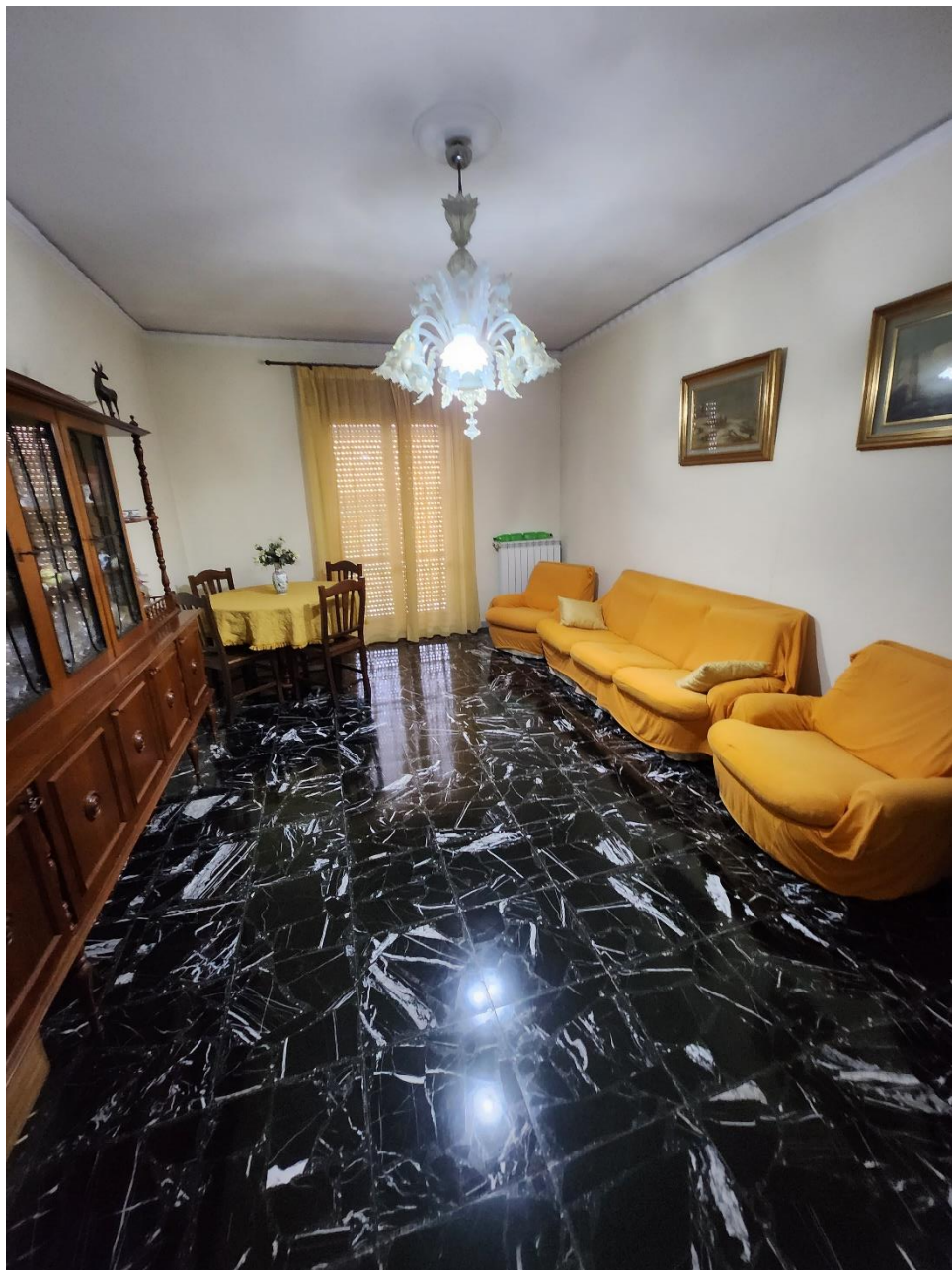
Foto dell'ambiente del Soggiorno, illuminato da una porta-finestra.