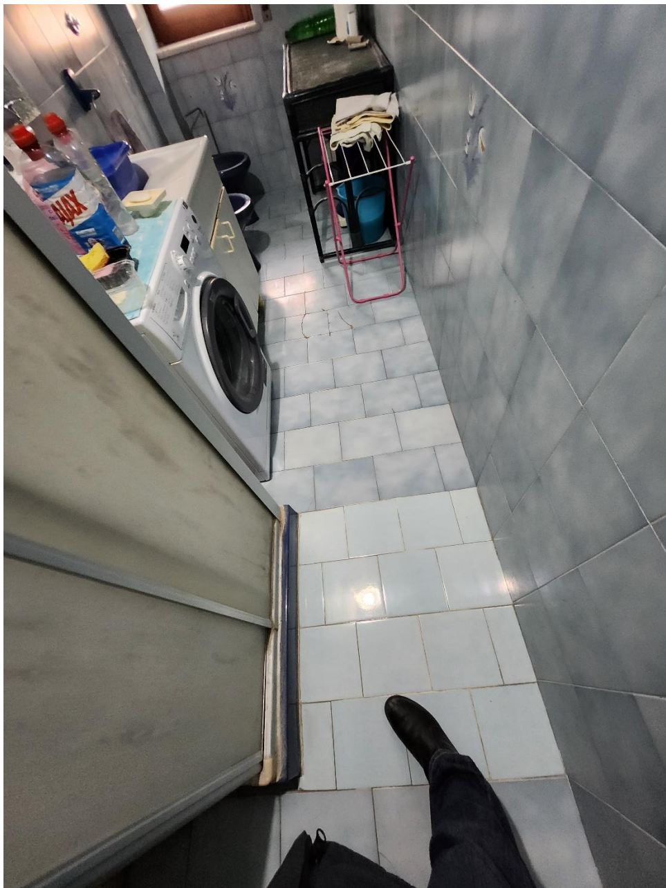
Foto del pavimento del Bagno 1, in cui emerge una porzione differente di mattonelle.