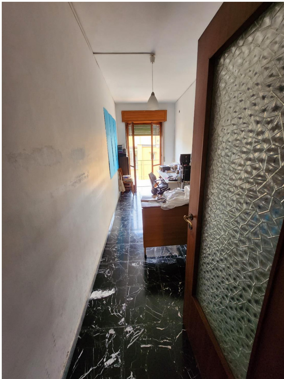
Spazio ricavato per un Ufficio, con una porta-finestra che si apre sul Terrazzino 1.