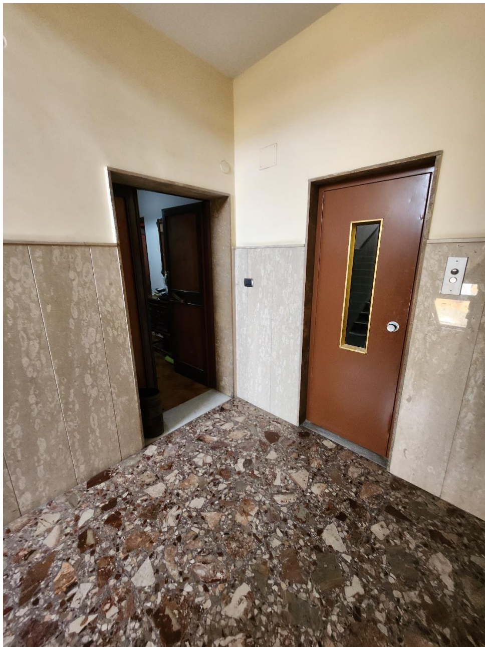
Porta d'ingresso dell'immobile al numero interno 15, e porta dell'ascensore.