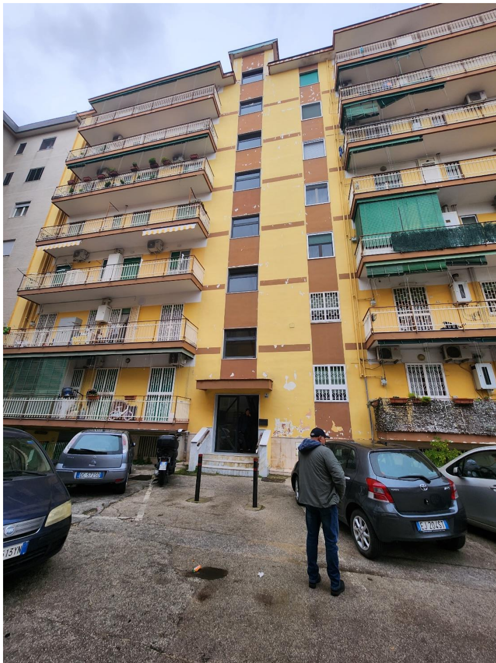
Facciata sud del fabbricato.