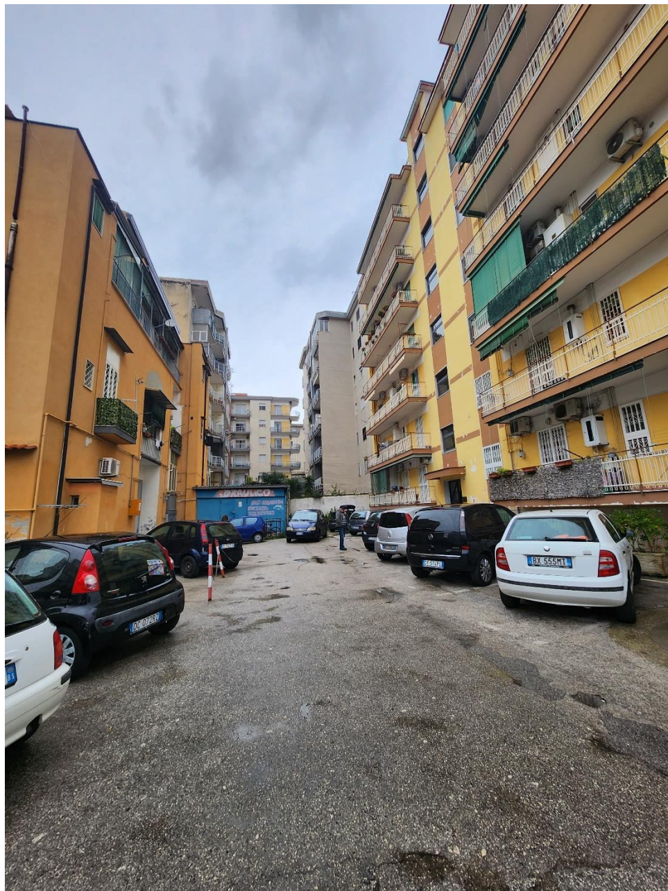
Viale di accesso al fabbricato, in cui vi è il cespite in esame (a destra).