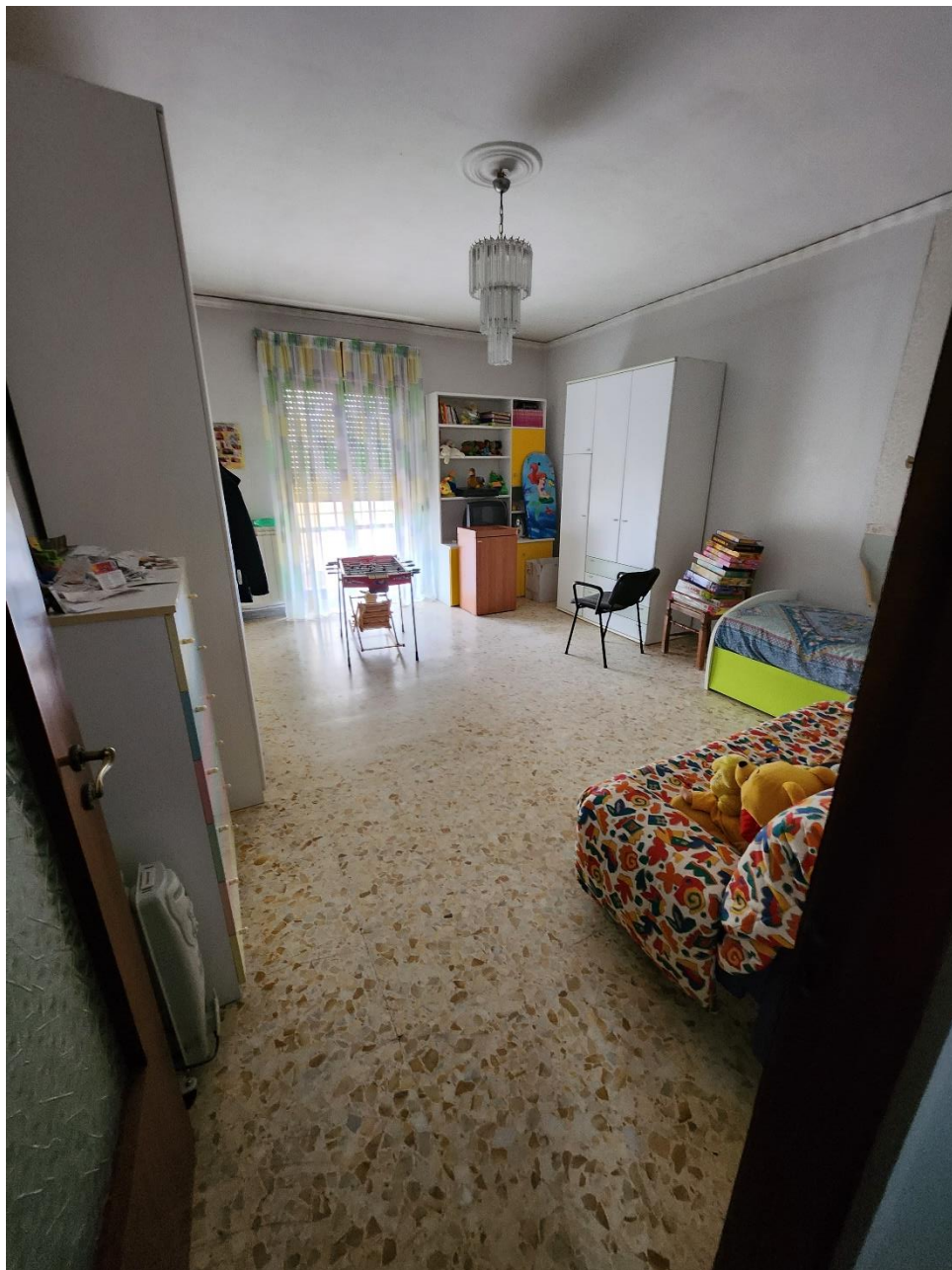
Camera 1, illuminata da una porta-finestra.