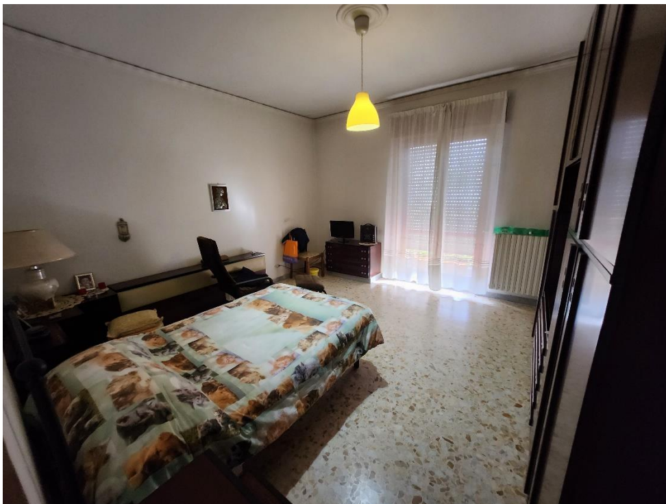
Camera matrimoniale, indicata nei grafici come "Camera 2".