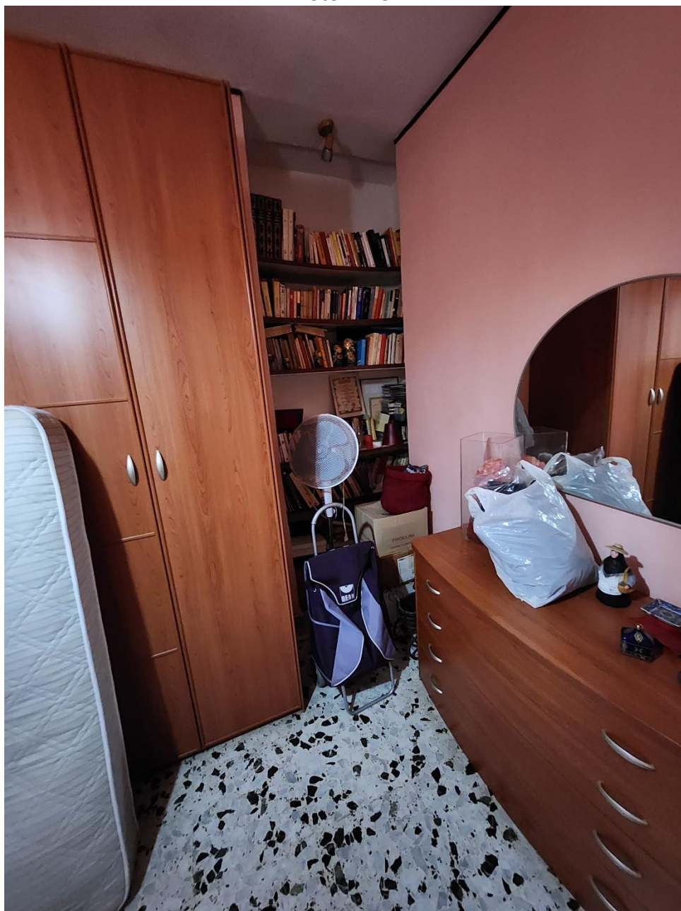
Spazio ricavato per una libreria nella Camera 3.