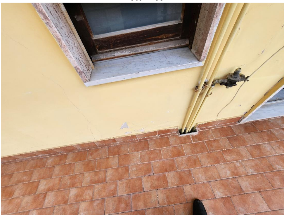
Imperfezioni della parte esterna, posta sul Terrazzino 1.