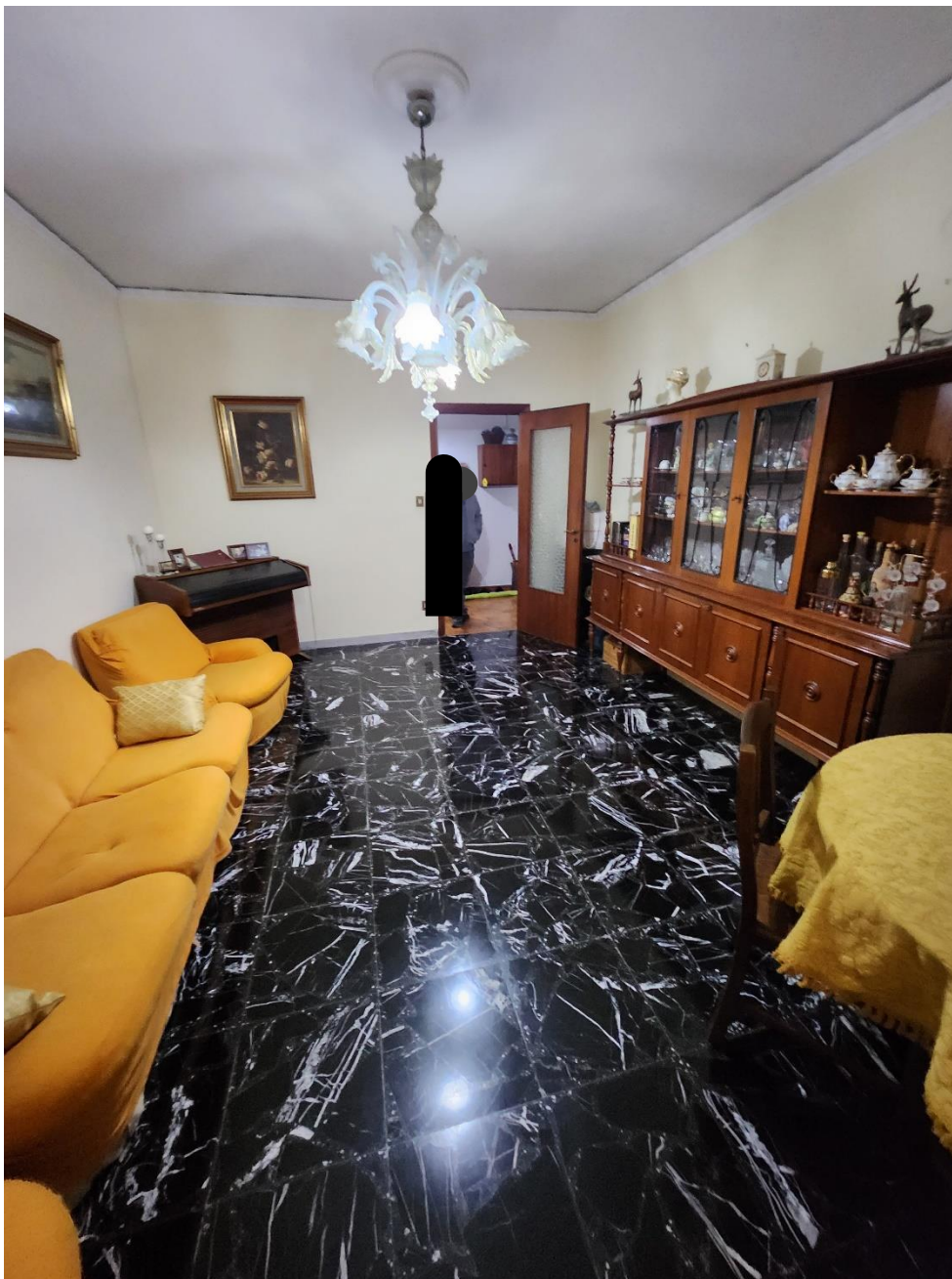
Vista del Soggiorno verso l'infisso interno, in legno e vetro.