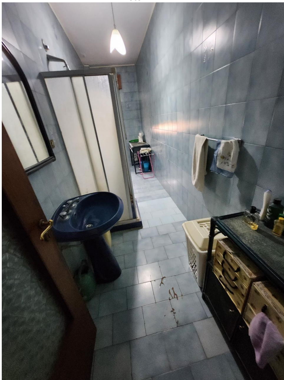
Bagno 1, con rivestimenti in gres porcellanato di colore azzurro. Si evidenziano delle mattonelle lesionate.