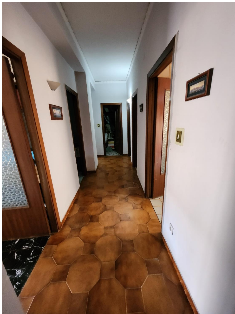
Ambiente del Corridoio, sul quale si aprono 7 porte.