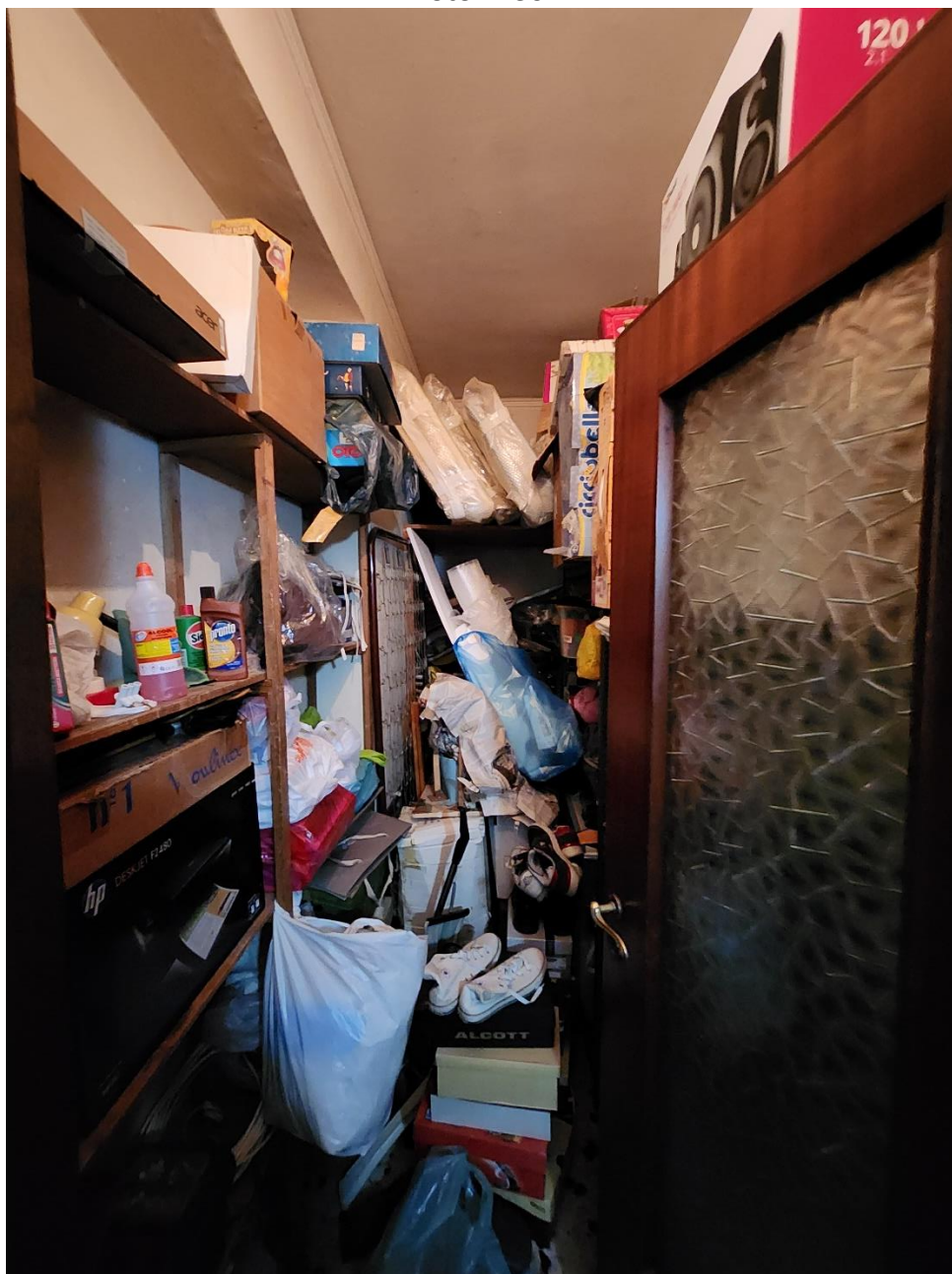
Ripostiglio, posto al termine del corridoio.