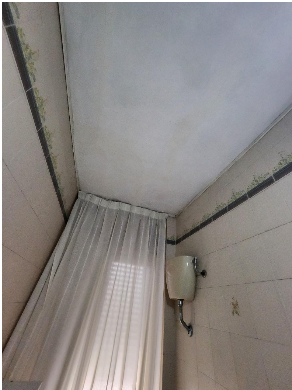
Foto del soffitto del Bagno 2, in cui emergono delle lievi macchie.