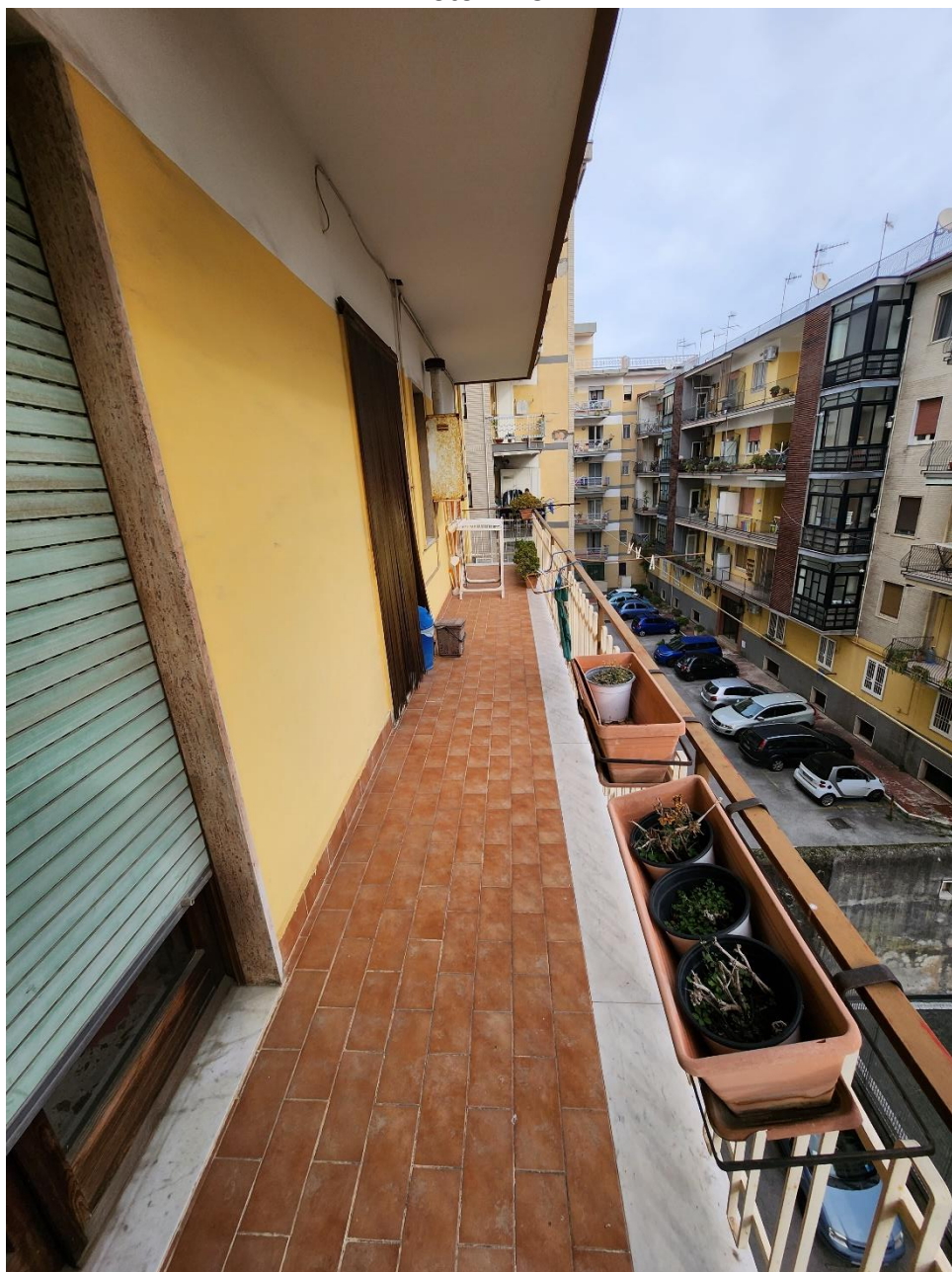
Terrazzino 2, posto al lato nord del fabbricato.