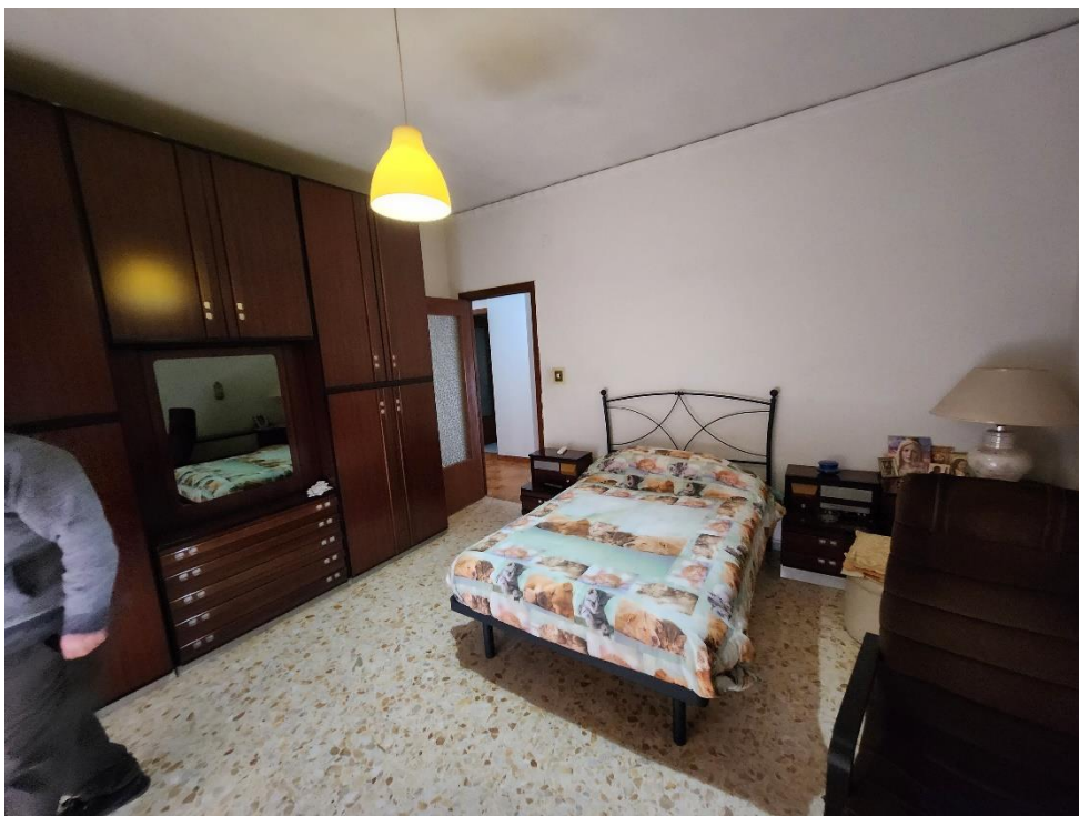
Vista del lato opposto della Camera 2.