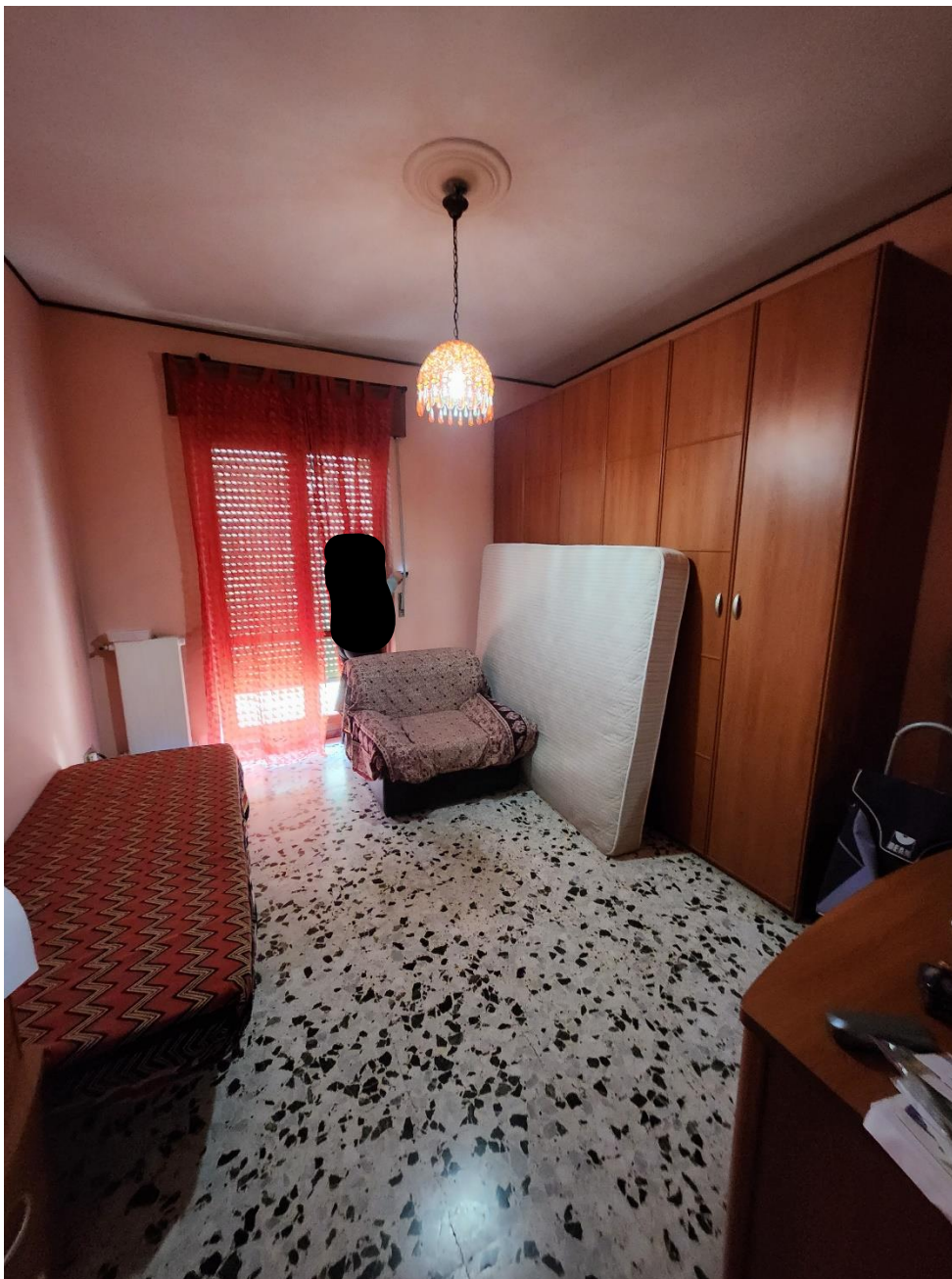
Camera 3, posta a destra dell'ingresso, illuminata da una porta-finestra.