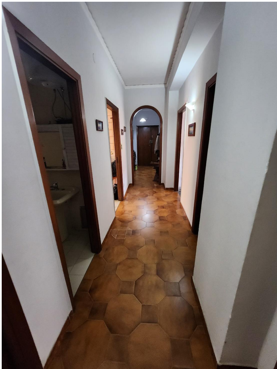
Foto del Corridoio, guardando dal fondo verso la porta d'ingresso.