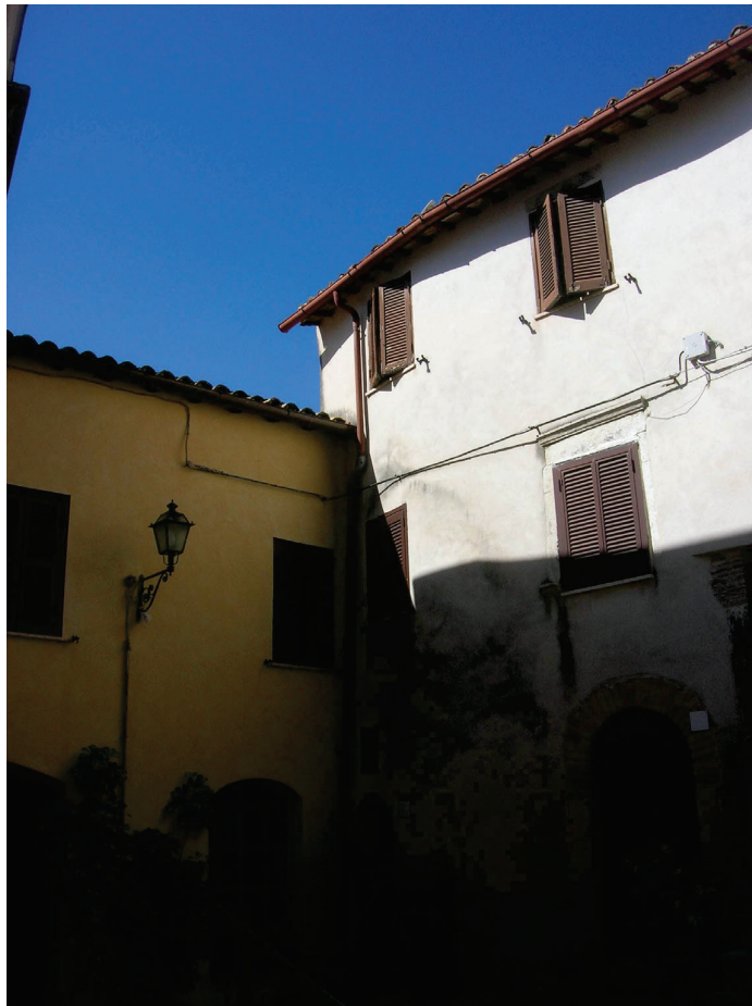
Vedute esterne del fabbricato e delle aree di accesso F. 12 Part. 270 sub 4