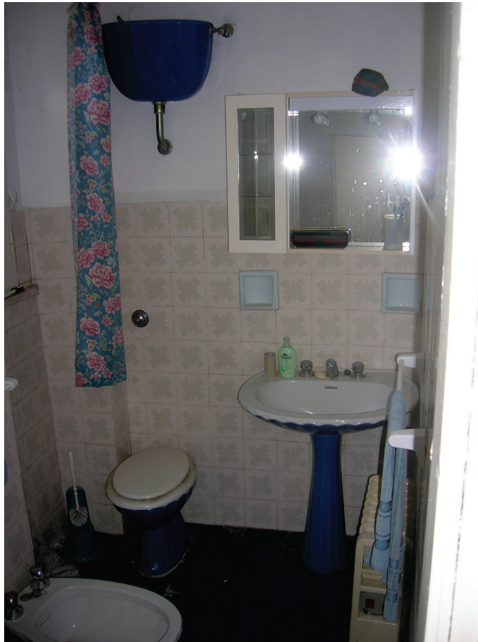
Vedute interne – bagno