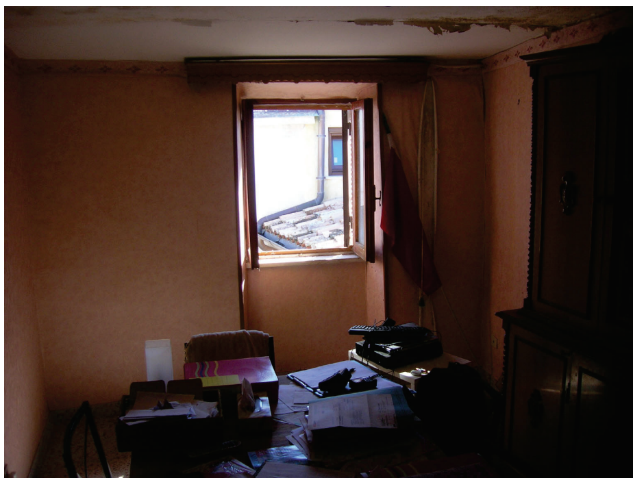
Vedute interne - soggiorno