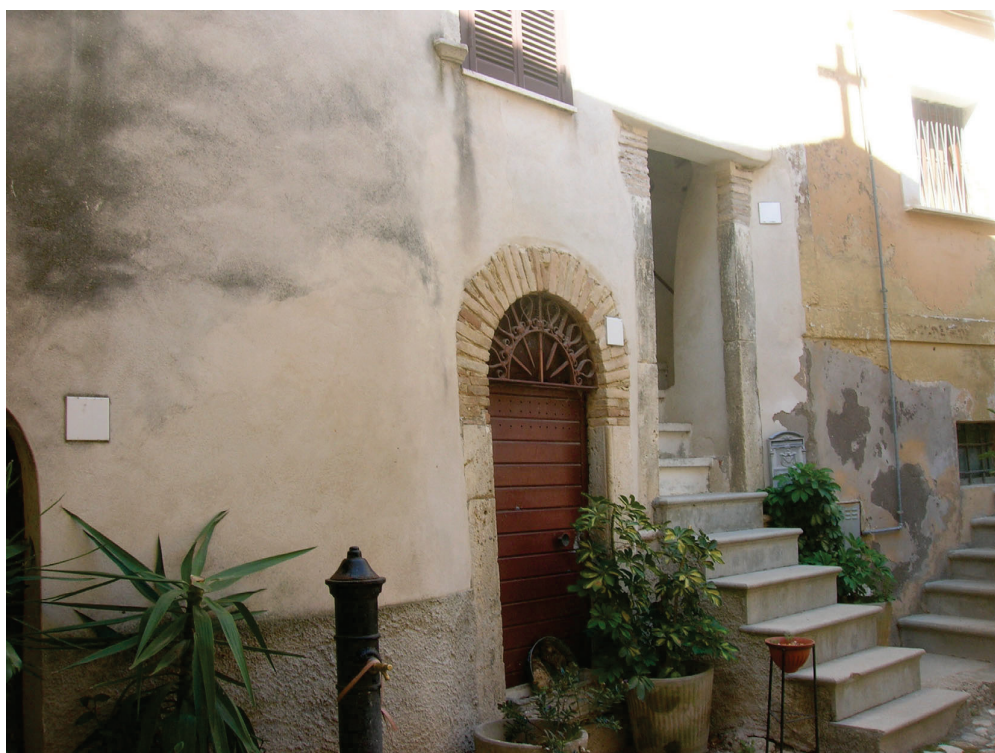
Vedute esterne del fabbricato e delle aree di accesso