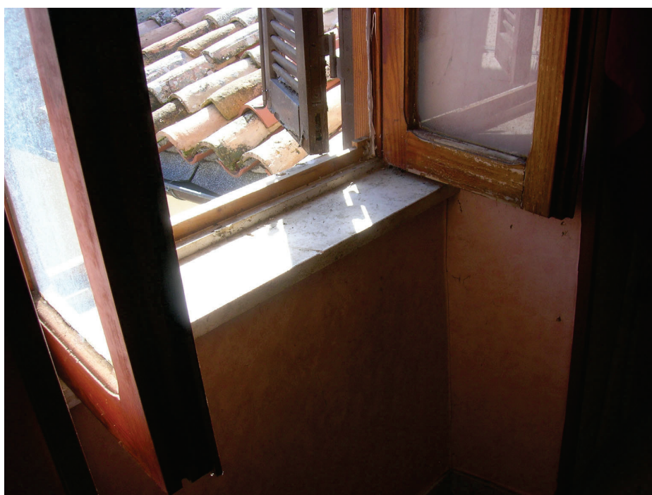
Vedute interne – dettagli finiture