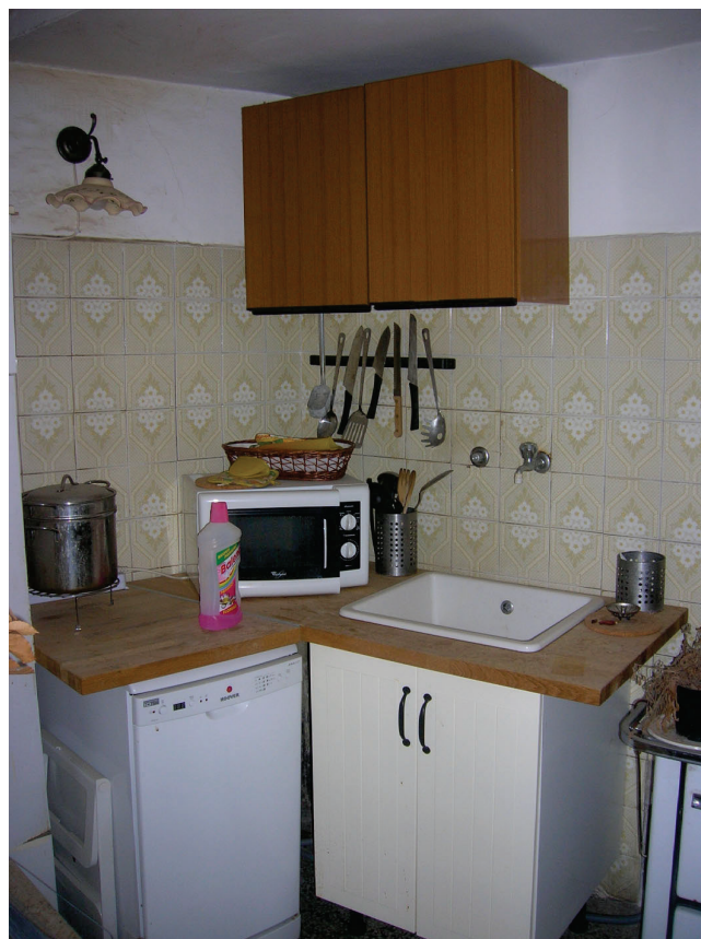
Vedute interne - cucina