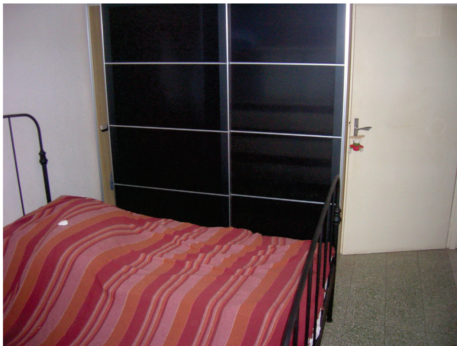
Vedute interne – camera da letto