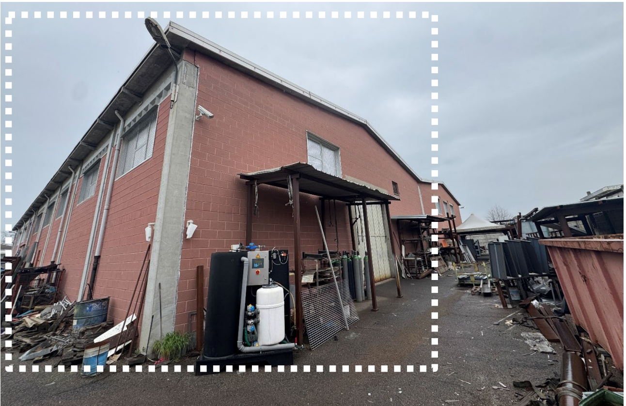
4. Vista della porzione di fabbricato in esecuzione.