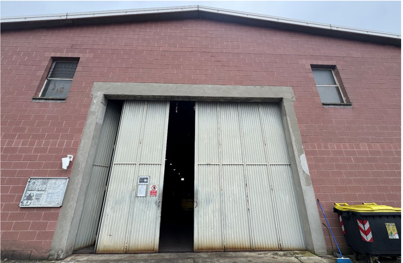
5. Vista del fabbricato dalla corte comune.