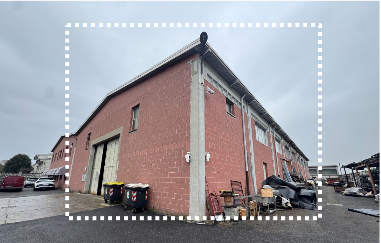
3. Vista della porzione di fabbricato in esecuzione.