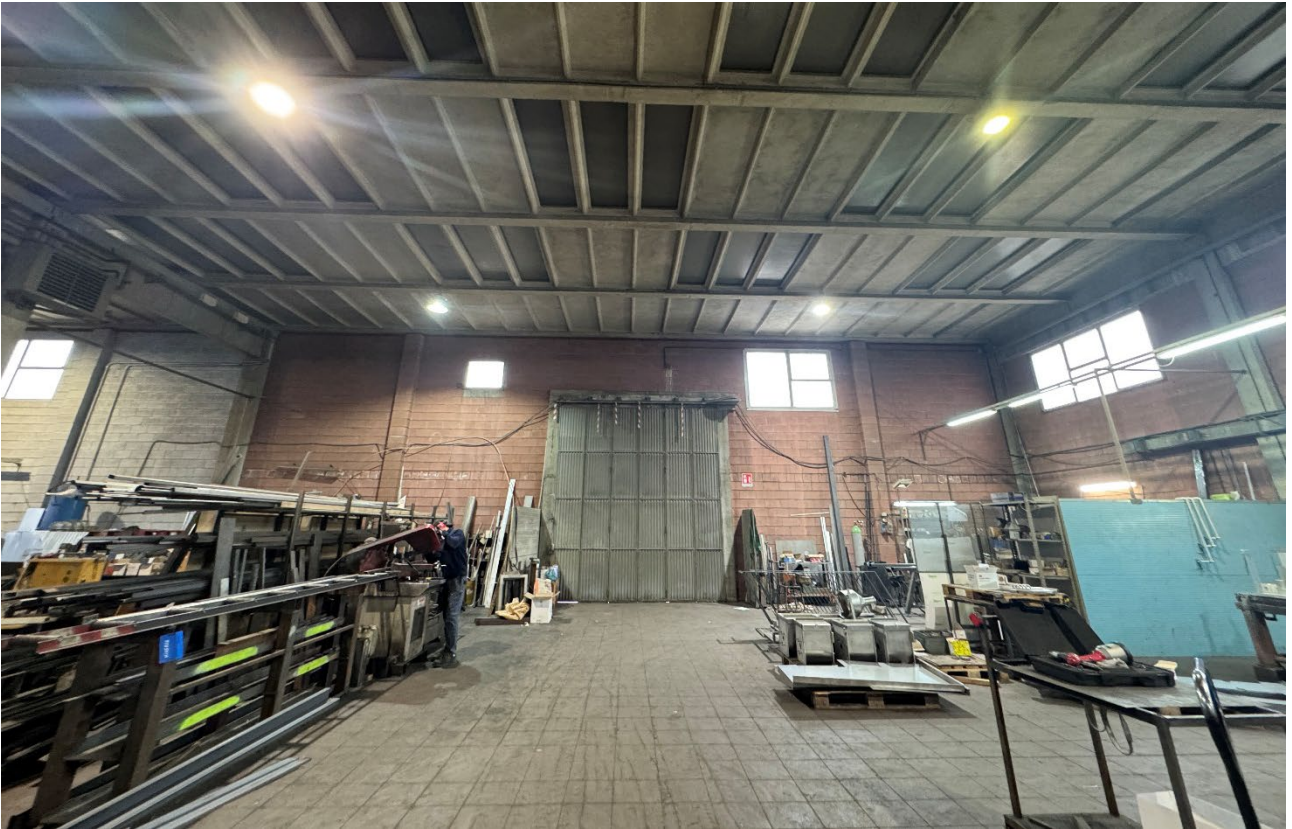
13. Vista dell'interno del fabbricato (sub. 2).