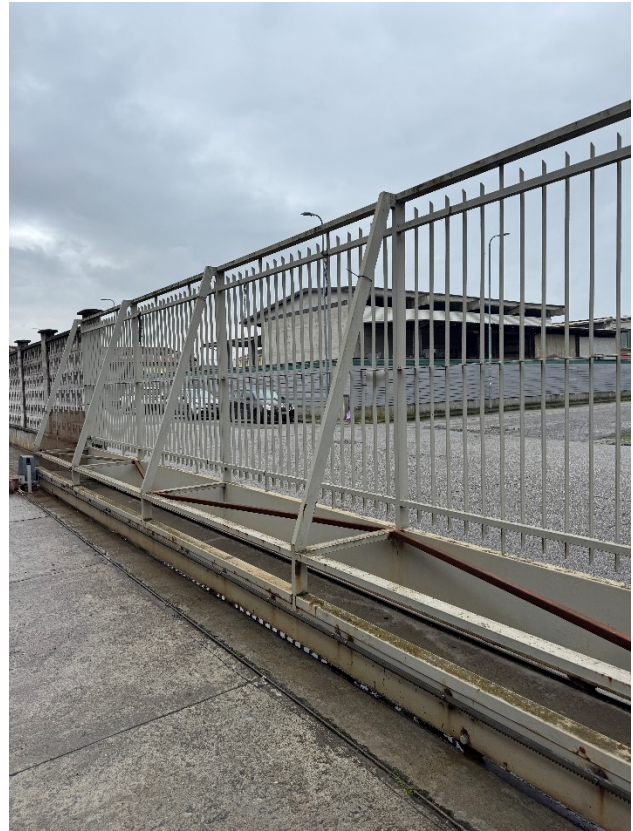
16. Vista del cancello scorrevole carraio.