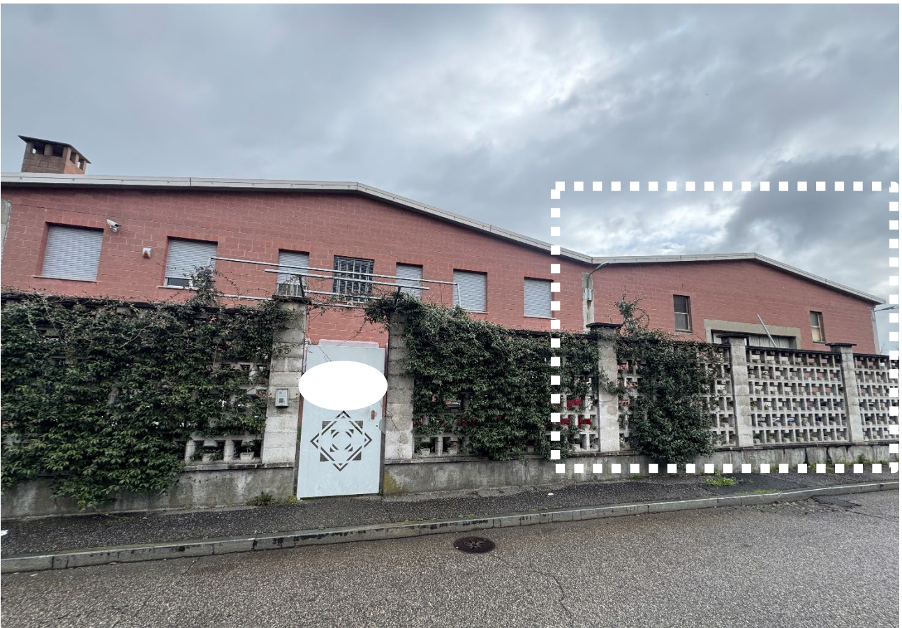
17. Vista del compendio dalla via Cavalieri del Lavoro.