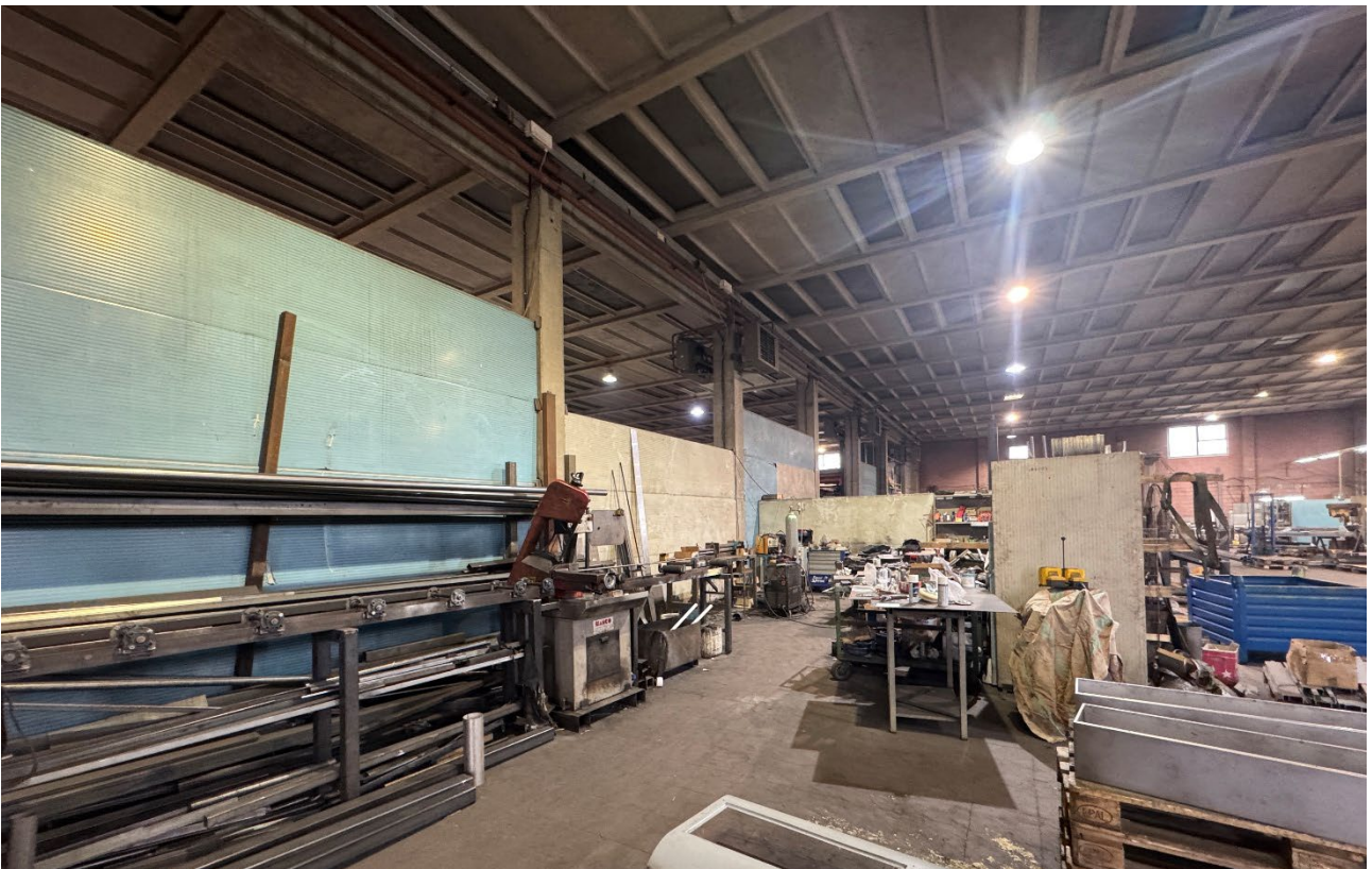
10. Vista dell'interno del fabbricato (sub. 2).