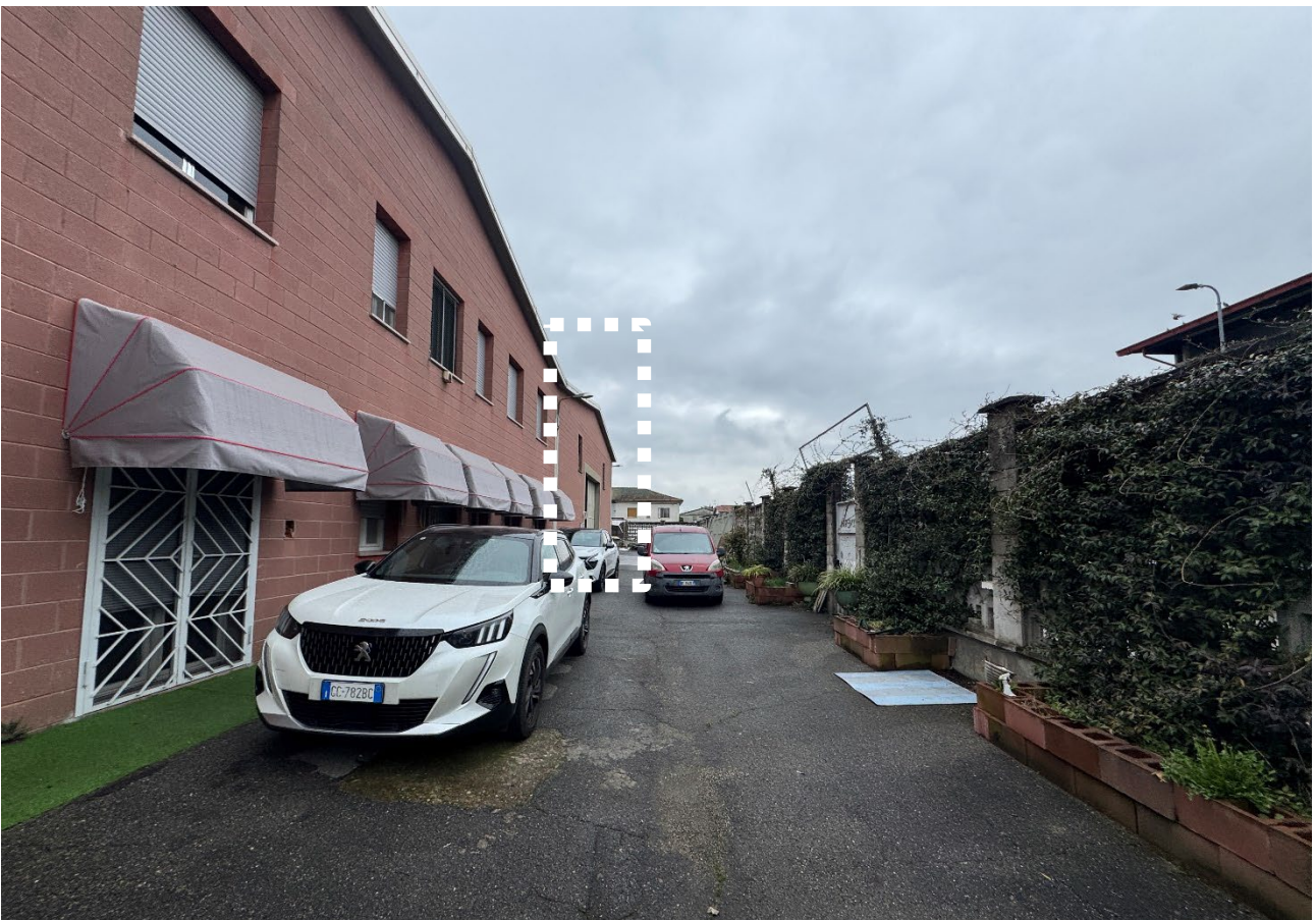
14. Vista della corte comune (sub. 3).