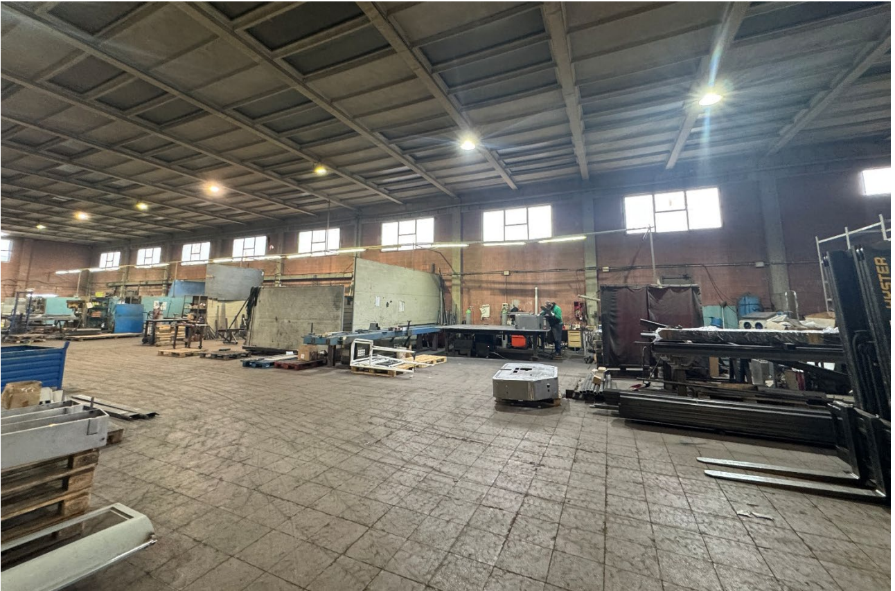
7. Vista dell'interno del fabbricato (sub. 2).