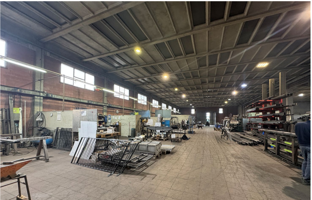
12. Vista dell'interno del fabbricato (sub. 2).