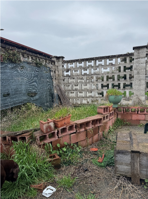
15. Vista della recinzione.