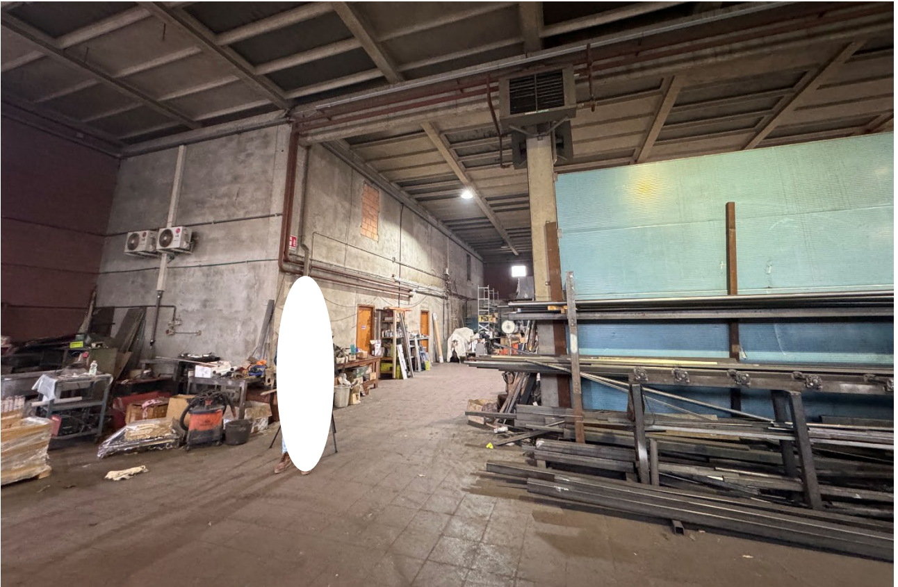
9. Vista dell'interno del fabbricato (sub. 2).