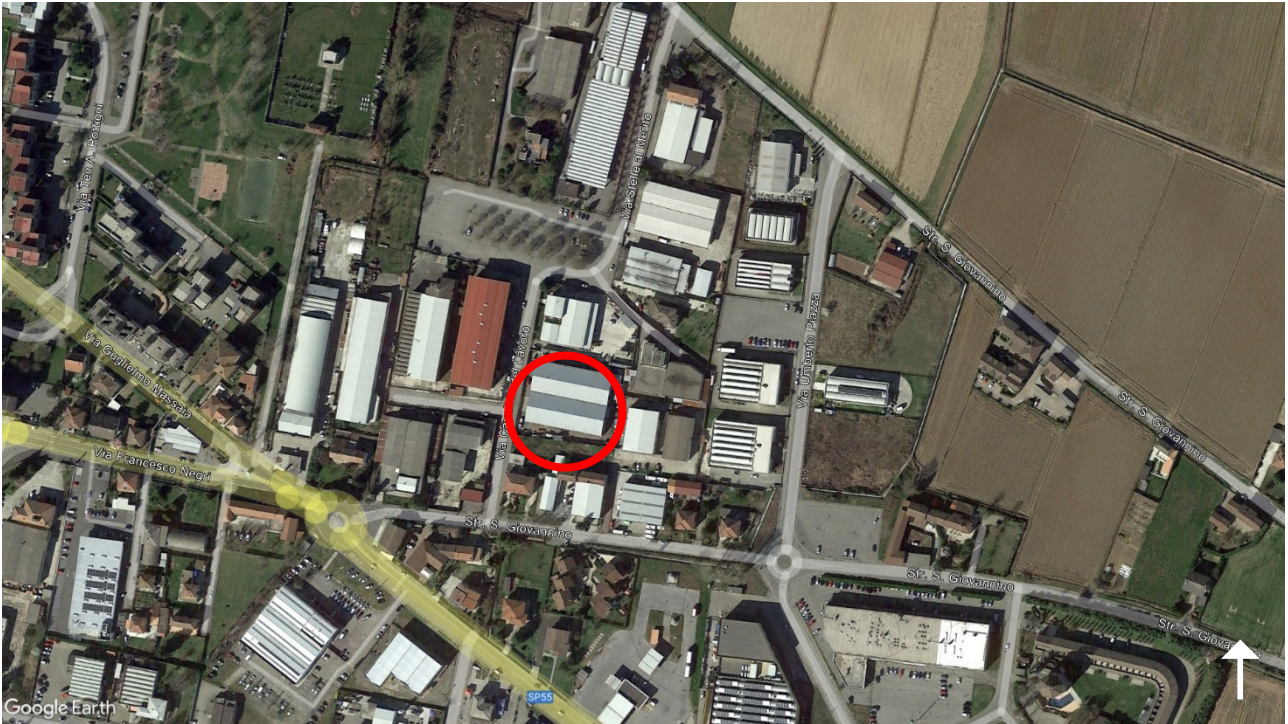
1. Vista satellitare del capannone produttivo oggetto di esecuzione, nel comune di Casale Monferrato.