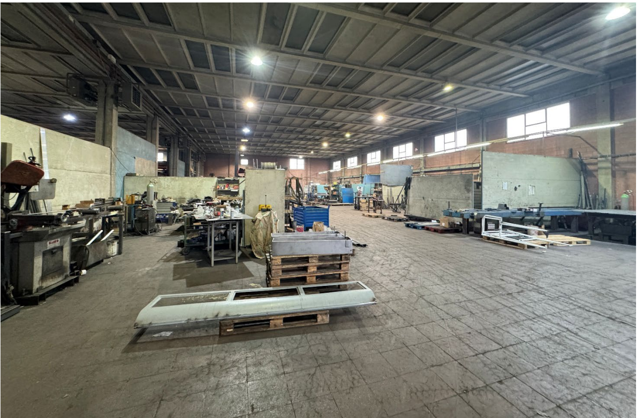
6. Vista dell'interno del fabbricato (sub. 2).