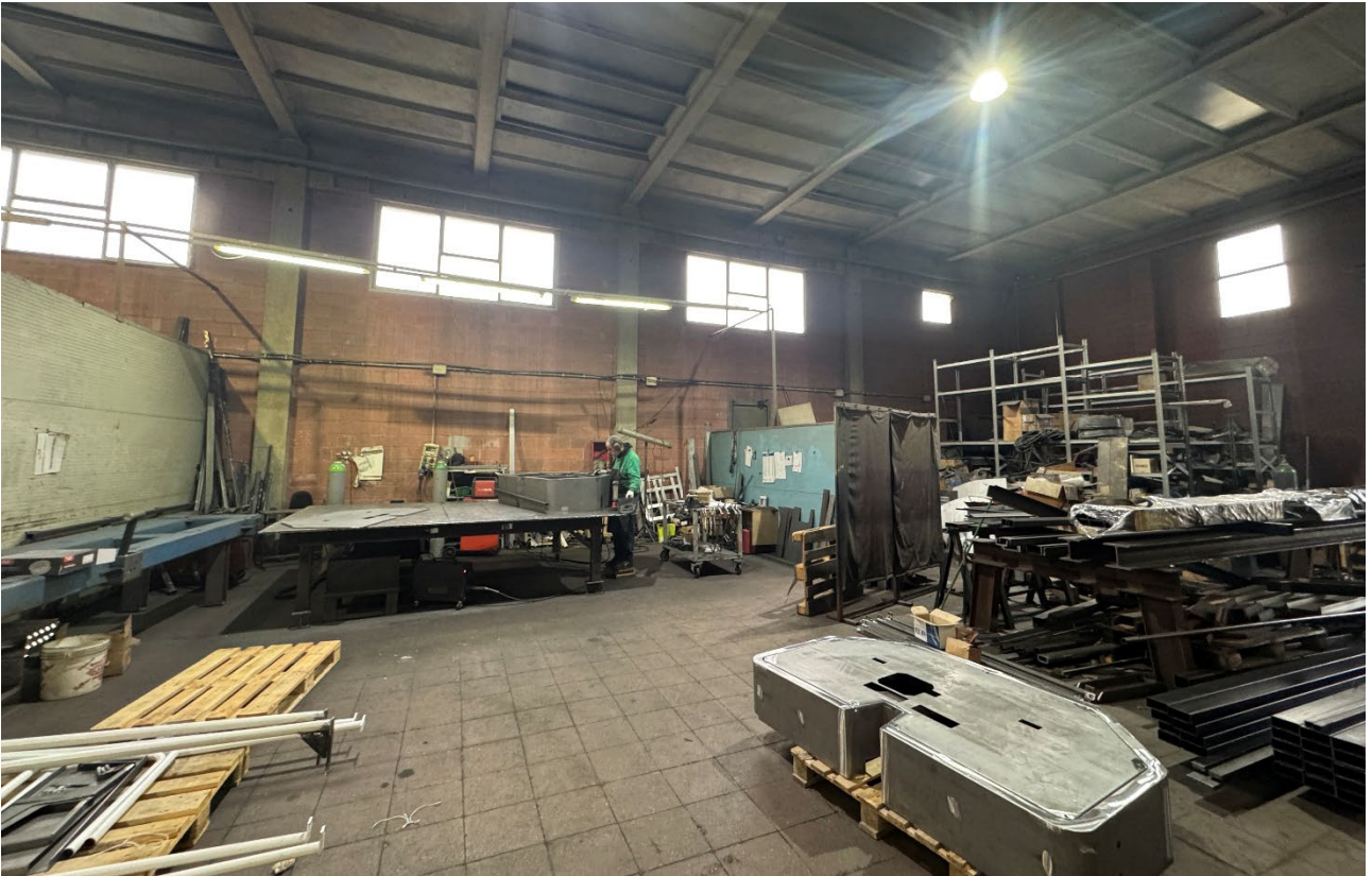
11. Vista dell'interno del fabbricato (sub. 2).