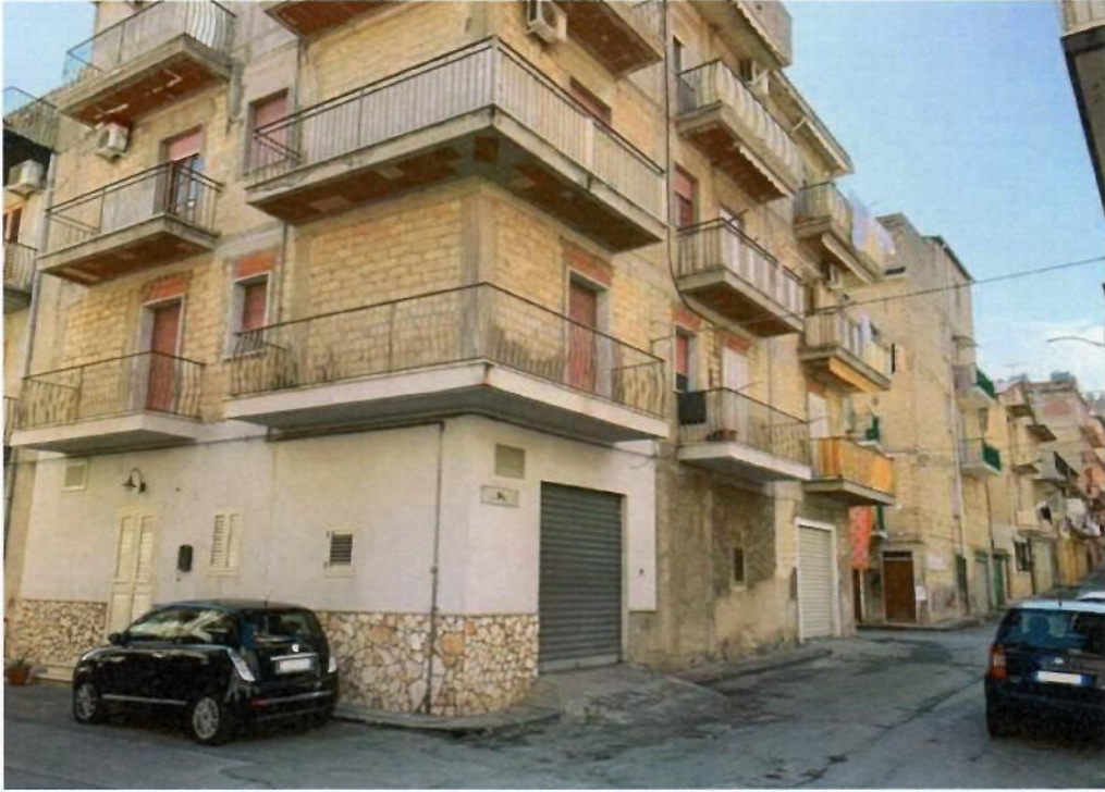
Foto 2 – Ripresa dall'incrocio tra la via Monza e la via Po (L'immobile è posto al primo piano)