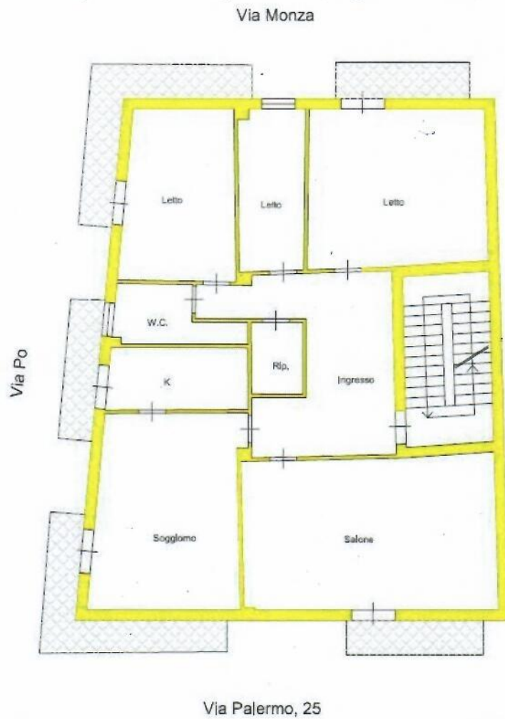
Fig. 3 – Pianta dell'appartamento (disegno non in scala)