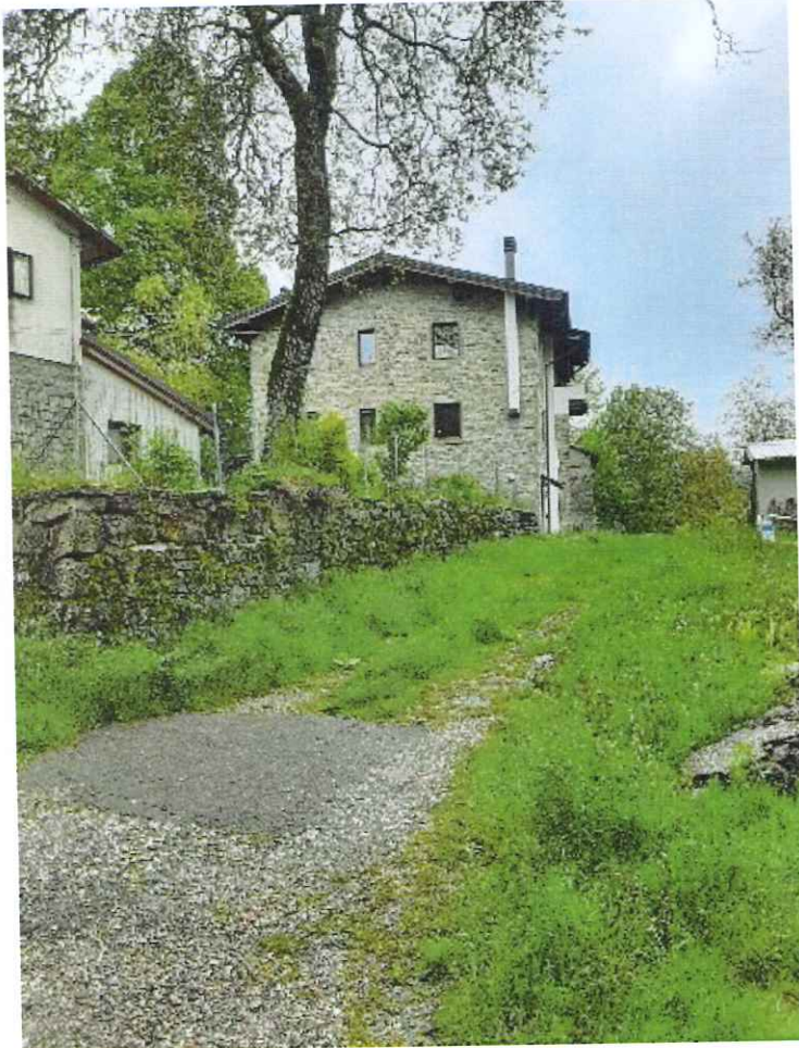
Vista dell'immobile da via Osteria (proseguimento di Via Selva romanesca)