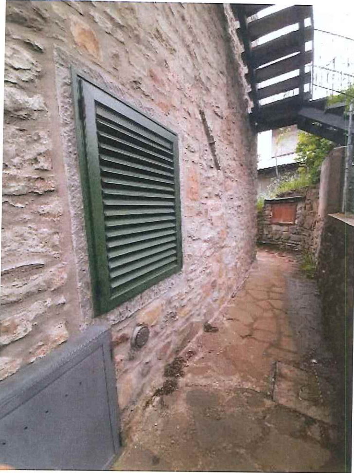
Vista dell'area cortiliva di proprietà esclusiva posta a monte.