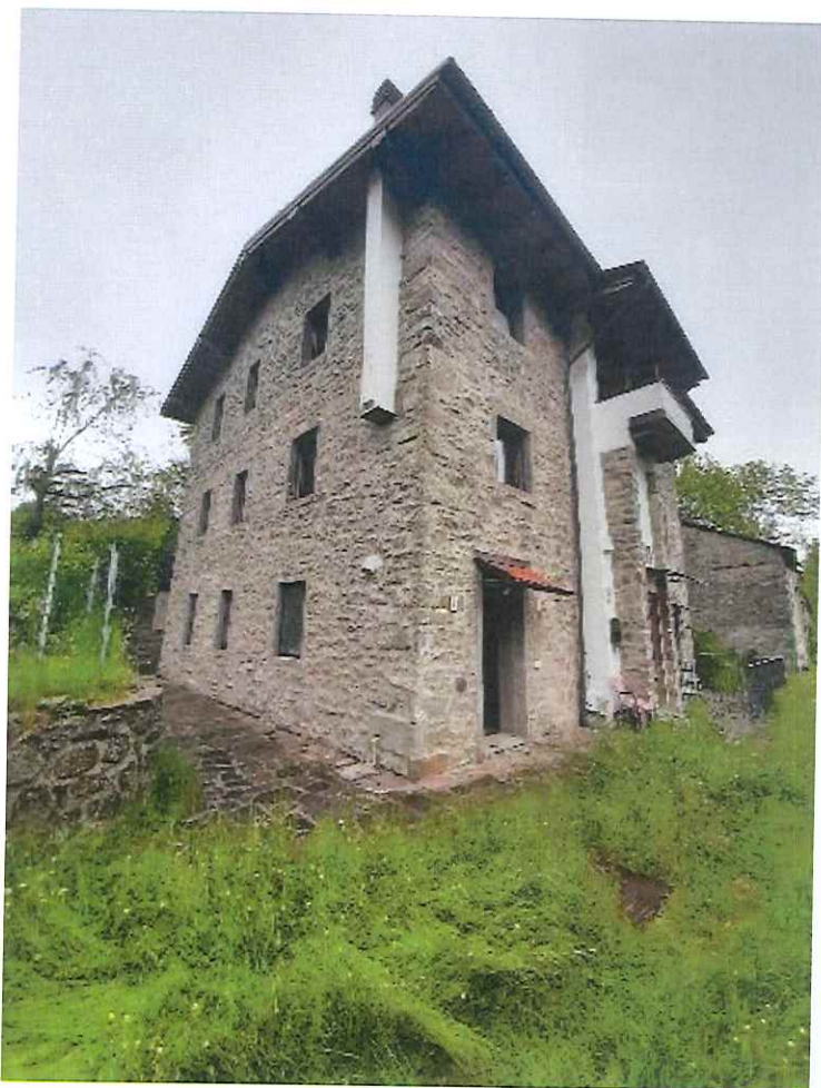
Vista della porzione sud dell'immobile.