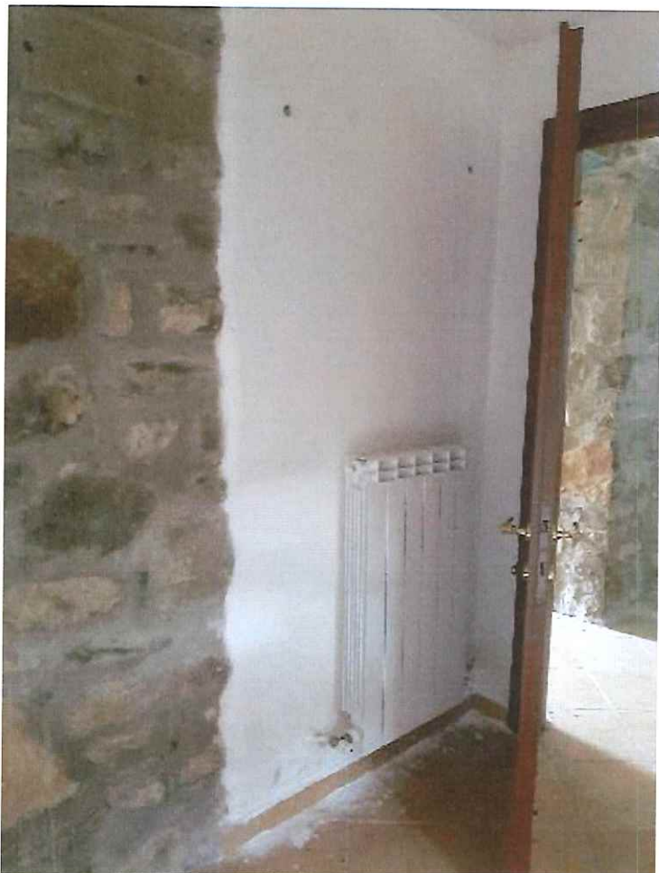
Dettaglio di umidità di risalita nella porzione intonacata.