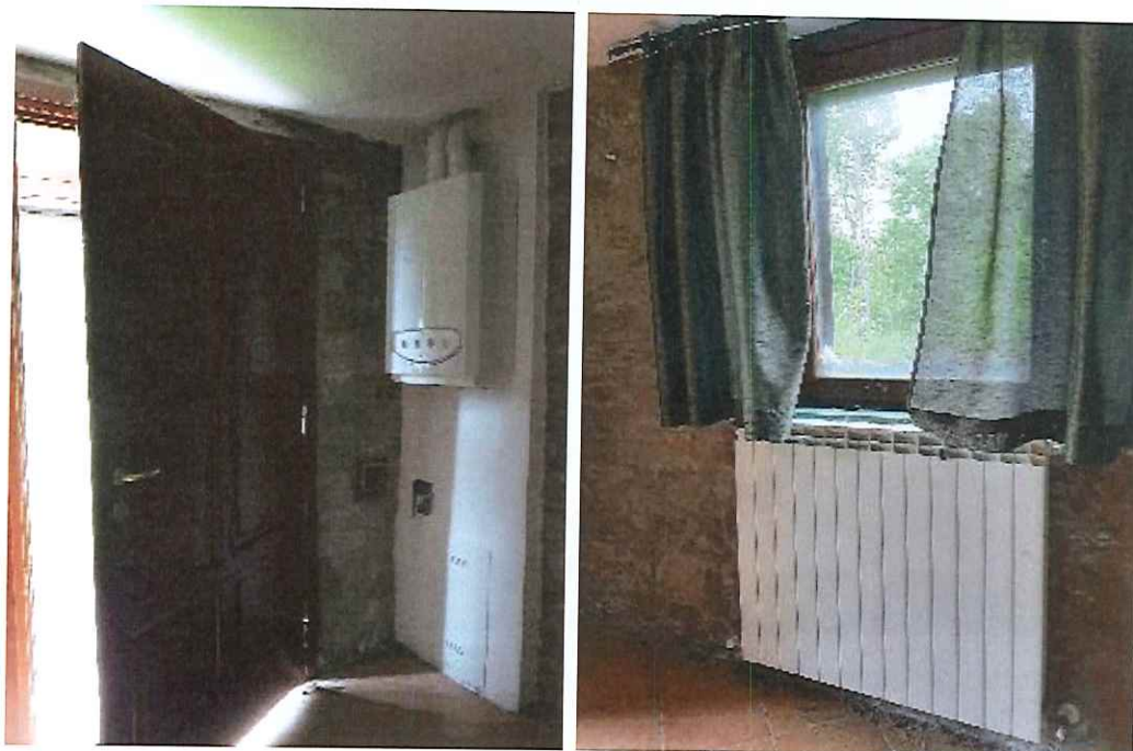
Dettaglio della caldaia e dei termosifoni.