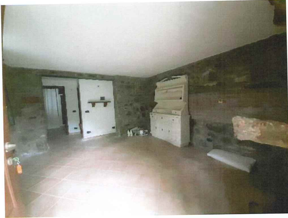
Vista della zona giorno dall'ingresso.