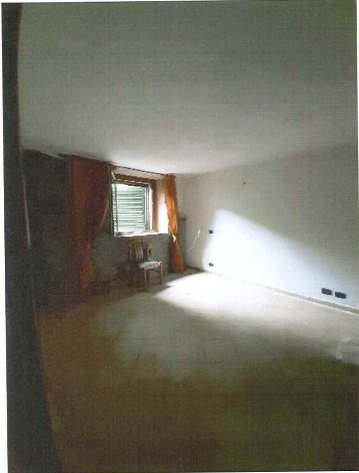
Vista della camera da letto.