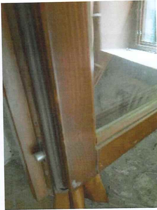
Dettaglio della finestra e dello scuro.