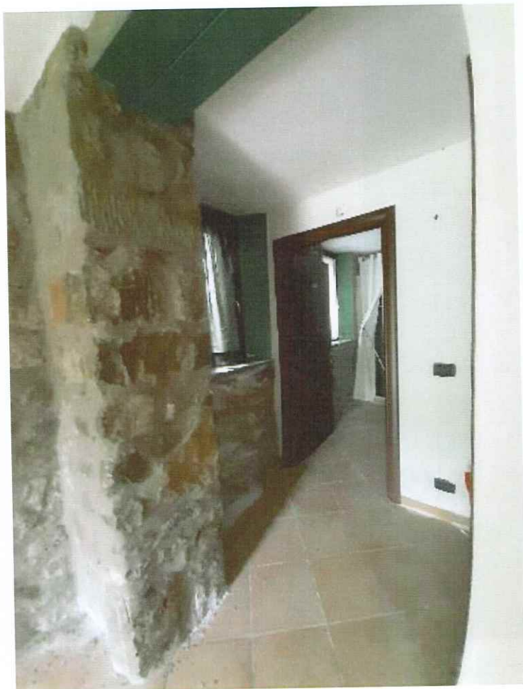
Viste del distributivo bagno e camera.