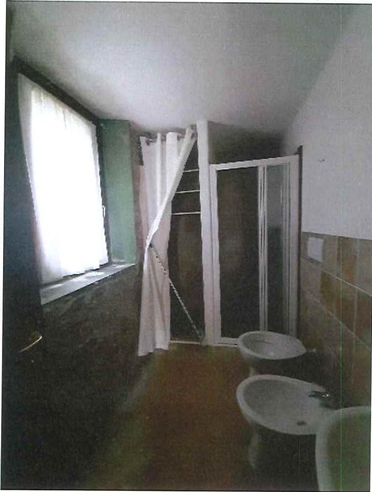
Vista del bagno.