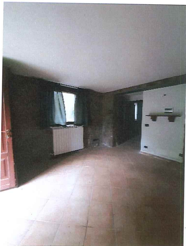
Vista della zona giorno.