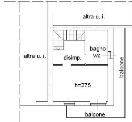
Pianta Piano Secondo (2)