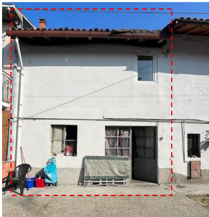
Autorimessa: vista esterna lato ovest (da corte interna comune)