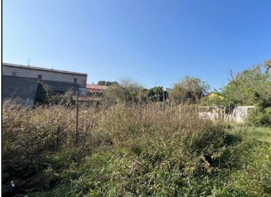
Terreno particella 1219

Viale A. Necchi 4 27100 Pavia e-mail nverdi2@gmail.com pec mail: nicola.verdi@ingpec.eu P.IVA 01806320188 Iscritto all'Albo degli Ingegneri della Provincia di Pavia al n. 1981