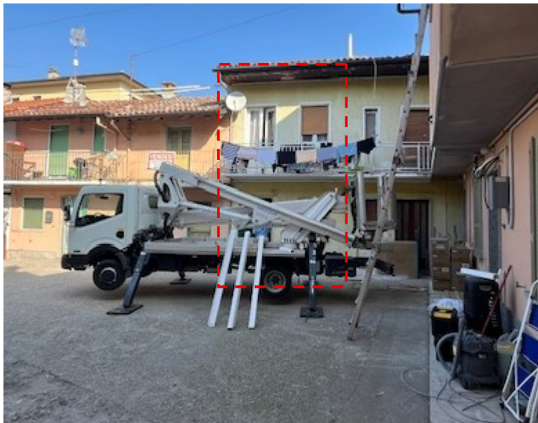
Abitazione: vista esterna lato ovest (da corte interna comune)