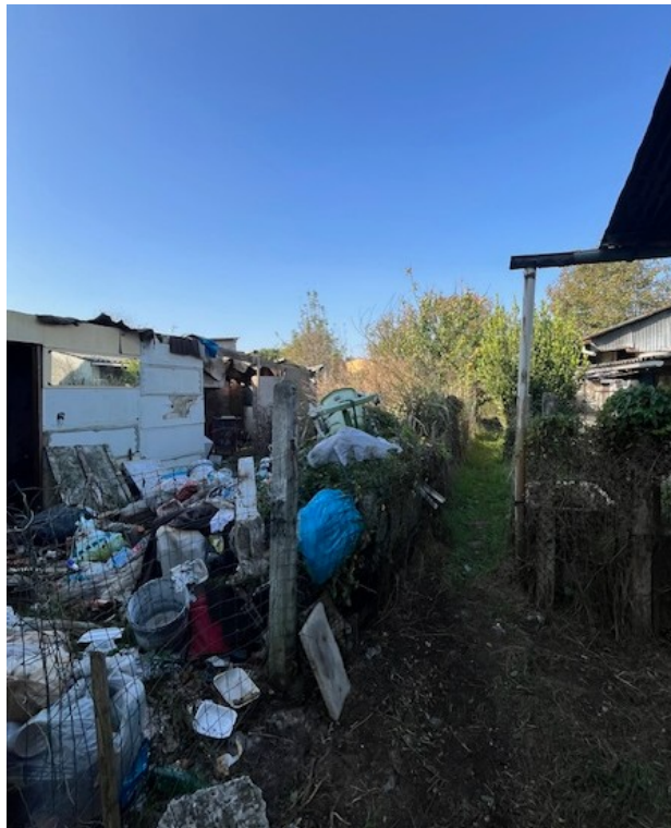
Terreno particella 79: inaccessible per la presenza di cumuli di rifiuti e macerie