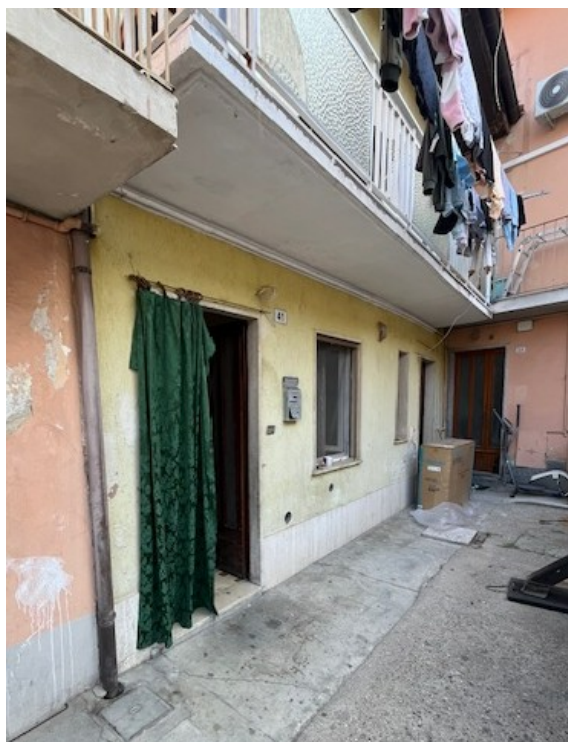
Abitazione: vista esterna lato ovest (da corte interna comune, civico 41)