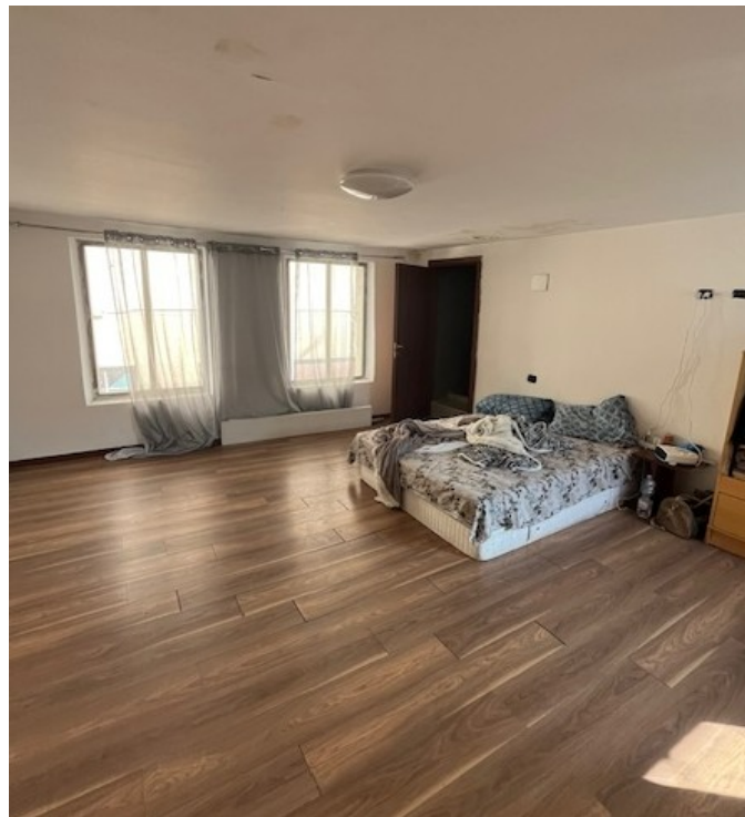
Ambiente al piano primo, soprastante autorimessa, utilizzato da altra proprietà