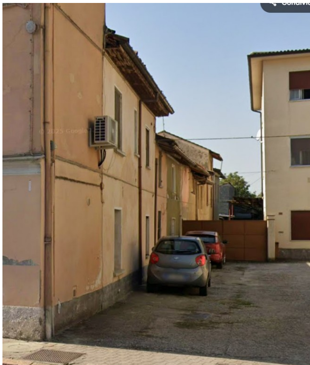
Abitazione: vista esterna lato est (da corte interna di altra proprietà)

Viale A. Necchi 4 27100 Pavia e-mail nverdi2@gmail.com pec mail: nicola.verdi@ingpec.eu P.IVA 01806320188 Iscritto all'Albo degli Ingegneri della Provincia di Pavia al n. 1981