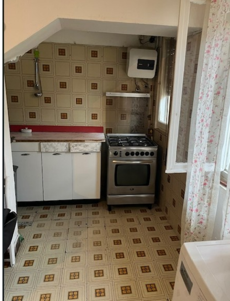
Angolo cottura nel sottoscala