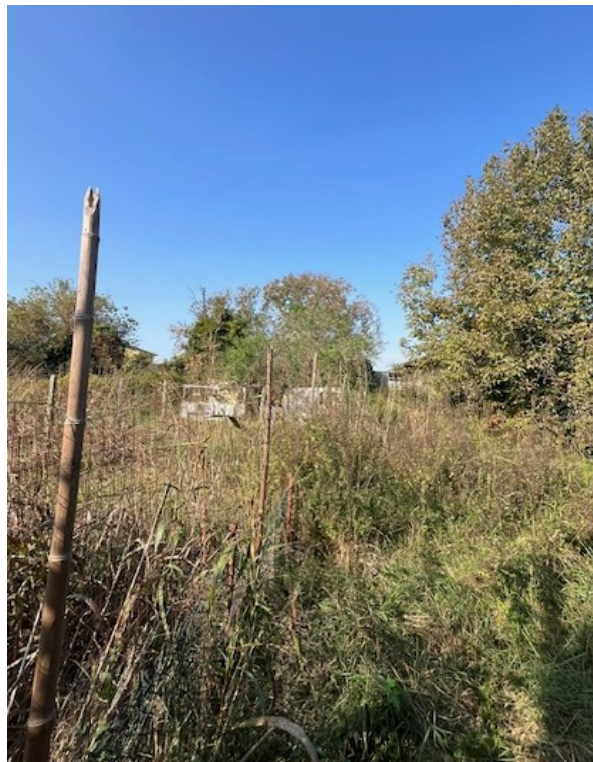
Terreno particella 1219: incolto e ricoperto da vegetazione spontanea