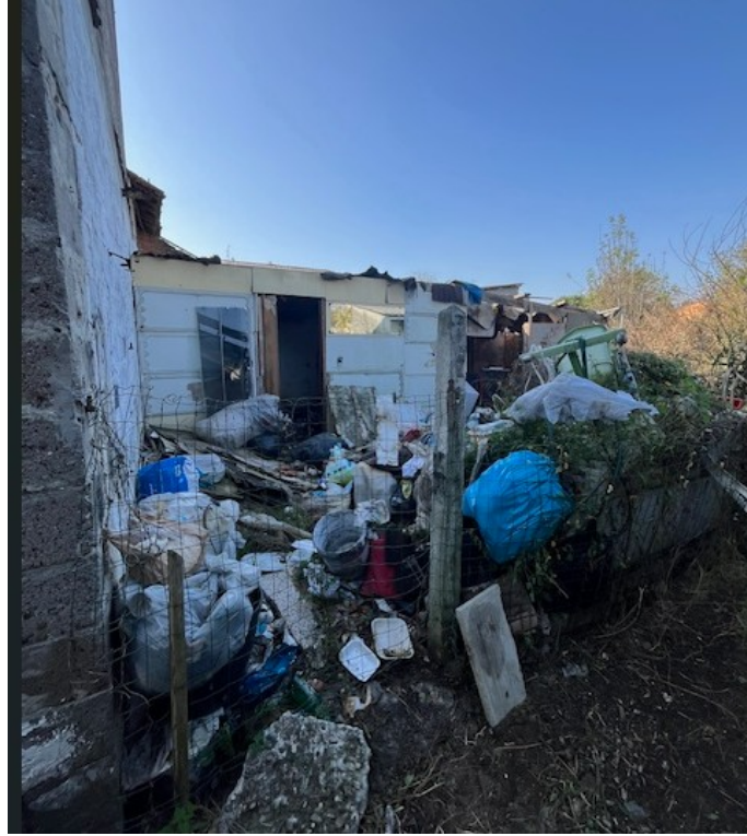
Terreno particella 79

Viale A. Necchi 4 27100 Pavia e-mail nverdi2@gmail.com pec mail: nicola.verdi@ingpec.eu P.IVA 01806320188 Iscritto all'Albo degli Ingegneri della Provincia di Pavia al n. 1981