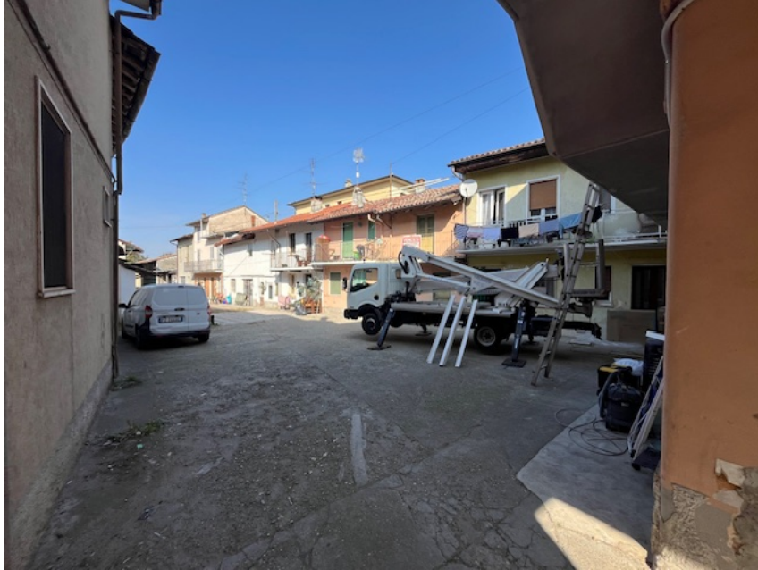
Vista esterna della corte comune

Viale A. Necchi 4 27100 Pavia e-mail nverdi2@gmail.com pec mail: nicola.verdi@ingpec.eu P.IVA 01806320188 Iscritto all'Albo degli Ingegneri della Provincia di Pavia al n. 1981