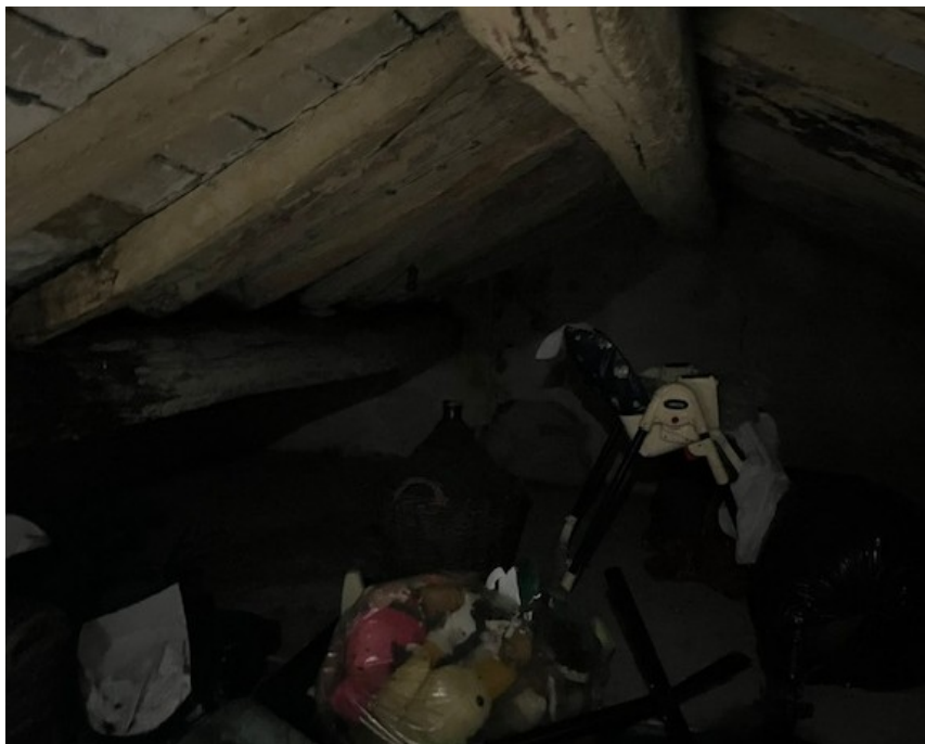
Sottotetto non abitabile