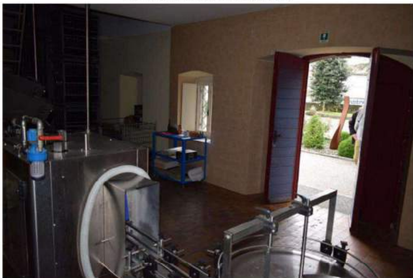
CONFEZIONAMENTO VINO E MAGAZZINO