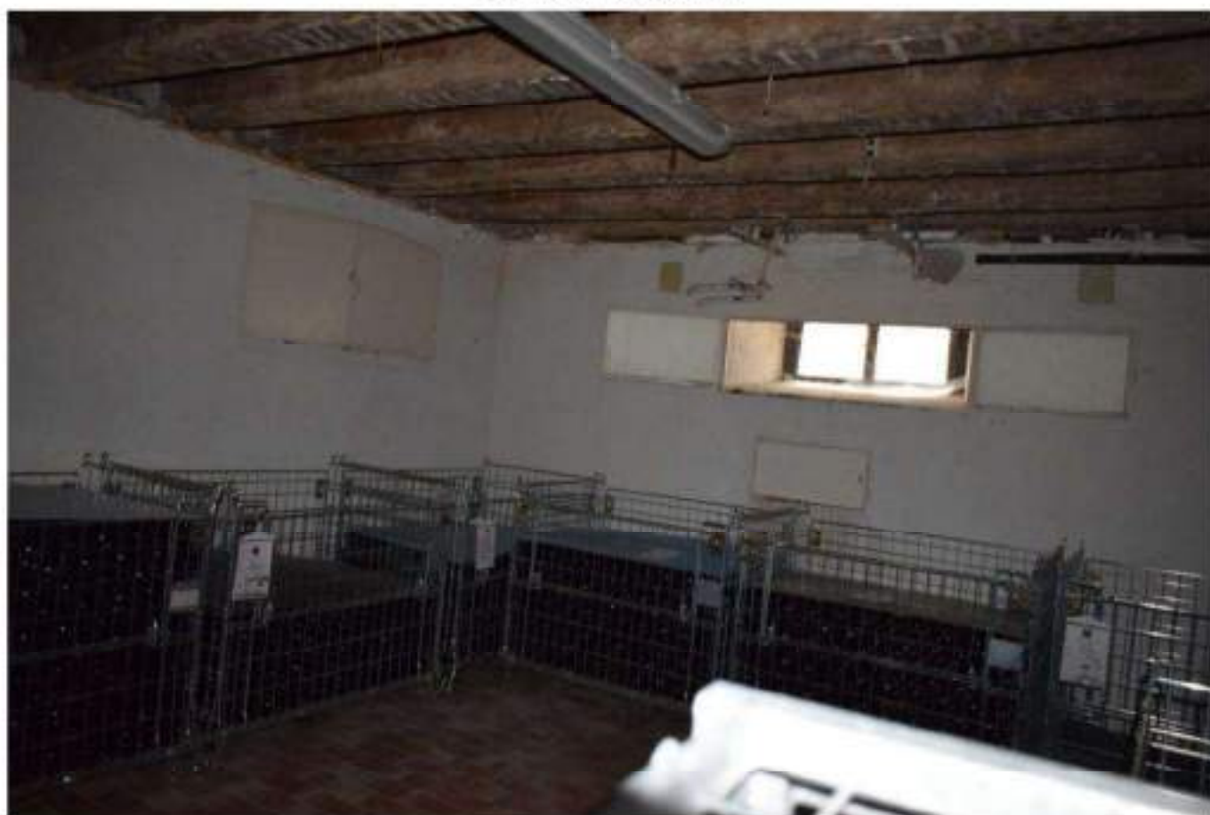
CANTINA - DEPOSITO