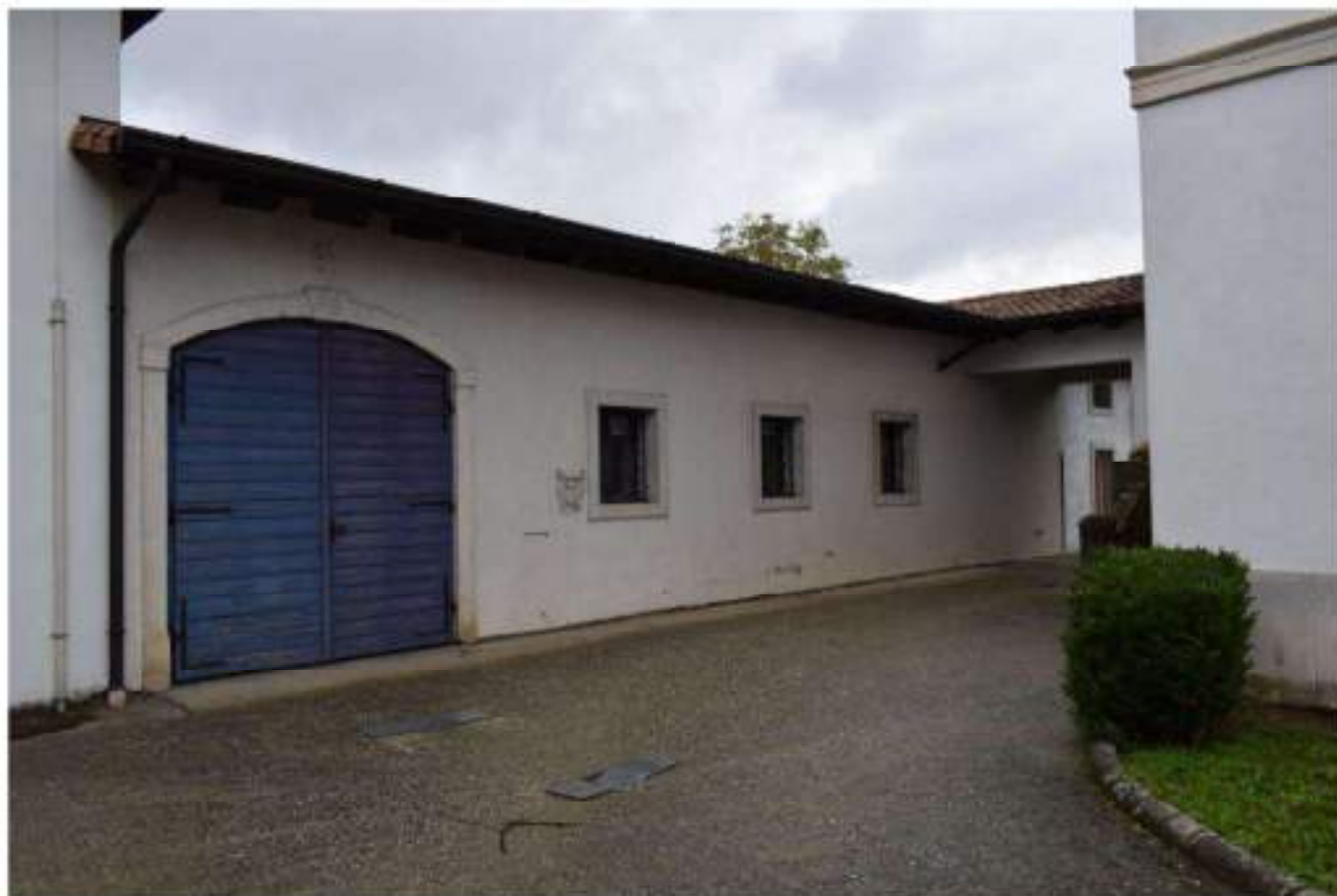
FABBRICATO S TRUMENTALE