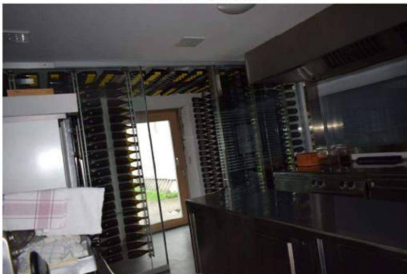
REFETTORIO – DEGUSTAZIONE