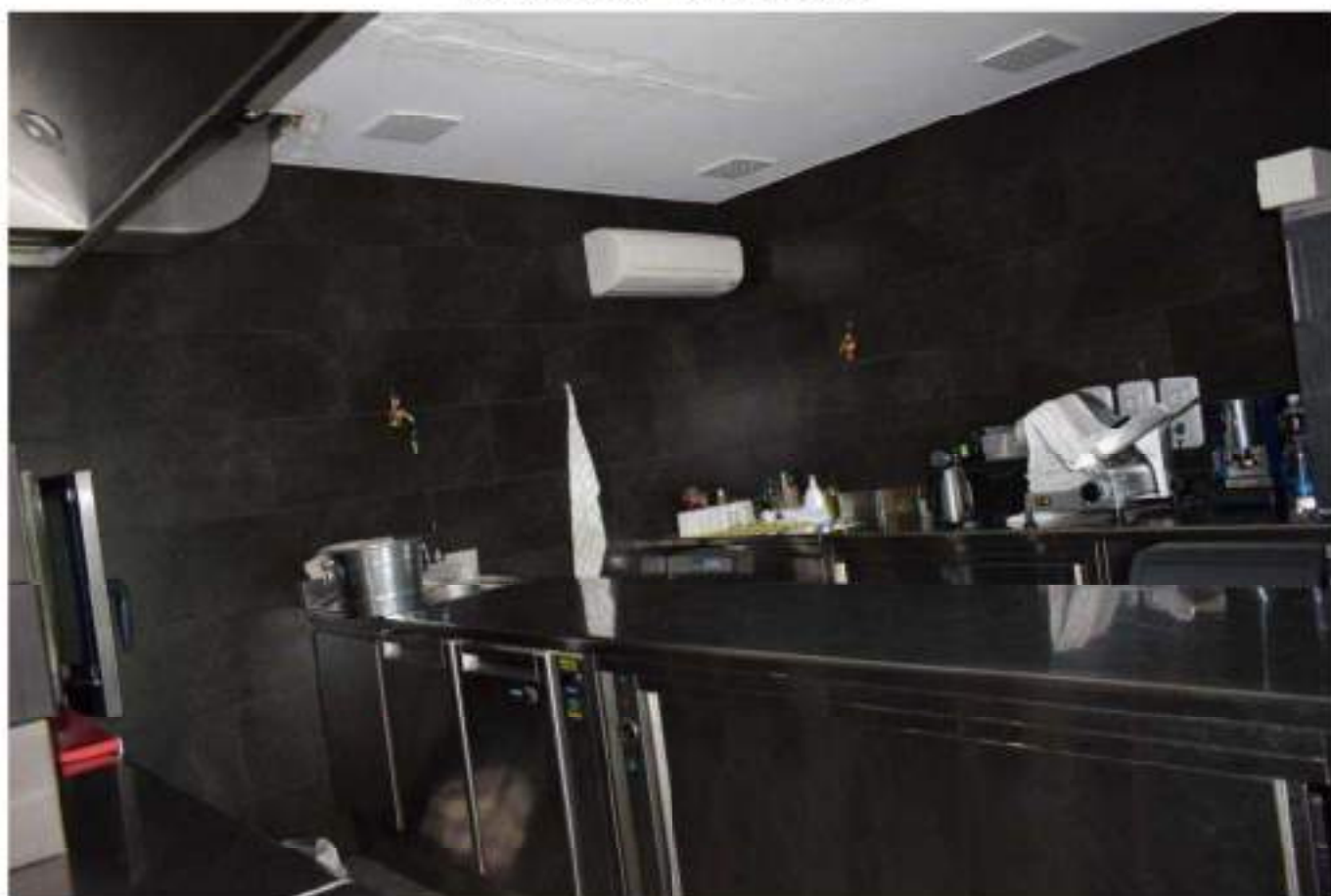
REFETTORIO – DEGUSTAZIONE