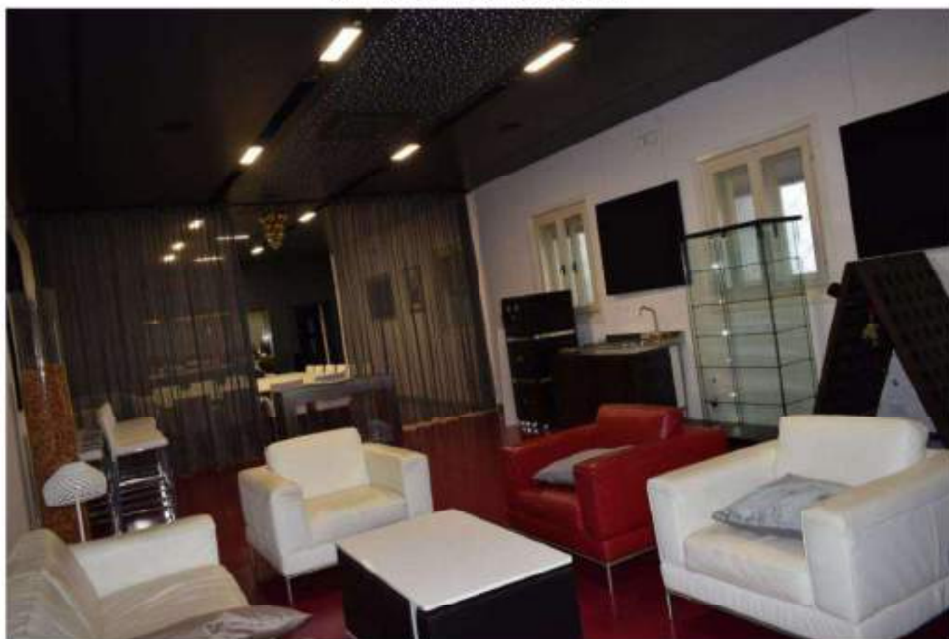
SALA MATURAZIONE SPUMANTI