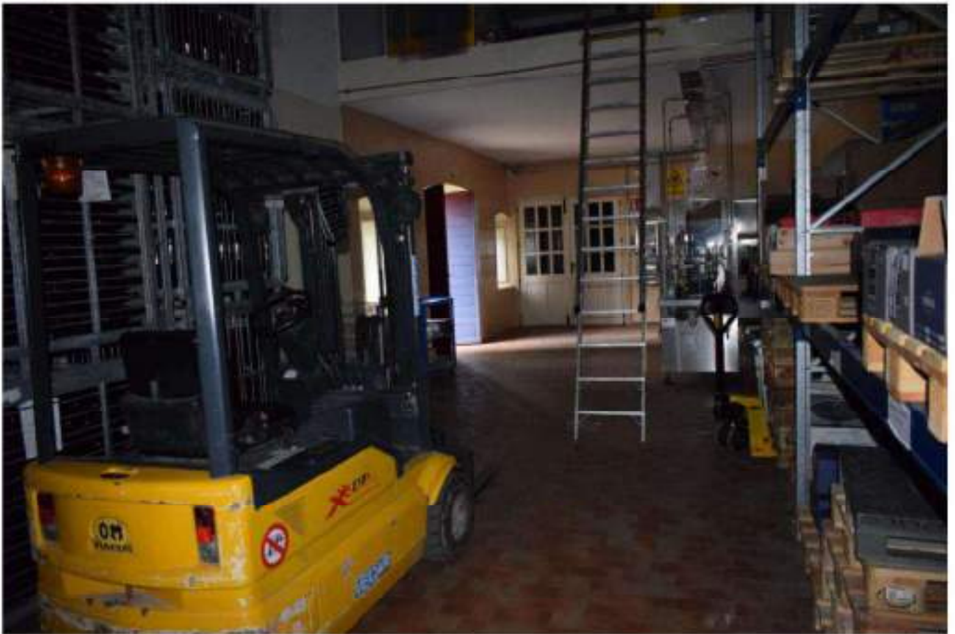
CONFEZIONAMENTO VINO E MAGAZZINO