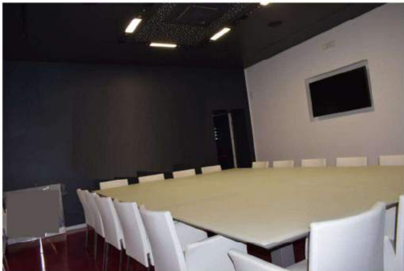
SALA MATURAZIONE SPUMANTI