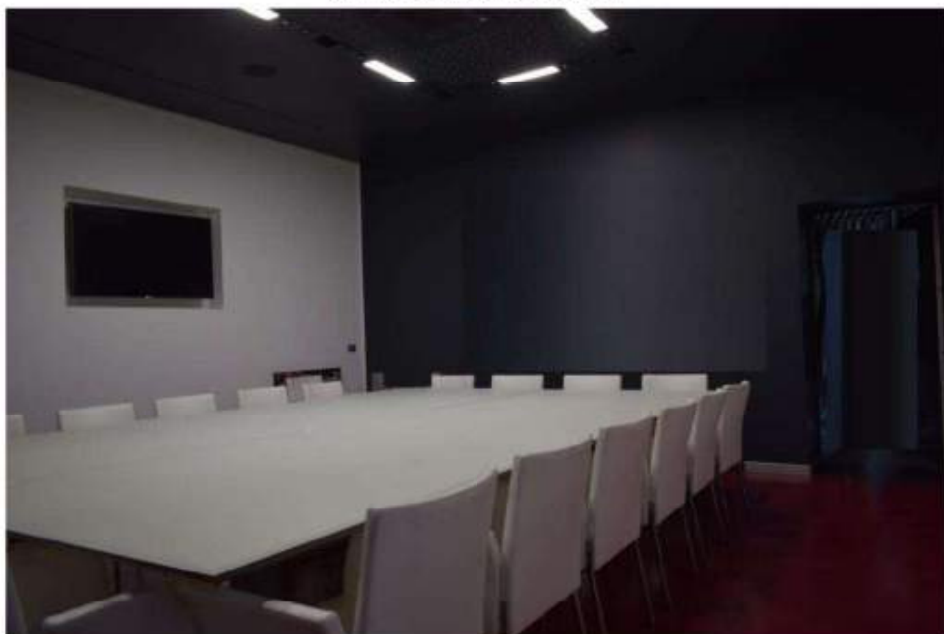
SALA MATURAZIONE SPUMANTI