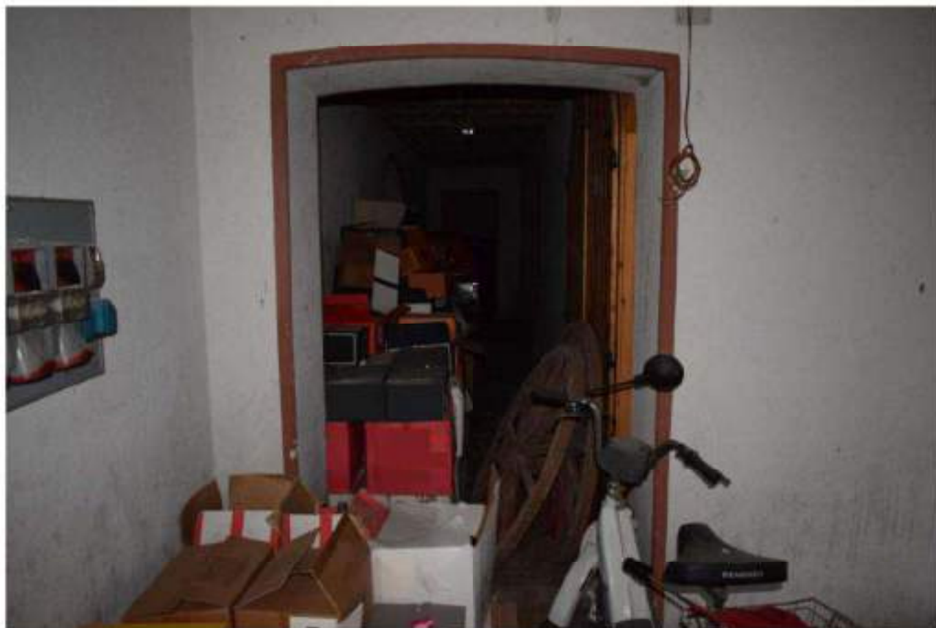
CANTINA - DEPOSITO