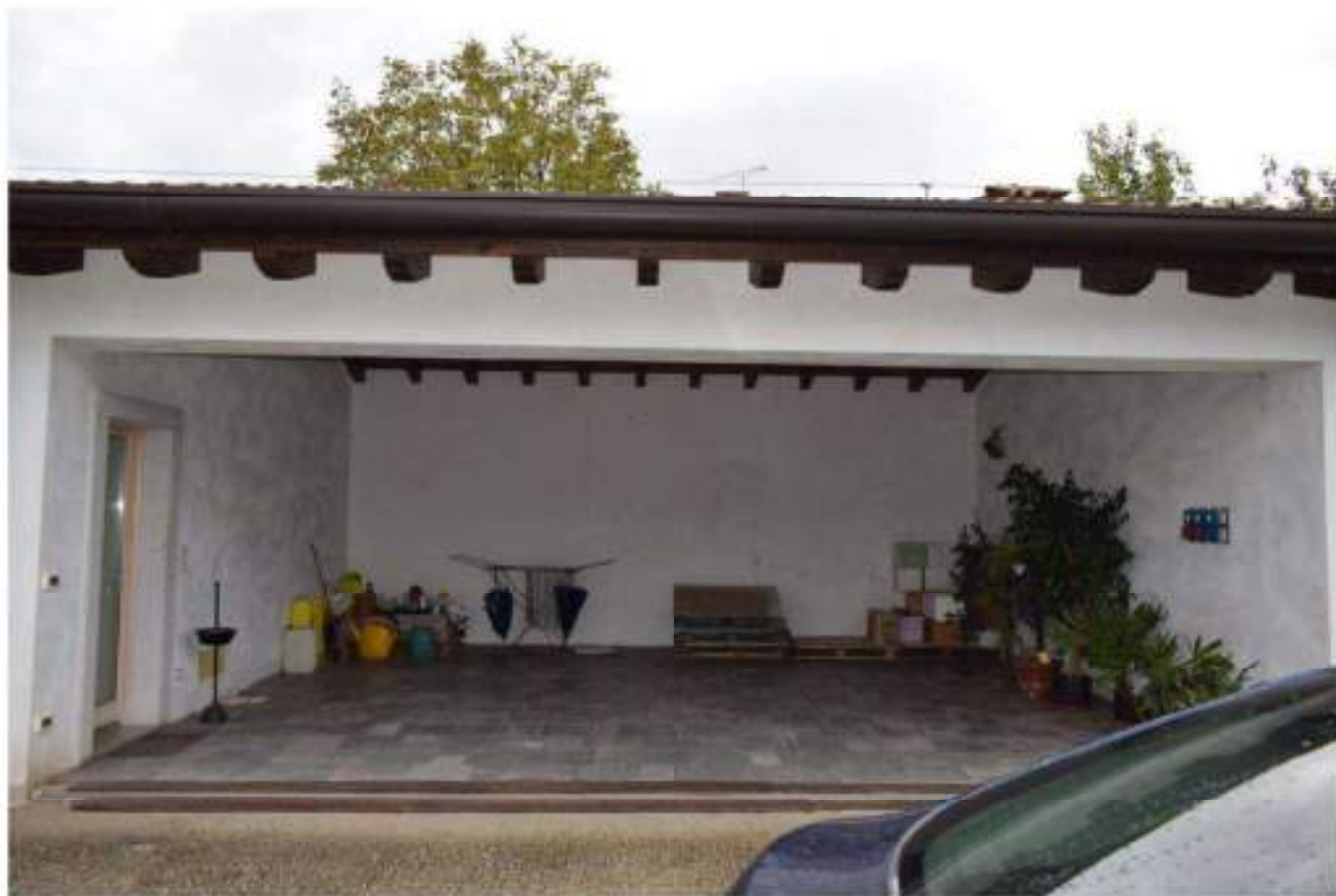
FABBRICATO S TRUMENTALE – PORTICO