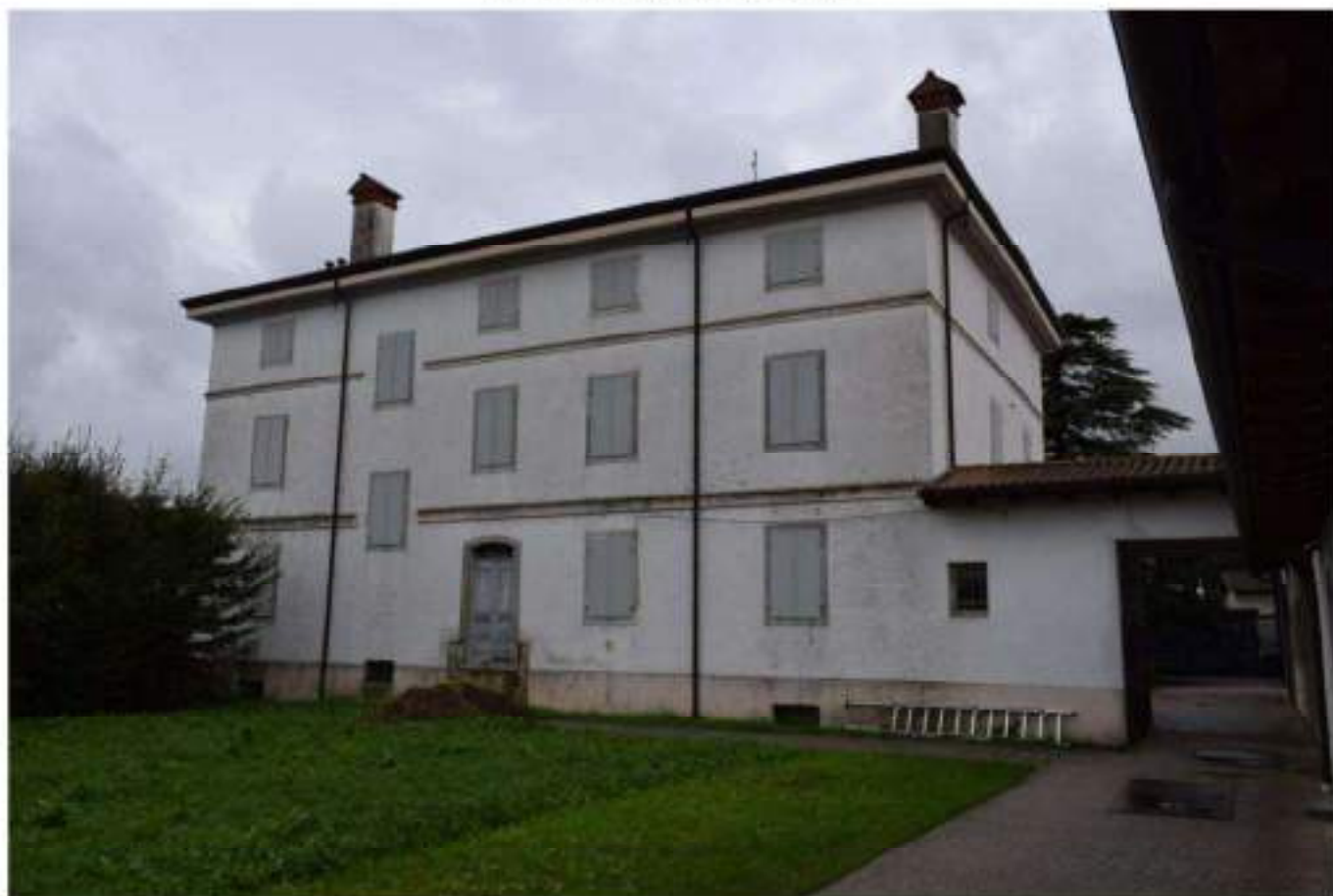
VILLA PADRONALE RETRO