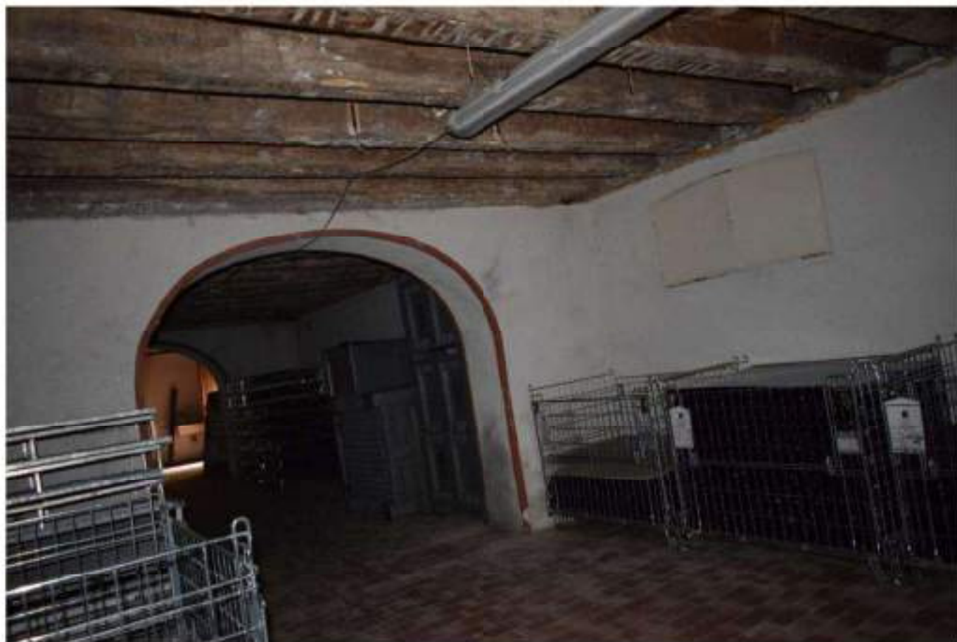
CANTINA - DEPOSITO