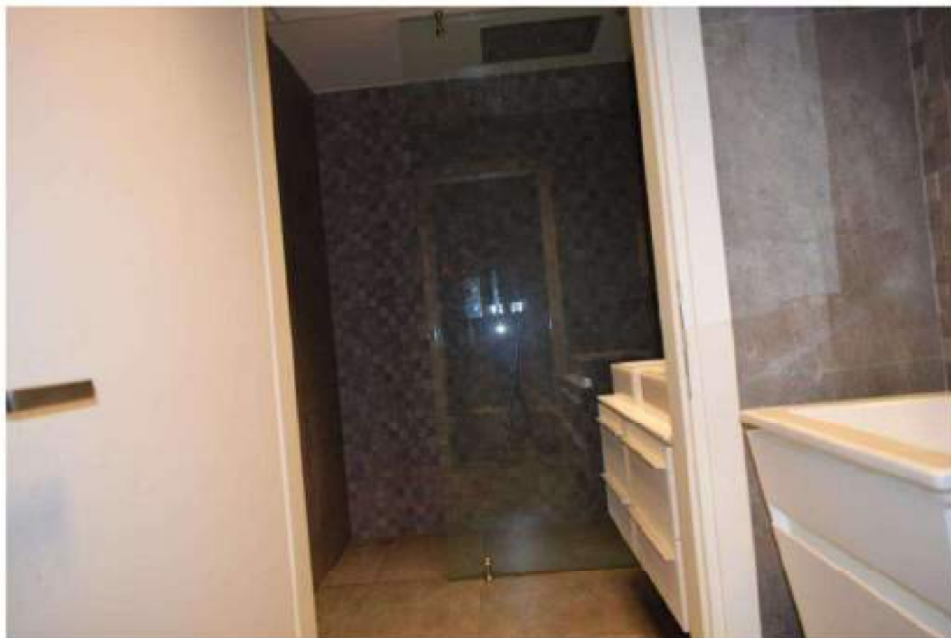
ANTI W.C. E W.C.