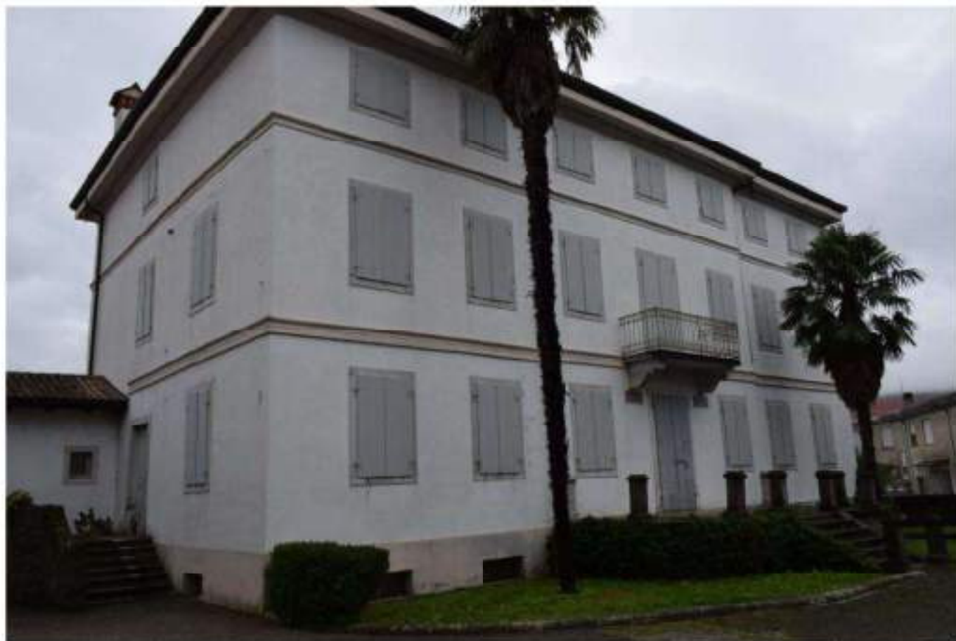
VILLA PADRONALE FRONTE