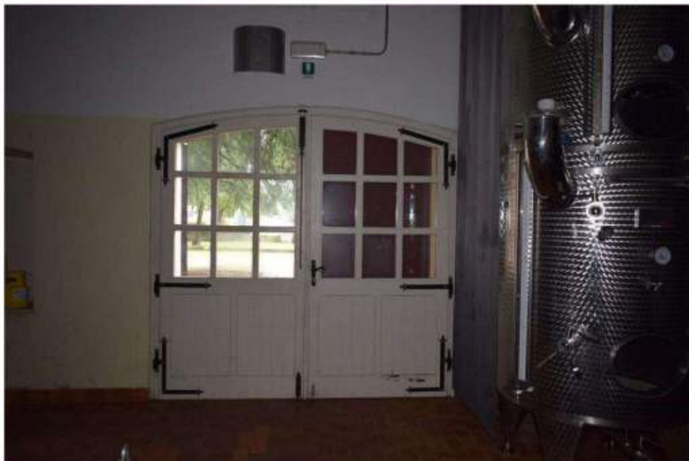
LAVORAZIONE E STOCCAGGIO VINO SFUSO