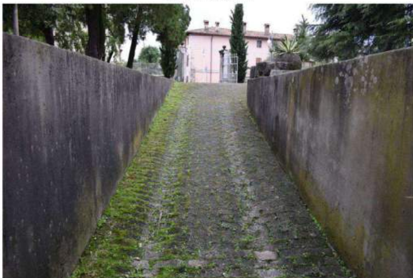
RAMPA CANTINA – DEPOSITO