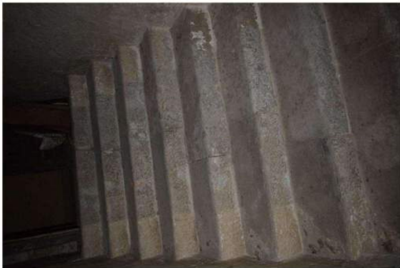
RAMPA SCALE SEMINTERRATO