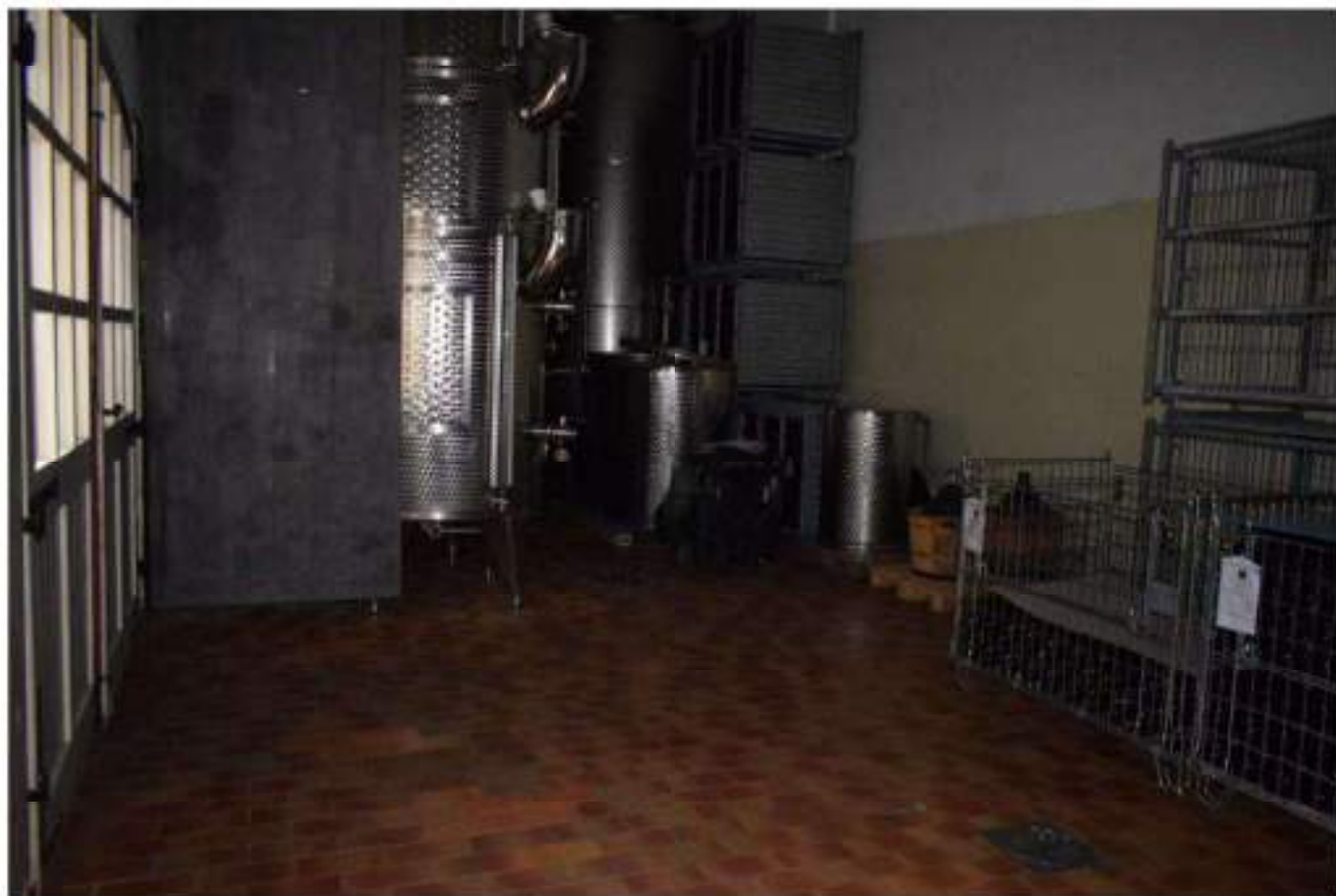
LAVORAZIONE E STOCCAGGIO VINO SFUSO