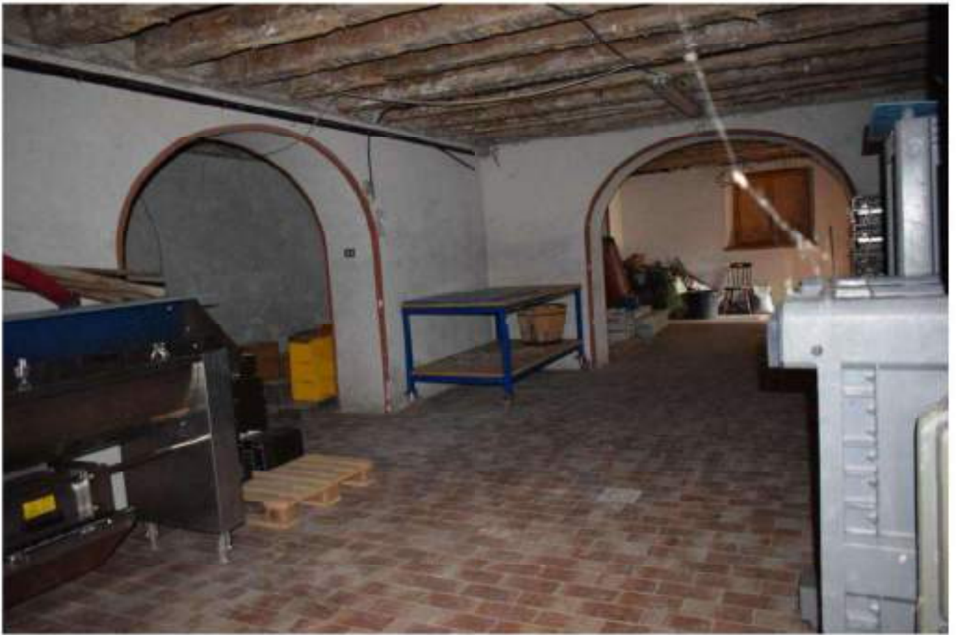
CANTINA - DEPOSITO