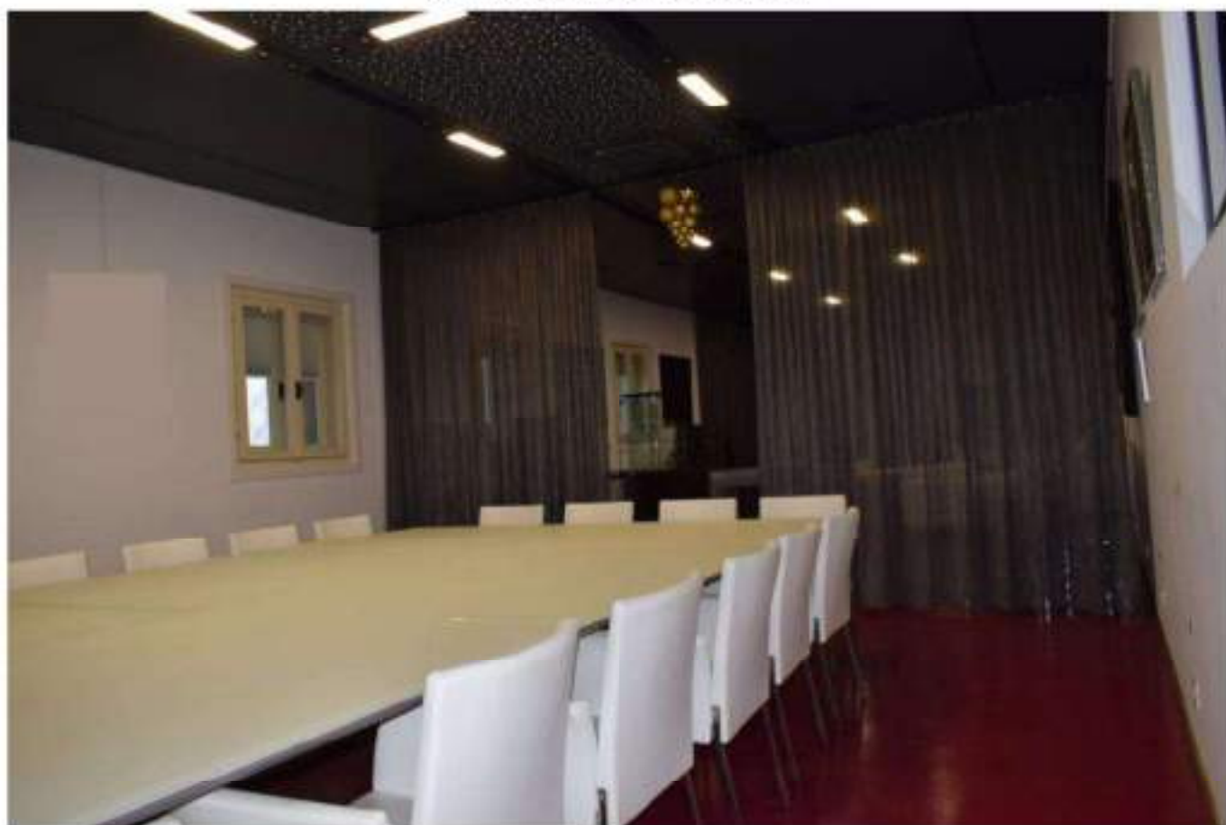
SALA MATURAZIONE SPUMANTI