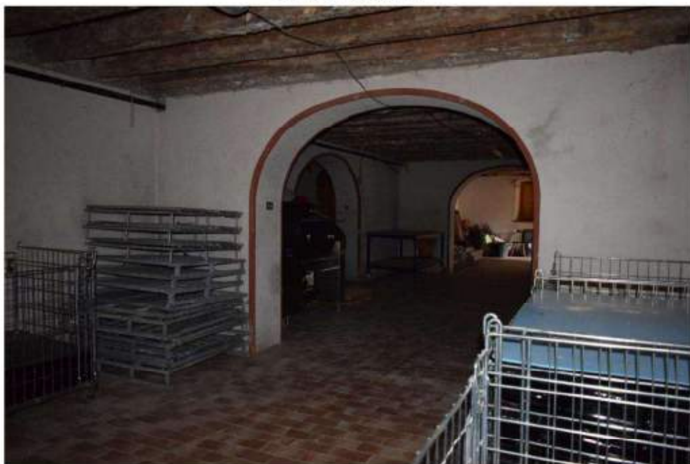
CANTINA - DEPOSITO