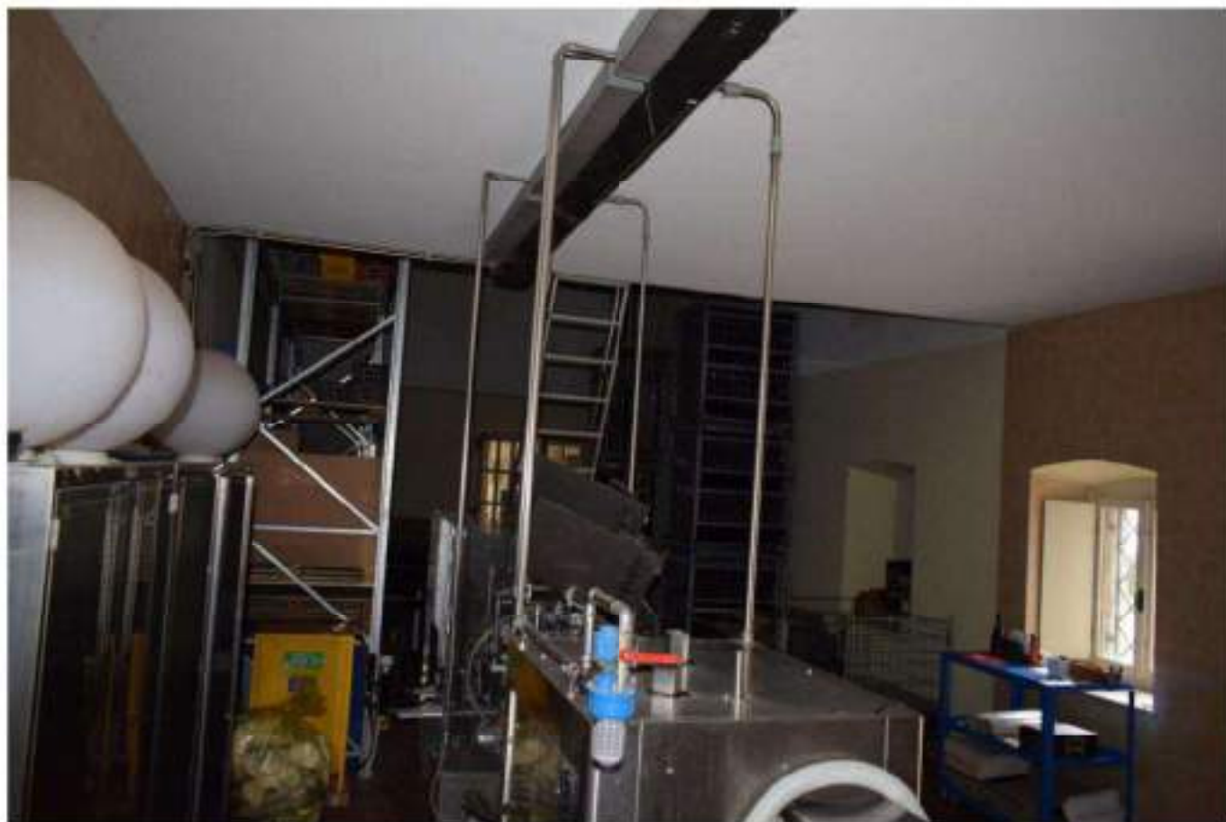
CONFEZIONAMENTO VINO E MAGAZZINO