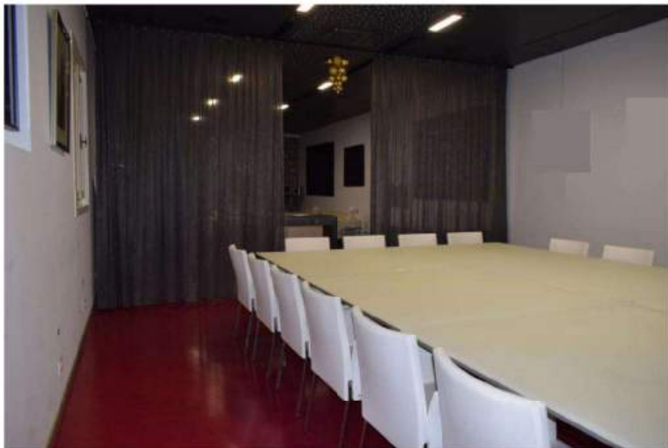
SALA MATURAZIONE SPUMANTI