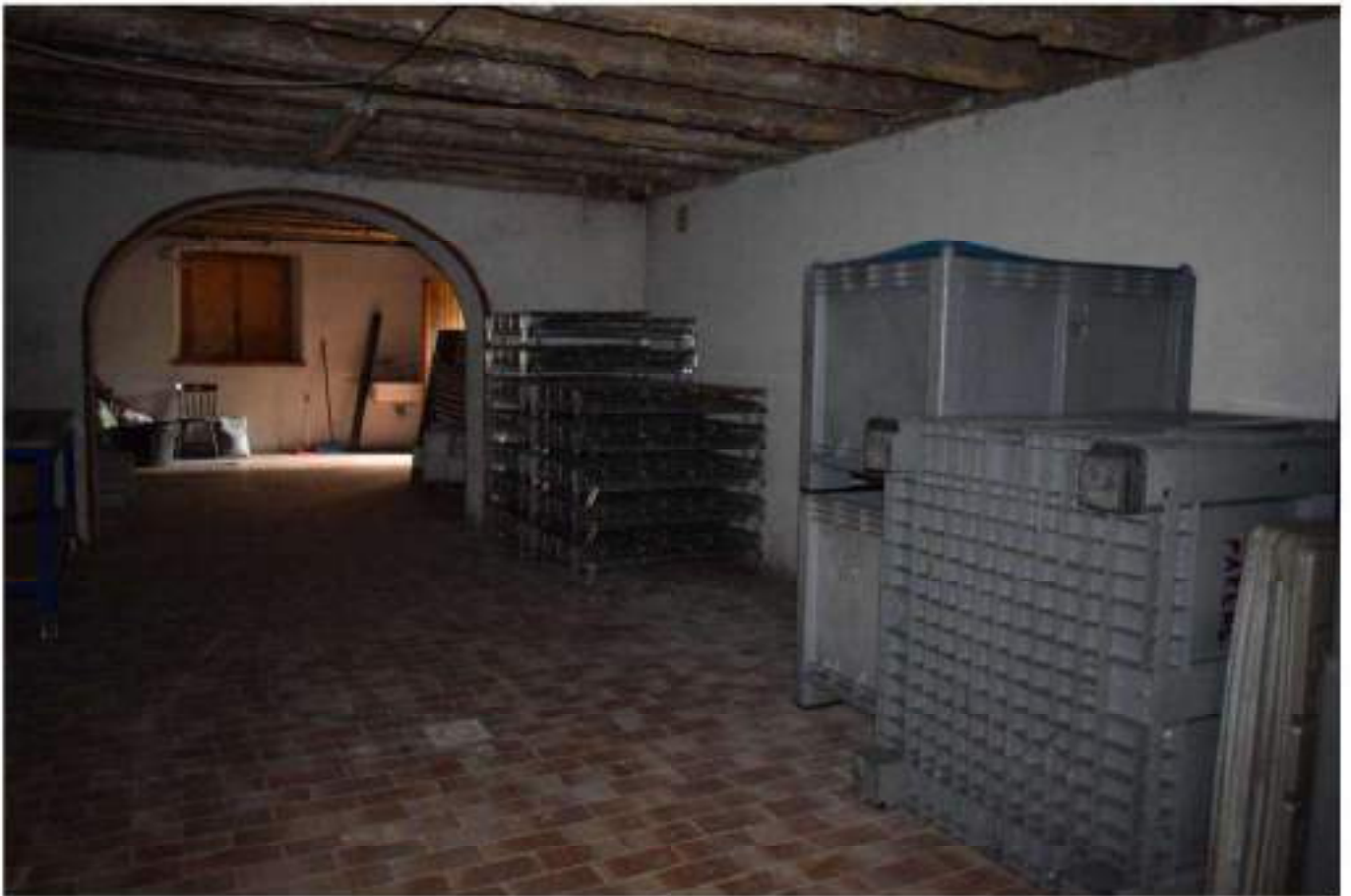
CANTINA - DEPOSITO