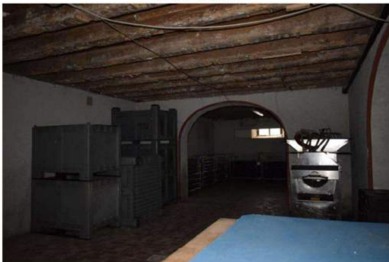
CANTINA - DEPOSITO