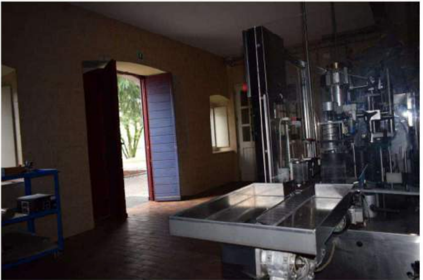
CONFEZIONAMENTO VINO E MAGAZZINO