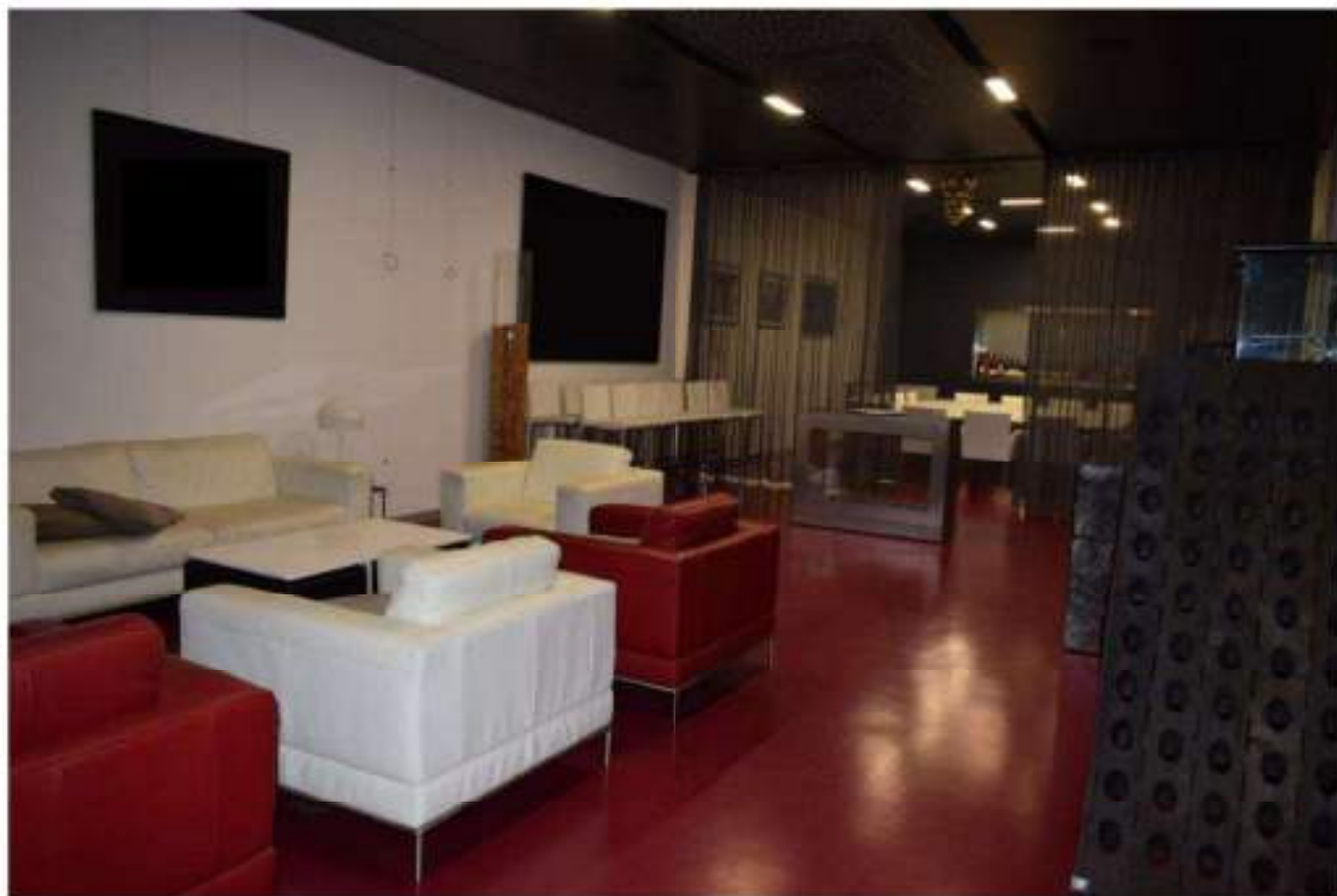
SALA MATURAZIONE SPUMANTI