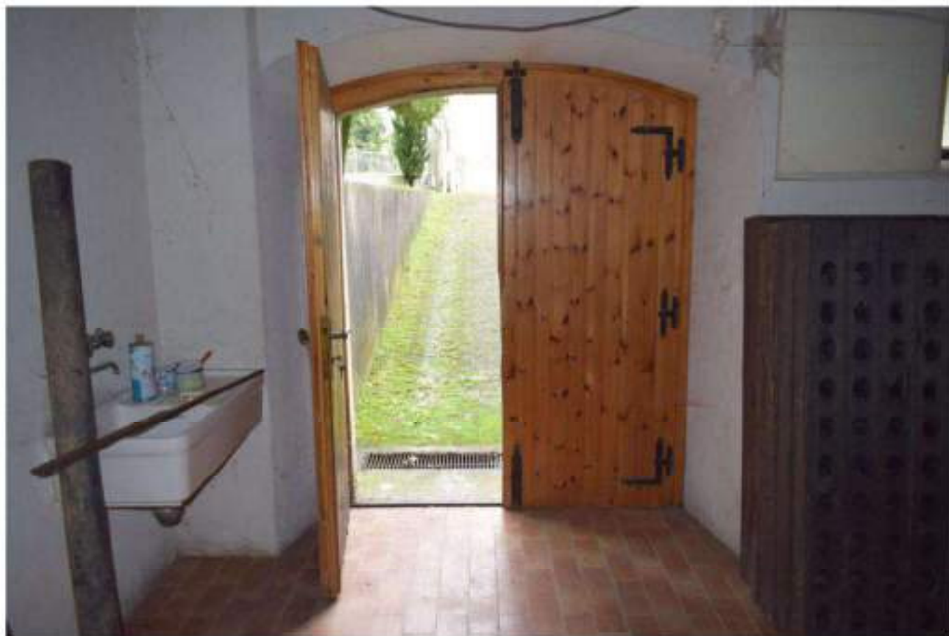
CANTINA – DEPOSITO