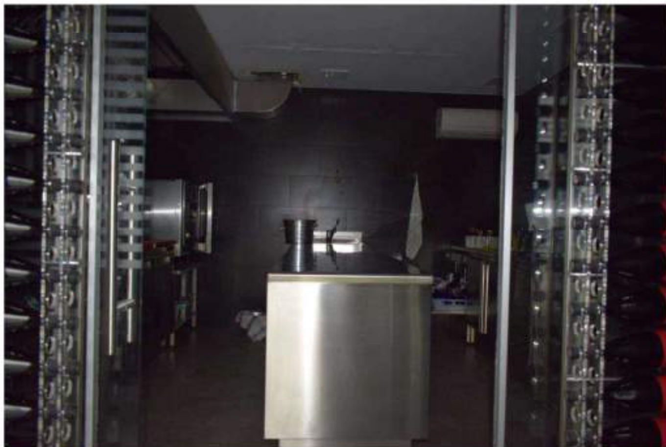
REFETTORIO – DEGUSTAZIONE