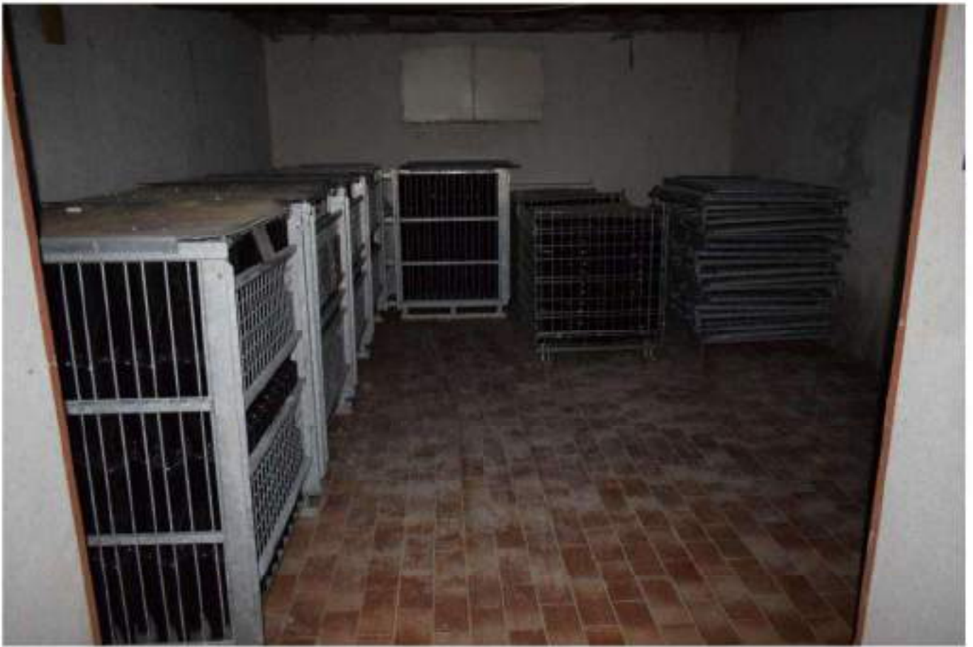
CANTINA - DEPOSITO