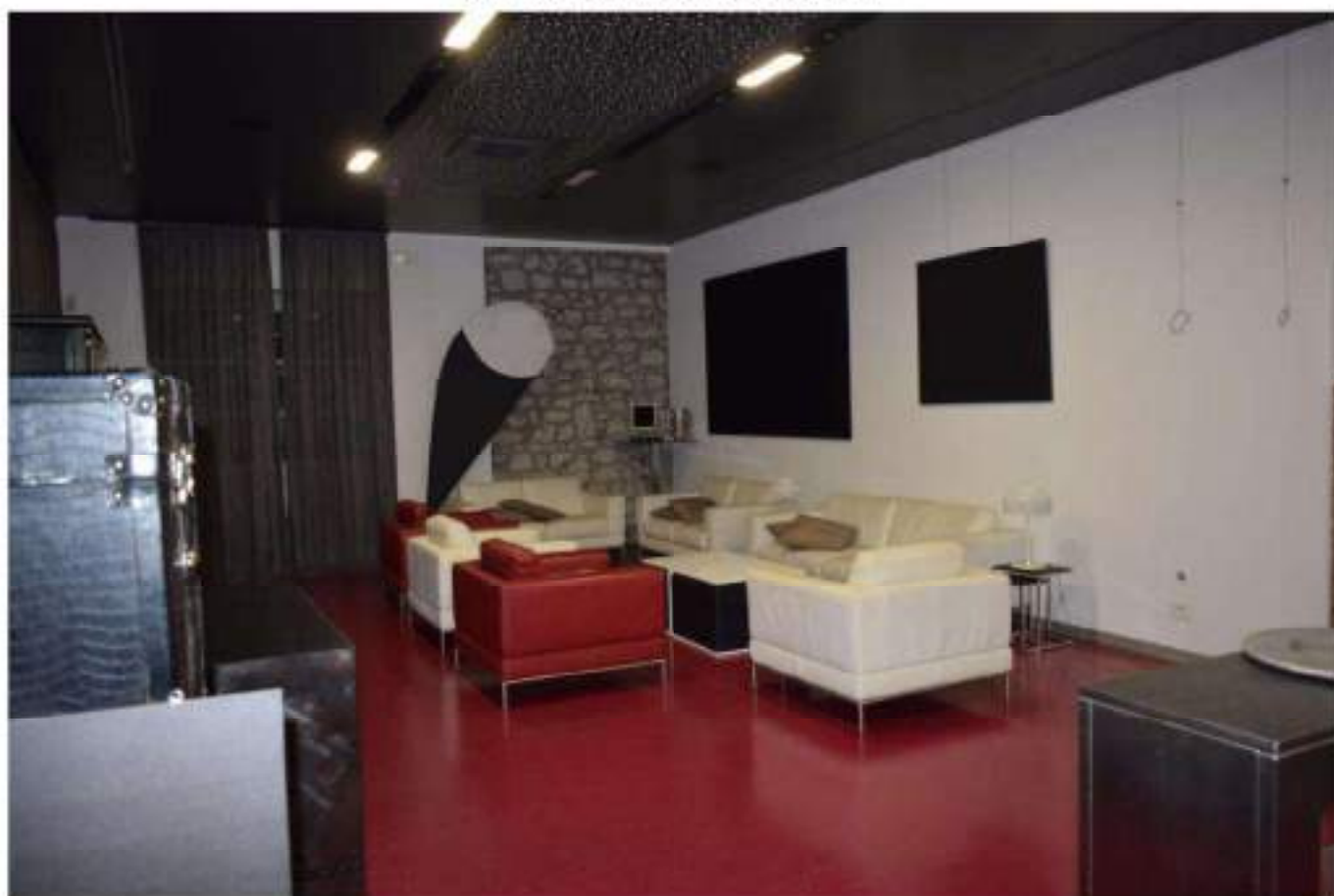
SALA MATURAZIONE SPUMANTI