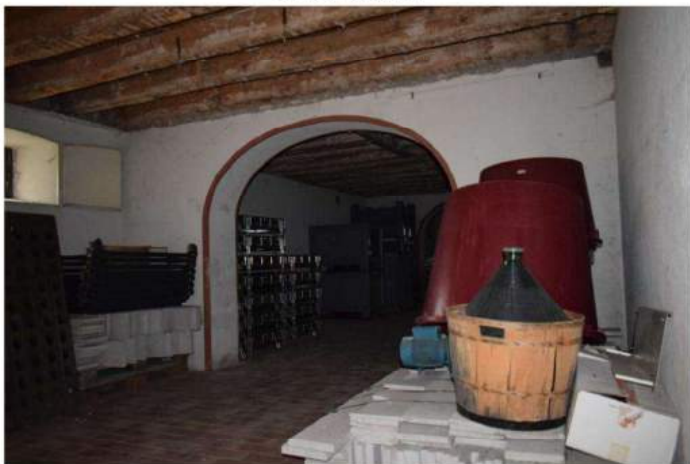
CANTINA - DEPOSITO