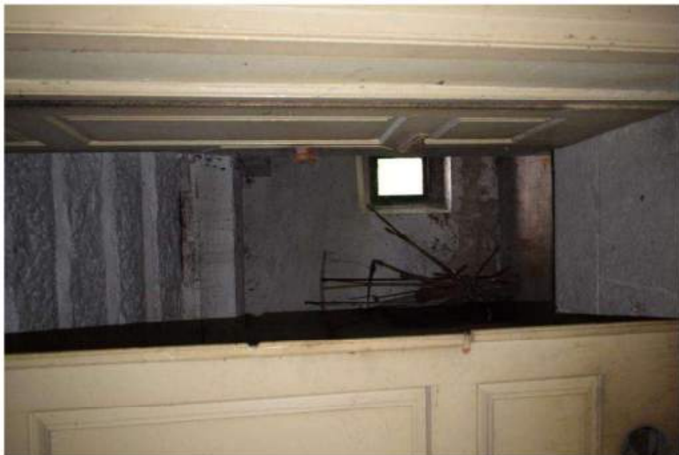
RAMPA SCALE SEMINTERRATO