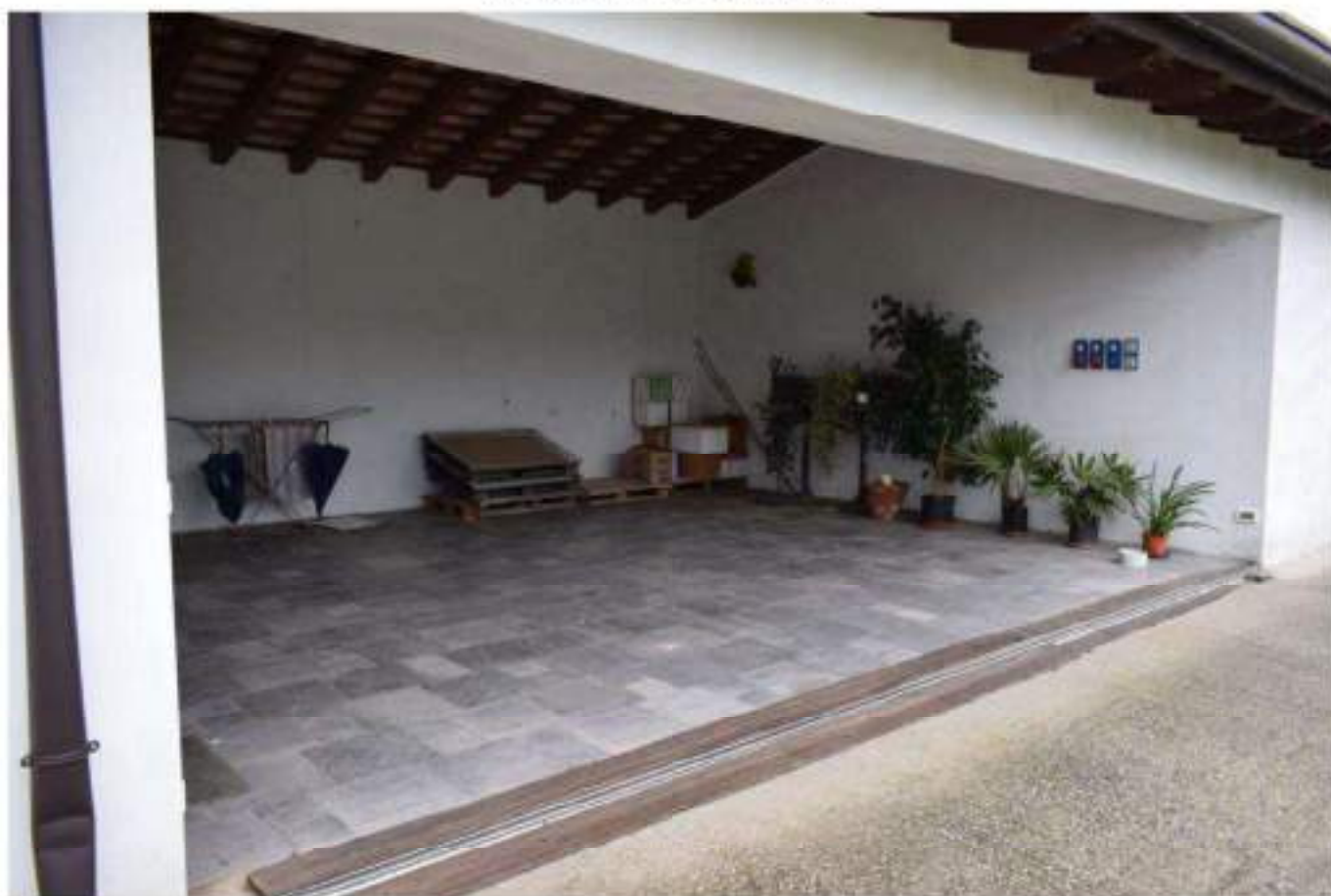
FABBRICATO S TRUMENTALE - PORTICO