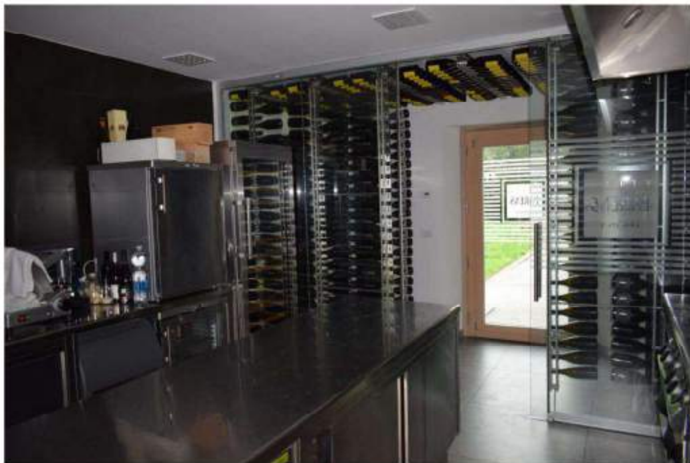
REFETTORIO – DEGUSTAZIONE