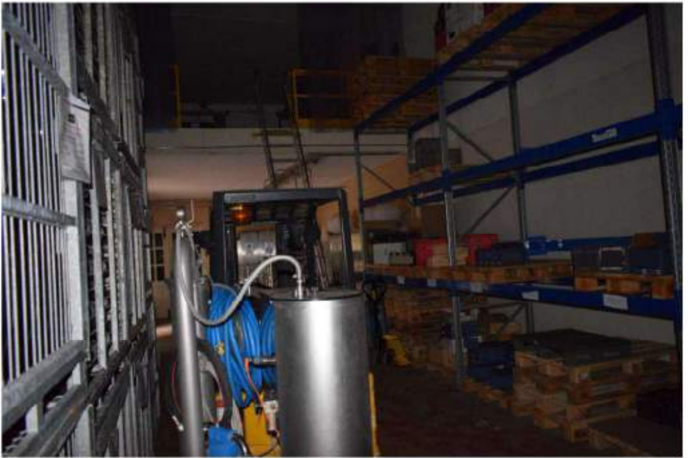
CONFEZIONAMENTO VINO E MAGAZZINO