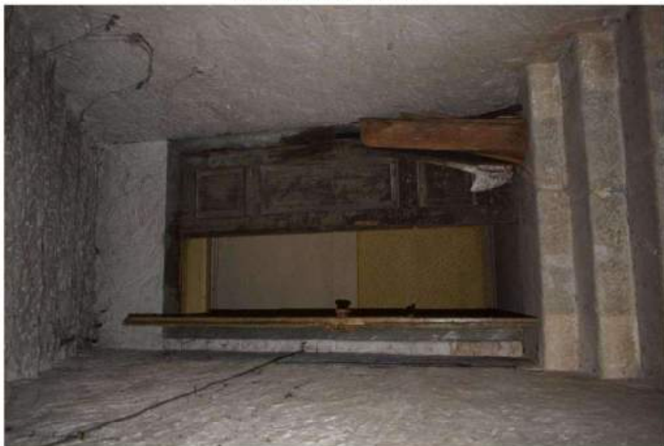
RAMPA SCALE SEMINTERRATO