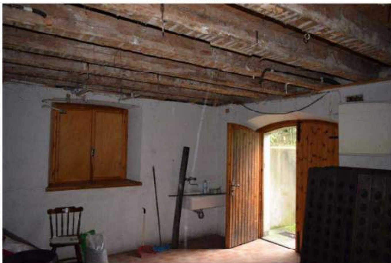
CANTINA - DEPOSITO