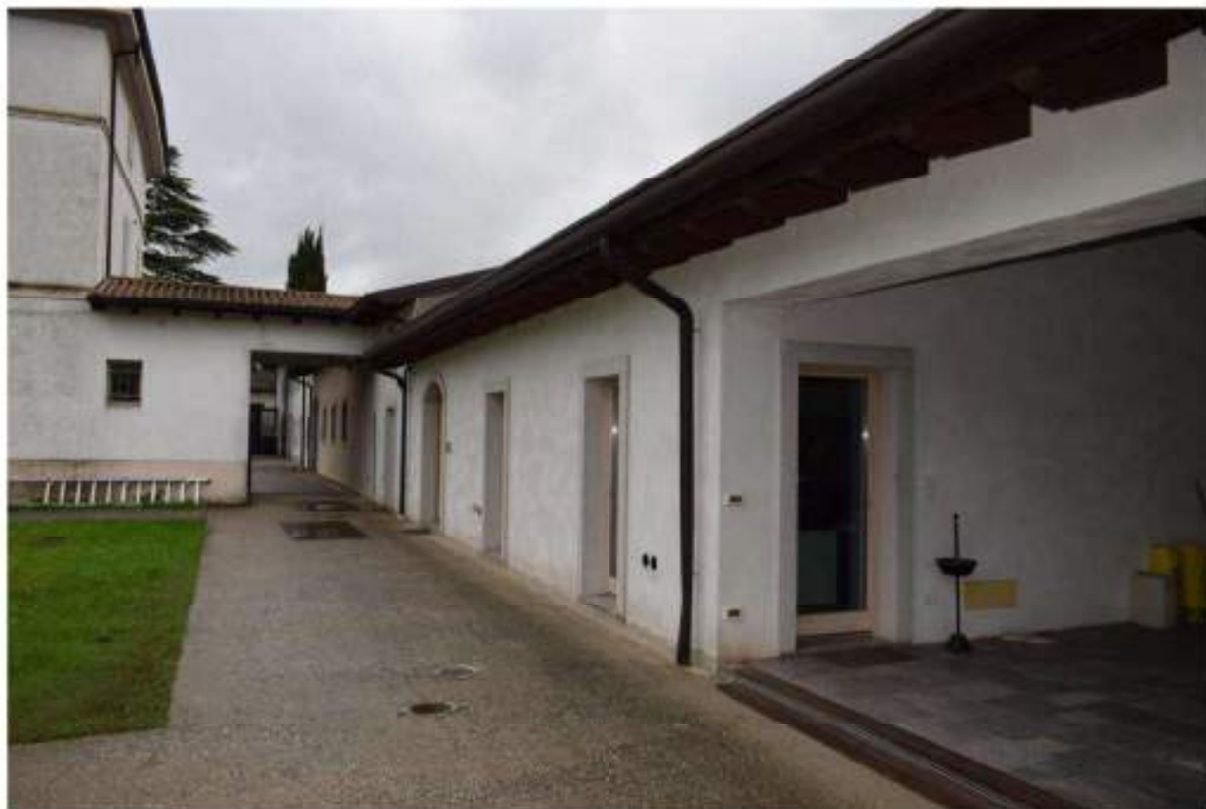
FABBRICATO S TRUMENTALE