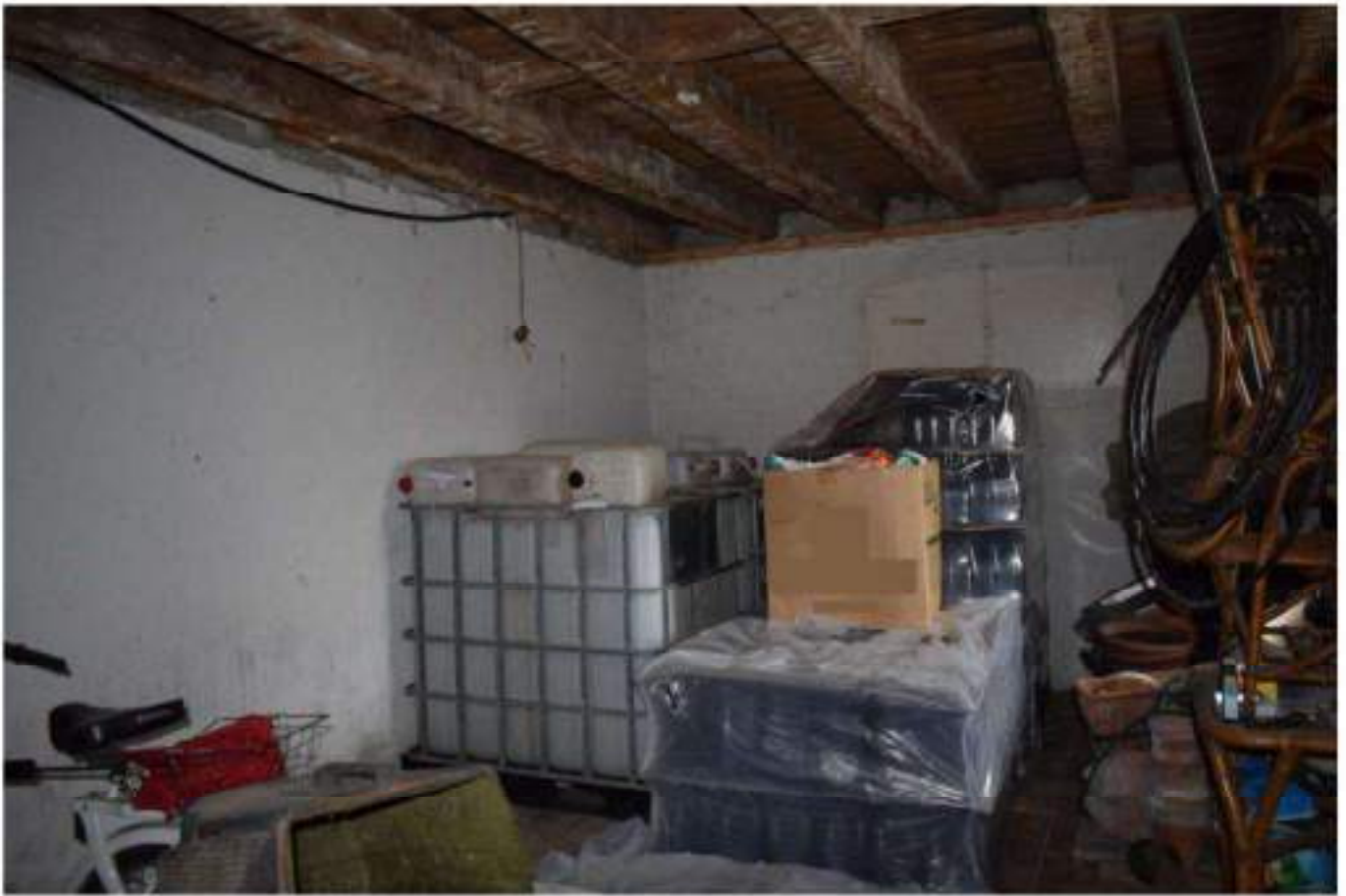
CANTINA - DEPOSITO