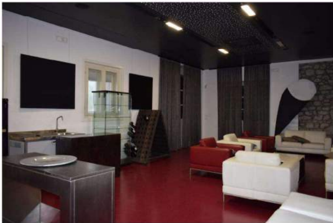
SALA MATURAZIONE SPUMANTI