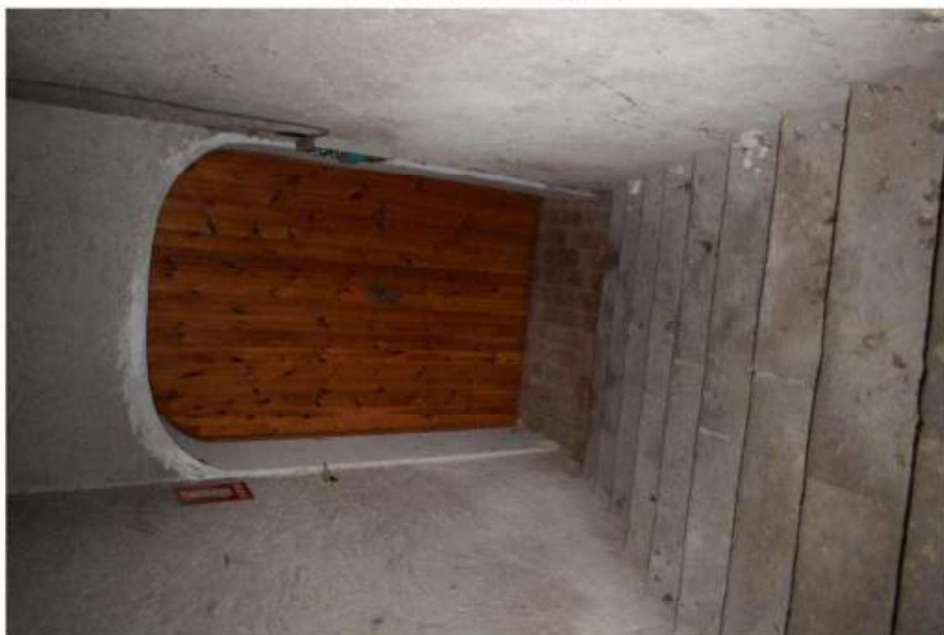
RAMPA SCALE SEMINTERRATO