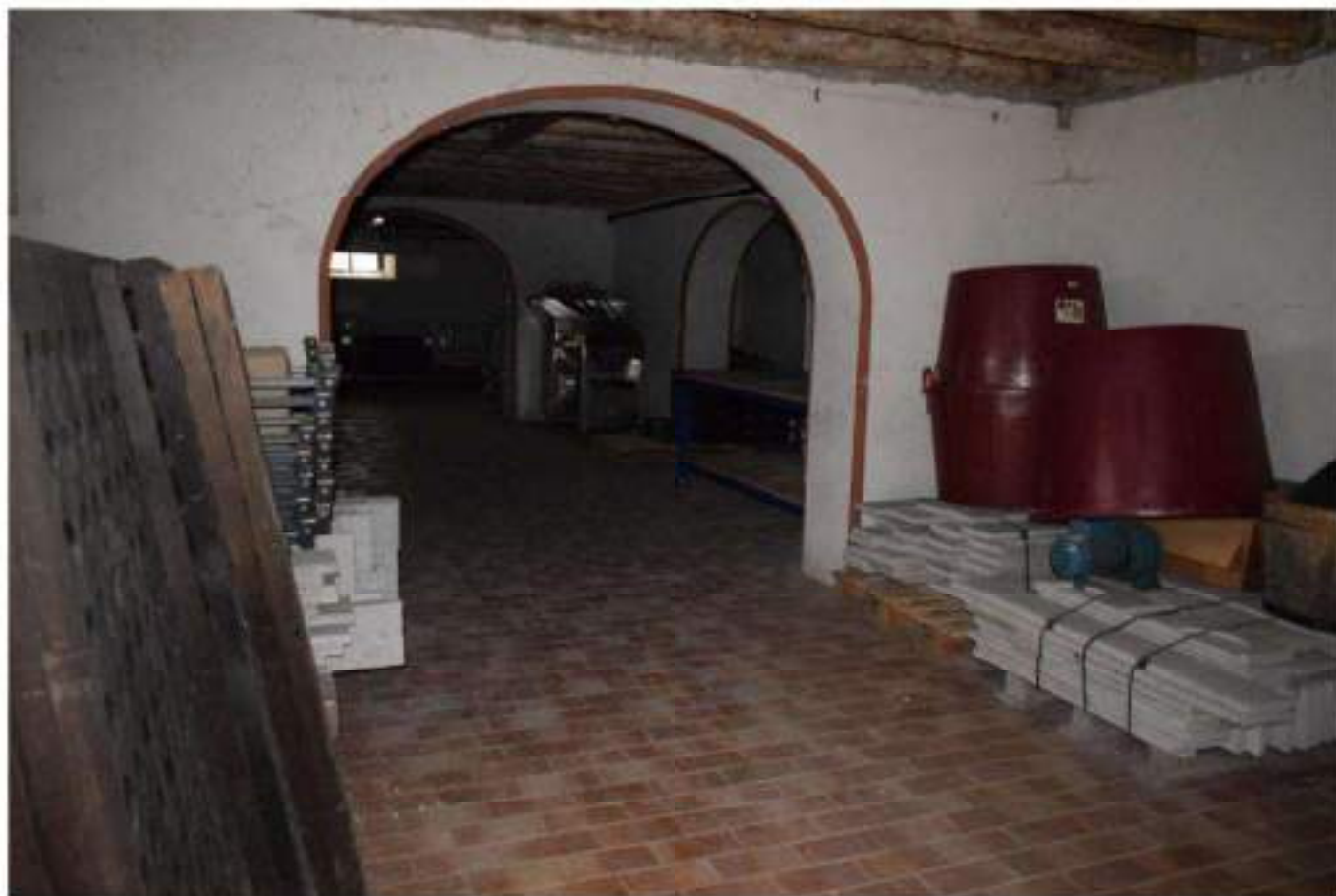
CANTINA - DEPOSITO