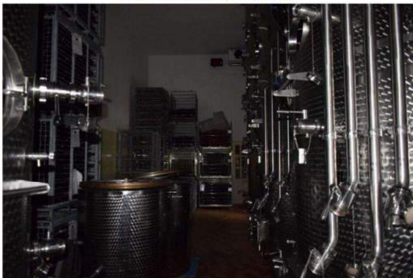
LAVORAZIONE E STOCCAGGIO VINO SFUSO