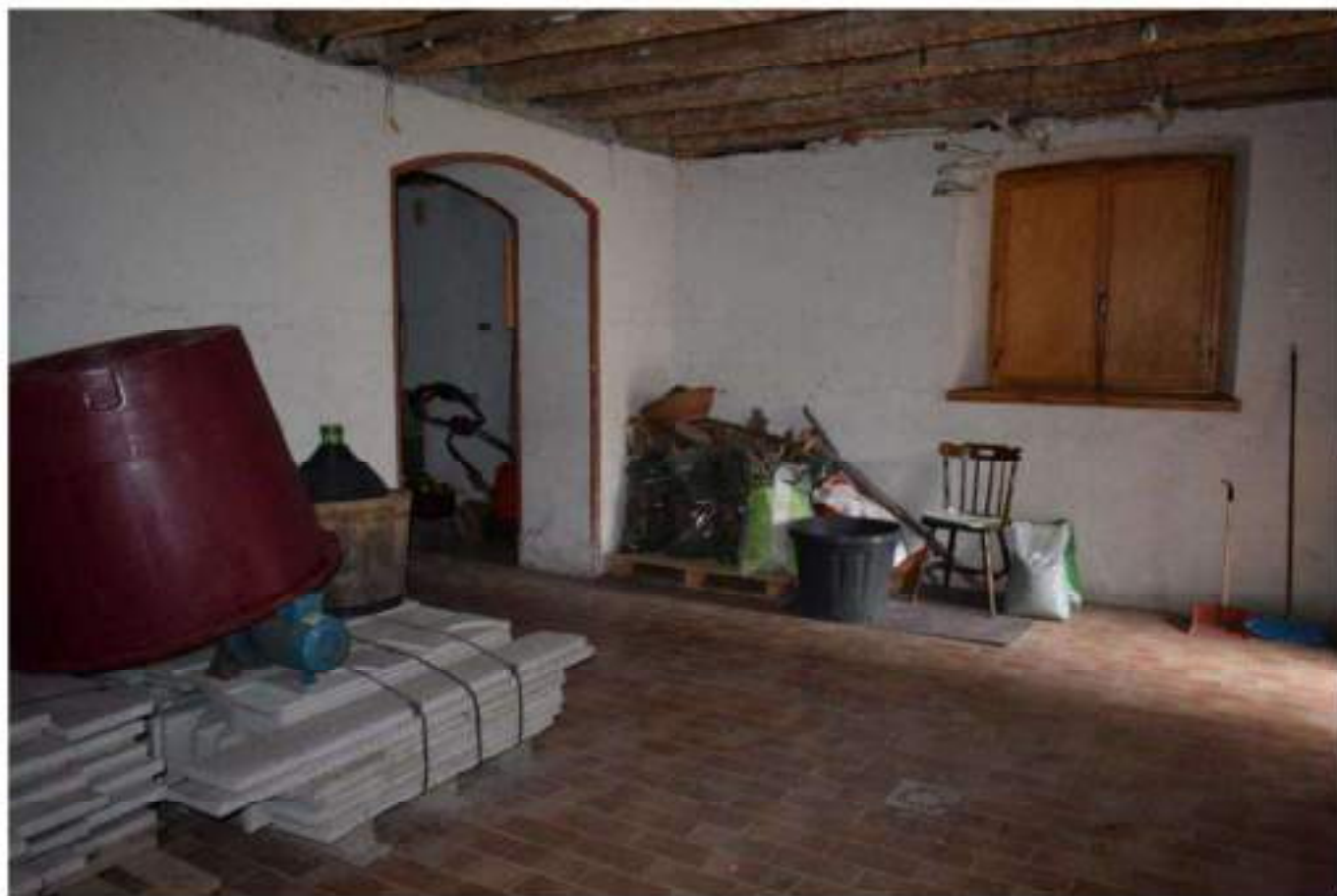
CANTINA - DEPOSITO