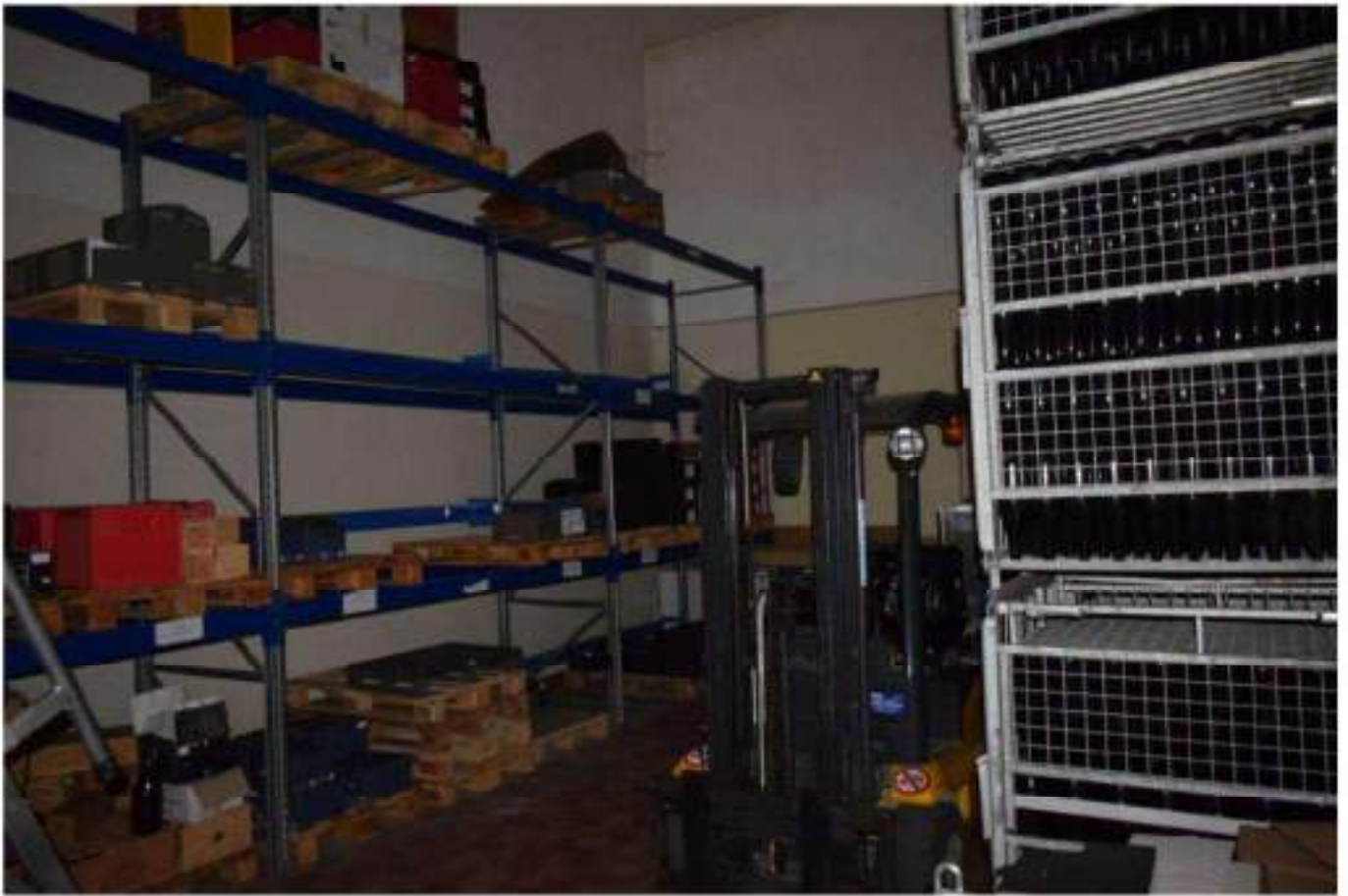
CONFEZIONAMENTO VINO E MAGAZZINO