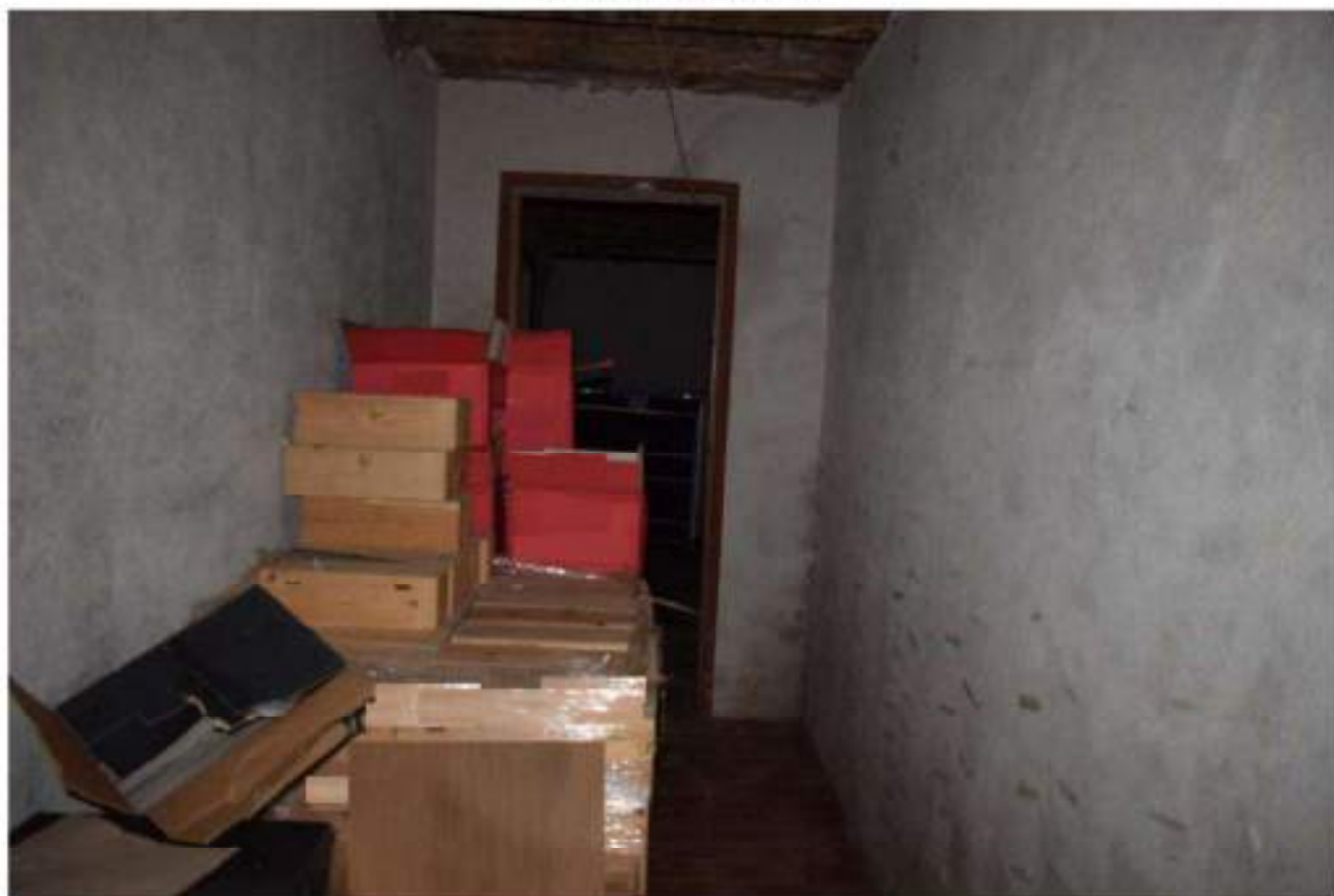
CANTINA - DEPOSITO