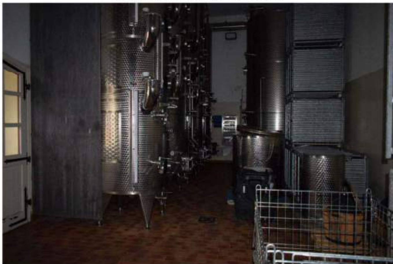
LAVORAZIONE E STOCCAGGIO VINO SFUSO