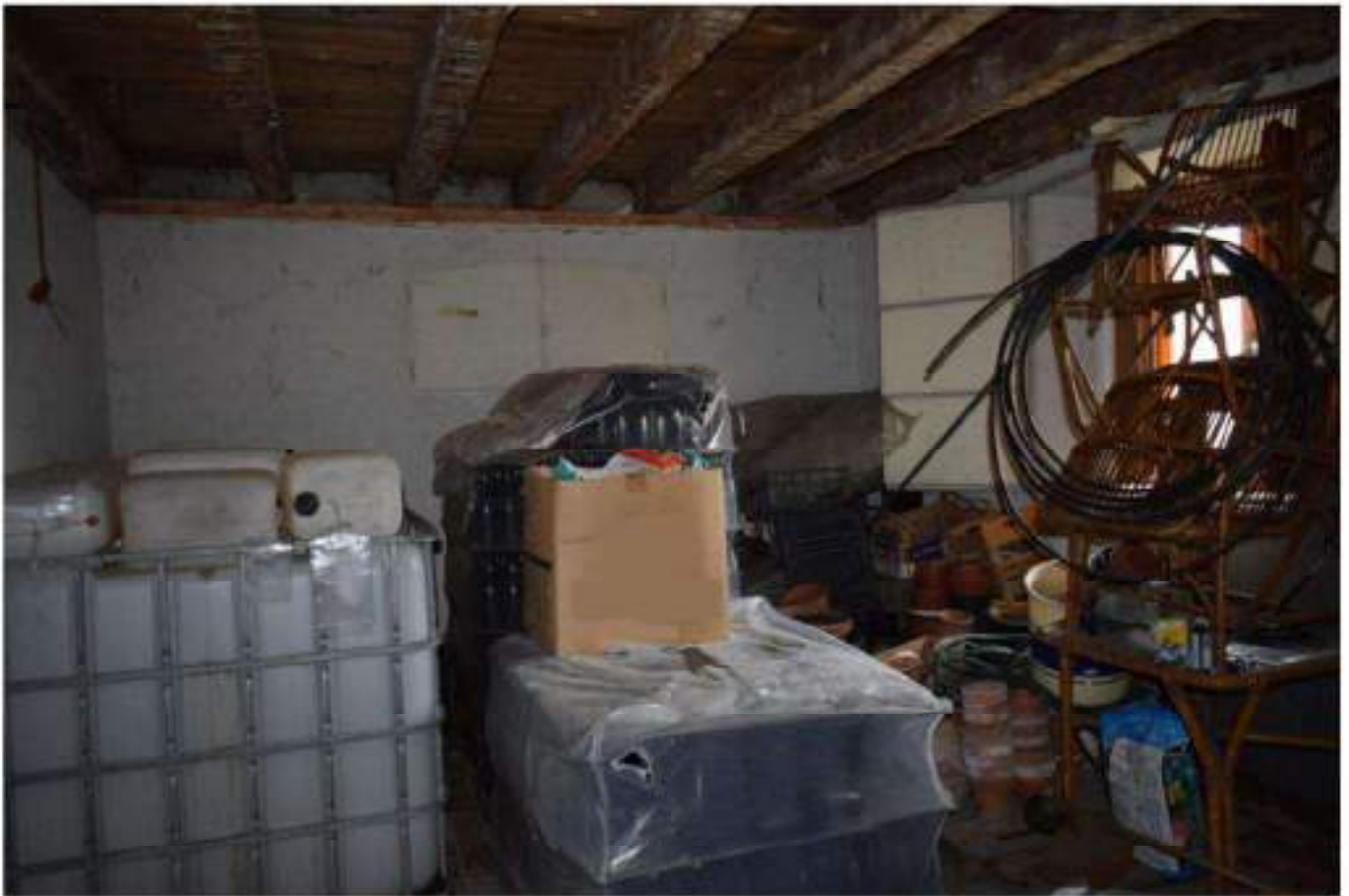
CANTINA - DEPOSITO