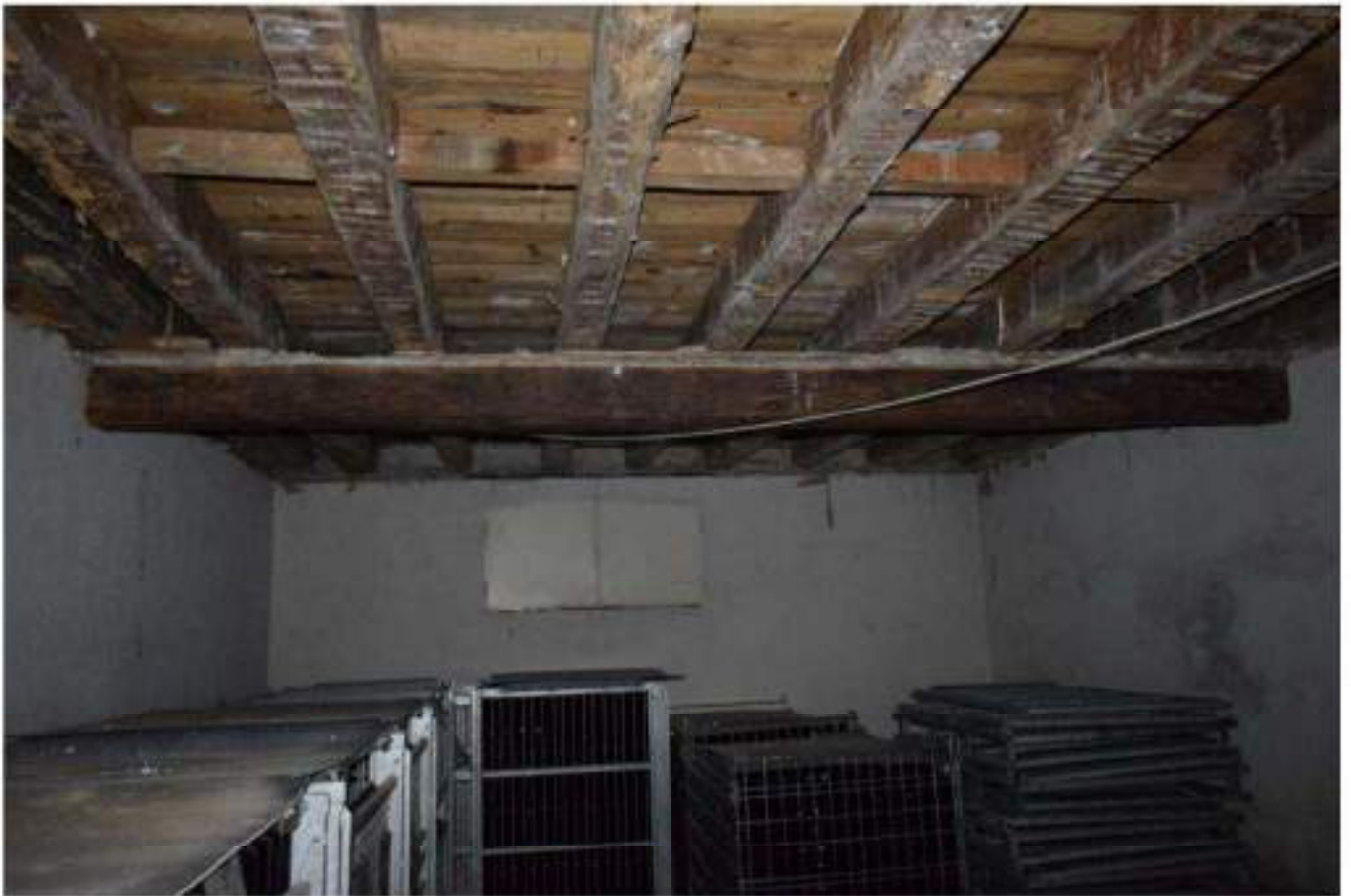
CANTINA - DEPOSITO