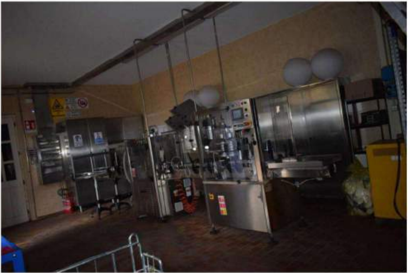
CONFEZIONAMENTO VINO E MAGAZZINO