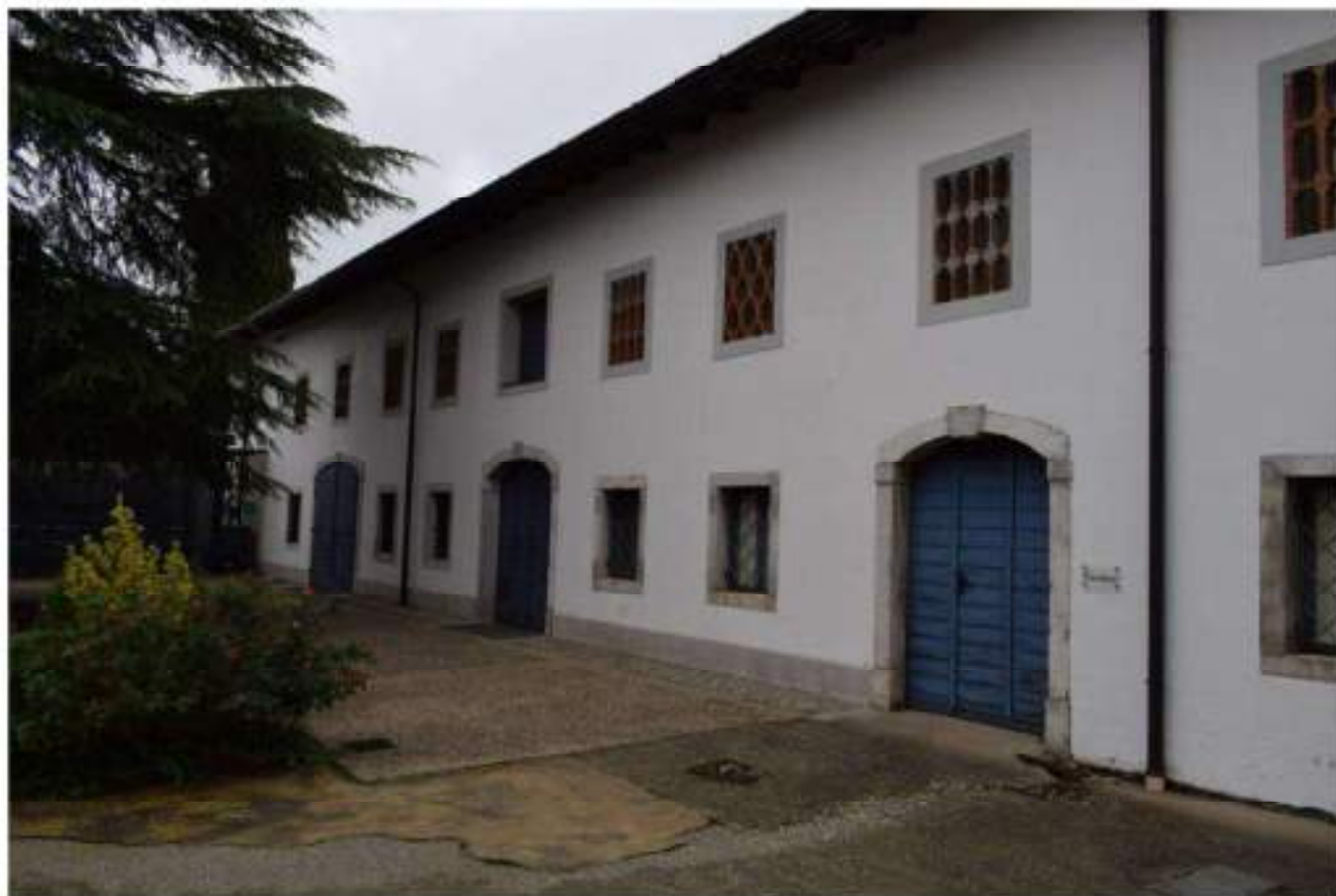
FABBRICATO S TRUMENTALE