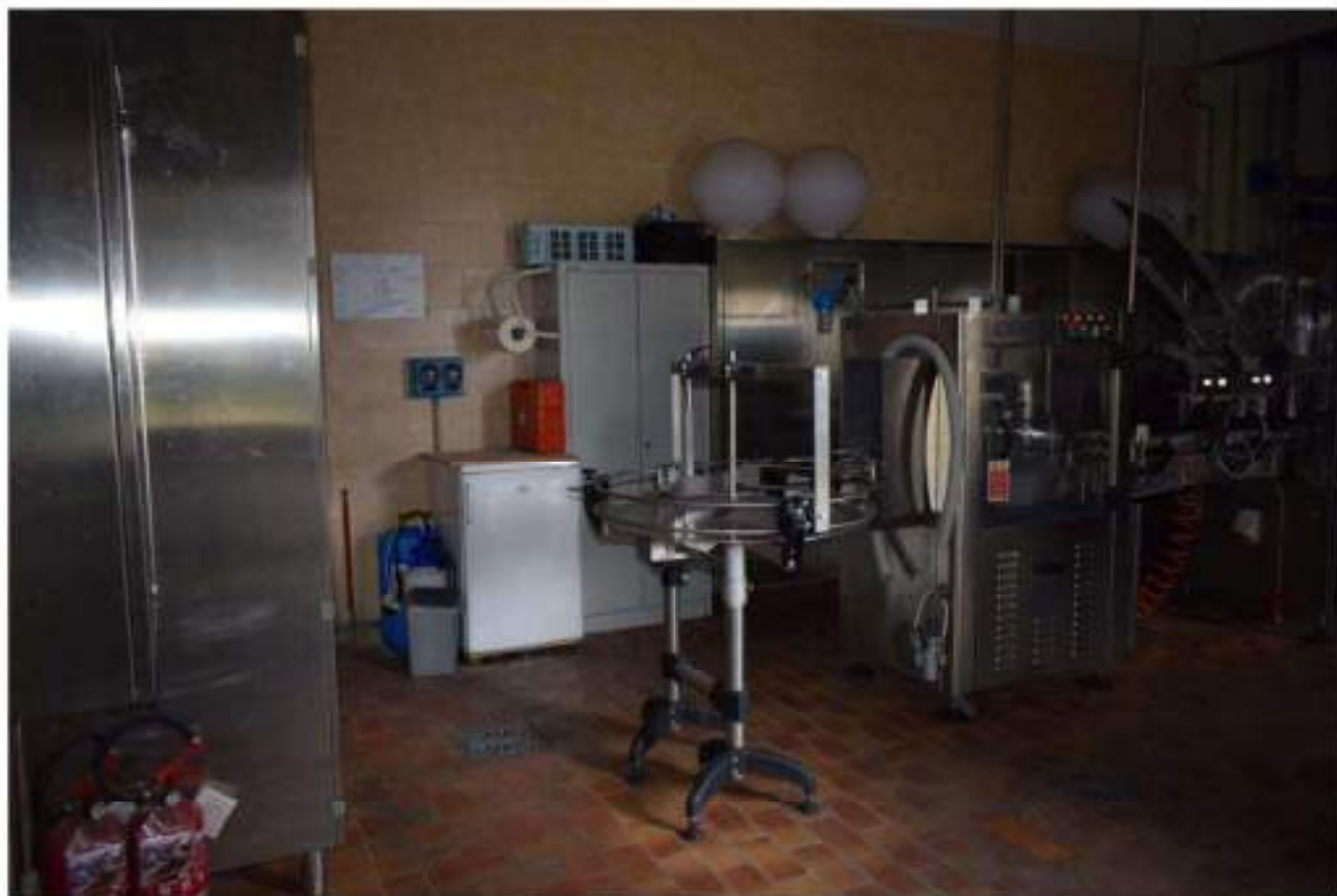
CONFEZIONAMENTO VINO E MAGAZZINO