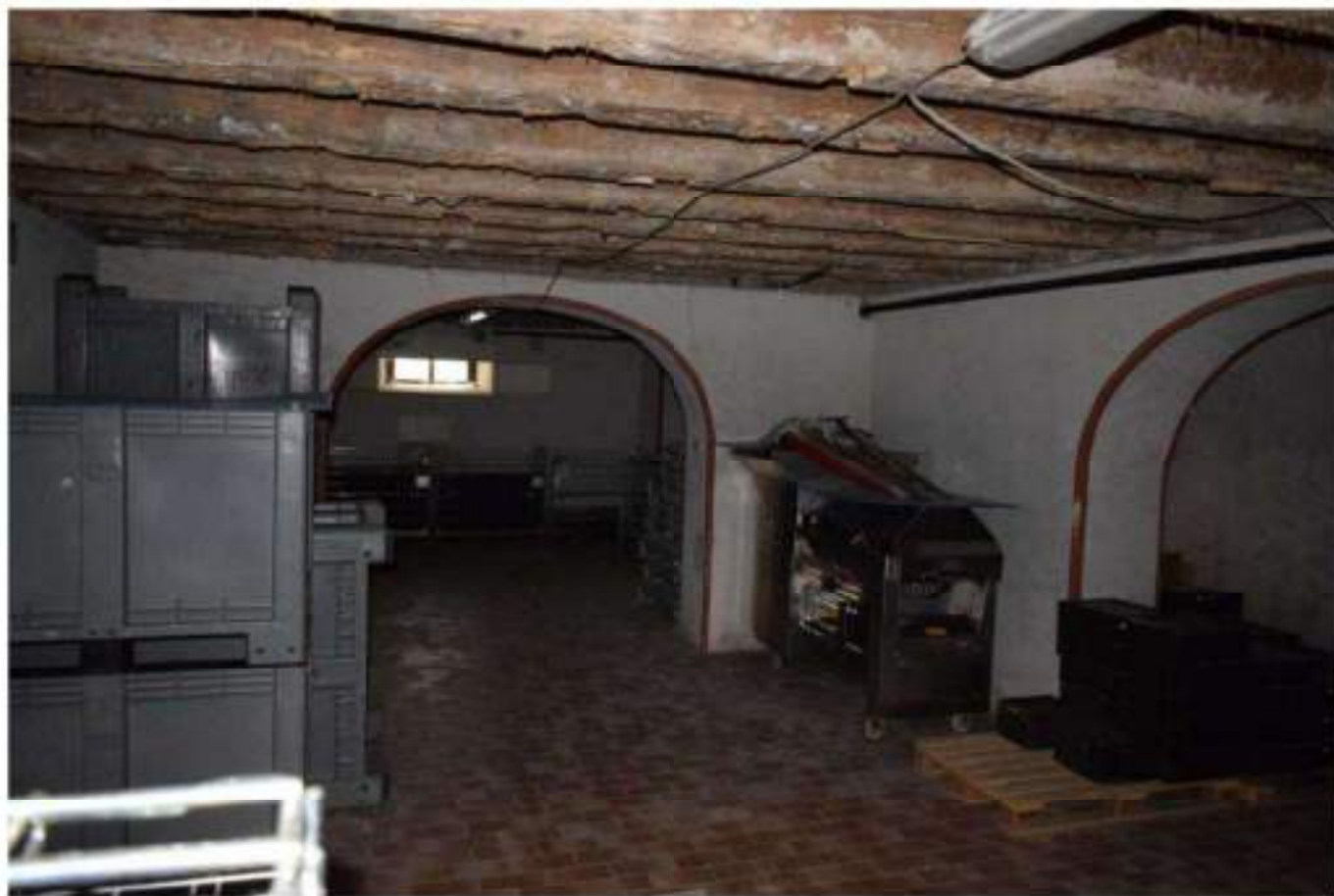
CANTINA - DEPOSITO