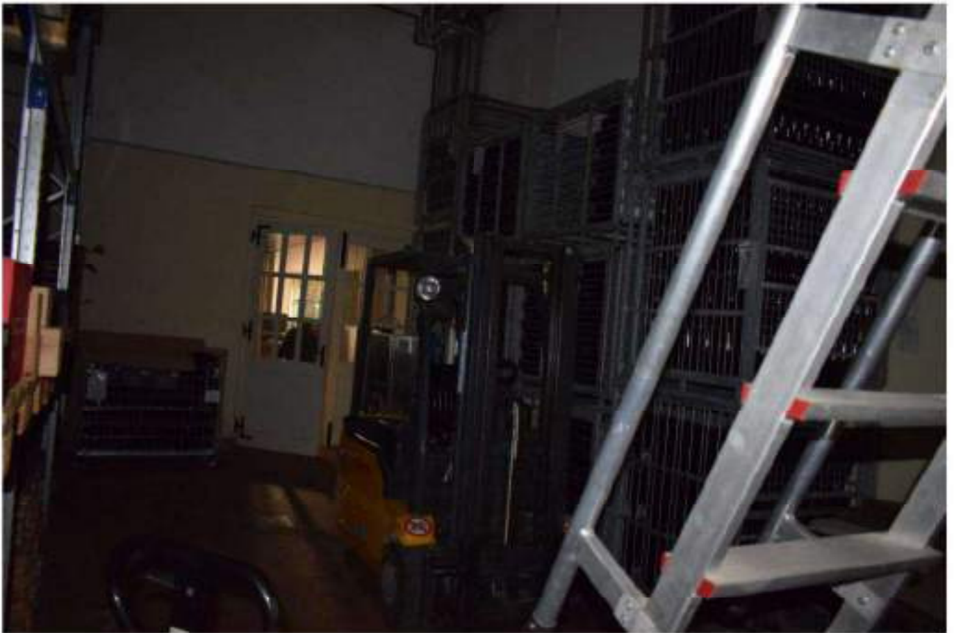
CONFEZIONAMENTO VINO E MAGAZZINO