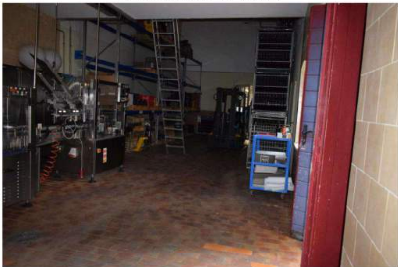
CONFEZIONAMENTO VINO E MAGAZZINO