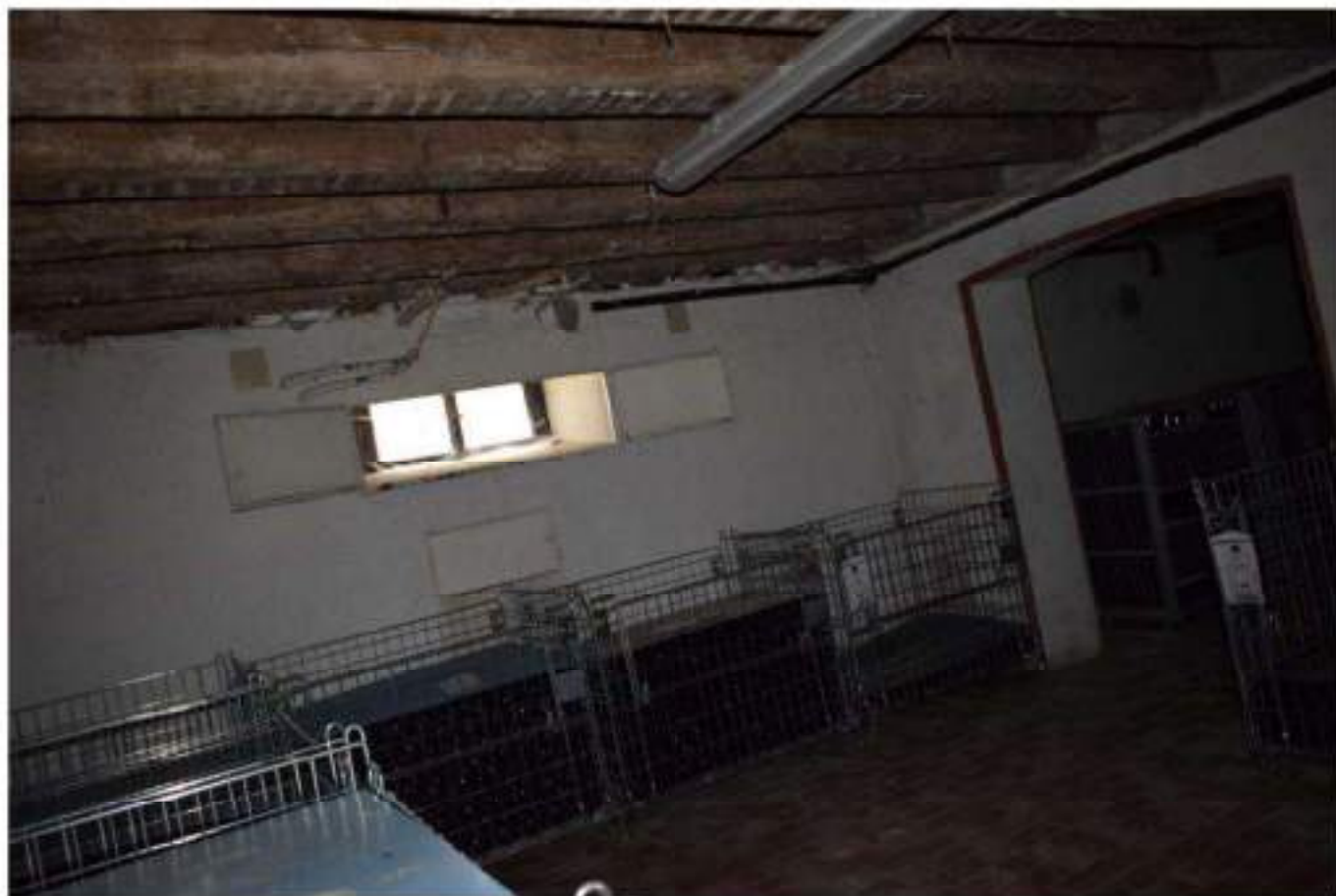
CANTINA - DEPOSITO