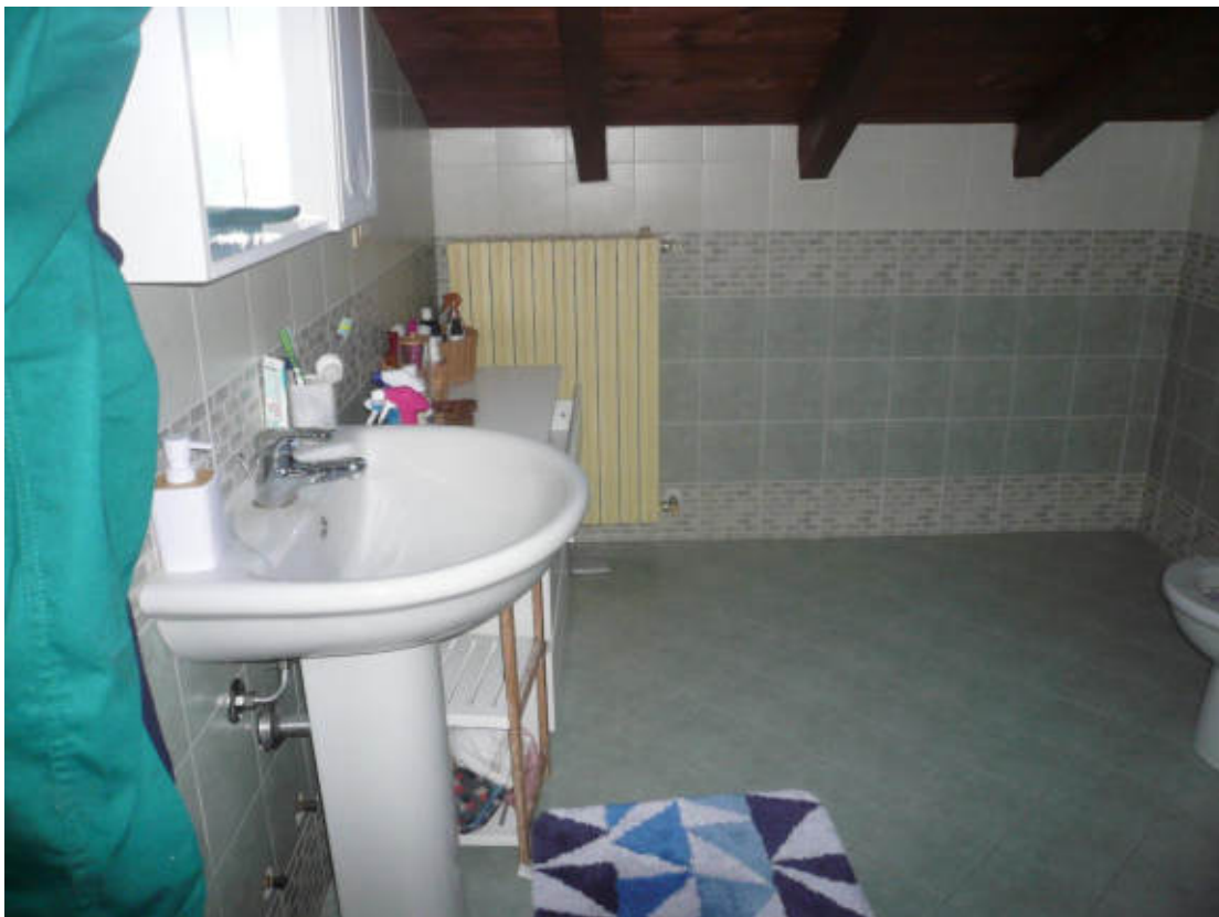
Figura 12 - Vista dei beni oggetto di vendita