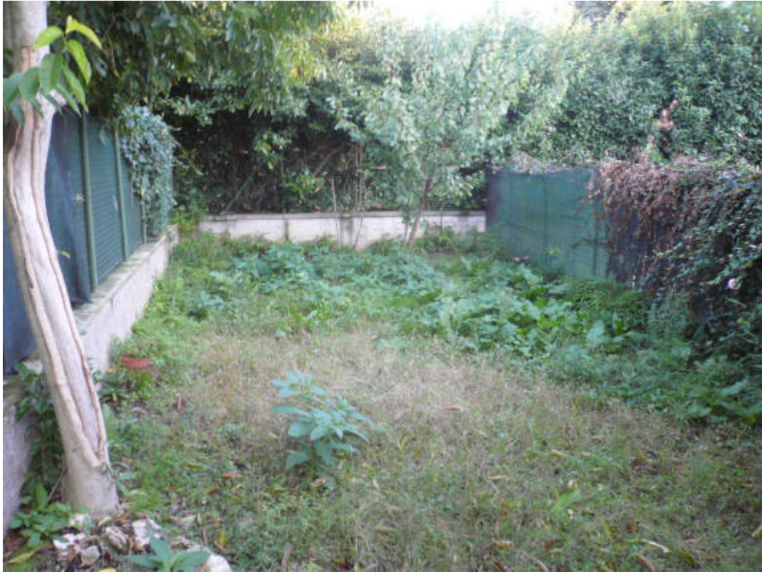
Figura 15 - Vista dei beni oggetto di vendita