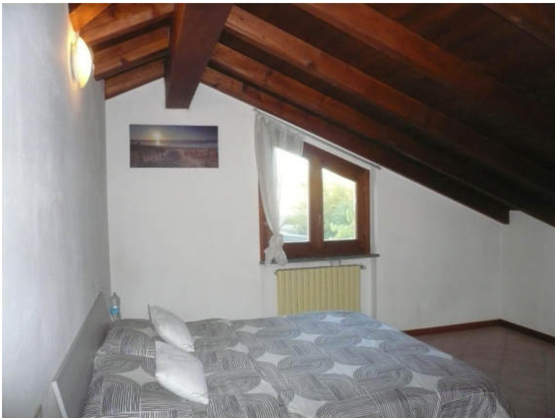
Figura 14 - Vista dei beni oggetto di vendita