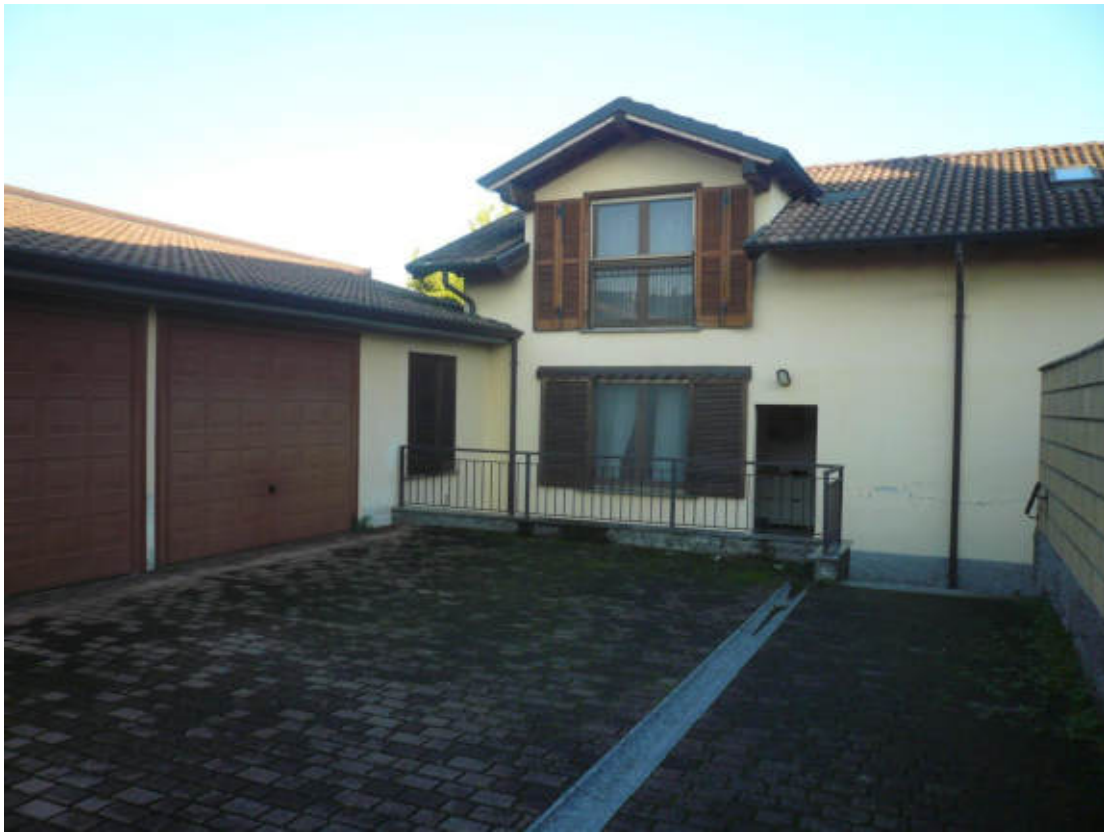
Figura 3 - Vista dei beni oggetto di vendita