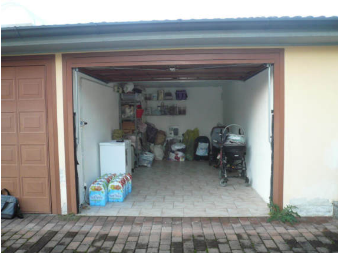
Figura 16 - Vista dei beni oggetto di vendita