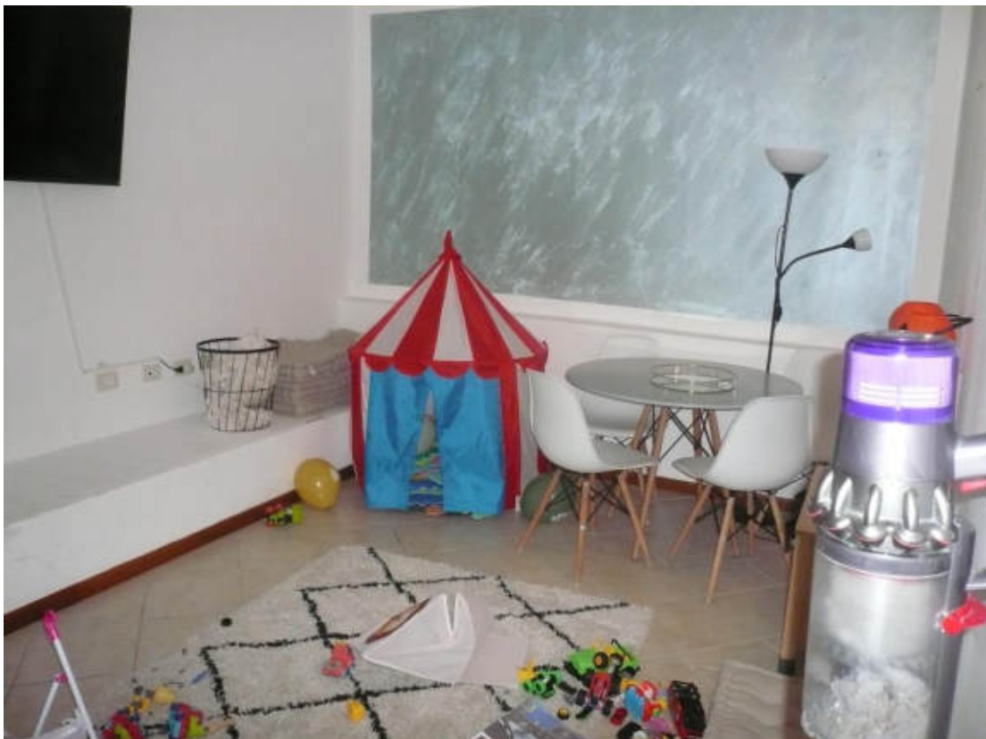
Figura 8 - Vista dei beni oggetto di vendita