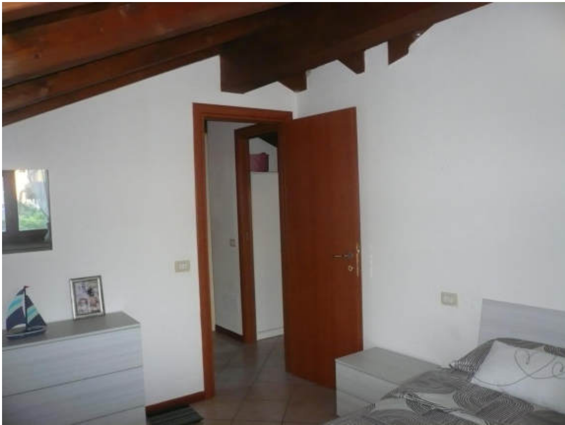
Figura 13 - Vista dei beni oggetto di vendita