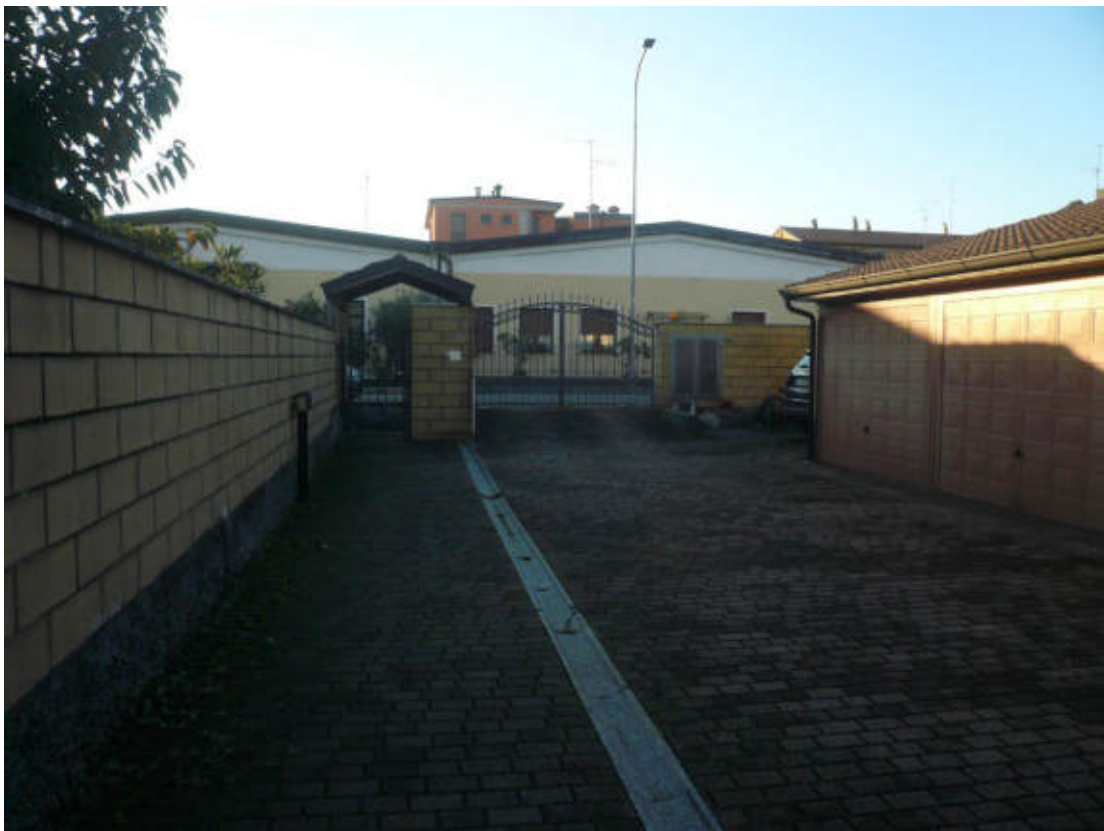
Figura 4 - Vista dei beni oggetto di vendita