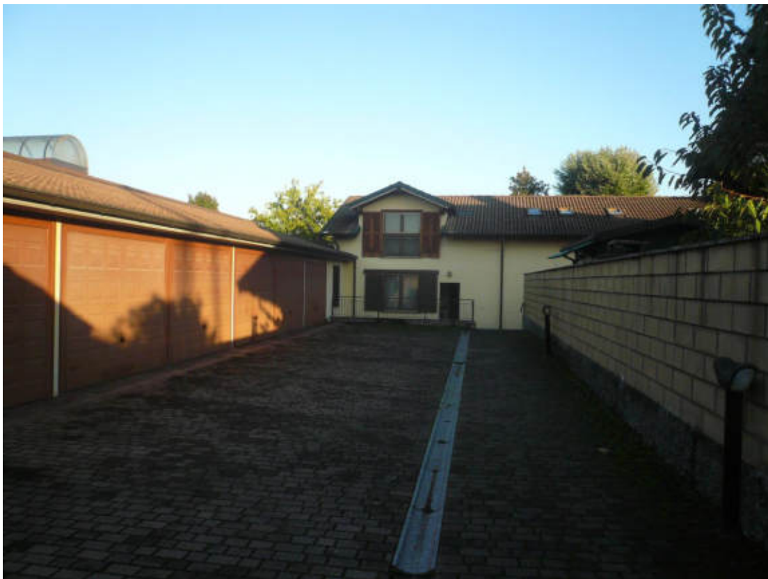
Figura 2 - Vista dei beni oggetto di vendita