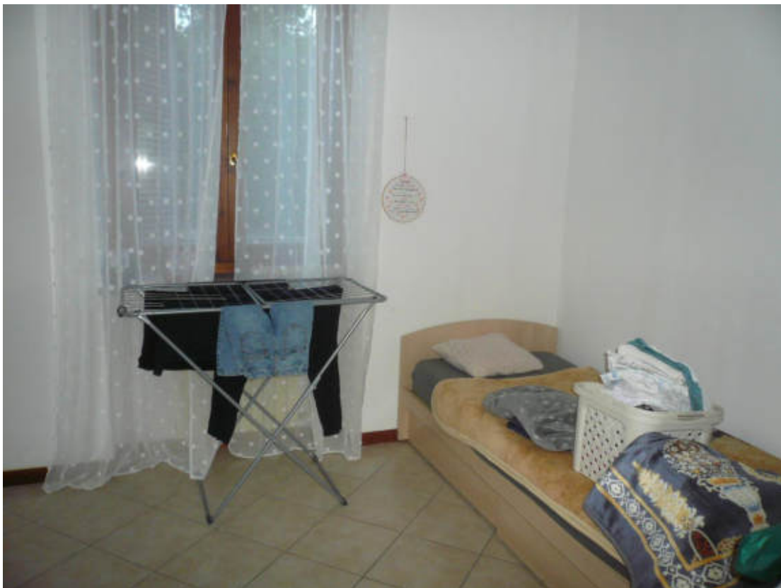
Figura 10 - Vista dei beni oggetto di vendita