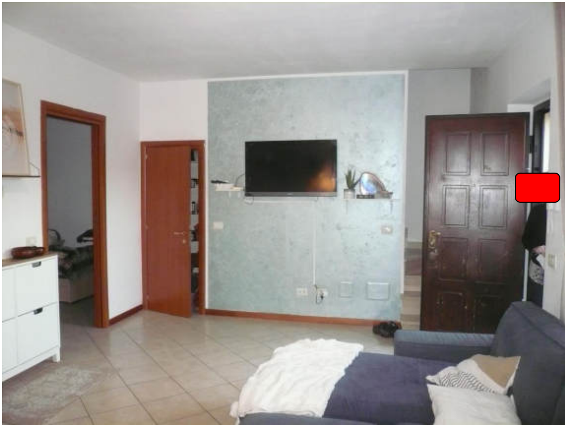
Figura 5 - Vista dei beni oggetto di vendita