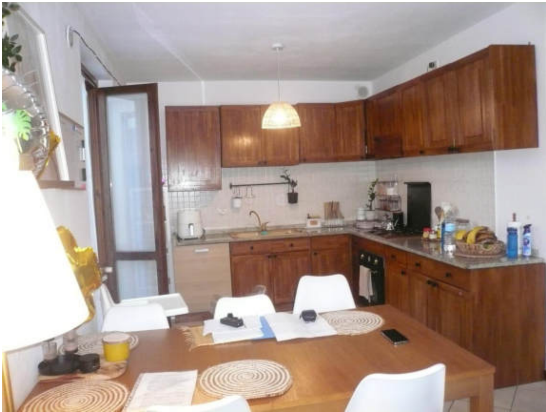
Figura 7 - Vista dei beni oggetto di vendita