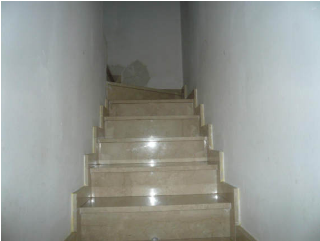
Figura 11 - Vista dei beni oggetto di vendita