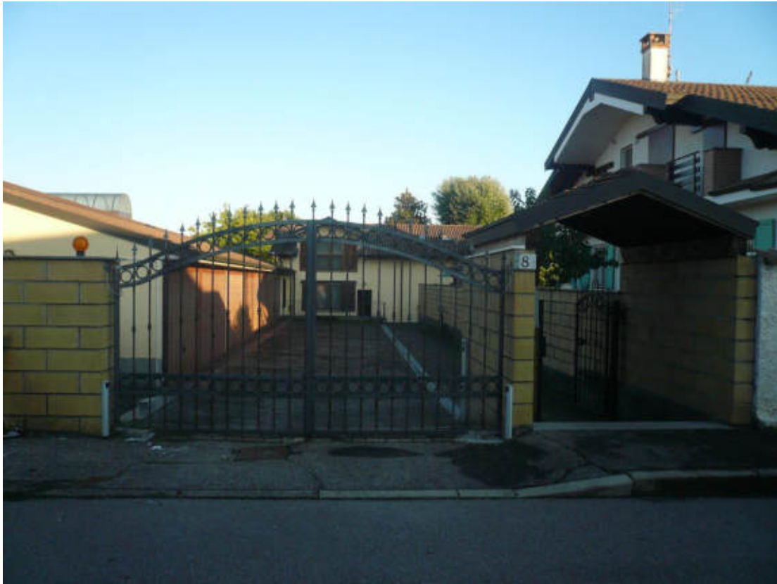
Figura 1 - Vista dei beni oggetto di vendita