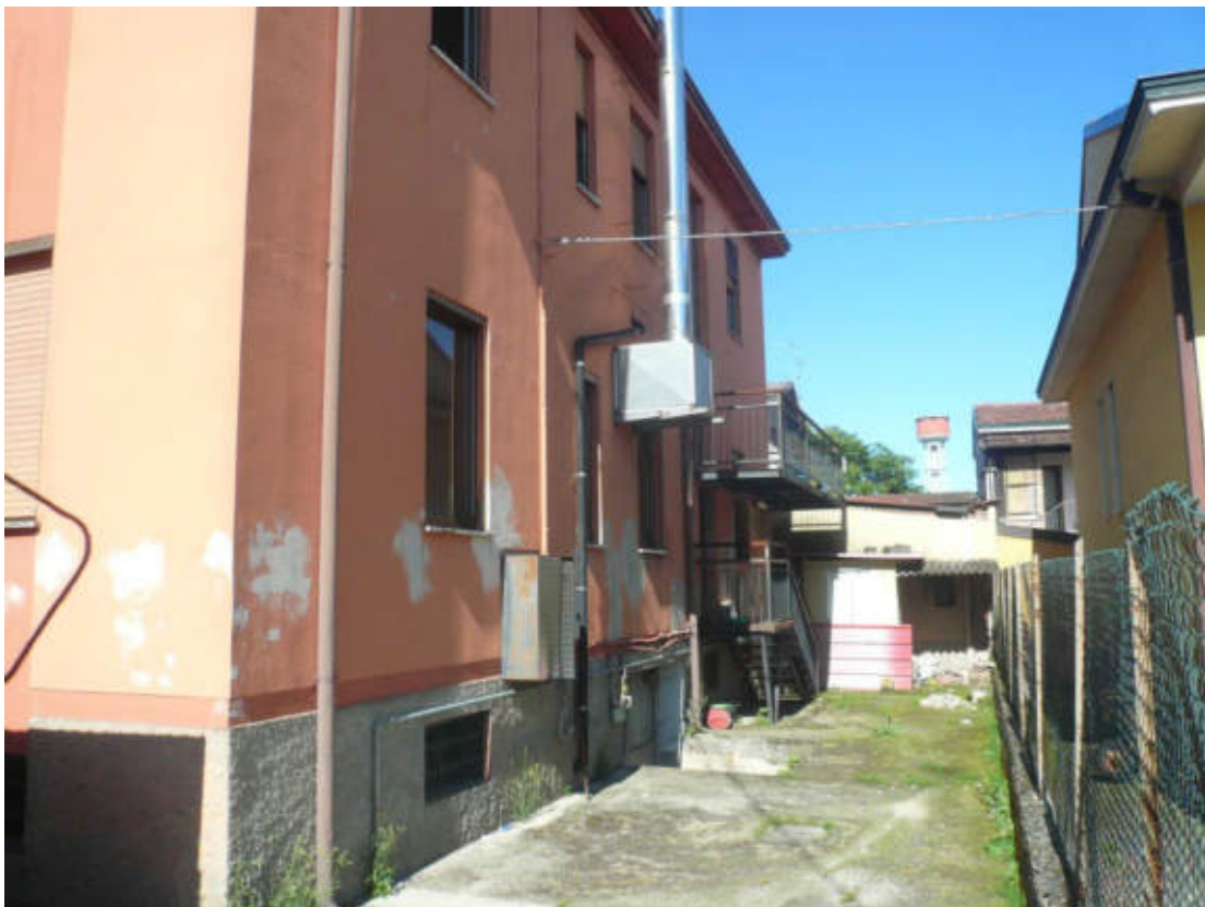
Figura 6 - Vista dei beni oggetto di vendita