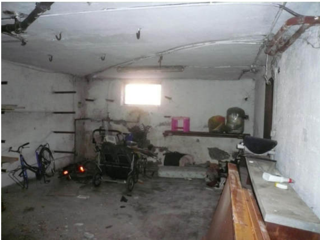
Figura 34 - Vista dei beni oggetto di vendita