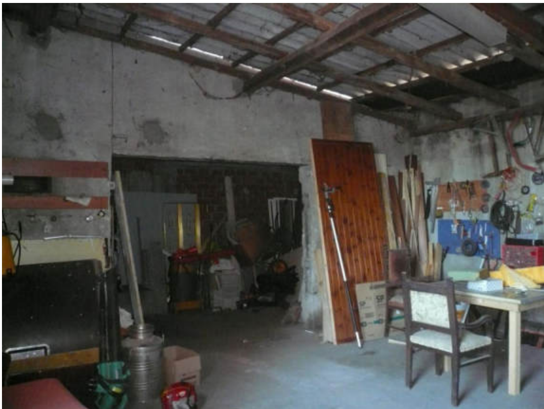
Figura 16 - Vista dei beni oggetto di vendita