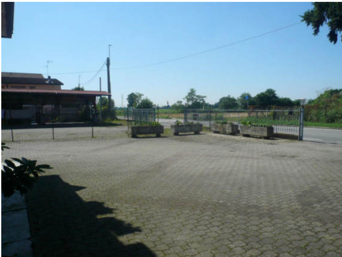
Figura 12 - Vista dei beni oggetto di vendita