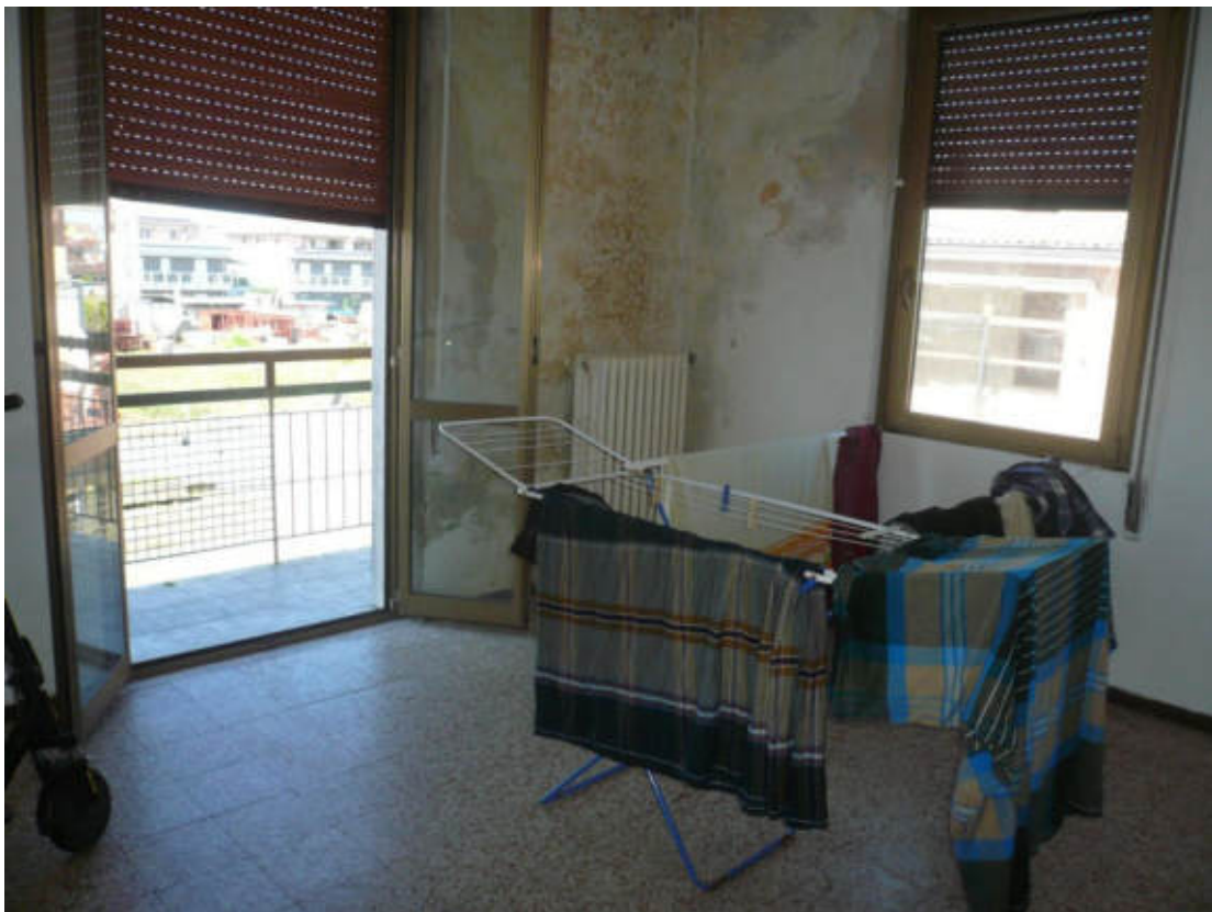
Figura 24 - Vista dei beni oggetto di vendita