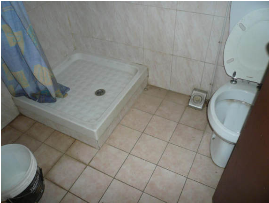
Figura 31 - Vista dei beni oggetto di vendita