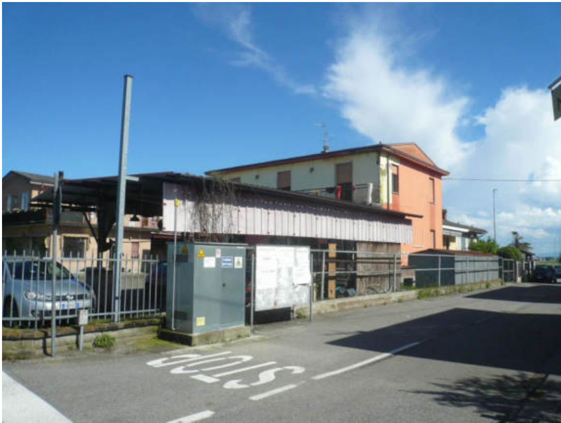
Figura 3 - Vista dei beni oggetto di vendita