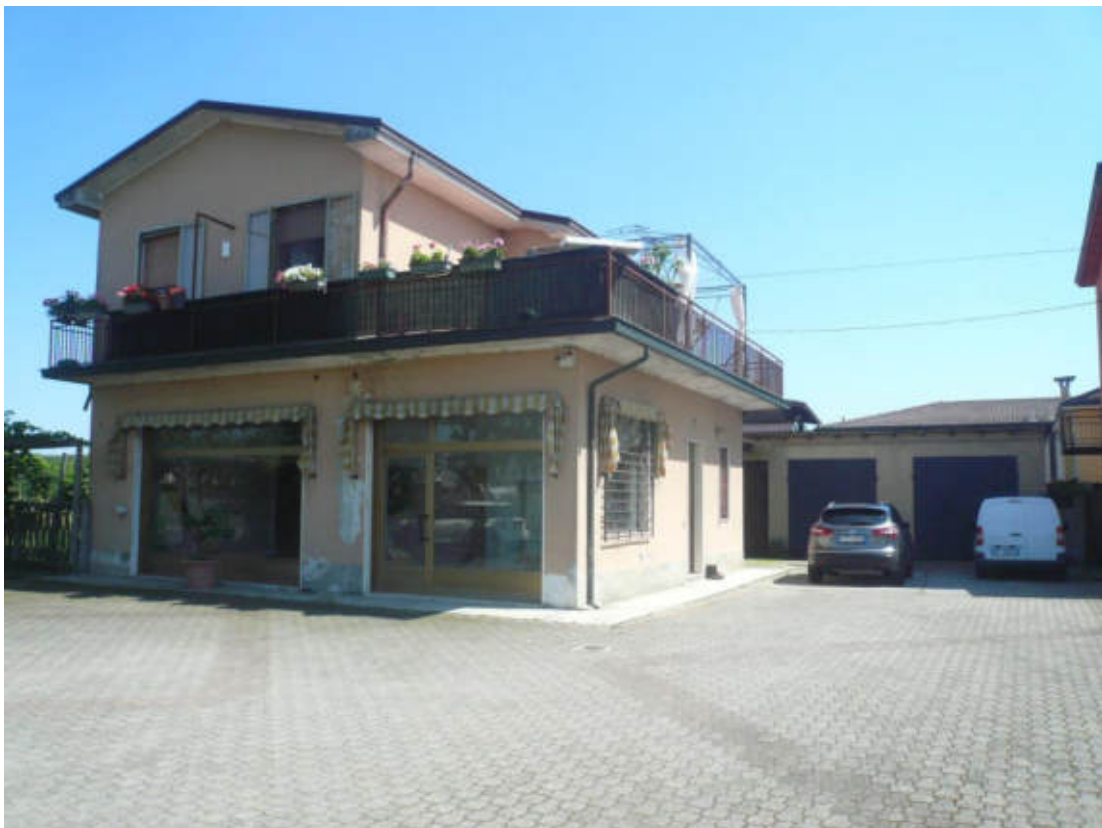
Figura 8 - Vista dei beni oggetto di vendita