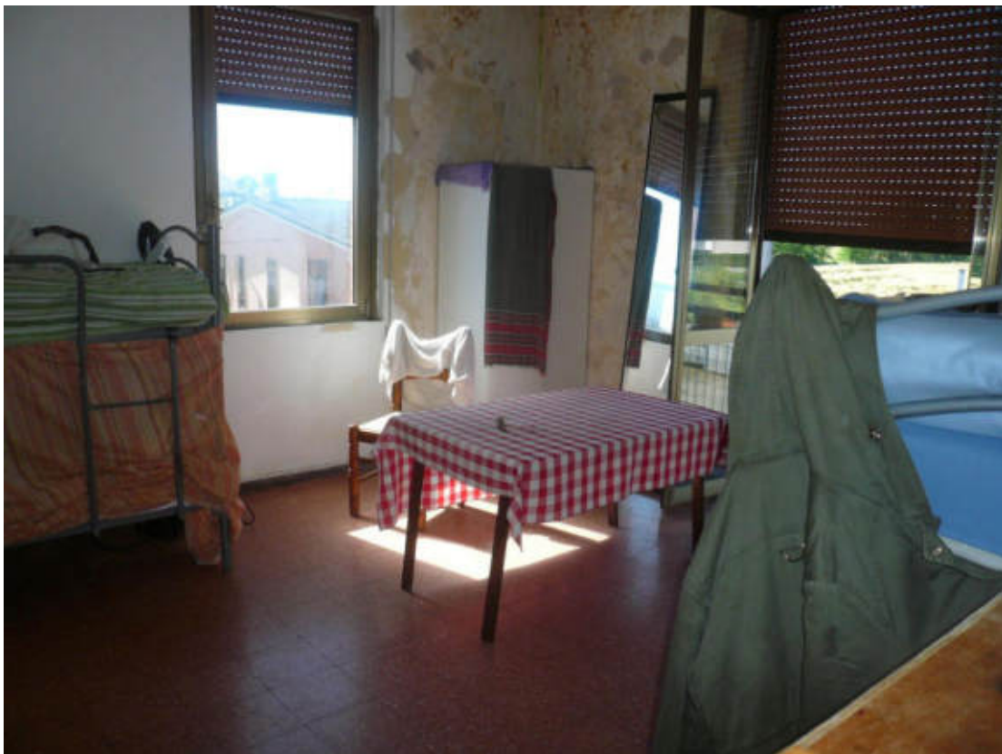
Figura 26 - Vista dei beni oggetto di vendita