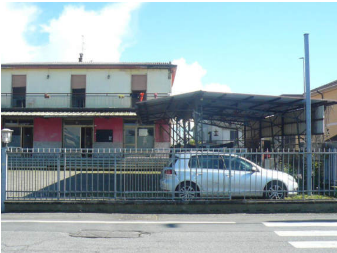
Figura 2 - Vista dei beni oggetto di vendita