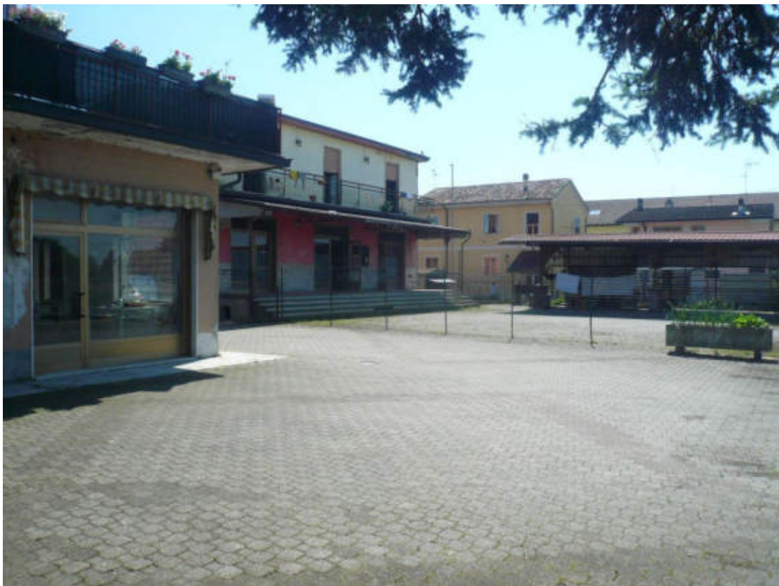
Figura 10 - Vista dei beni oggetto di vendita