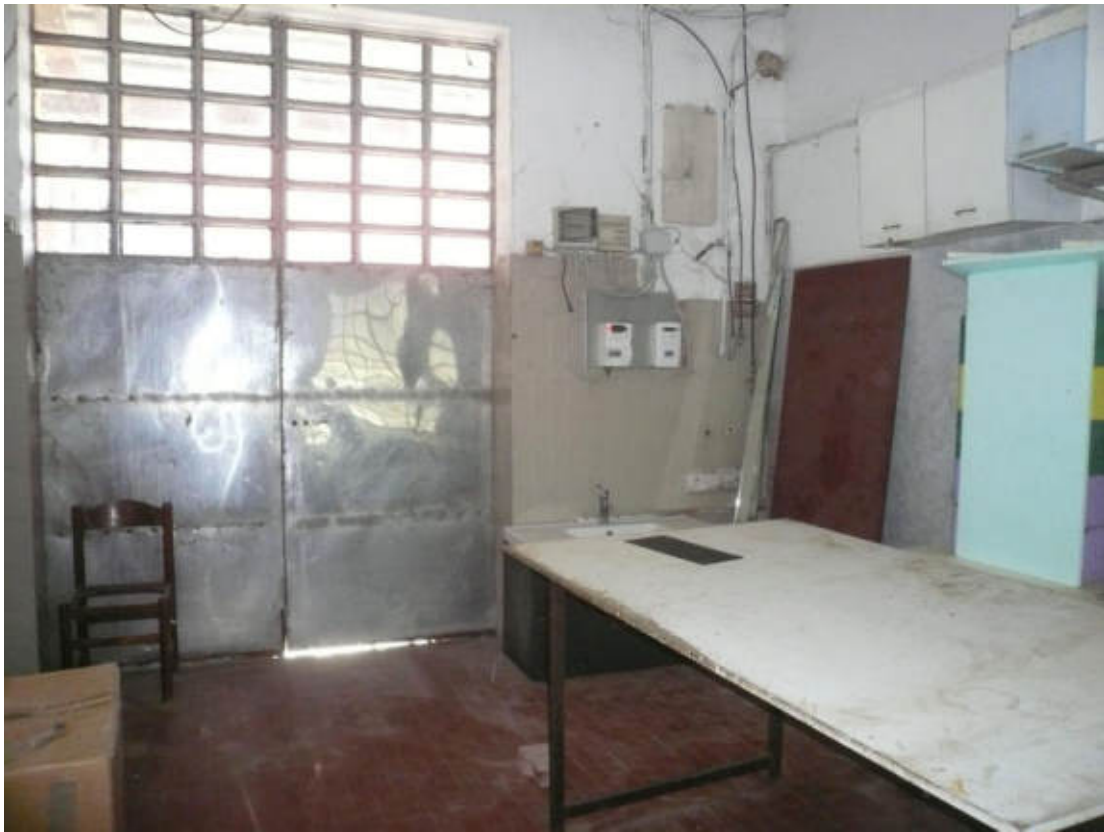
Figura 17 - Vista dei beni oggetto di vendita