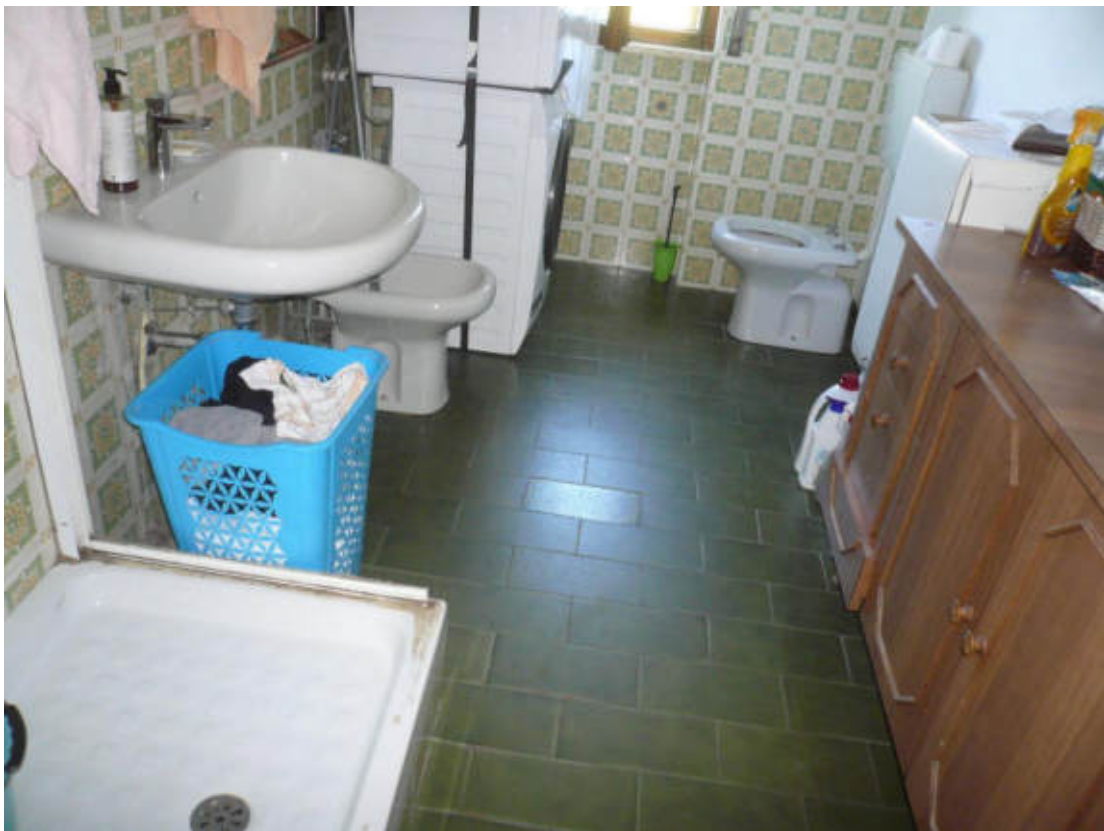
Figura 22 - Vista dei beni oggetto di vendita