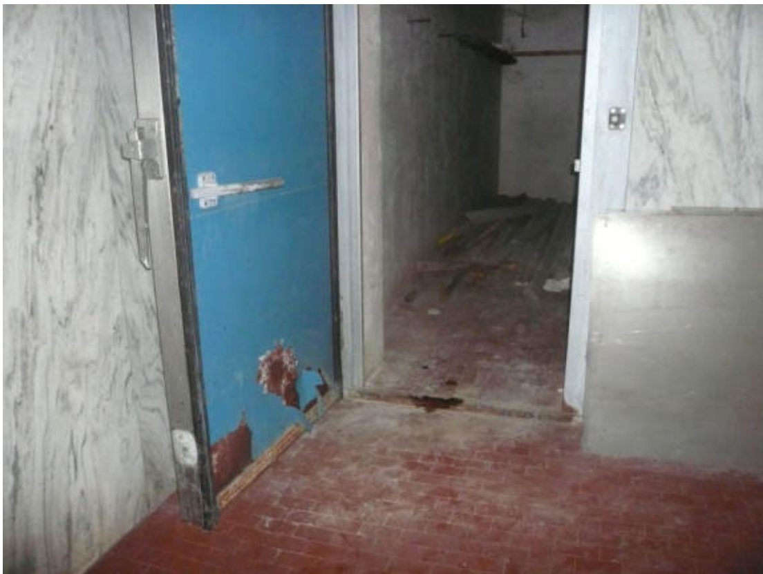
Figura 18 - Vista dei beni oggetto di vendita