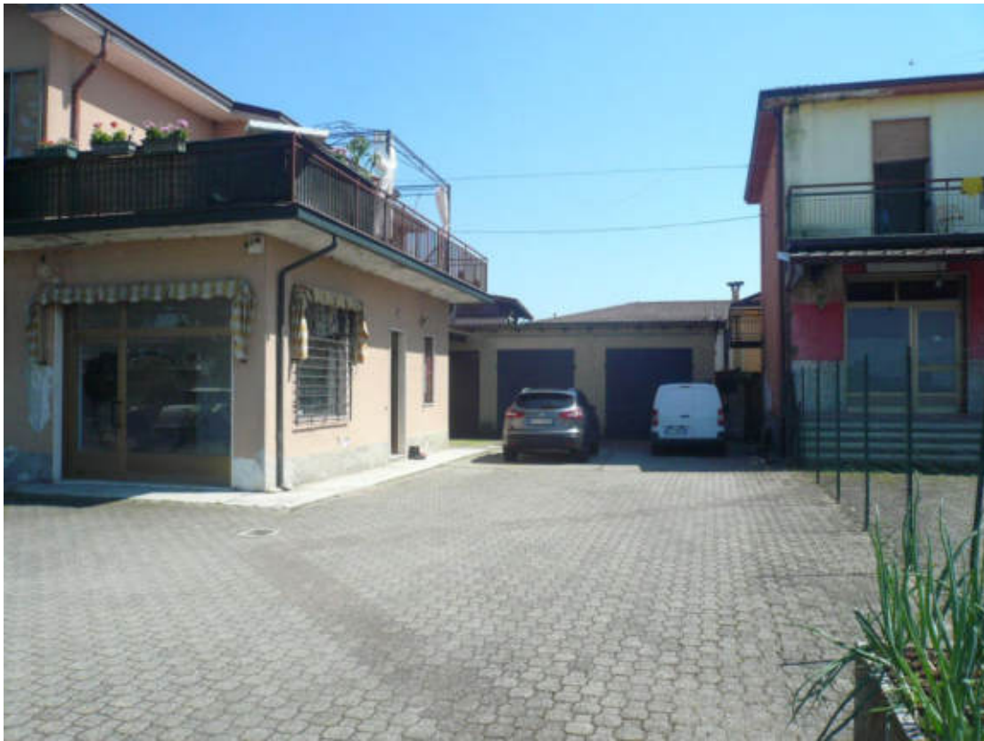
Figura 9 - Vista dei beni oggetto di vendita