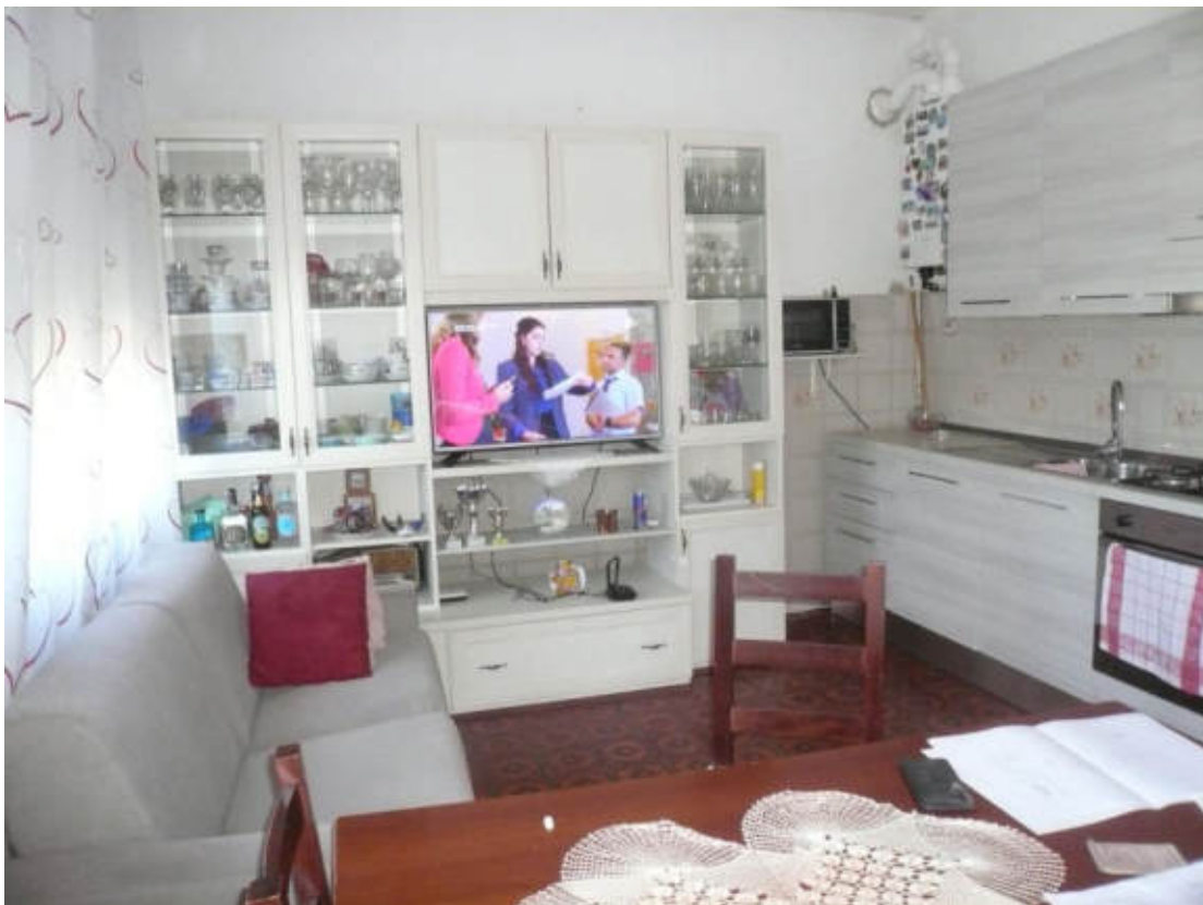
Figura 20 - Vista dei beni oggetto di vendita