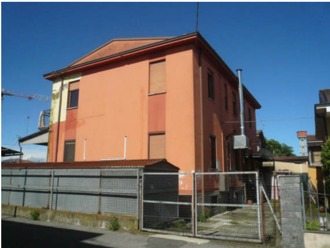
Figura 4 - Vista dei beni oggetto di vendita