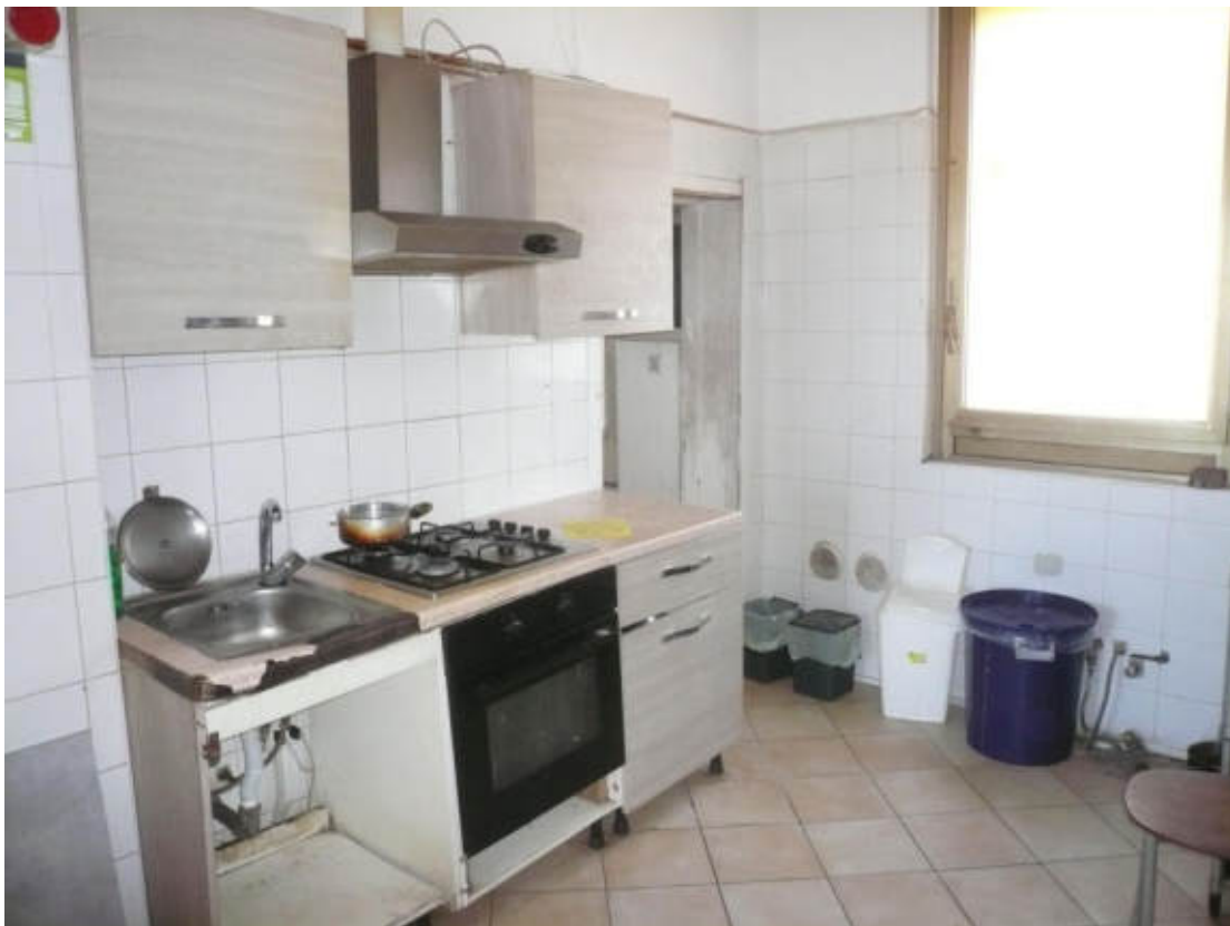
Figura 30 - Vista dei beni oggetto di vendita