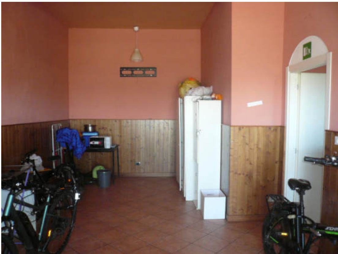
Figura 32 - Vista dei beni oggetto di vendita