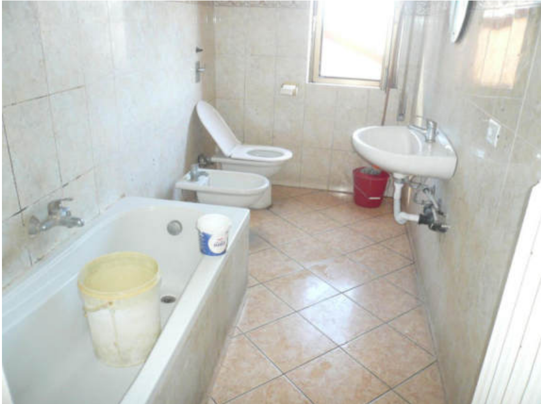
Figura 28 - Vista dei beni oggetto di vendita