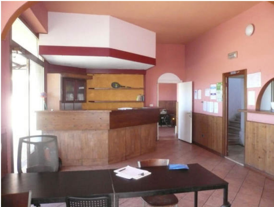
Figura 33 - Vista dei beni oggetto di vendita