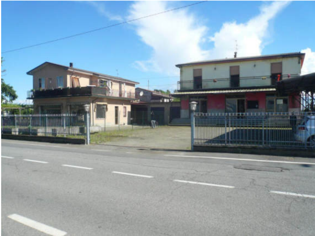
Figura 1 - Vista dei beni oggetto di vendita