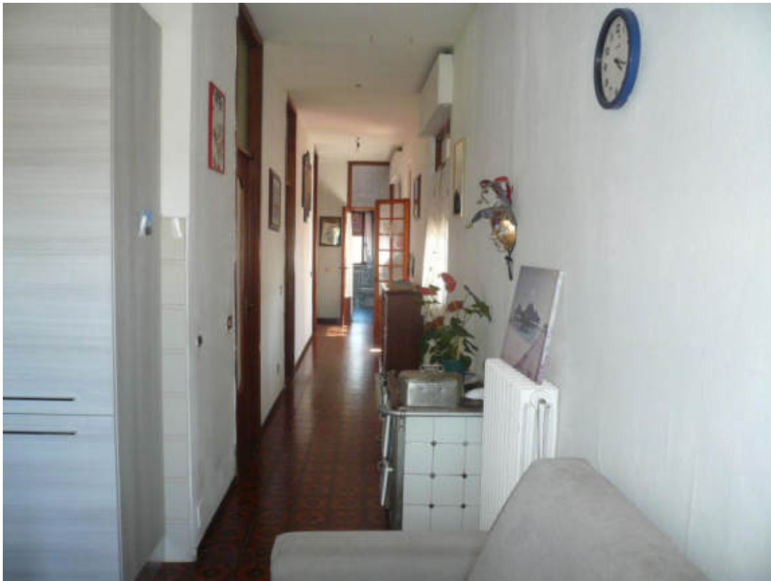
Figura 19 - Vista dei beni oggetto di vendita