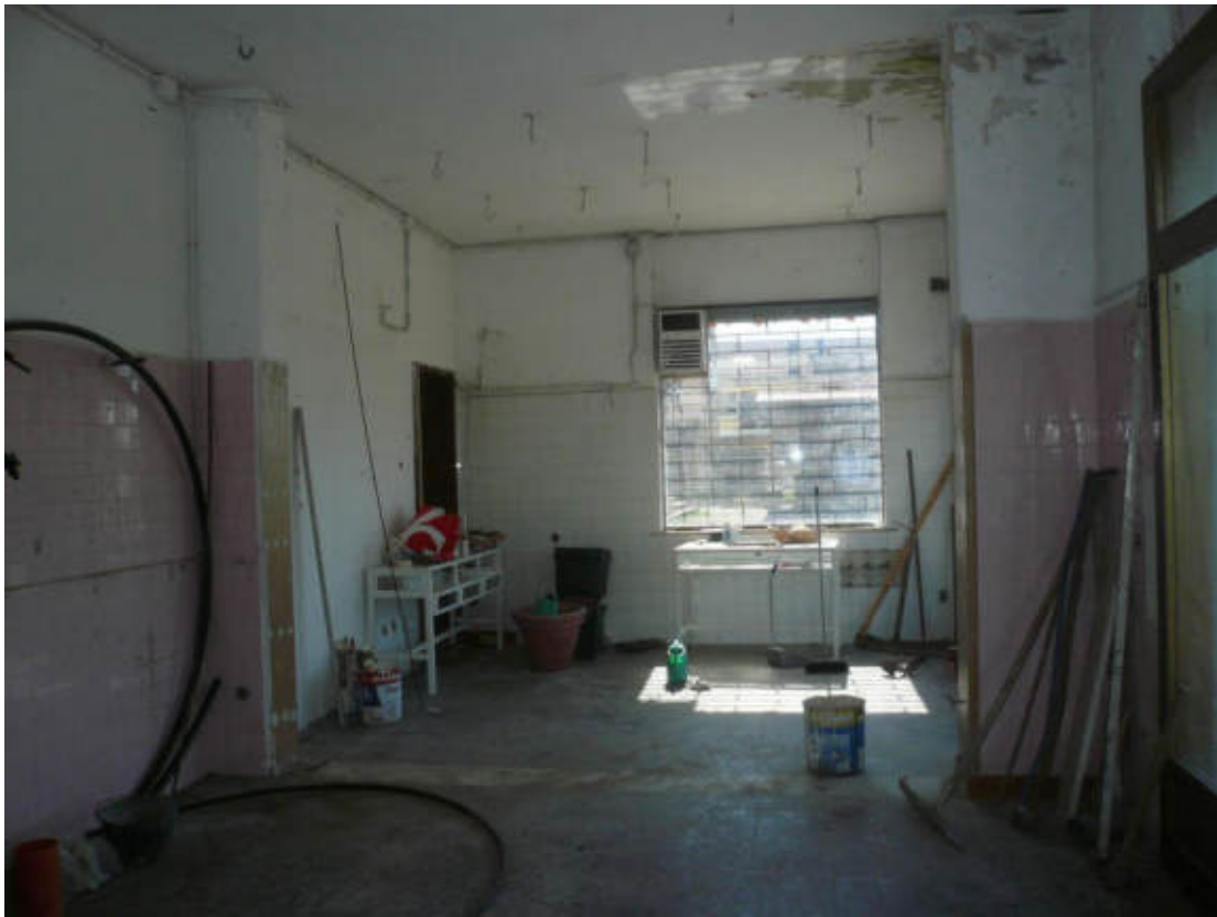
Figura 13 - Vista dei beni oggetto di vendita