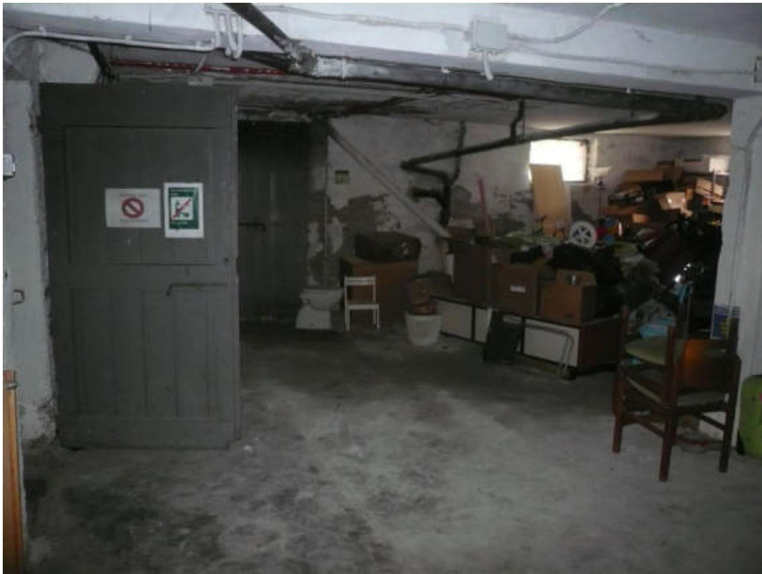
Figura 35 - Vista dei beni oggetto di vendita