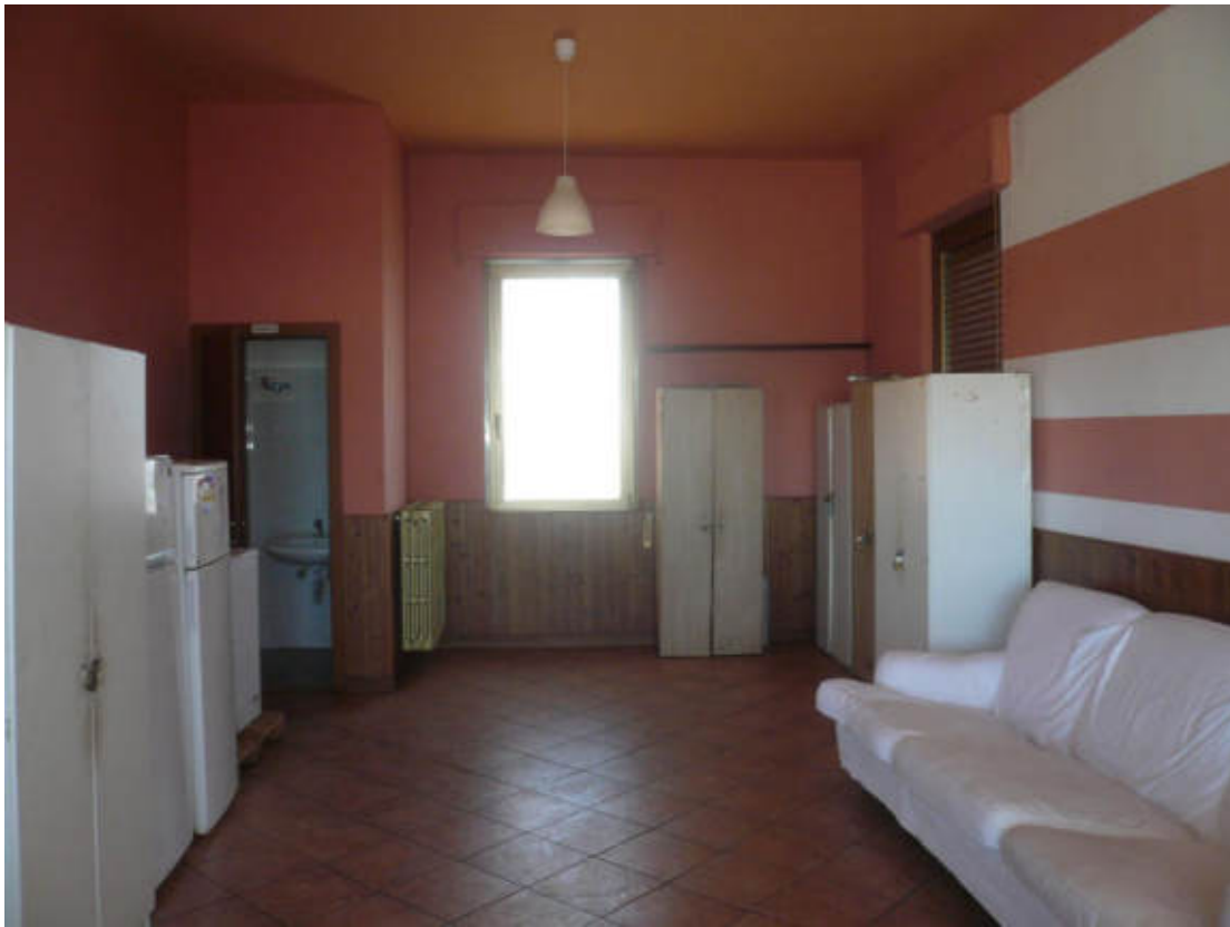
Figura 29 - Vista dei beni oggetto di vendita