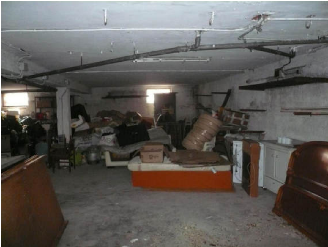
Figura 36 - Vista dei beni oggetto di vendita