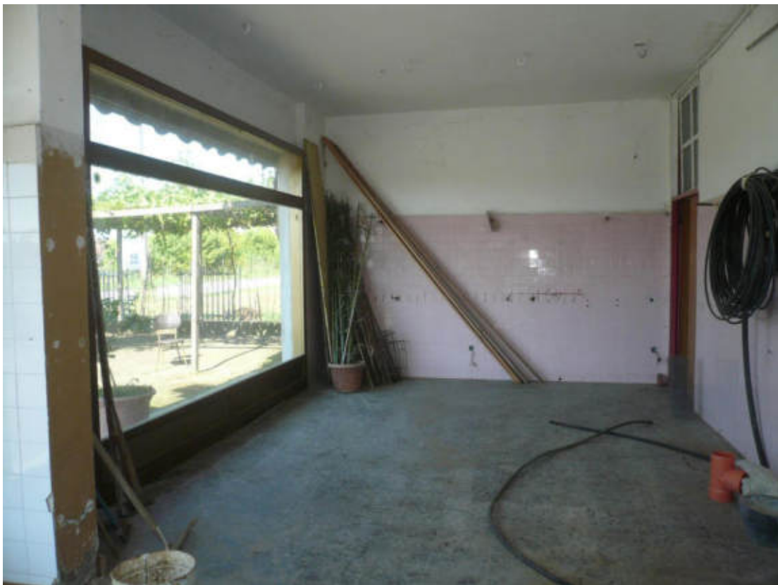
Figura 14 - Vista dei beni oggetto di vendita