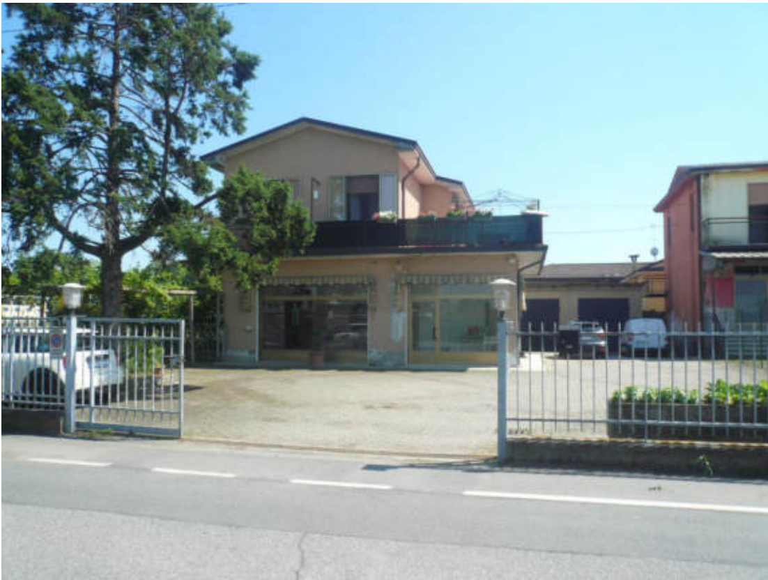
Figura 7 - Vista dei beni oggetto di vendita