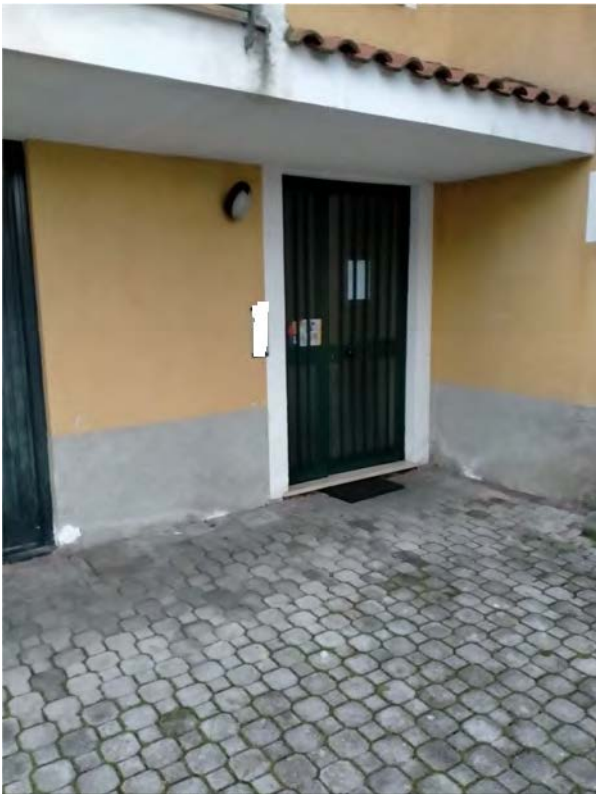
FOTO 36- ACCESSO CONDOMINIALE