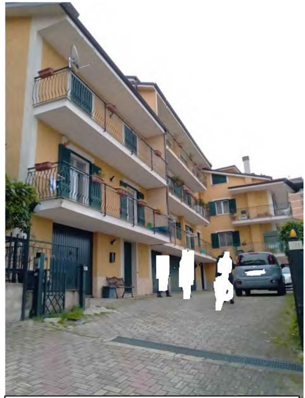
FOTO 35- PIAZZALE CONDOMINIALE