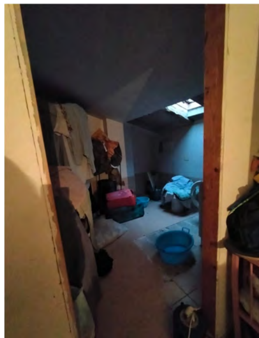
FOTO 46- BAGNO