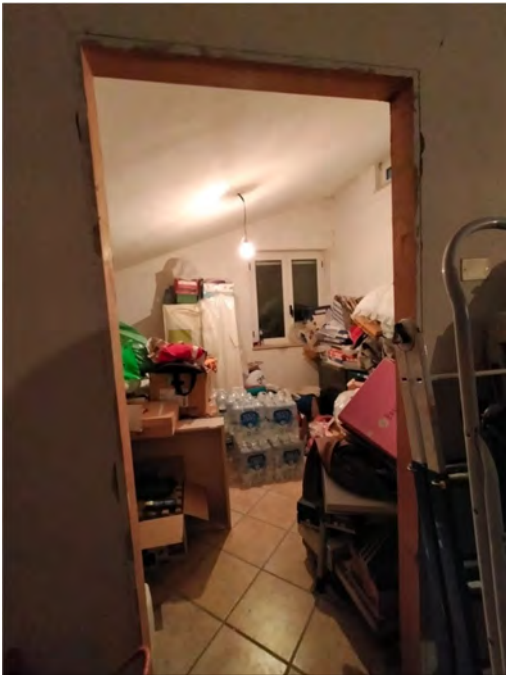
FOTO 44- ACCESSO ALLA CAMERA