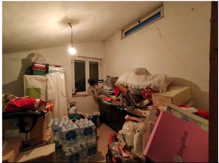
FOTO 45- CAMERA