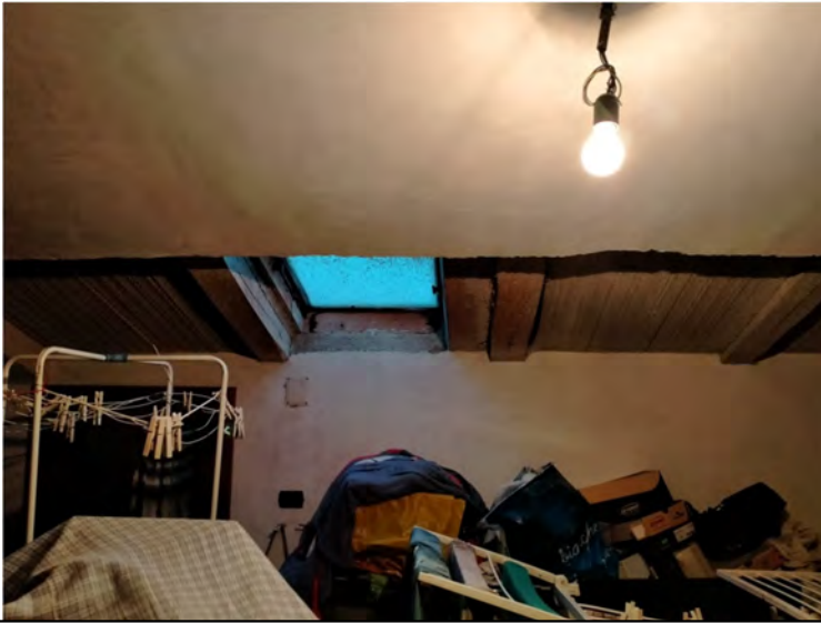
FOTO 41- ZONA GIORNO, VISTA VERSO ZONA DEPOSITO