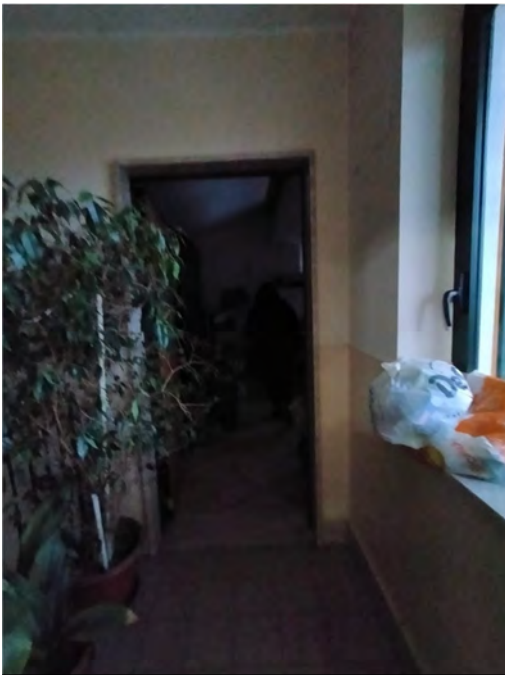
FOTO 38- ACCESSO AL BENE