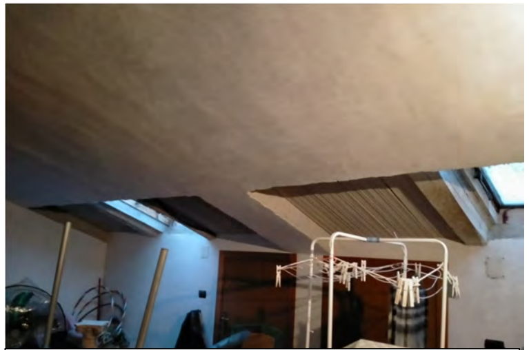
FOTO 42- ZONA GIORNO, VISTA VERSO ZONA DEPOSITO