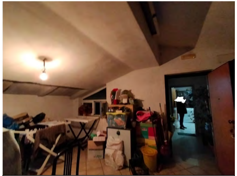
FOTO 39- ZONA GIORNO, VISTA VERSO INGRESSO