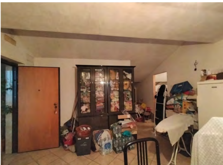
FOTO 43- ZONA GIORNO, VISTA VERSO CAMERA