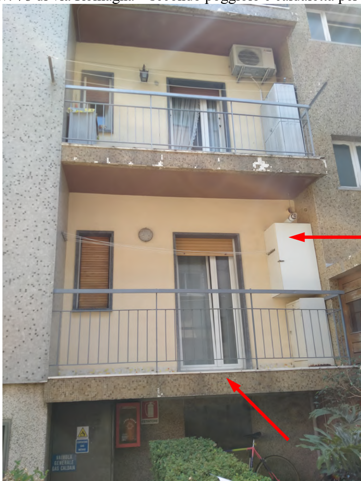
FOTO 7 – facciate stabile civ. 78 di via Romagna; finestra camera da letto