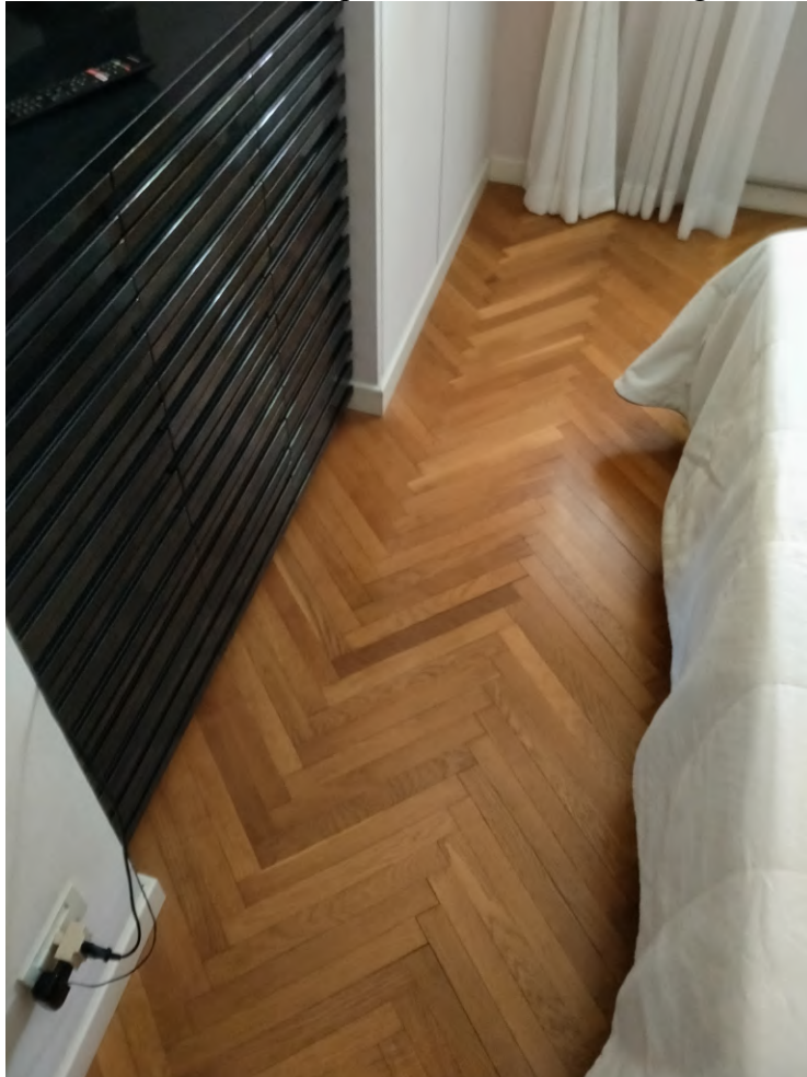
FOTO 24 – camera da letto matrimoniale; pavimento in listelli di legno, verosimilmente rovere