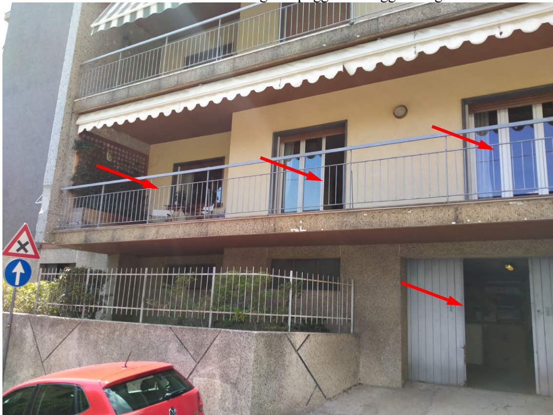
FOTO 6 – facciate stabile civ. 78 di via Romagna – ingresso all’edificio