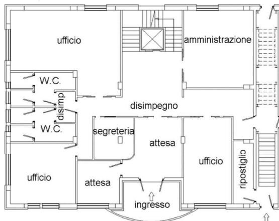
Pianta piano terra