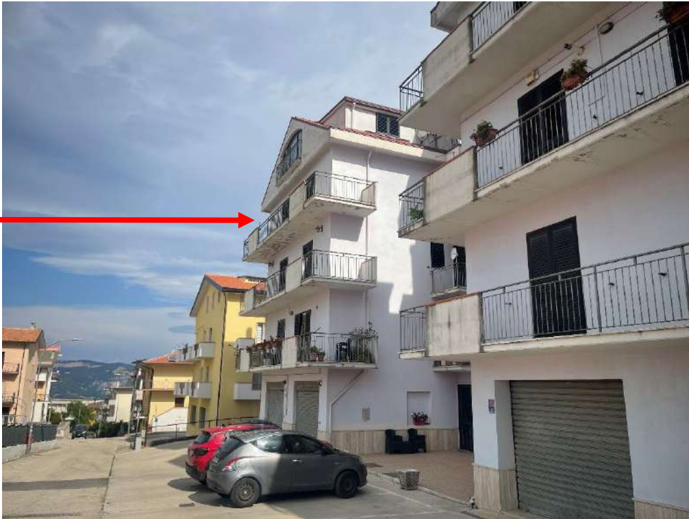
foto n. 2 lato sud ovest esterno appartamento terzo piano