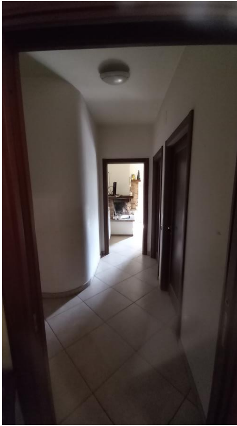
Foto n. 3 - disimpegno