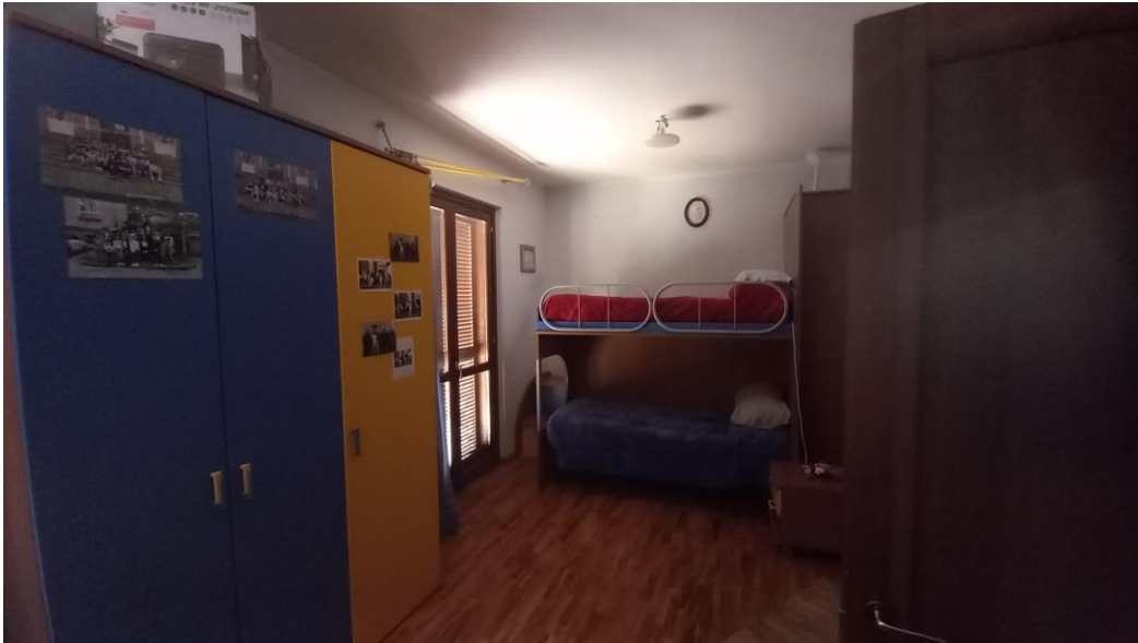
Foto n. 5 - camera da letto