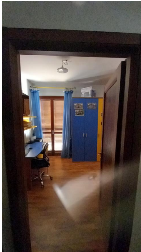
Foto n. 4 - camera da letto