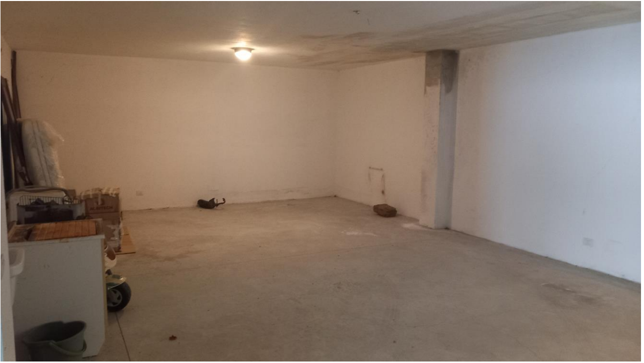
Foto n. 17 - interno box