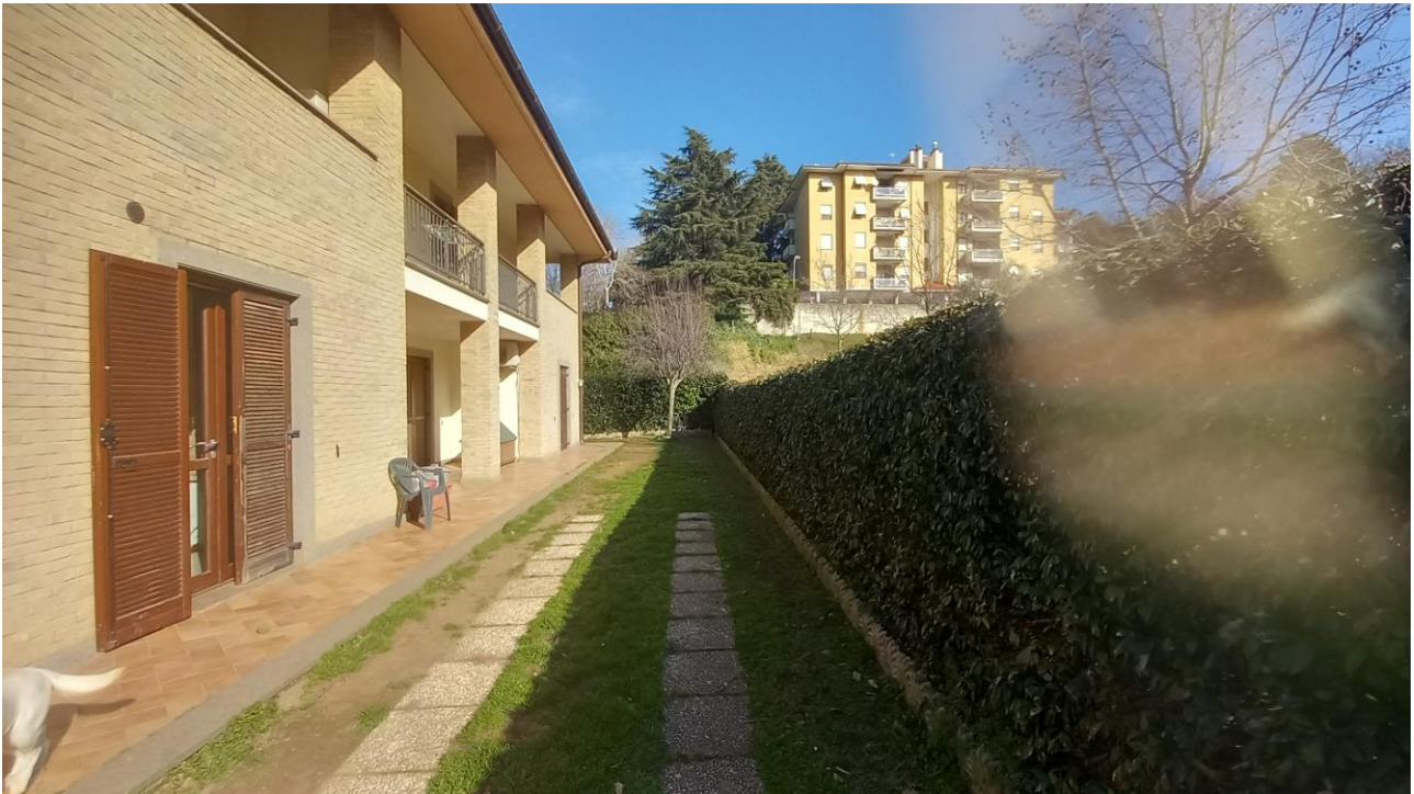
Foto n. 14 - giardino