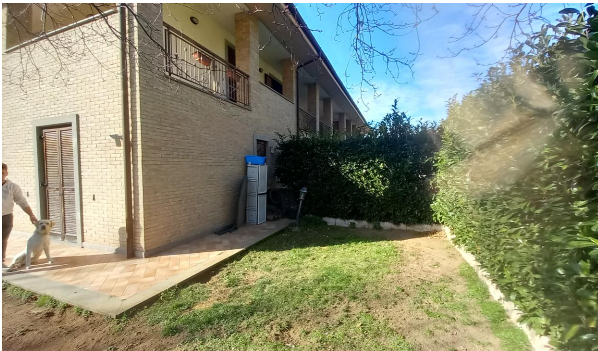
Foto n. 15 - giardino