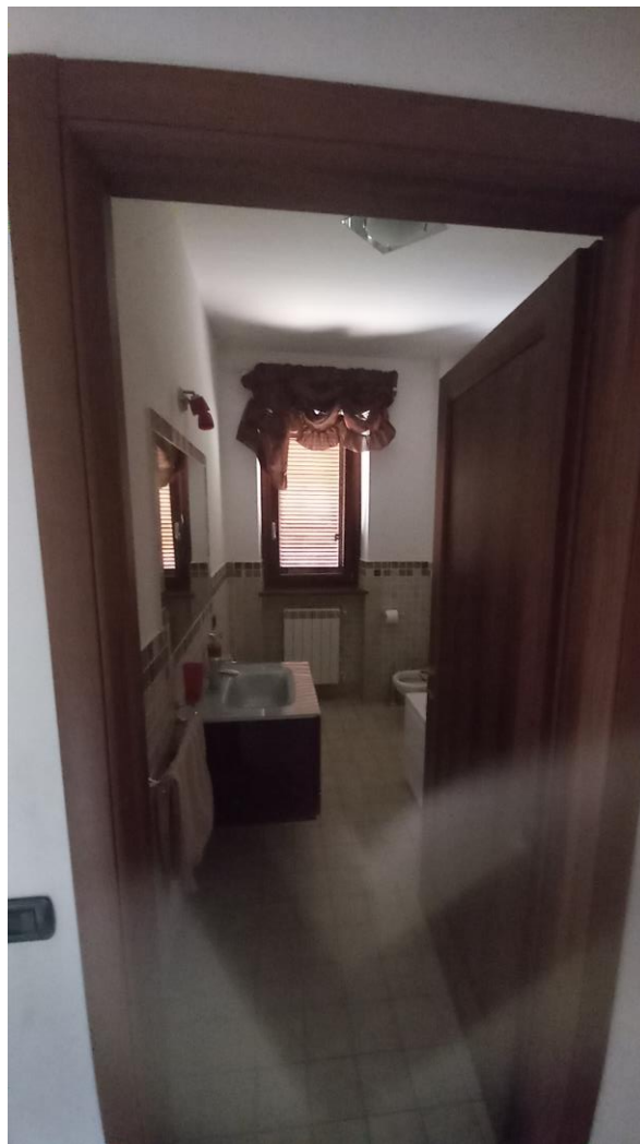
Foto n. 8 - bagno