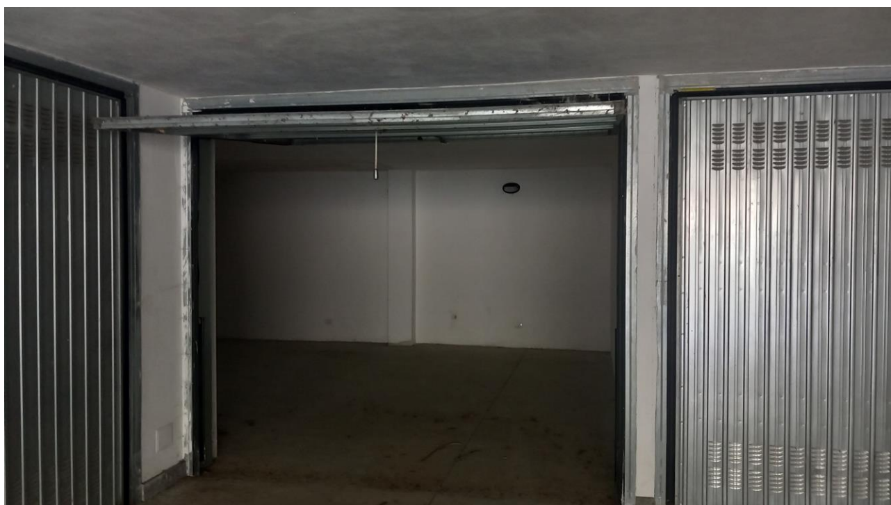
Foto n. 16 - ingresso box