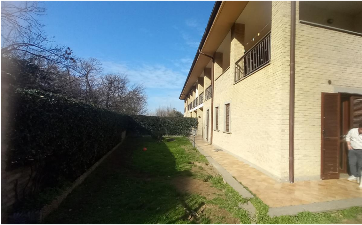
Foto n. 13 - giardino