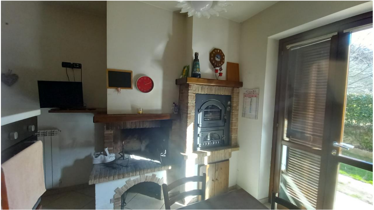
Foto n. 11 - cucina