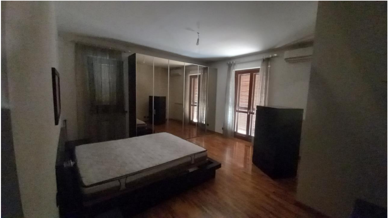
Foto n. 7 - camera da letto matrimoniale