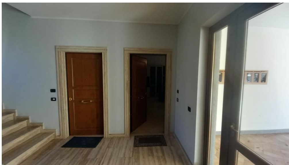
Foto n. 1 - P.T. Ingresso abitazione