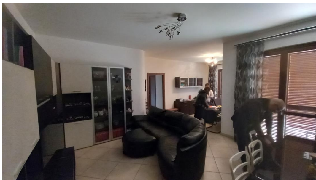
Foto n. 2 - soggiorno