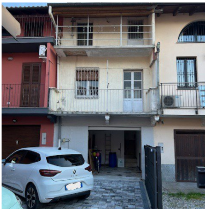
Prospetto Nord corte