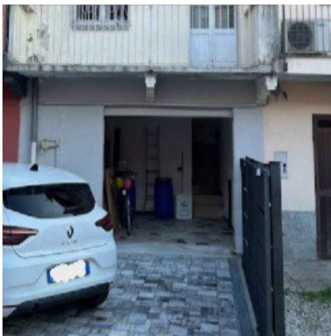
Piano terra ingresso