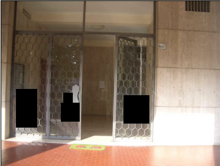
Vista accesso comune