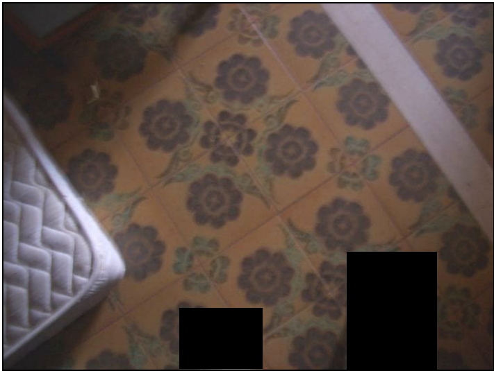
Vista interna appartamento