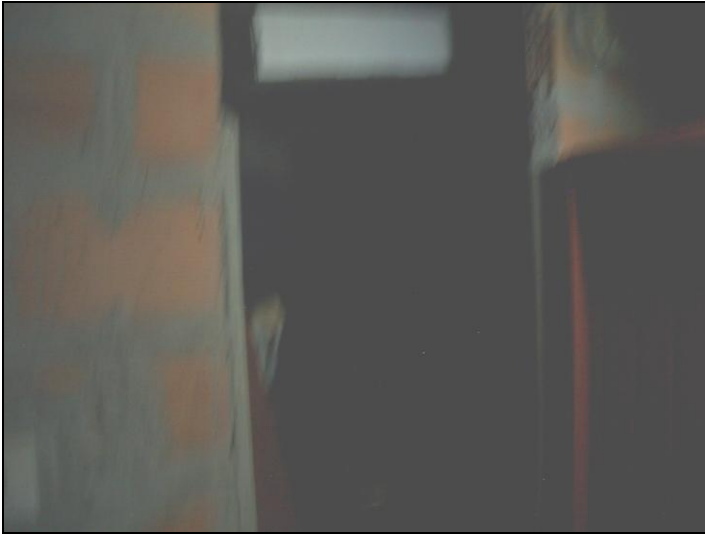
Vista esterna cantina