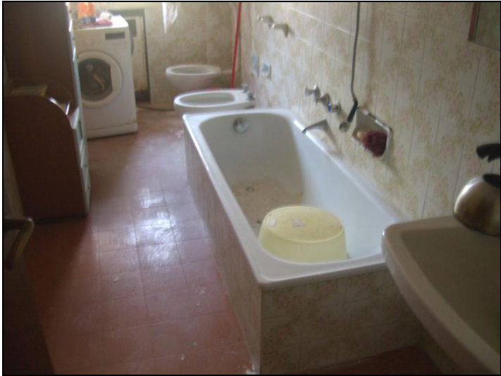
Vista interna appartamento