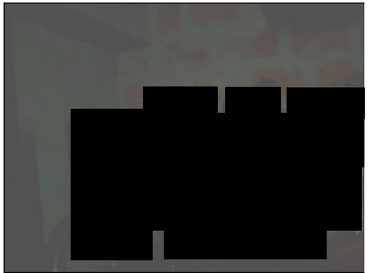
Vista interna cantina