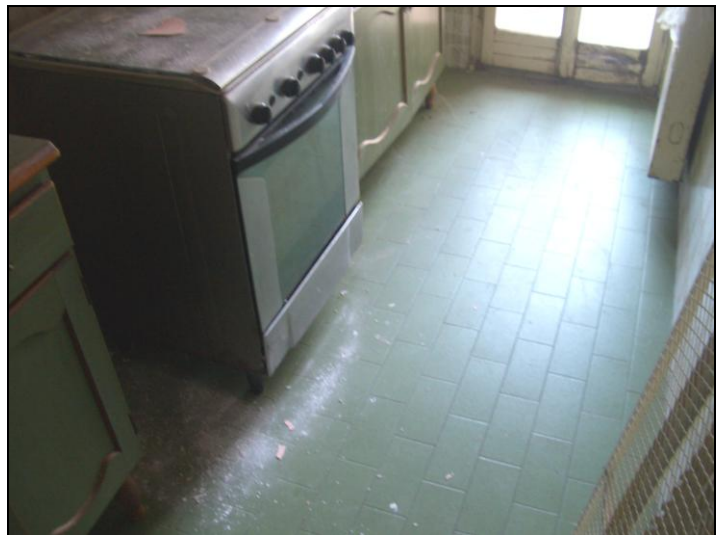
Vista interna appartamento