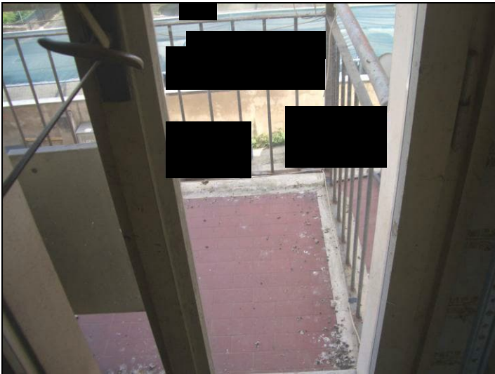
Vista interna appartamento