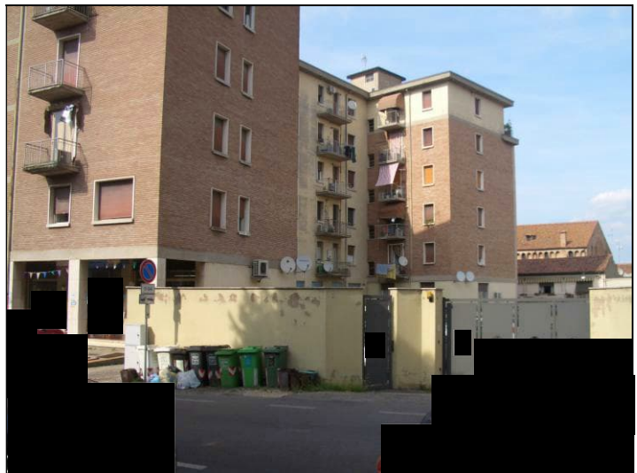
Vista esterna da Riviera Luigi Balzan