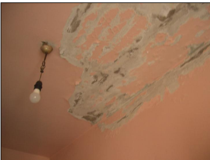
Vista interna appartamento