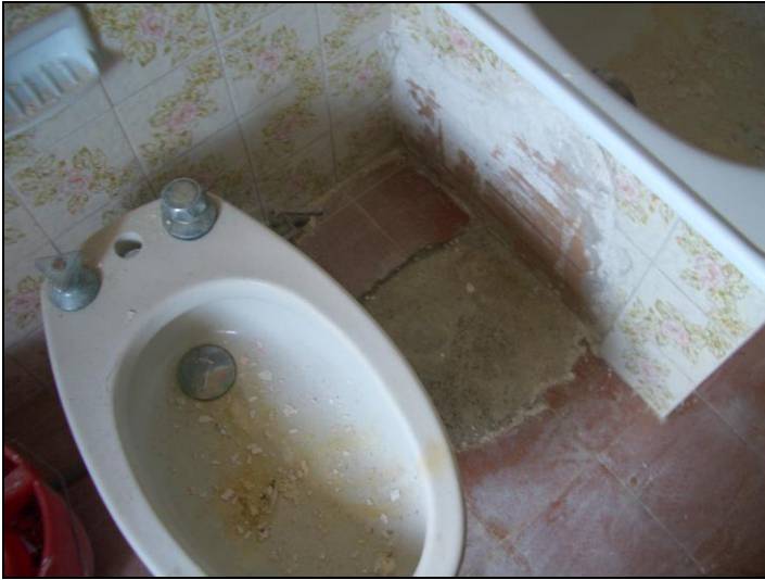
Vista interna appartamento