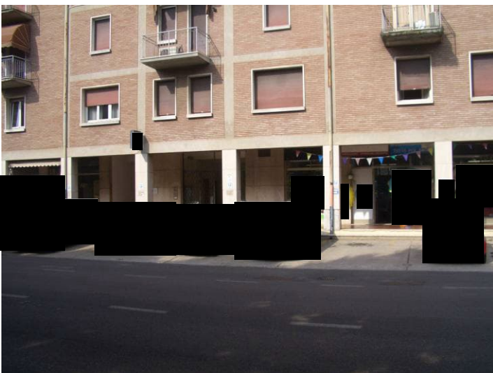
Vista esterna da Riviera Luigi Balzan