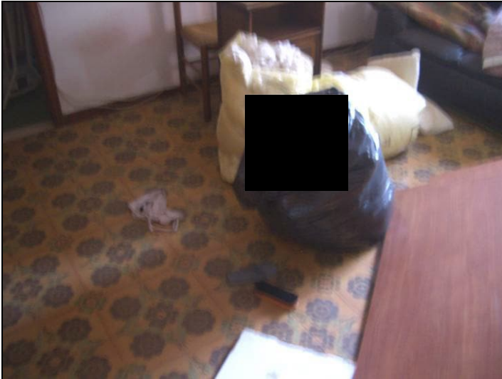
Vista interna appartamento