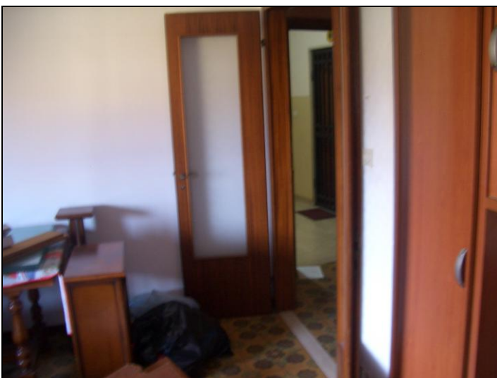
Vista interna appartamento