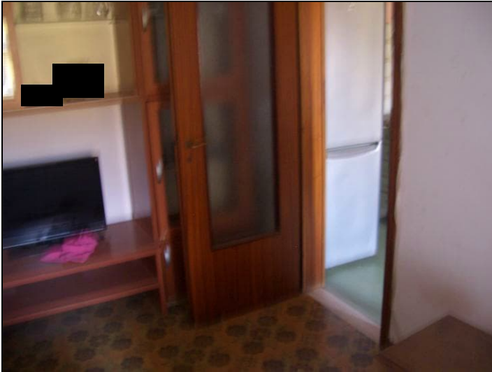
Vista interna appartamento