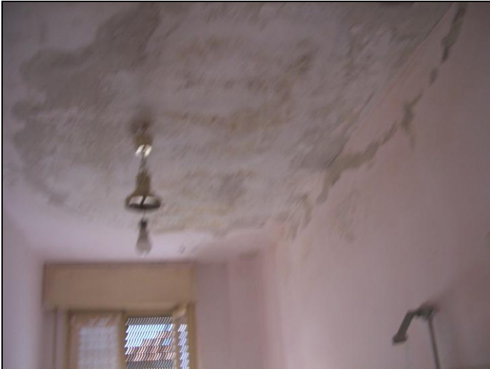
Vista interna appartamento