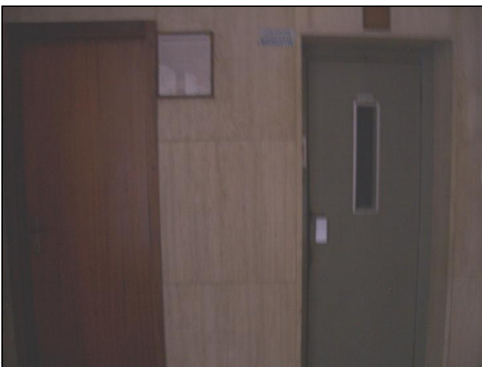
Vista ascensore comune