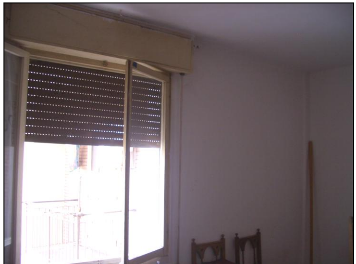
Vista interna appartamento