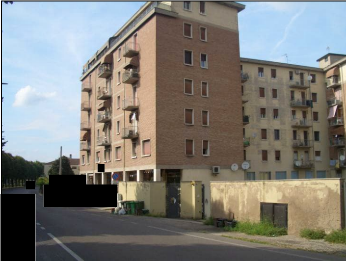
Vista esterna da Riviera Luigi Balzan