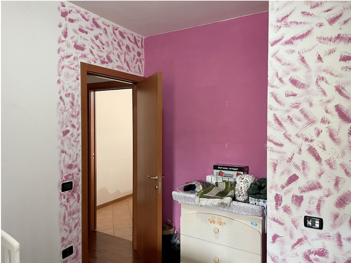
CAMERETTA (STESSA STANZA DI CUI SOPRA)