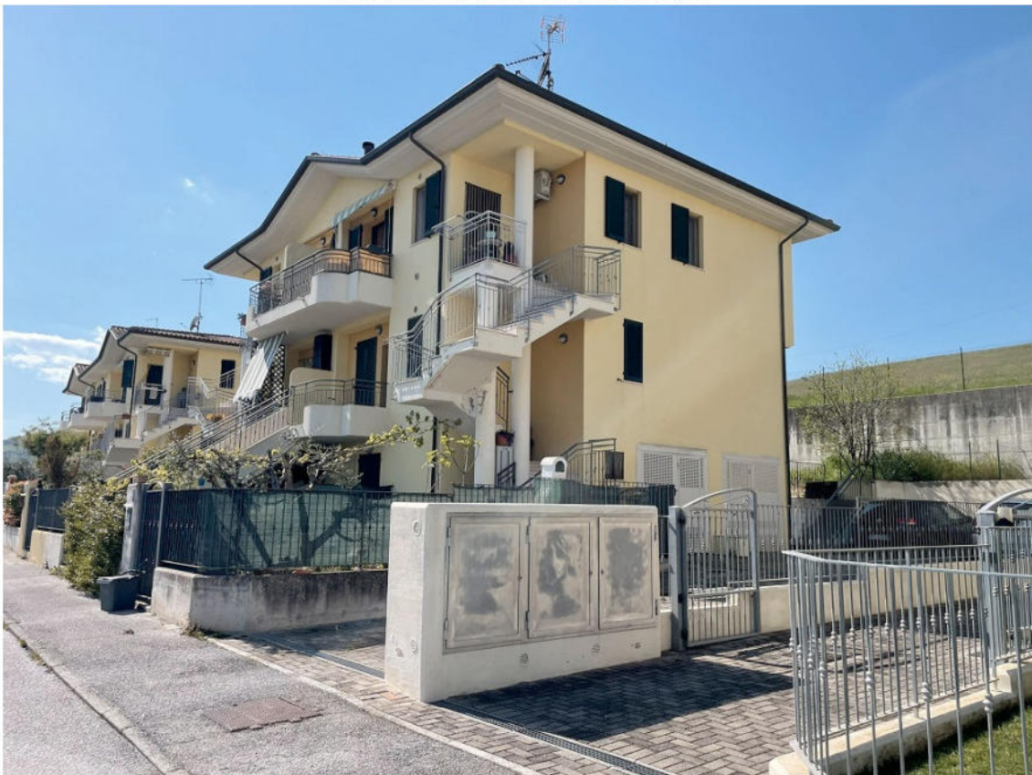
LUNGO VIA ROSSELLI