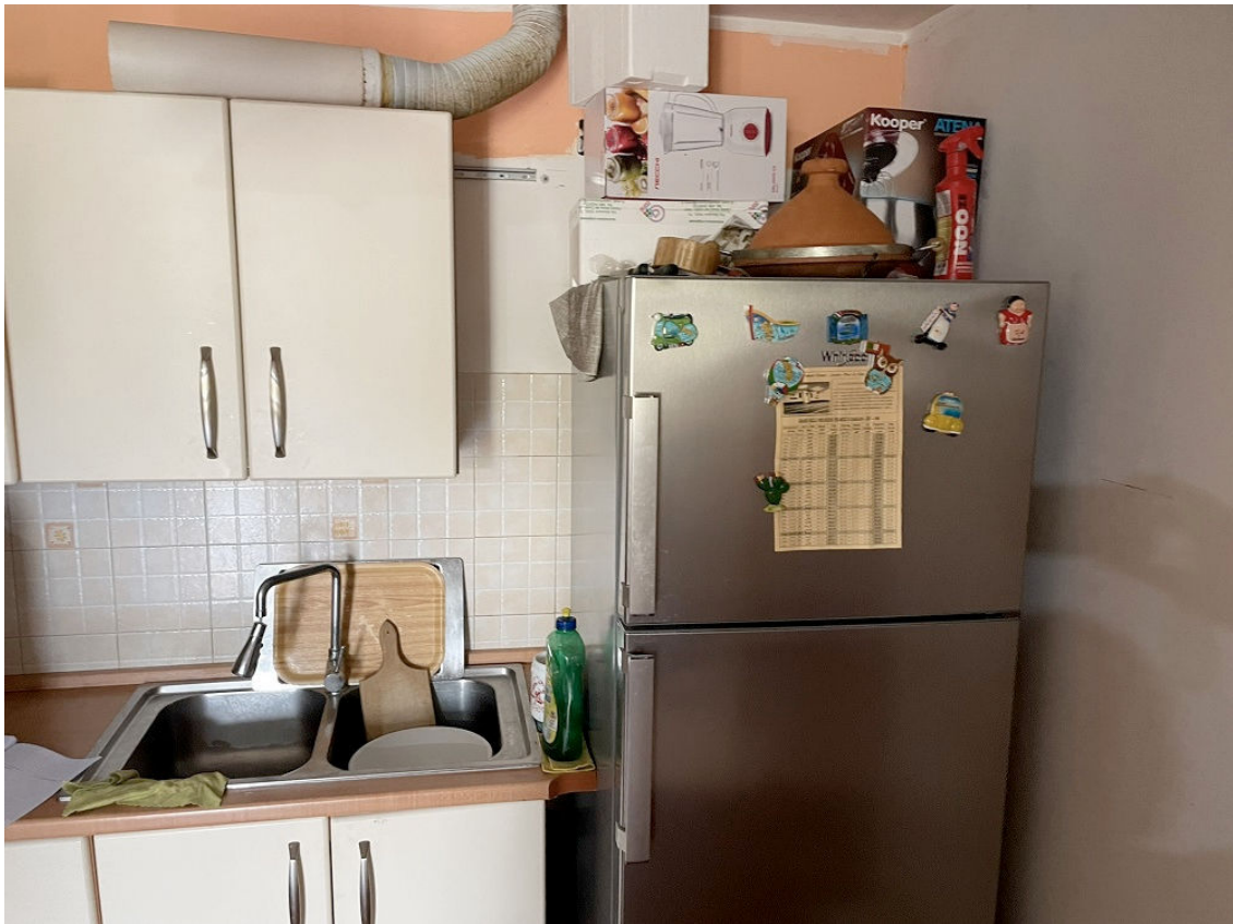
CUCINA IN TAVERNETTA