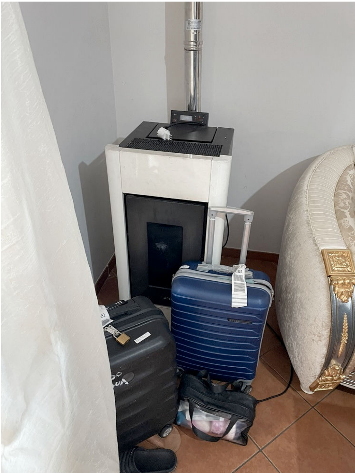
STUFA A PELLETT IN TAVERNETTA AL PIANO TERRA