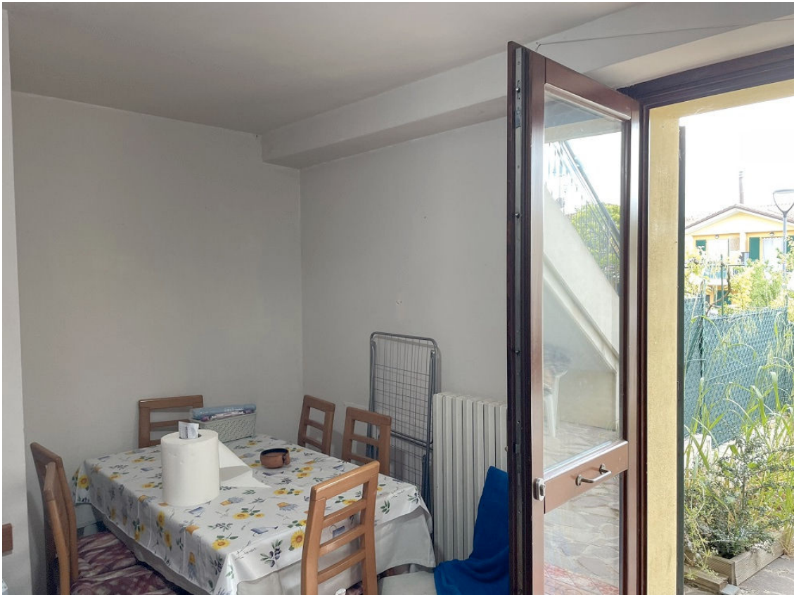
TAVERNETTA PIANO TERRA