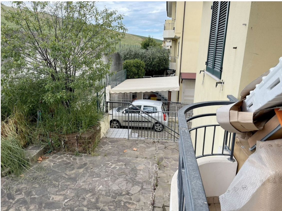
SCOPERTO ESCLUSIVO RETRO