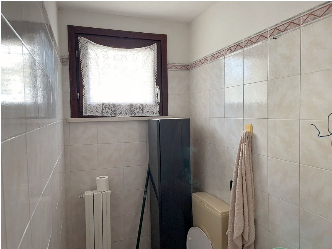
BAGNO PIANO TERRA