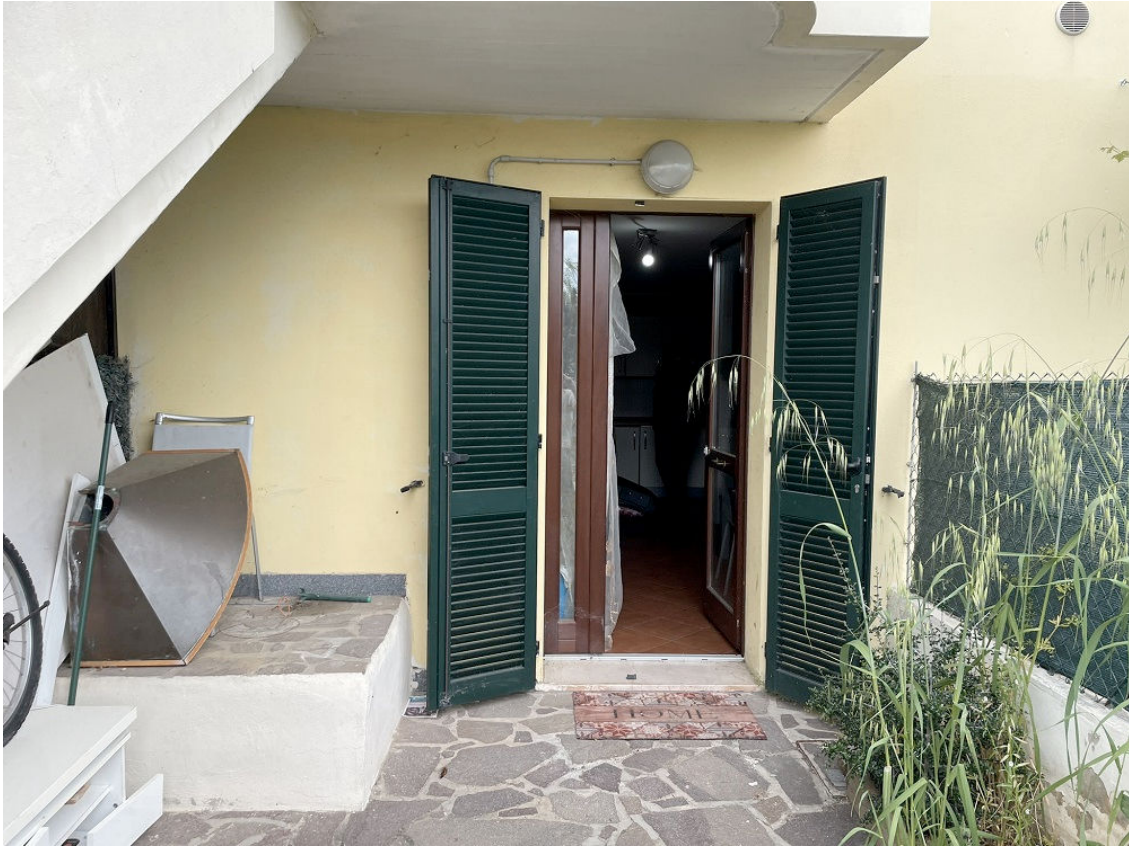
SCOPERTO ESCLUSIVO FRONTE