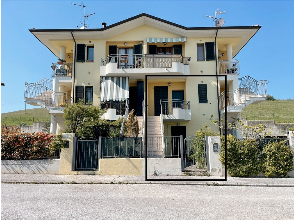
INTERO FRONTE FABBRICATO