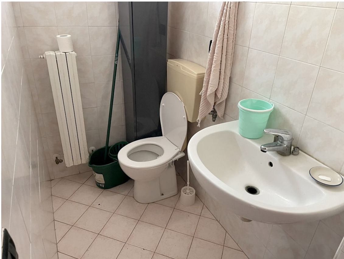
BAGNO PIANO TERRA