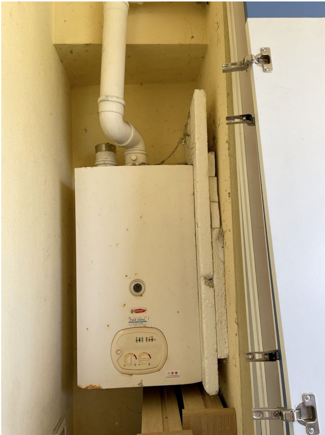
CALDAIA POSTA NEL TERRAZZINO PIANO PRIMO