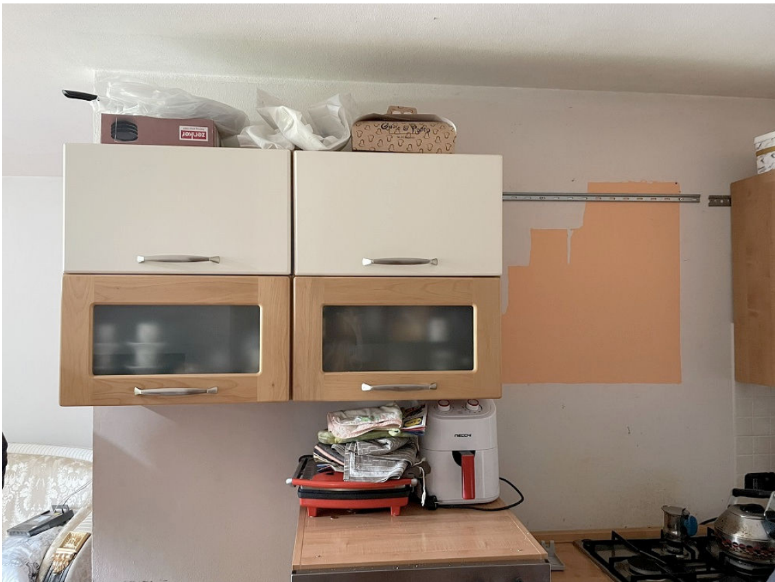
CUCINA AL PIANO TERRA - TAVERNETTA