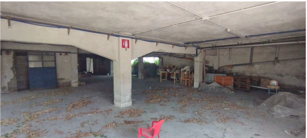
Garage comune anche ai Lotti n. 5-6 e 8