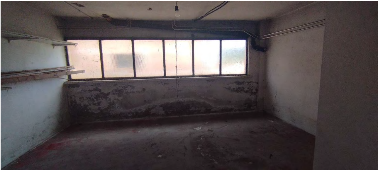
Fondaco Piano seminterrato