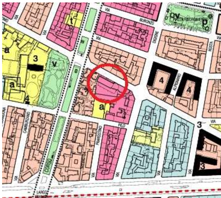
Estratto di P.R.G. Comune di Torino