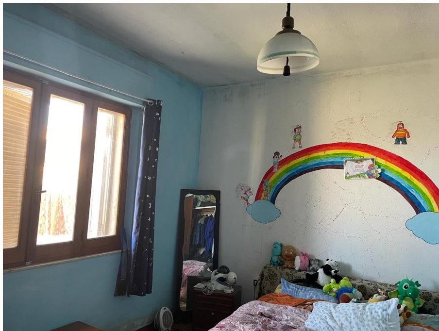
Foto 6_ Vista Camera destra da corridoio