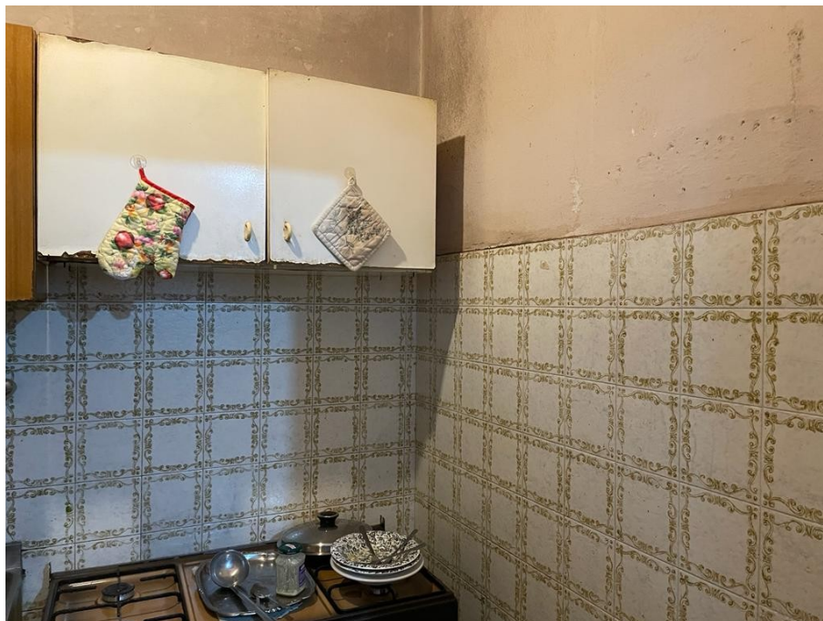
Foto 17_ Vista cucinino