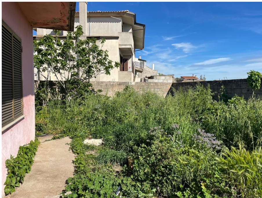
Foto 21_ Vista cortile interno