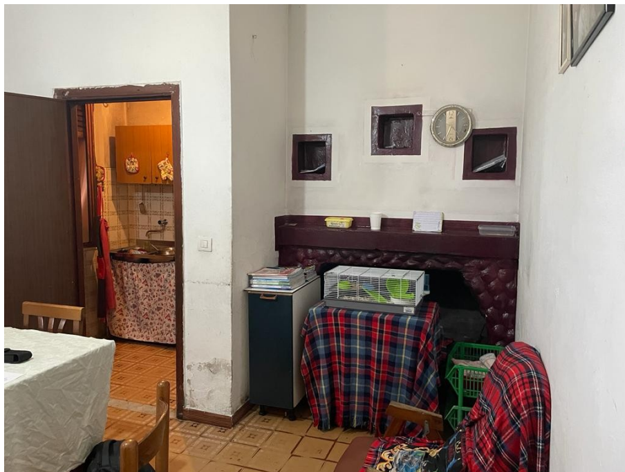
Foto 15_ Vista sala pranzo