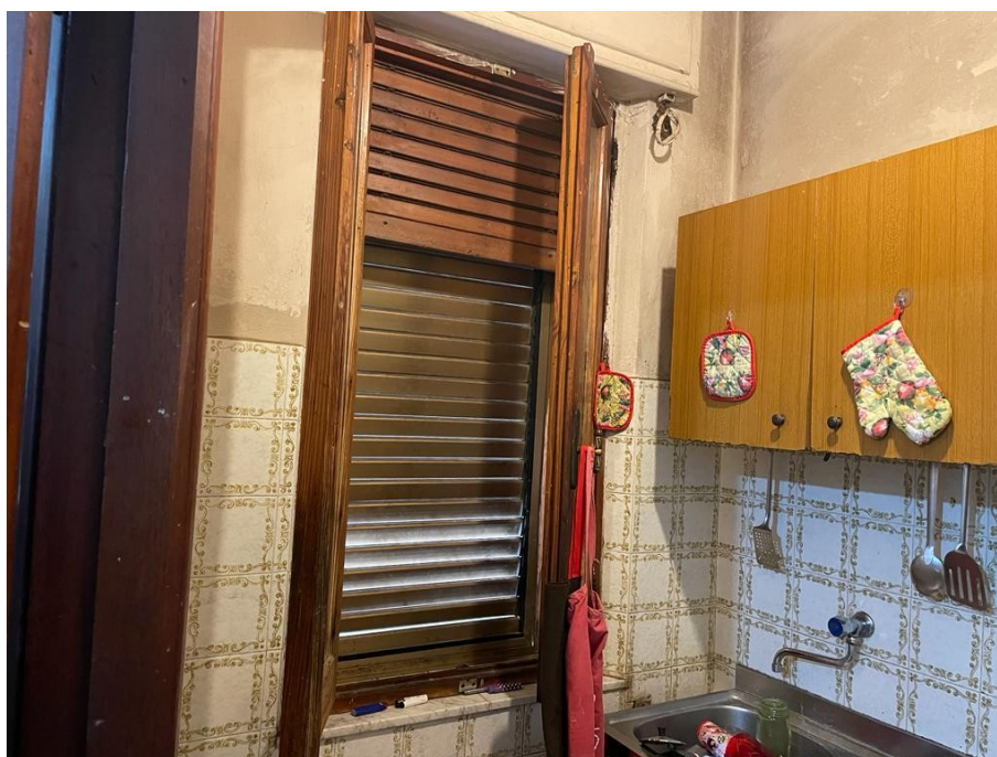
Foto 18_ Vista cucinino