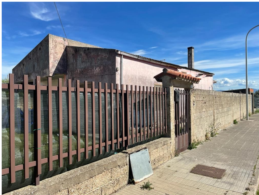
Foto 1_ Prospetto esterno su via Togliatti