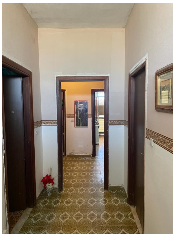
Foto 5_ Ingresso corridoio