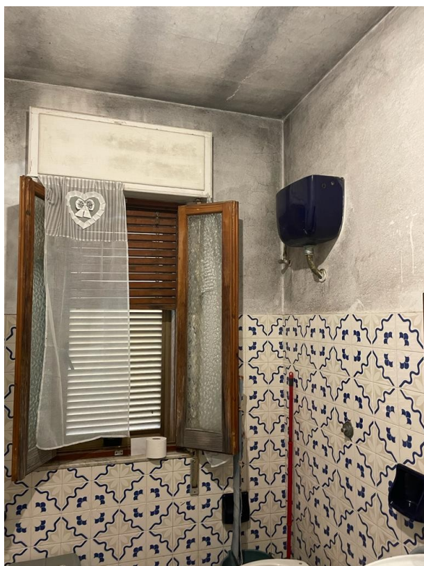
Foto 12_ Vista bagno