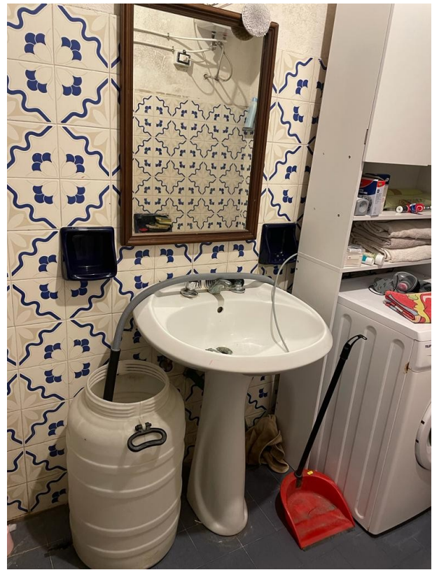
Foto 11_ Vista bagno