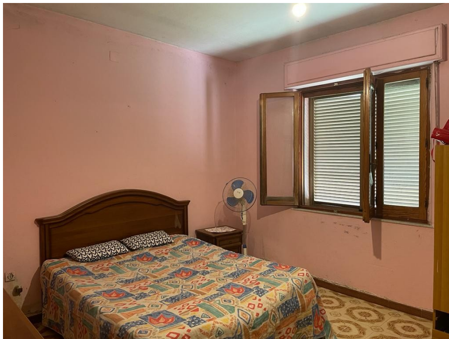
Foto 13_ Vista camera fianco sala pranzo