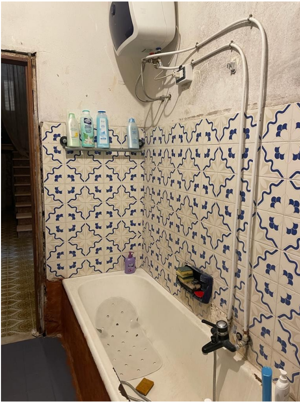
Foto 10_ Vista bagno