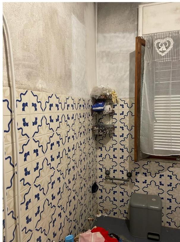
Foto 13_ Vista bagno