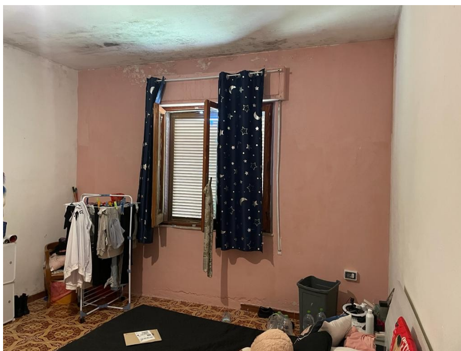
Foto 7_ Vista Camera sinistra da corridoio