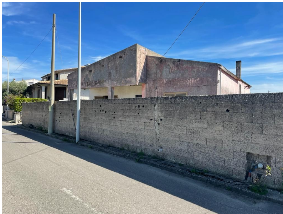
Foto 3_ Prospetto esterno su via Renzo Laconi