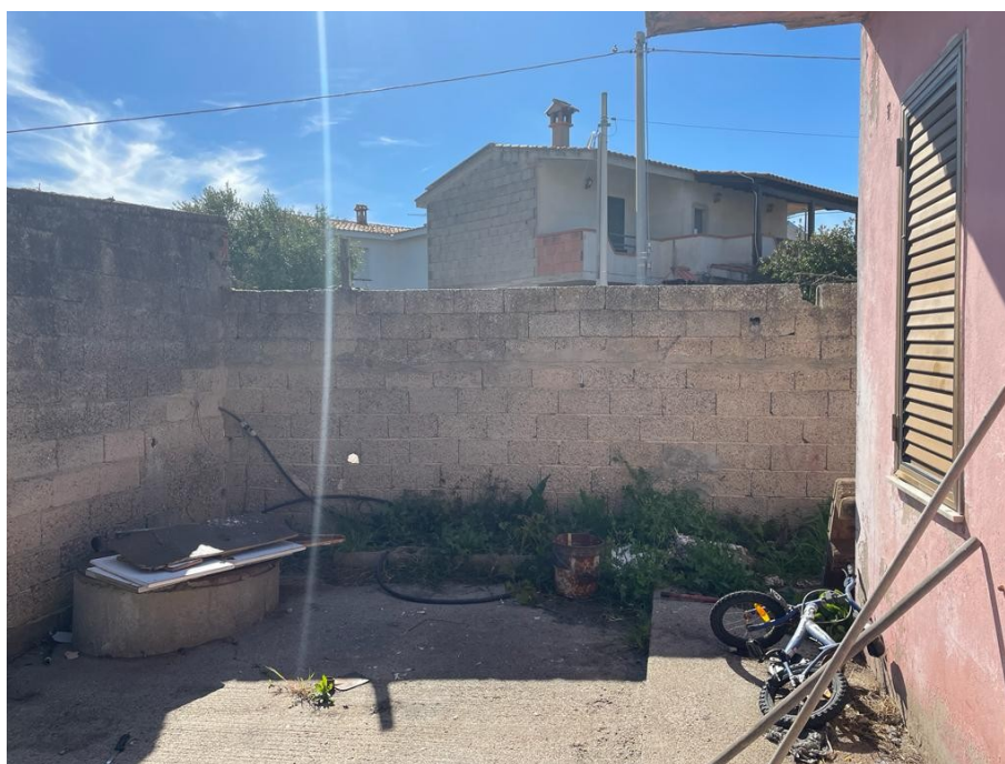
Foto 20_ Vista cortile interno