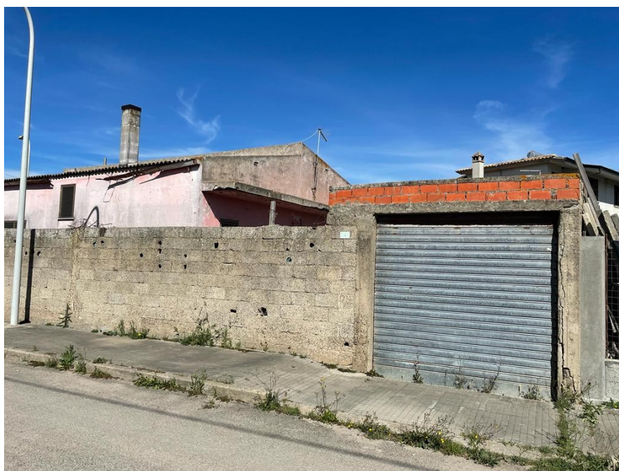
Foto 2_ Prospetto esterno su via Togliatti - vista garage