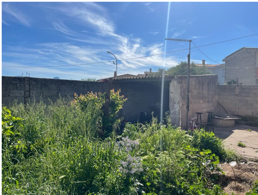
Foto 23_ Vista cortile interno e garage