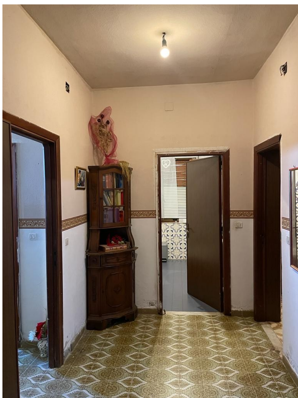
Foto 8 _ Vista disimpegno