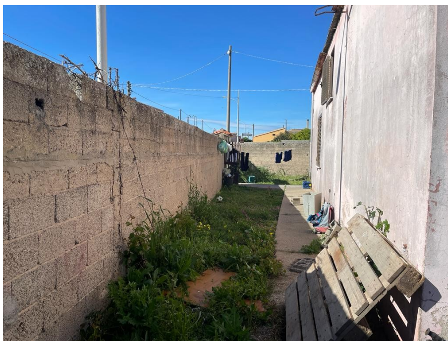
Foto 22_ Vista cortile interno