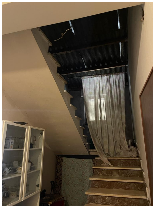
Foto 9 _ Vista disimpegno e vano scala