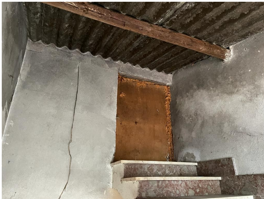
Foto 19_ Vista accesso al locale sottotetto non accessibile