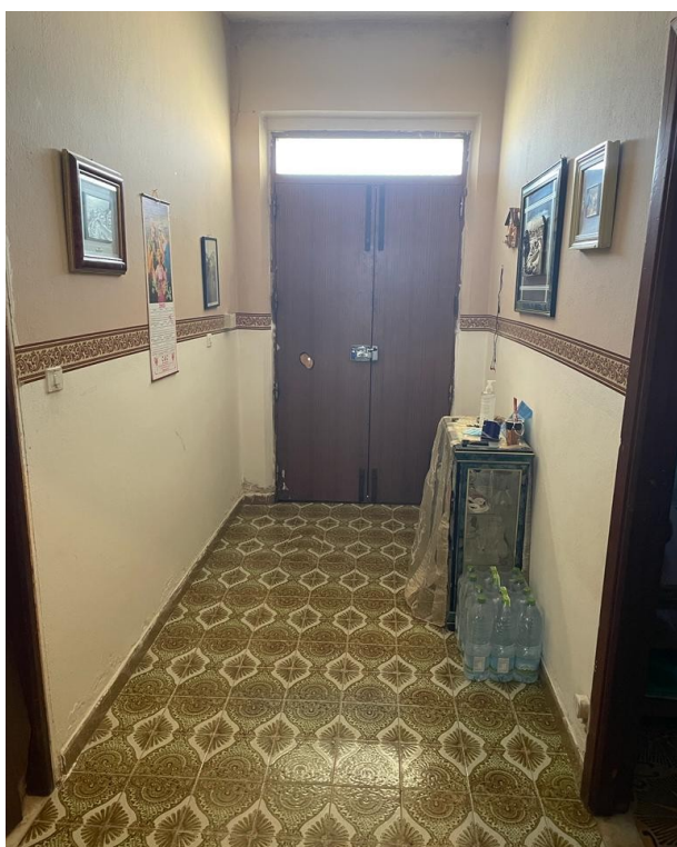
Foto 4_ Ingresso corridoio