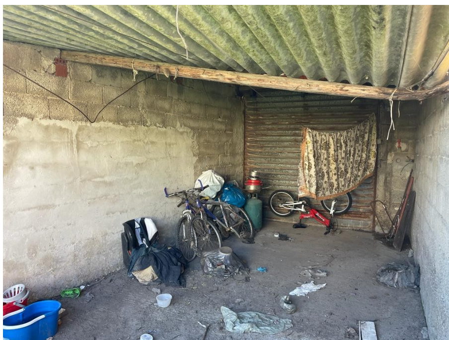
Foto 24_ Vista garage