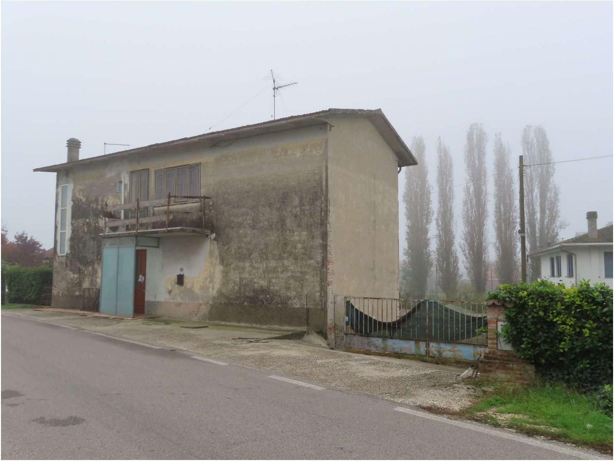
PROSPETTI NORD ed OVEST