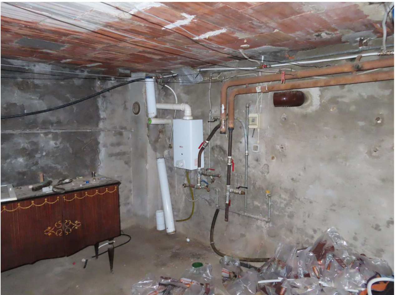
RIPOSTIGLIO LATO CALDAIA ed ISTANTANEO PER ACQUA SANITARIA