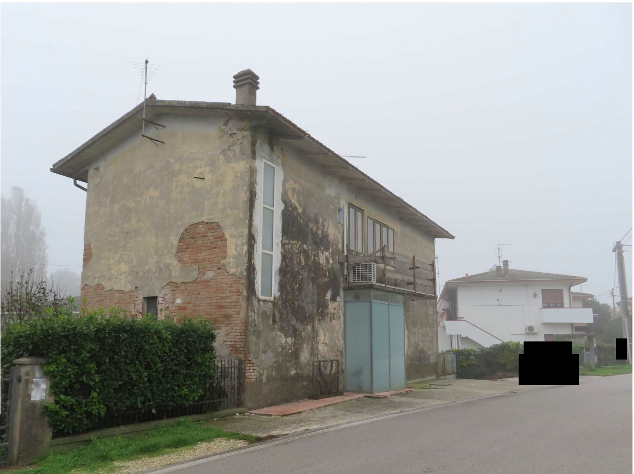
PROSPETTI NORD ed EST