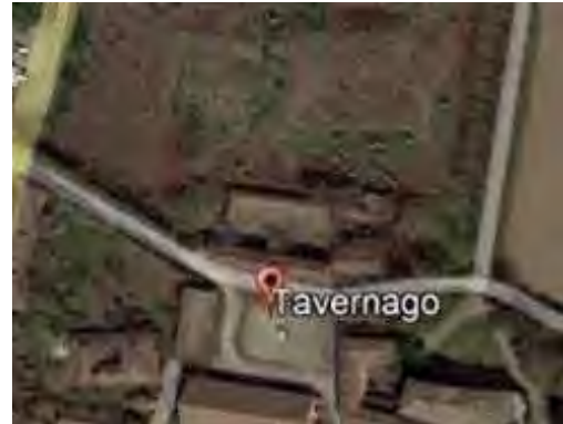
Fig.4 : Estratto aerofotogrammetrico