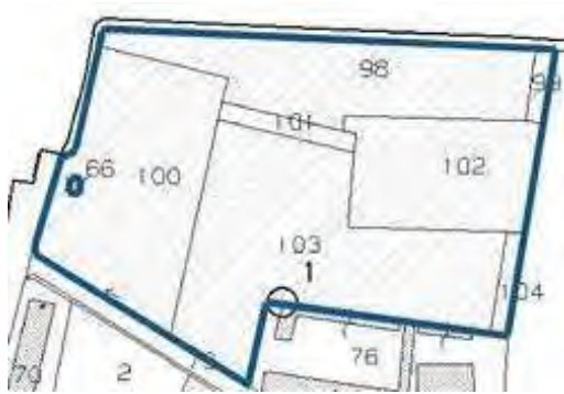
Fig.1 : Estratto mappa catastale