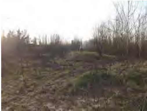
Fig.3 : Documentazione Fotografica