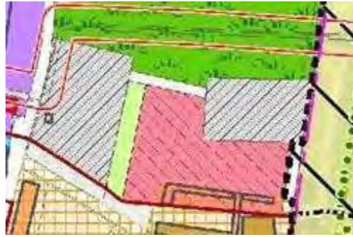
Fig.2 : Estratto R.U.E.