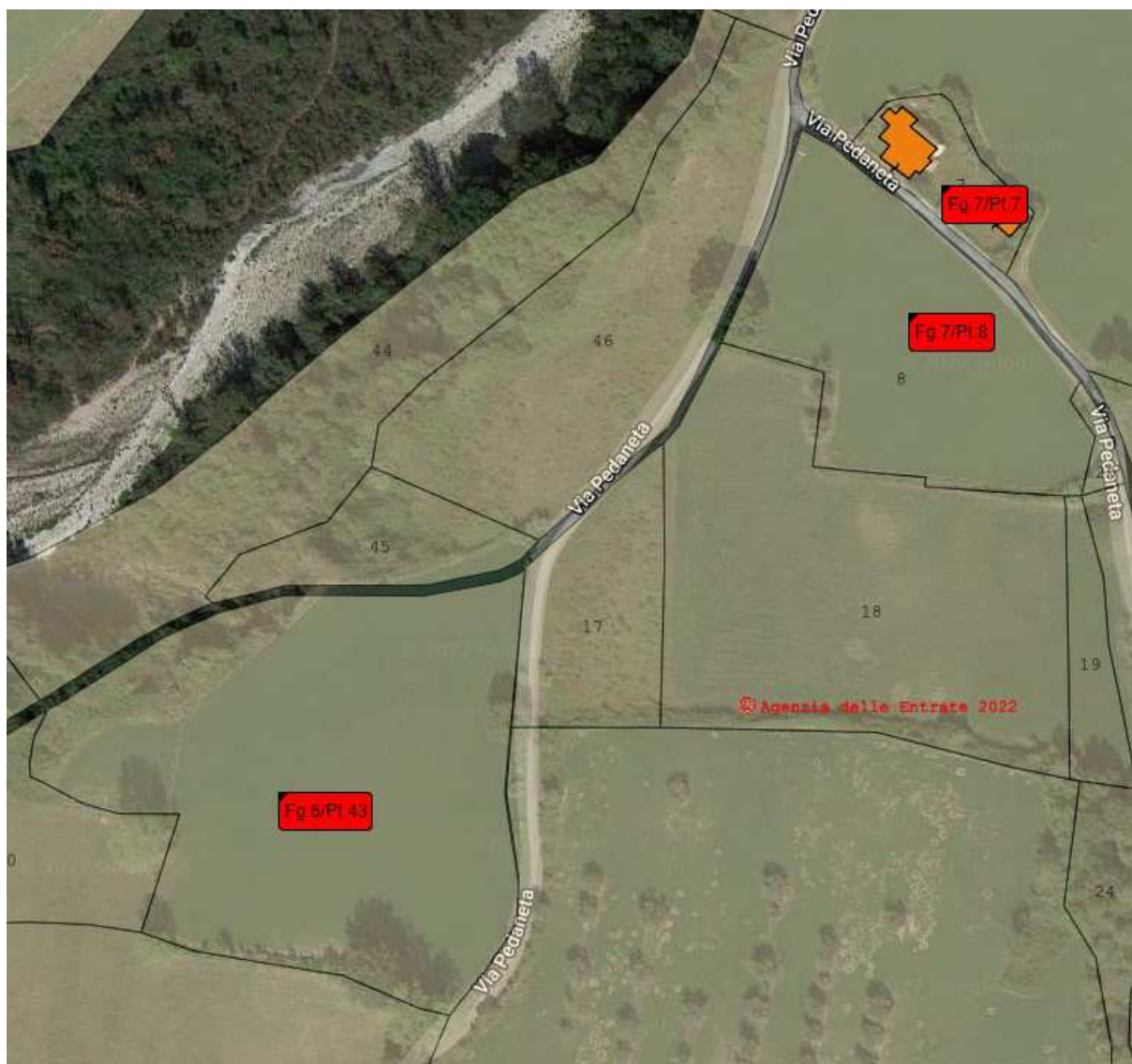
Ortofoto dei terreni sviluppo 3 di 3