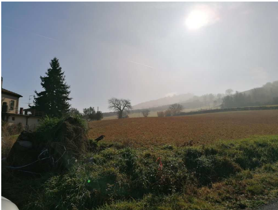
Foto n.20 - terreni