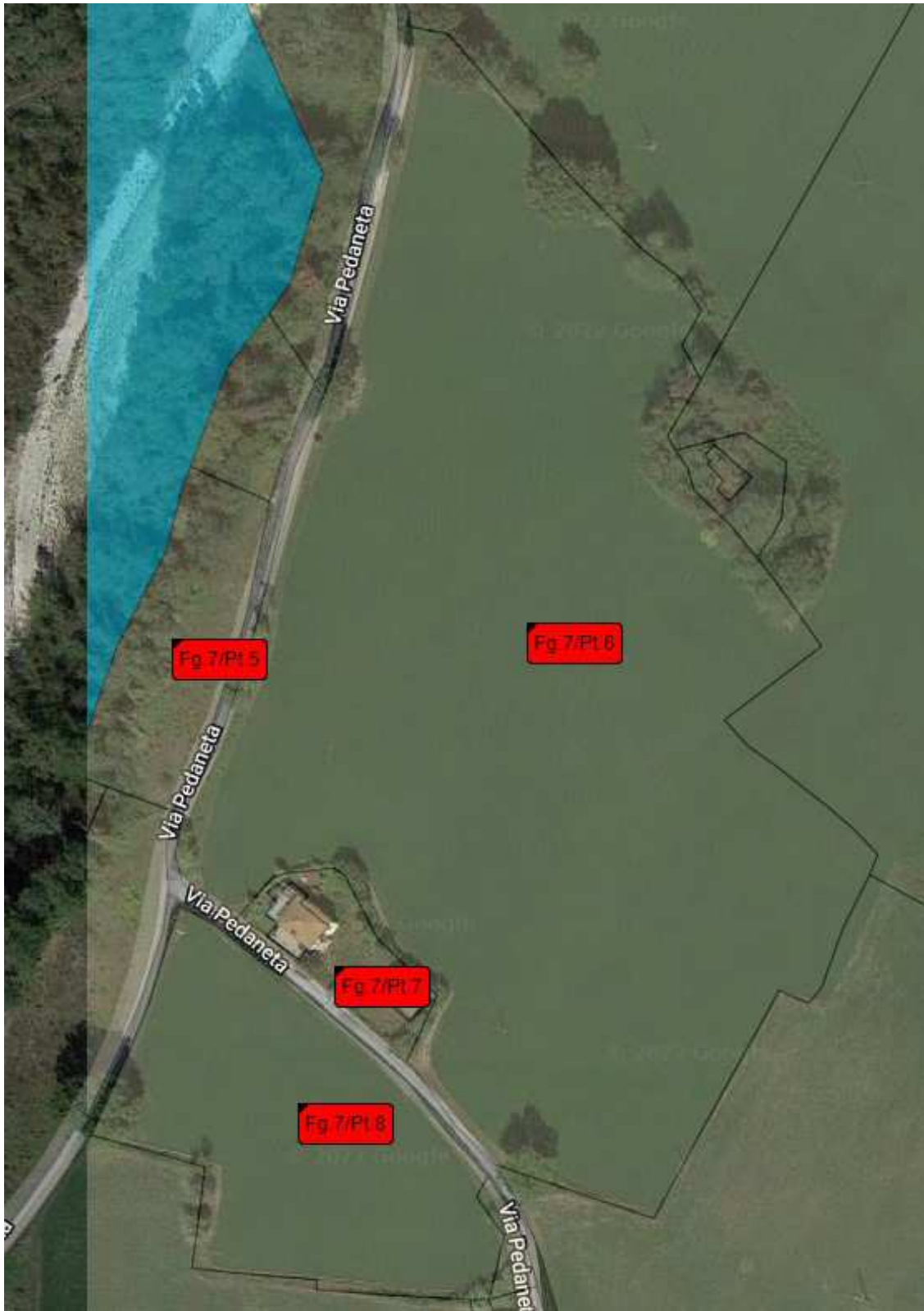
Ortofoto dei terreni sviluppo 2 di 3