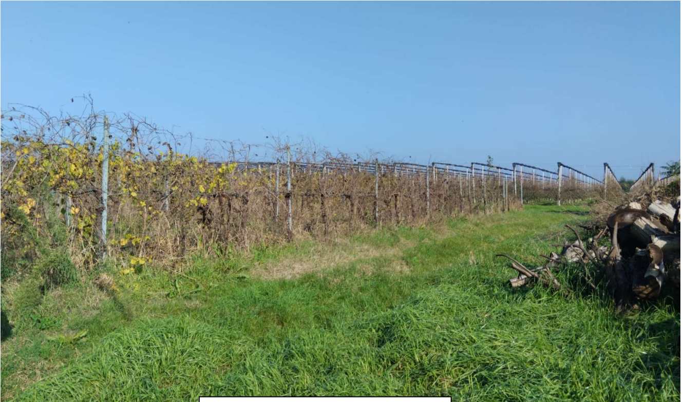
Vigneto da estirpare