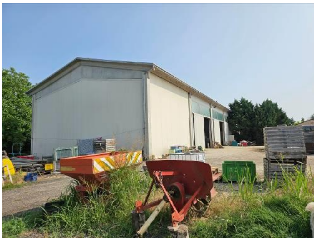
Fg. 14 mapp. 209/1