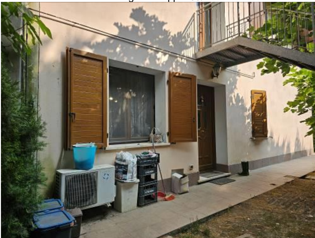
Fg. 14 mapp. 209/7