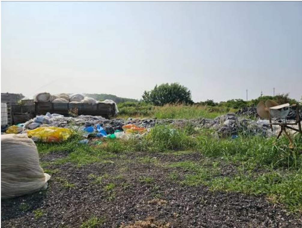
Fig. 14 mapp. 2 – terreno agricolo