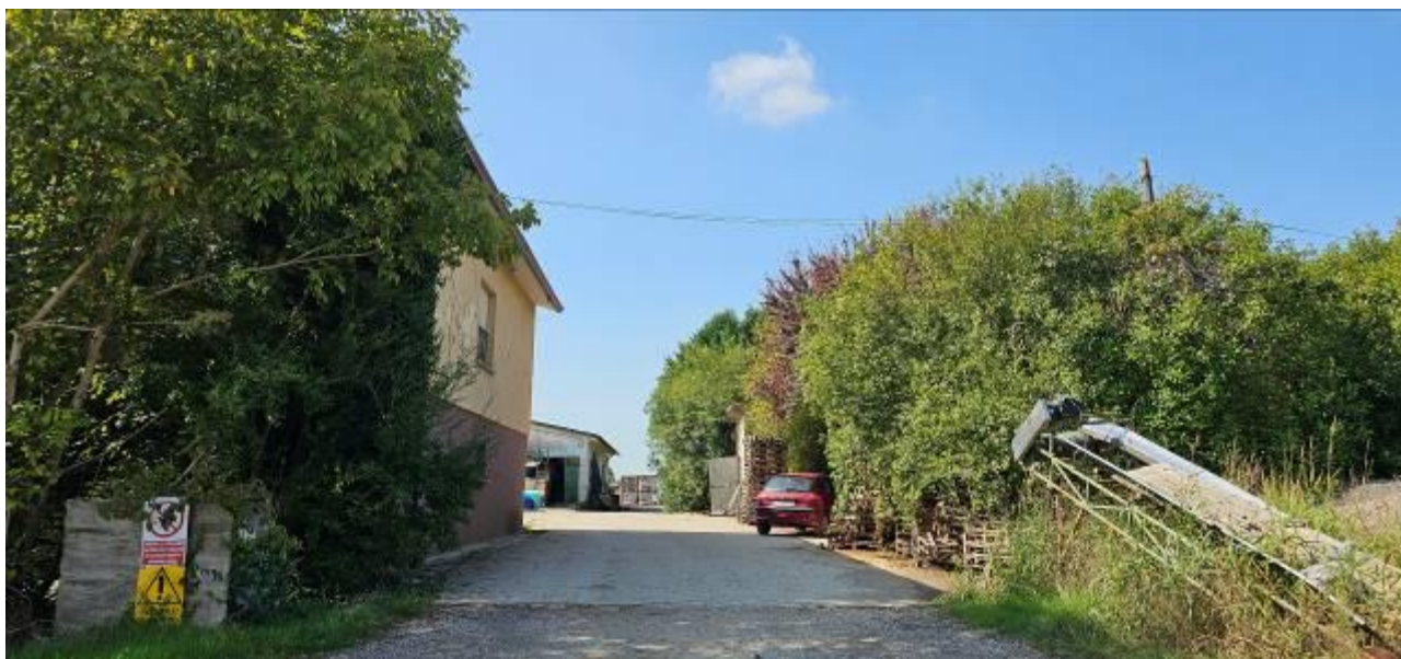
1 - Accesso da via Alberia c.n. 8

AZIENDA AGRICOLA CON FABBRICATI RESIDENZIALI, MAGAZZINI E TERRENO AGRICOLO