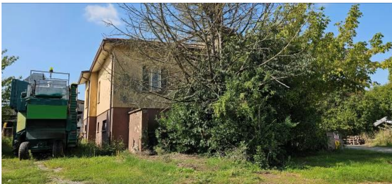
2 – mapp. 249/1