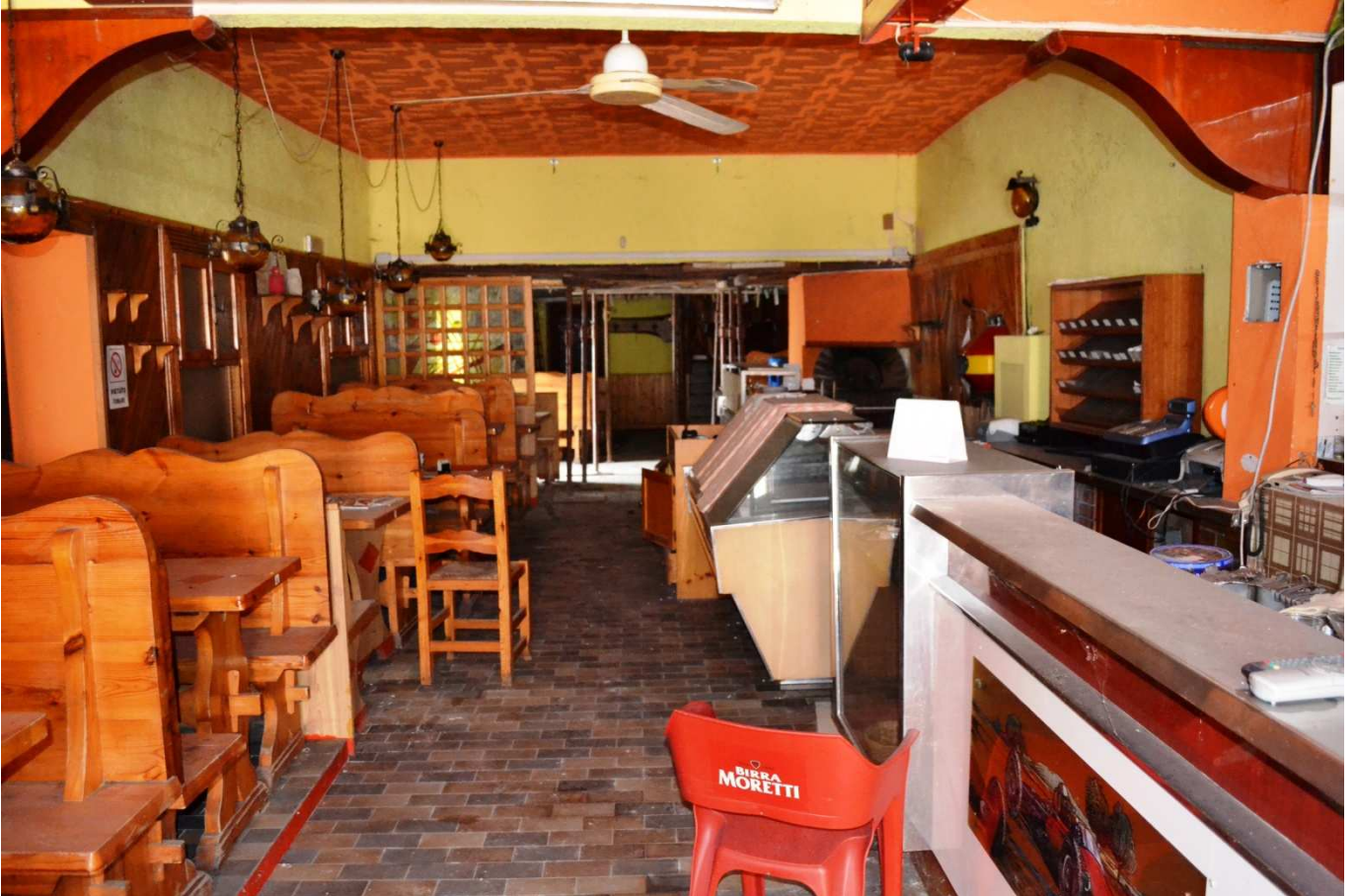
foto 14 - Edificio in via Roma n. 77-79-81, piano terra, sala ingresso e bar vista dall'ingresso a sud