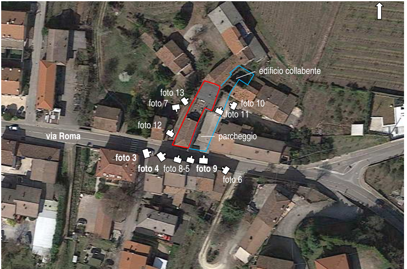
foto 2 - Aerofoto Google – coni visuali delle foto esterne – scala apx 1:1000