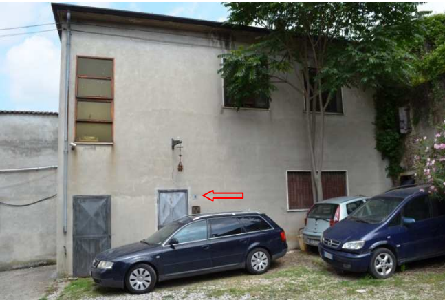
foto 10 - Prospetto est della parte nord con il civ. 81