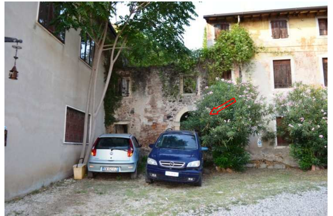
foto 11 - Prospetto sud dell'edificio collabente al n. 83