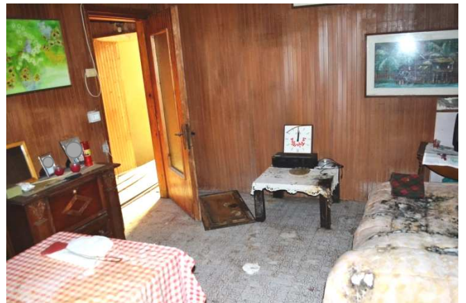
foto 23 - Vista dall'interno dell'ingresso dell'abitazione