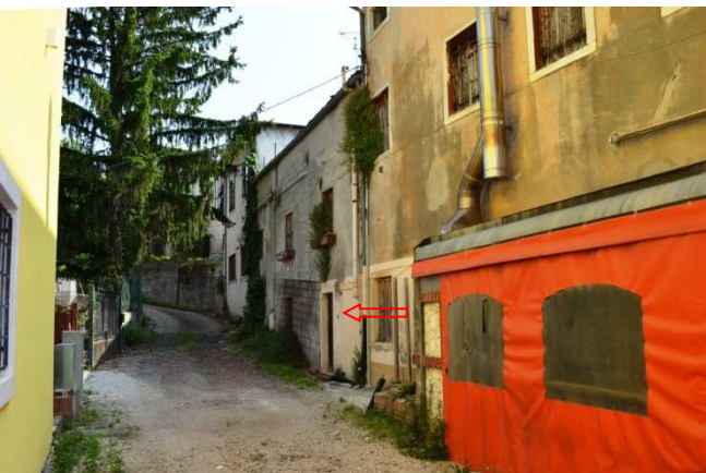
foto 12 - Scorcio ovest della parte centrale col civ. 77