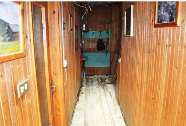
foto 22 - Vista dal vano scala del corridoio d'accesso