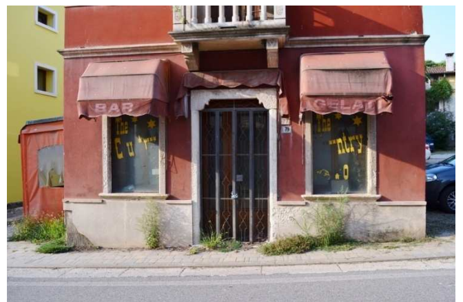
foto 8 - L'ingresso del bar/pizzeria al n. 79 in via Roma