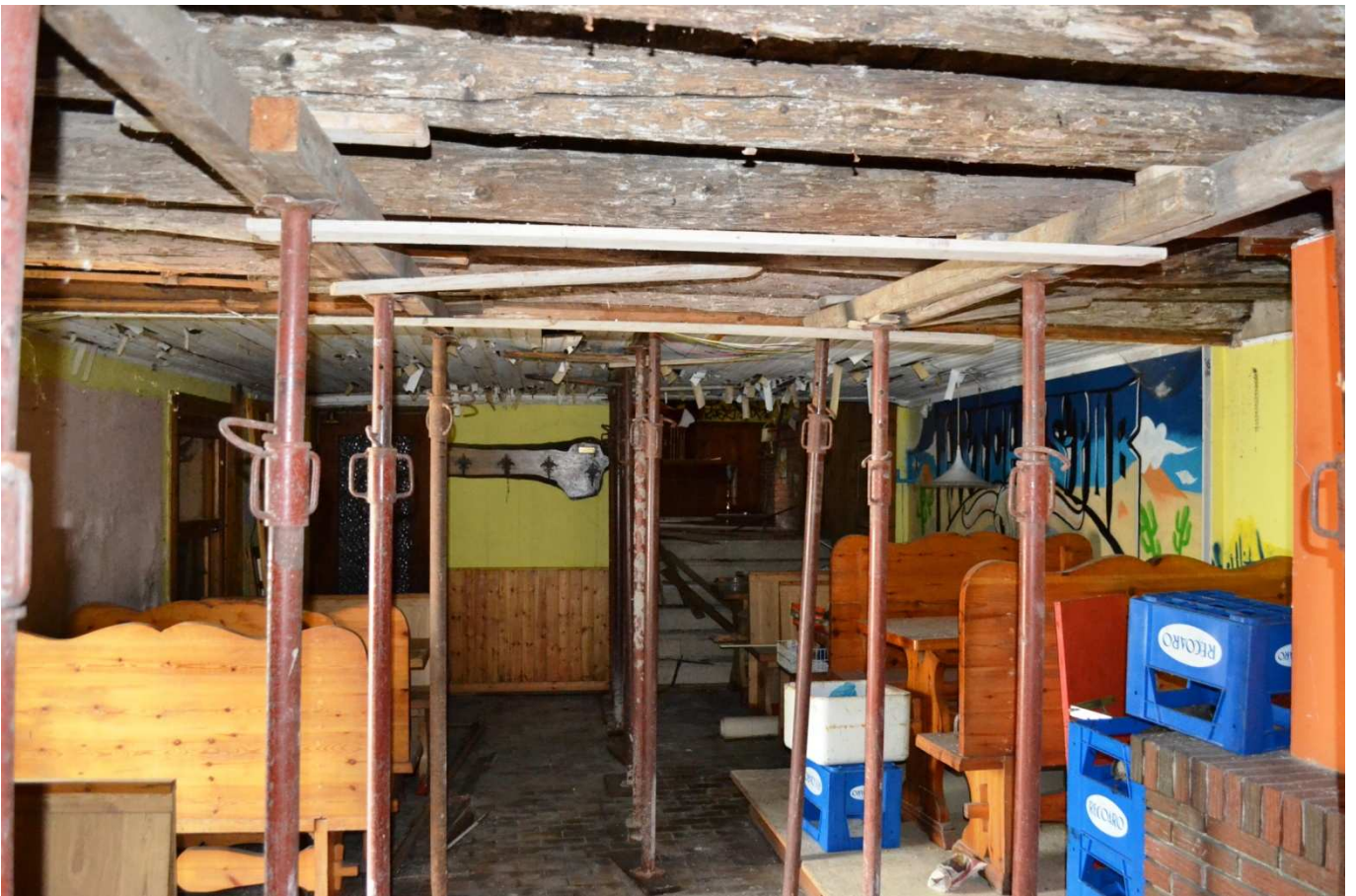
foto 15 - Edificio in via Roma n. 77-79-81, piano terra, sala centrale collabente vista da sud