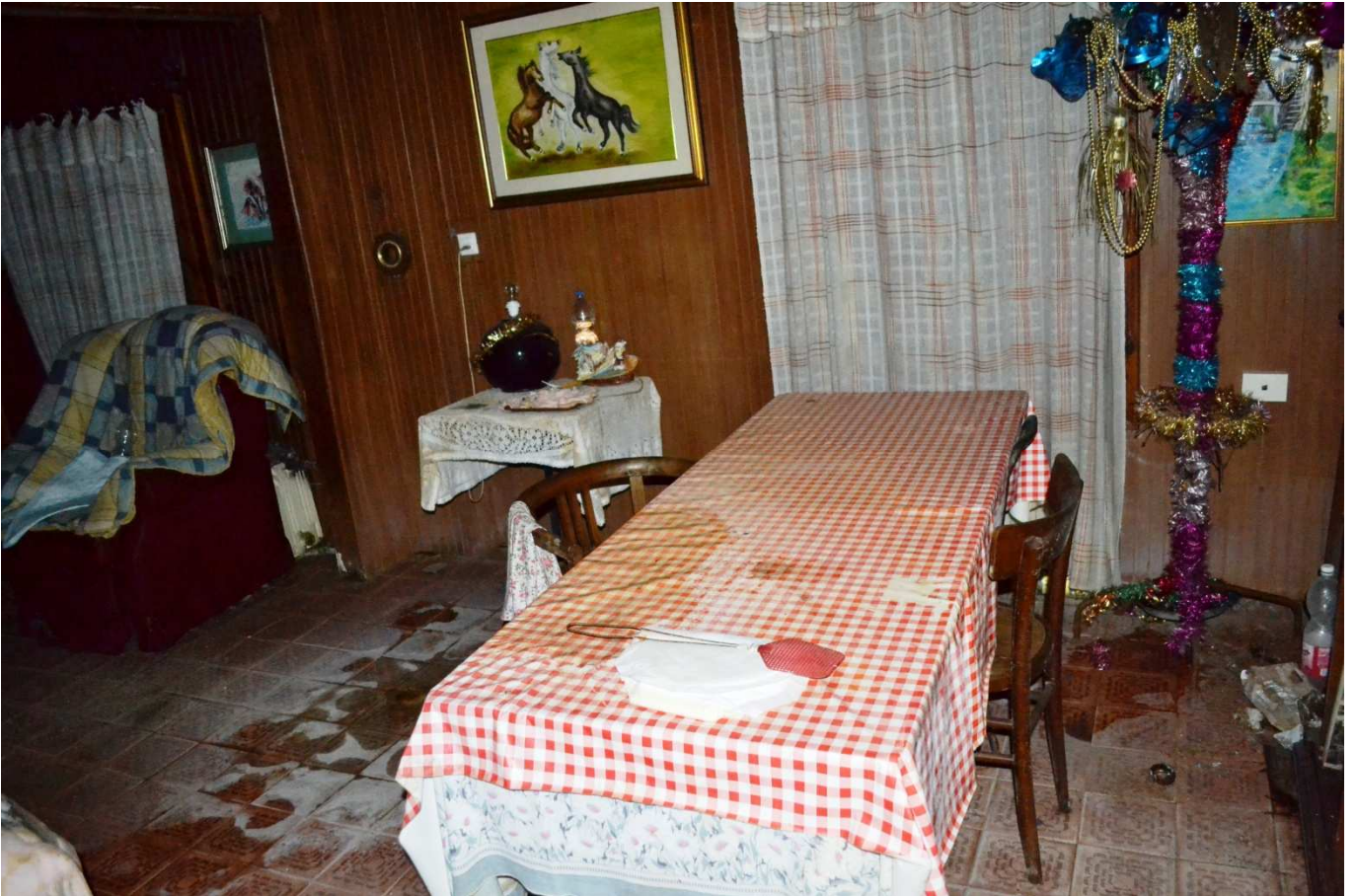
foto 21 - Edificio in via Roma n. 77-79-81, piano 1°, ingresso/soggiorno - visto dalla zona ingresso

EDIFICIO IN VIA ROMA n. 77-79-81 – PIANO PRIMO, abitazione - zona giorno