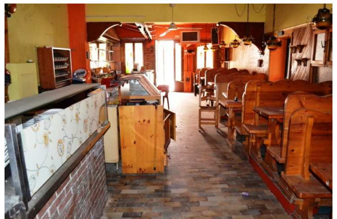
foto 20 - Scorcio interno della sala sud visto da nord