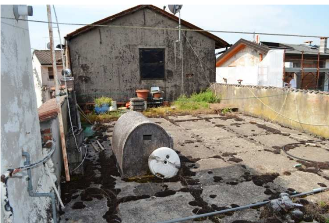
foto 34 - La terrazza con l'accesso al sottotetto sud