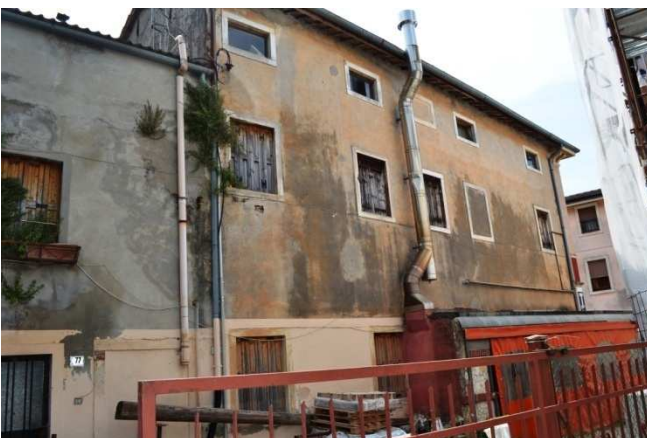
foto 7 - Scorcio del fianco ovest dell'edificio