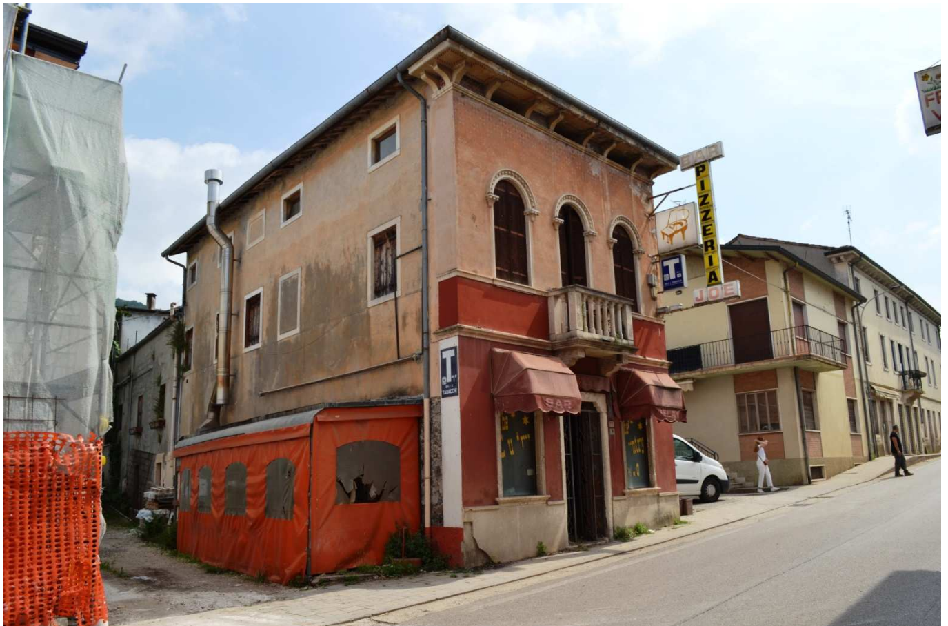
foto 3 - Scorcio del prospetto ovest e prospetto sud dell'edificio in via Roma n. 77-79-81 a Roncà