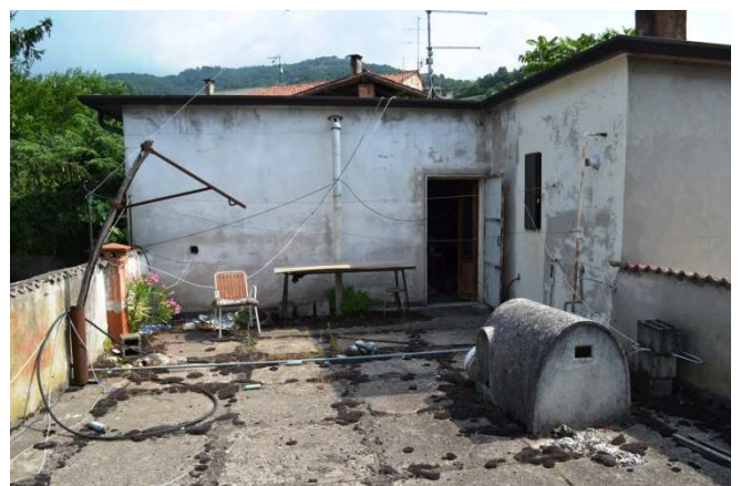
foto 35 - La terrazza centrale con l'ingresso a nord