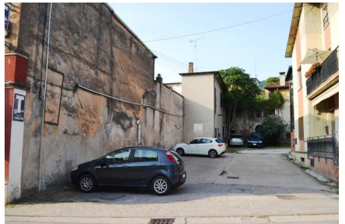
foto 6 - Vista del parcheggio m.n. 254 e del fianco est