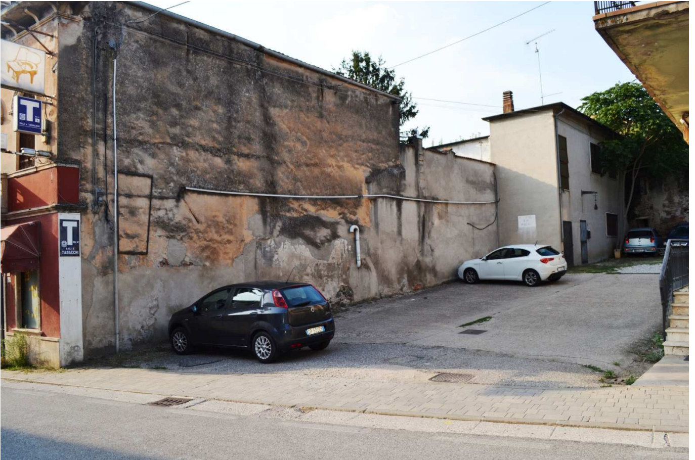
foto 9 - Edificio in via Roma n. 77-79-81 - fianco est e parcheggio del bar/pizzeria visti da sud ovest