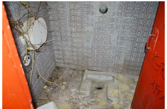
foto 18 - Locale servizi visto dall'ingresso