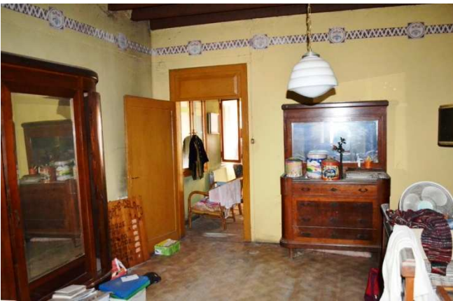
foto 27 - Scorcio interno della stanza da letto 1