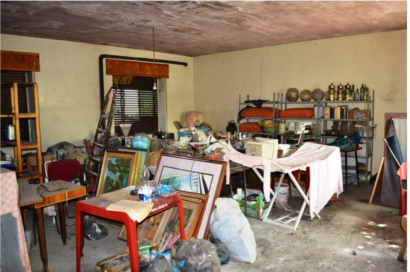
foto 31 - Edificio in via Roma n. 77-79-81, piano 1° parte nord, stanzone caposcala (soffitta)