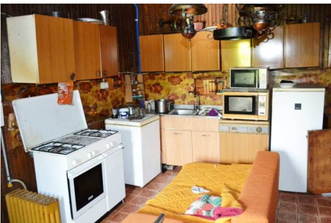
foto 24 - Vista dall'interno della cucina pranzo