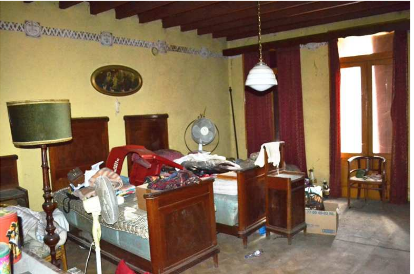
foto 26 - Edificio in via Roma n. 77-79-81, piano 1° parte sud, stanza da letto 1 - vista dall'ingresso

EDIFICIO IN VIA ROMA n. 77-79-81 - PIANO PRIMO, abitazione - zona notte