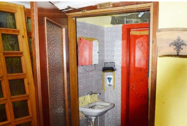
foto 17 - Ingresso del locale servizi con lavandino