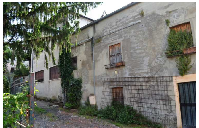
foto 13 - Scorcio ovest della parte nord e centrale