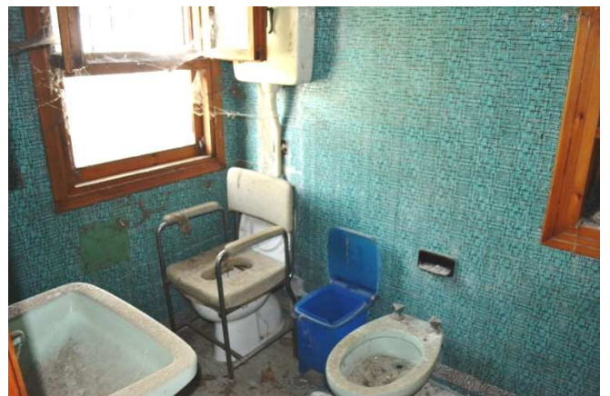
foto 25 - Scorcio interno del bagno dell'abitazione