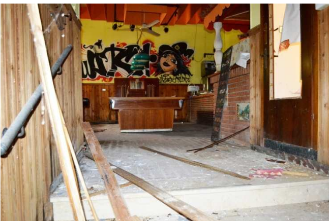
foto 19 - Scorcio della sala nord visto dalla scalinata