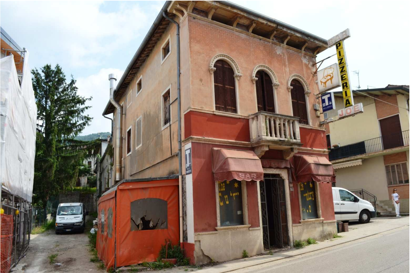
foto 4 - Prospetto sud dell'edificio con l'ingresso del bar/pizzeria in via Roma civ. 79 visto da sud ovest