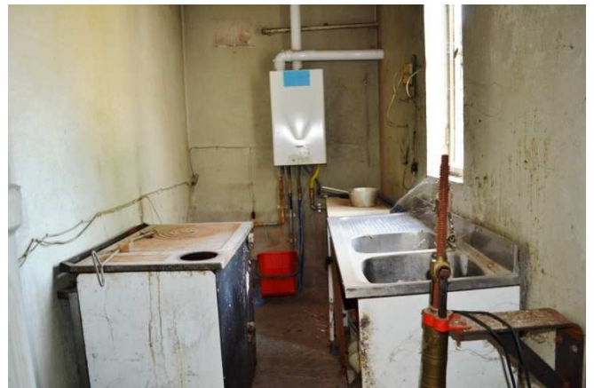
foto 33 - Il locale con la caldaia sopra il vano scala