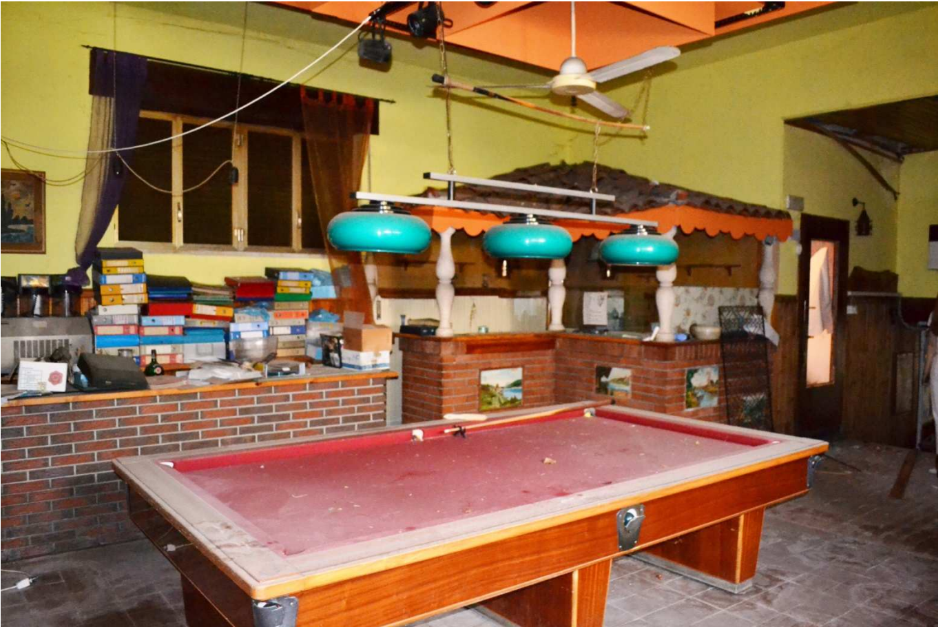
foto 16 - Edificio in via Roma n. 77-79-81, piano terra, sala nord con biliardo vista da nord ovest