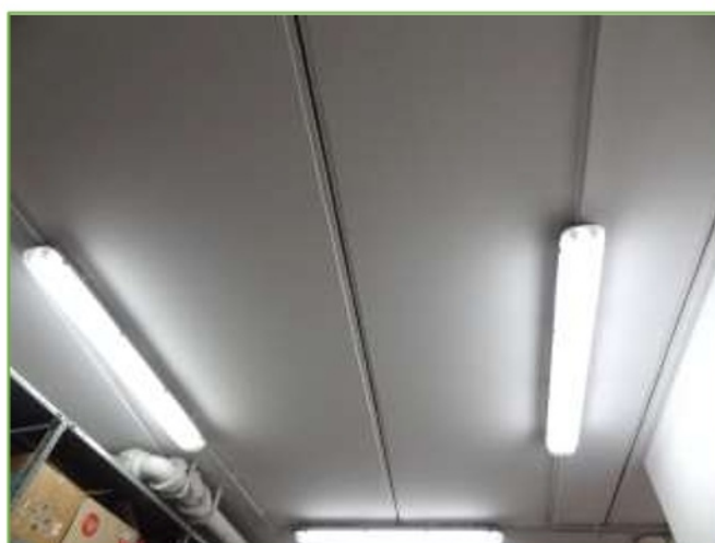
Foto n° 56: particolare del solaio delle cantine in lastre predalles