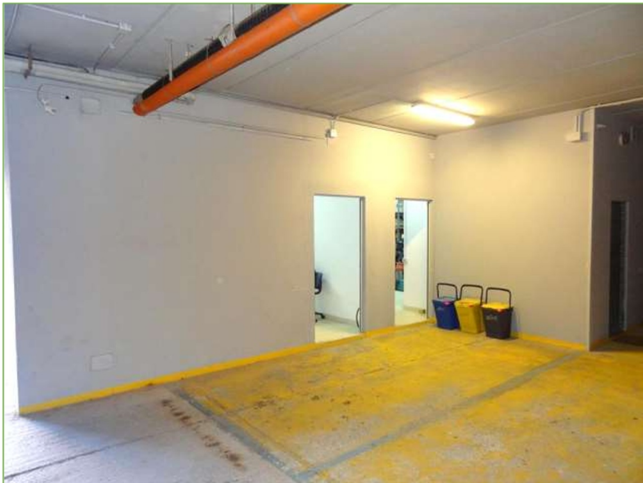
Foto n° 49: Posto auto nell'autorimessa al piano interrato (sub. 34) adiacente all'accesso alle due cantine (subb. 93-94)