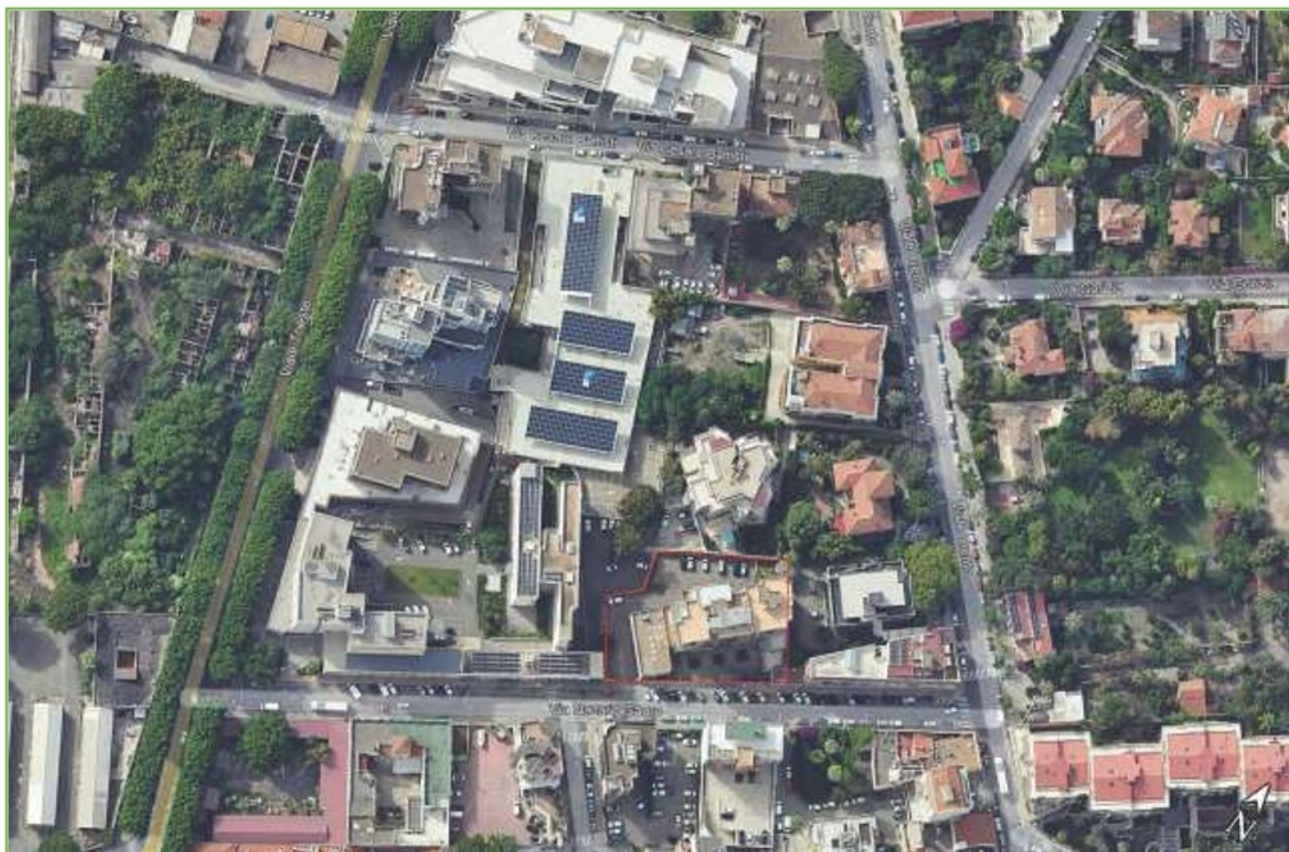
Foto n° 1: Vista aerea della zona in cui sono ubicati gli immobili oggetto della valutazione