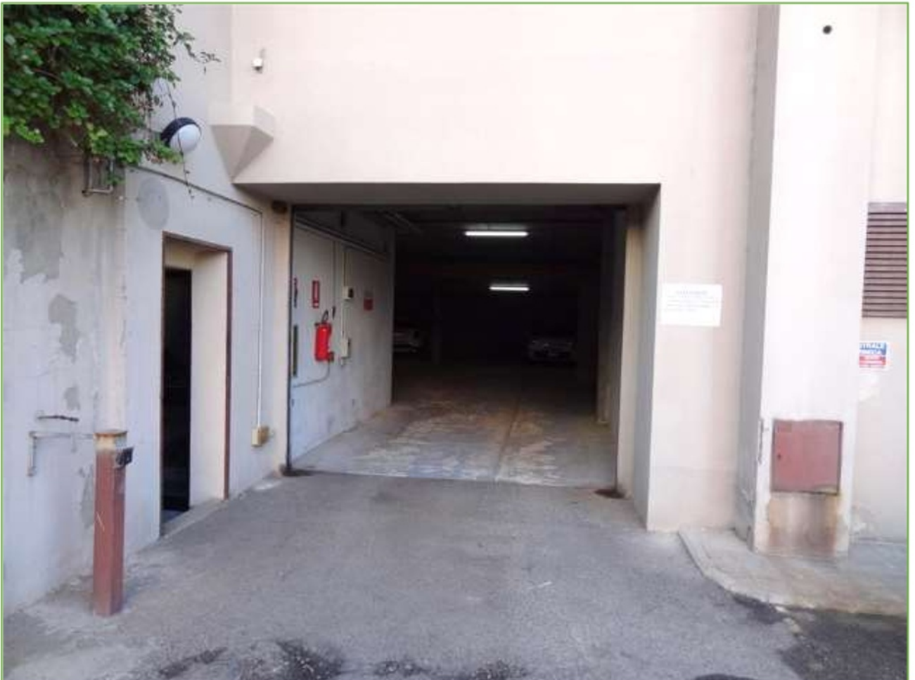
Foto n° 48: Rampa di accesso al piano seminterrato, protetta con serranda metallica elettrica