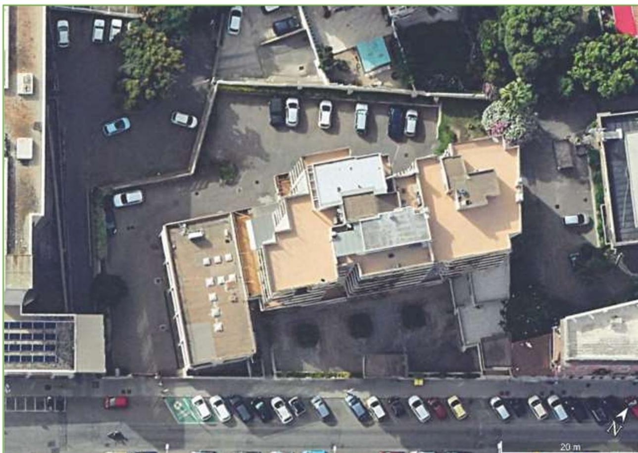
Foto n° 2: Vista aerea del fabbricato in cui sono ubicati gli immobili oggetto della valutazione