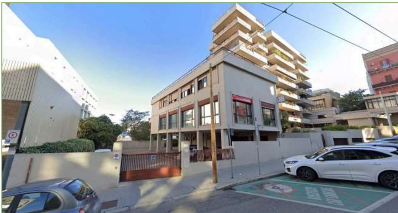
Foto n° 4: accesso carrabile dal civico n. 13 della via Nazario Sauro