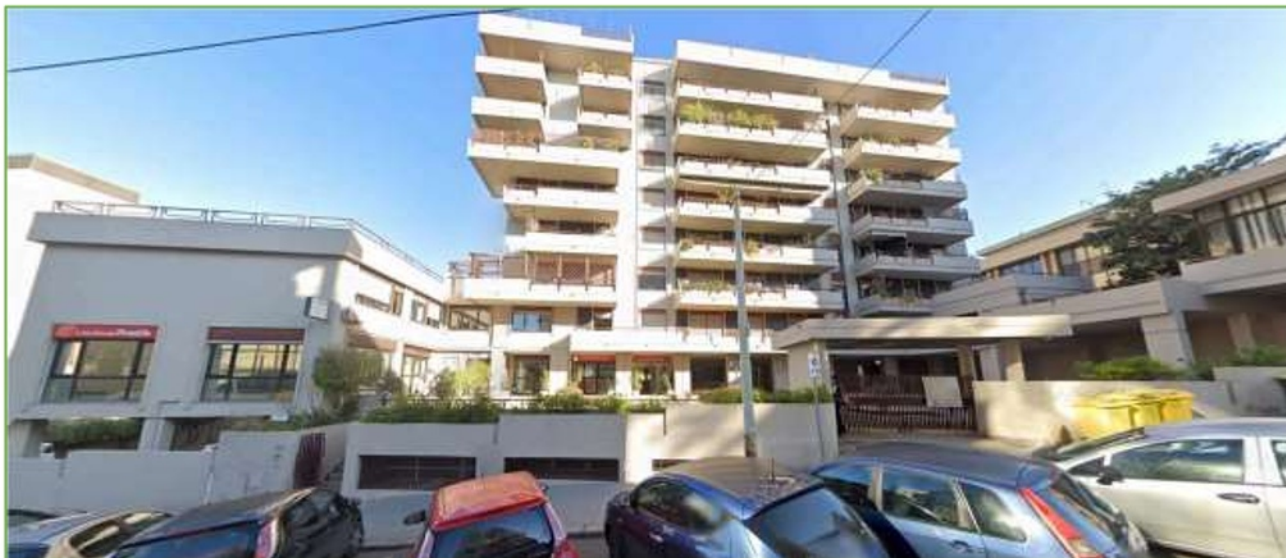
Foto n° 3: prospetto principale del fabbricato (accesso pedonale dal civico n. 9 della via Nazario Sauro)