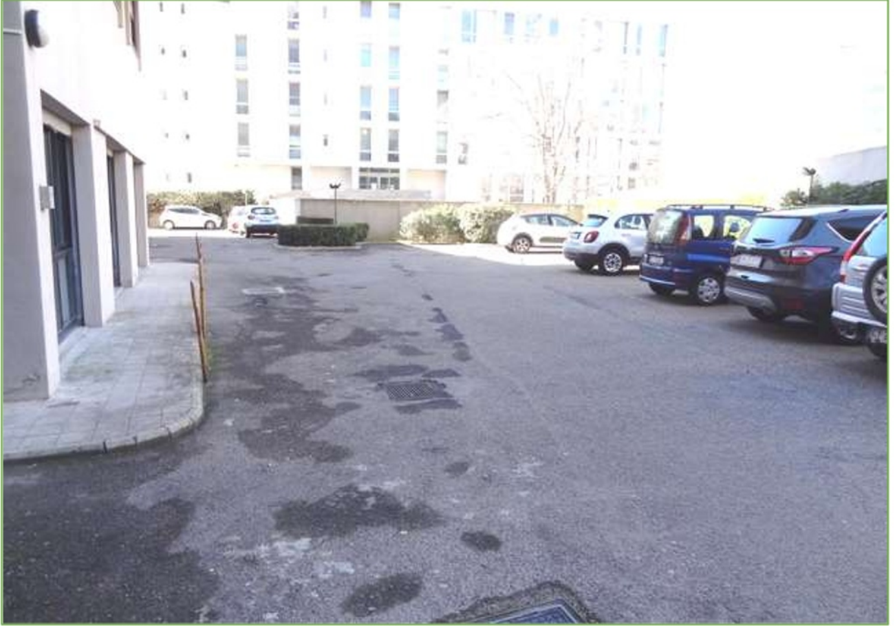
Foto n° 47: Cortile condominiale posteriore per accesso al piano seminterrato