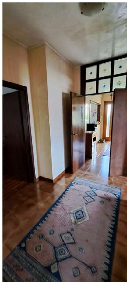
20_corridoio zona notte