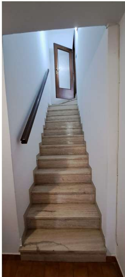
28_scala a piano scantinato