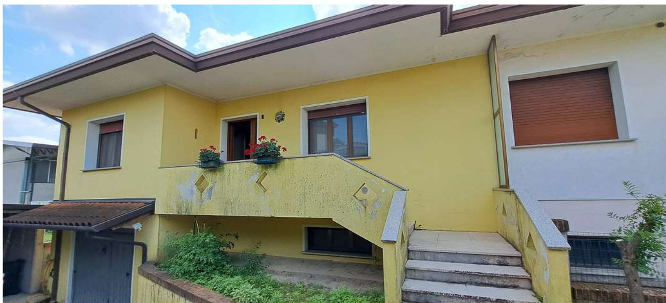
9_ingresso lato nor est