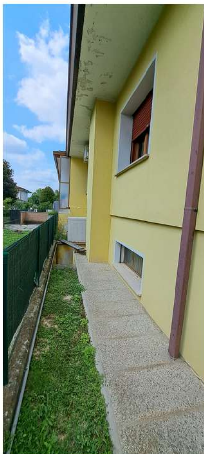
6_lato sud ovest