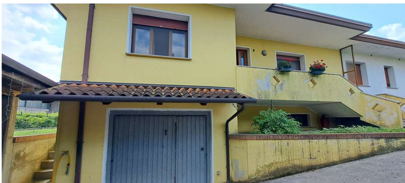
4_lato nord est