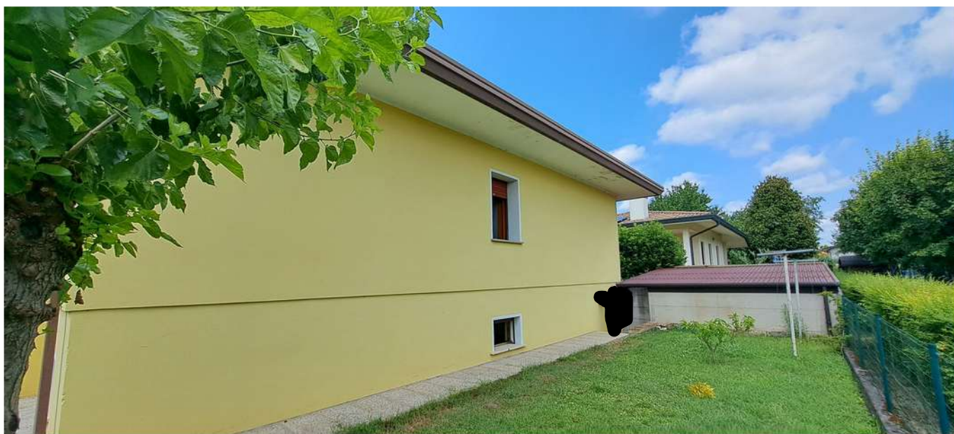
5_lato sud est