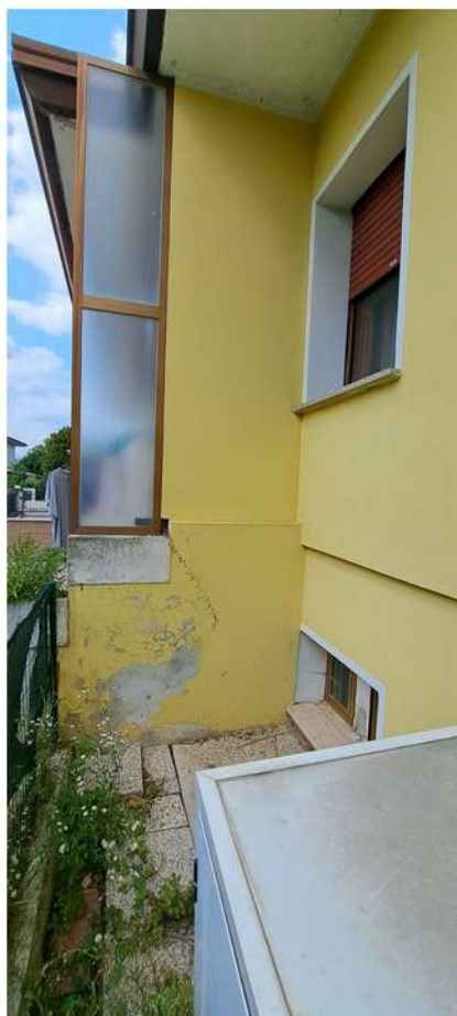
12_lato CT confine