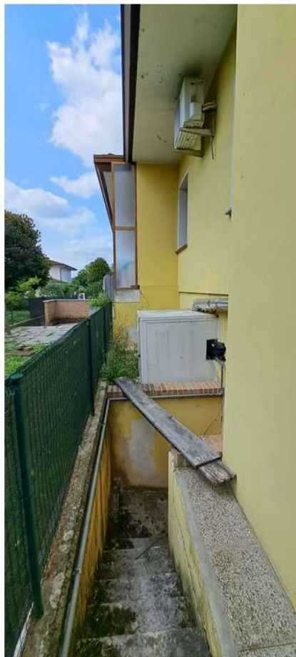
7_lato sud ovest CT