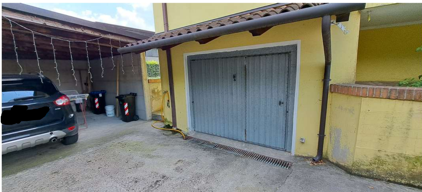
11_ accesso autorimessa