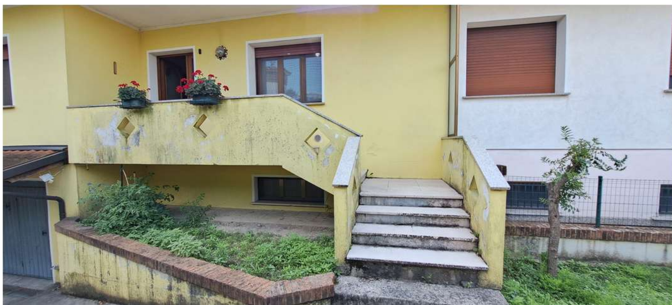
10_scala esterna accesso