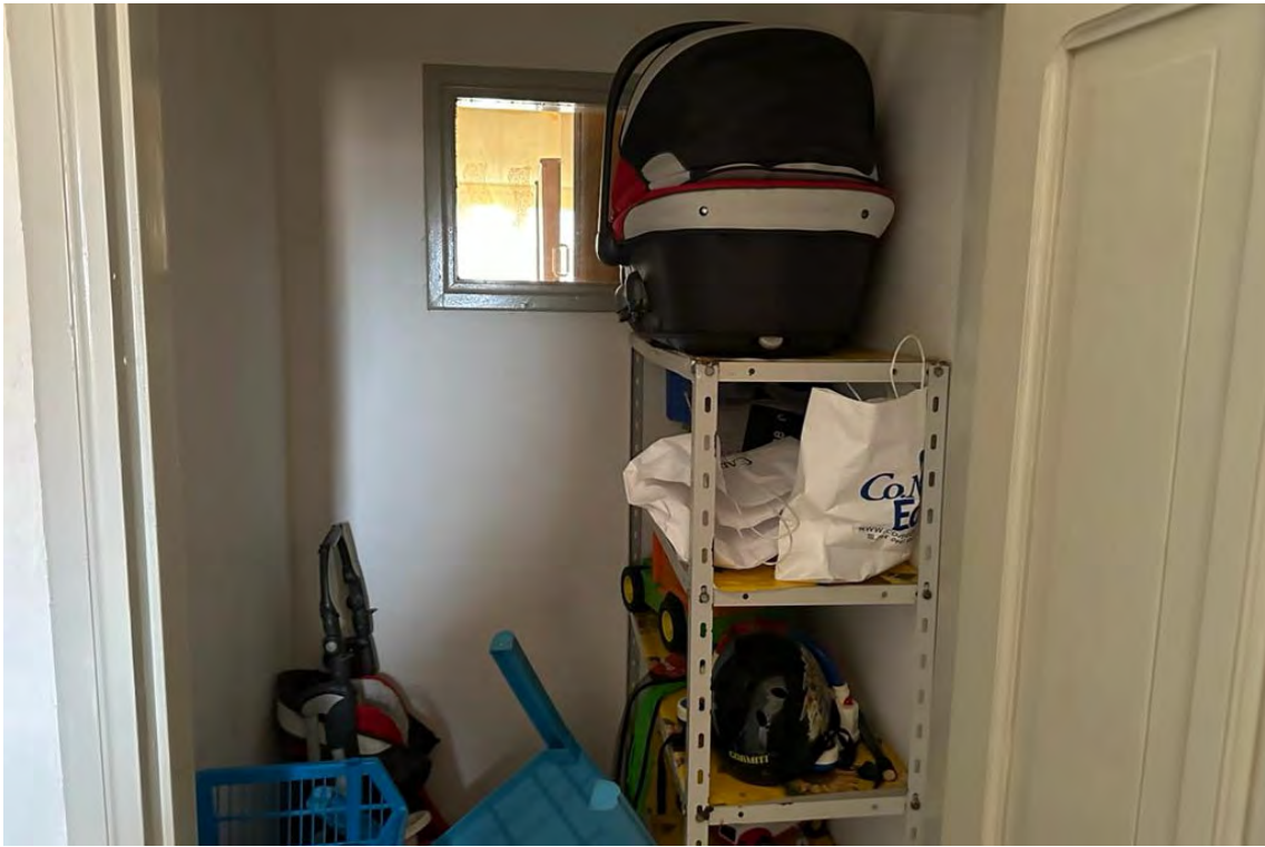
Foto n.5 Ripostiglio