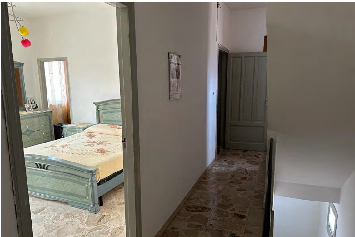
Foto n.6 Corridoio