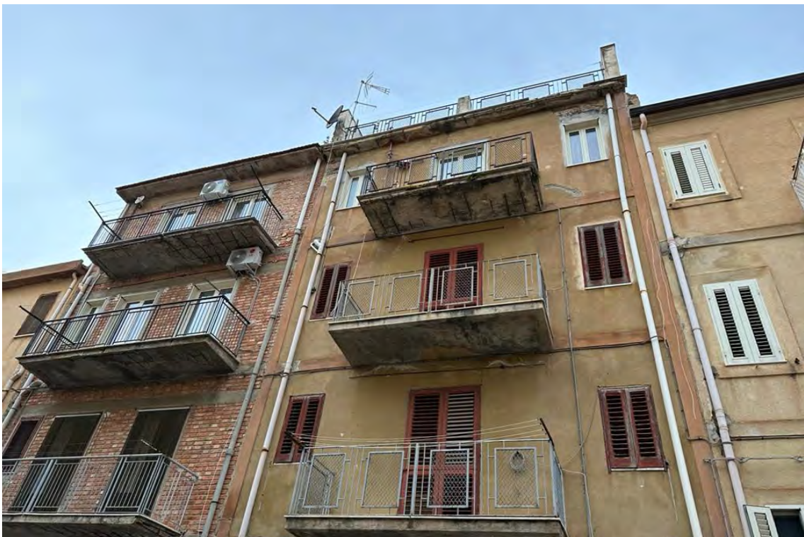
Foto n.2 Prospetti esterni