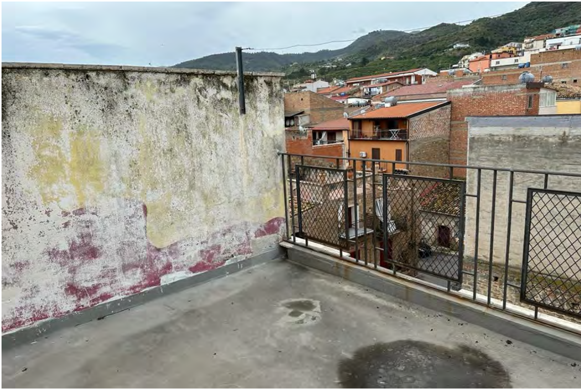
Foto n.13 Terrazzo