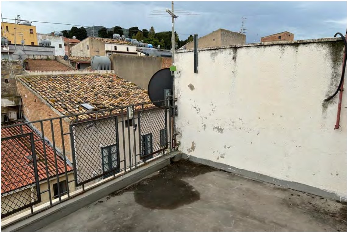
Foto n.17 Terrazzo