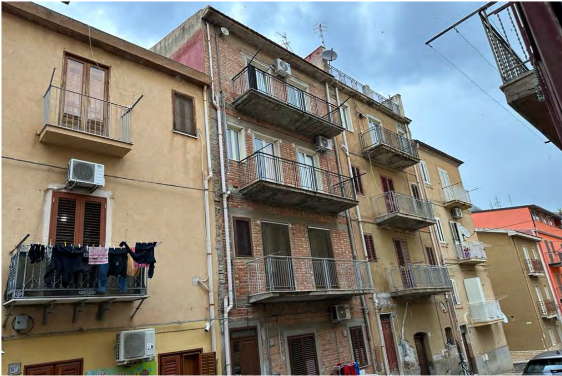
Foto n.1 Prospetti esterni