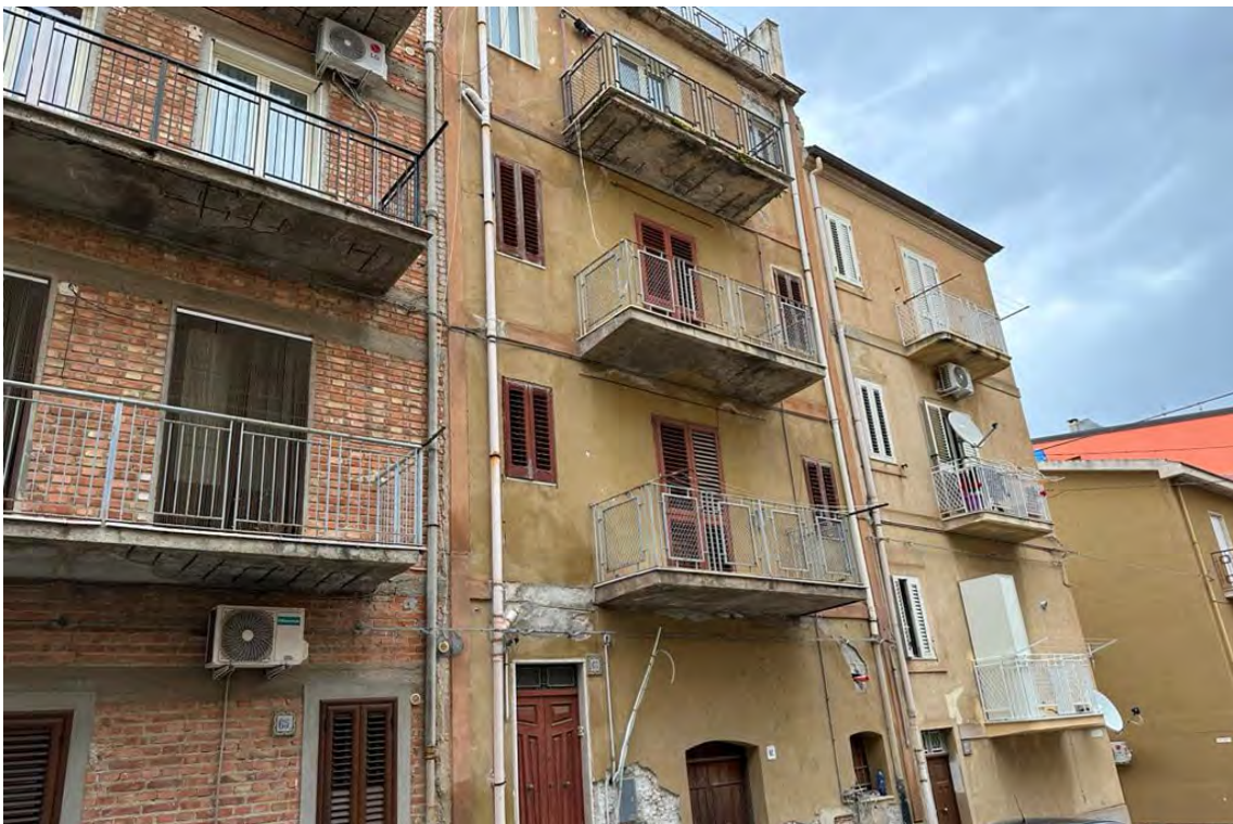
Foto n.4 Prospetti esterni