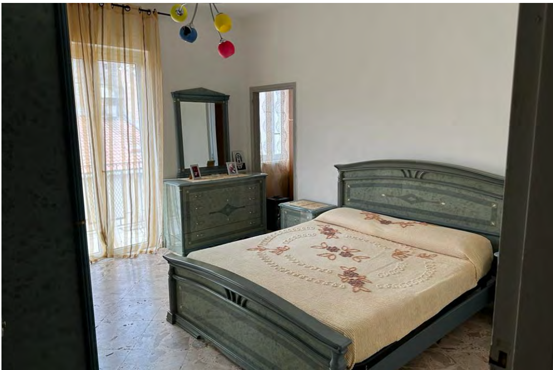
Foto n.12 Camera