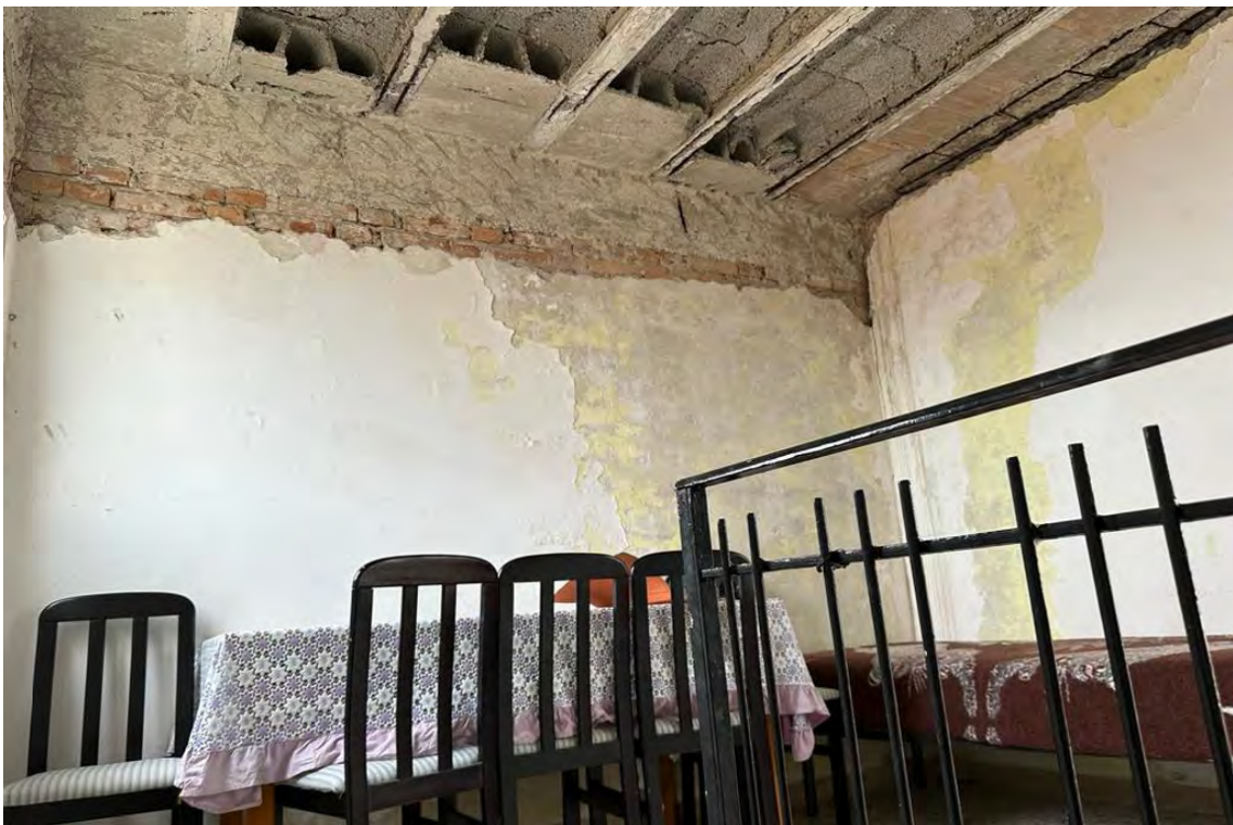
Foto n.14 Soggiorno al 4 piano