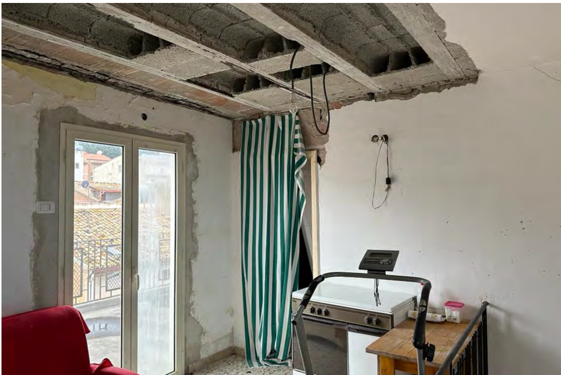
Foto n.16 Soggiorno al 4 piano