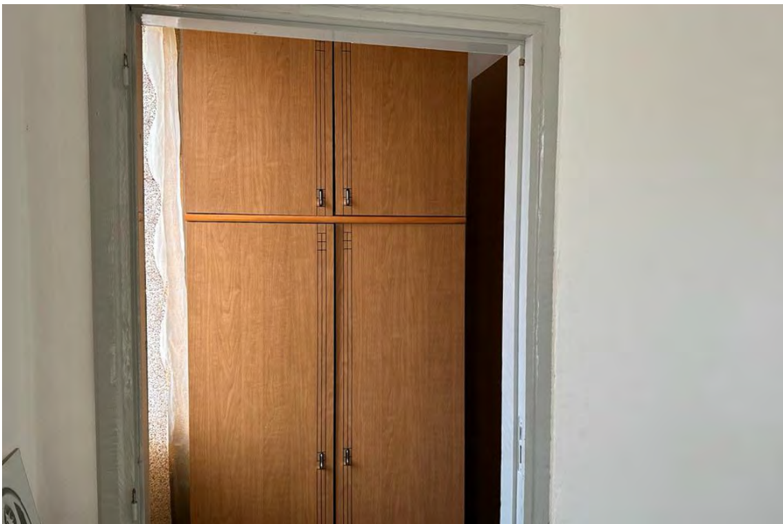
Foto n.8 w.c.-Ripostiglio