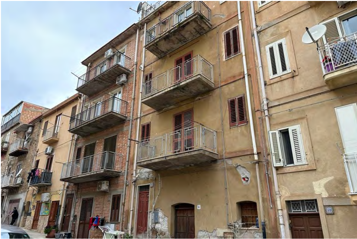
Foto n.3 Prospetti esterni