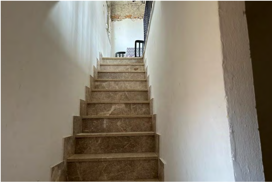
Foto n.9 Scala di collegamento fra i piani