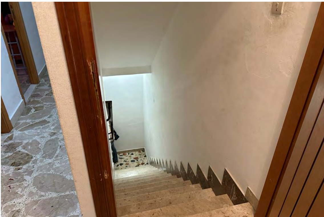
Foto n.10 Scala di collegamento fra i piani