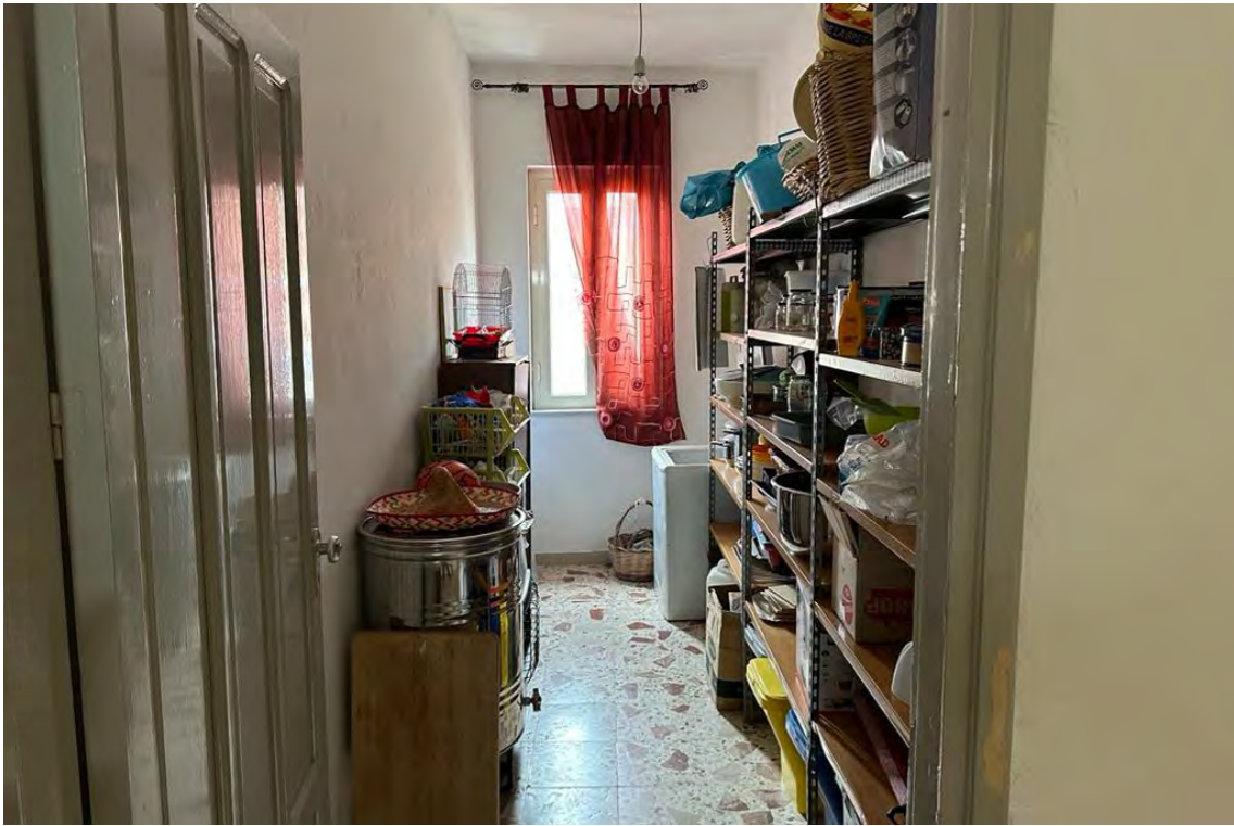
Foto n.11 Ripostiglio