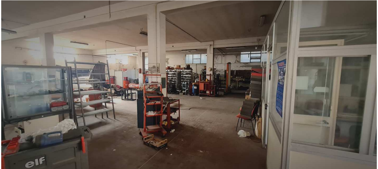
Figura 11 - Vista interna dall'ingresso