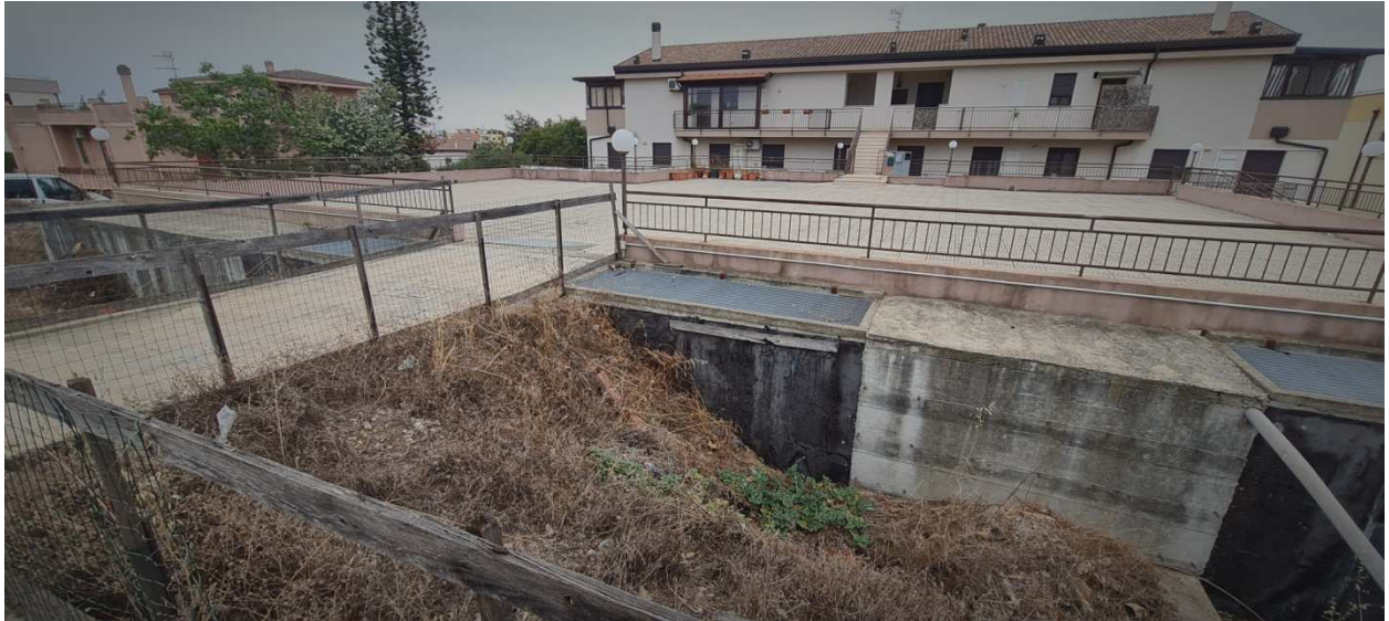
Figura 5 - Vista esterna del fabbricato dall'area a parcheggio posteriore, con sovrastante area pedonale