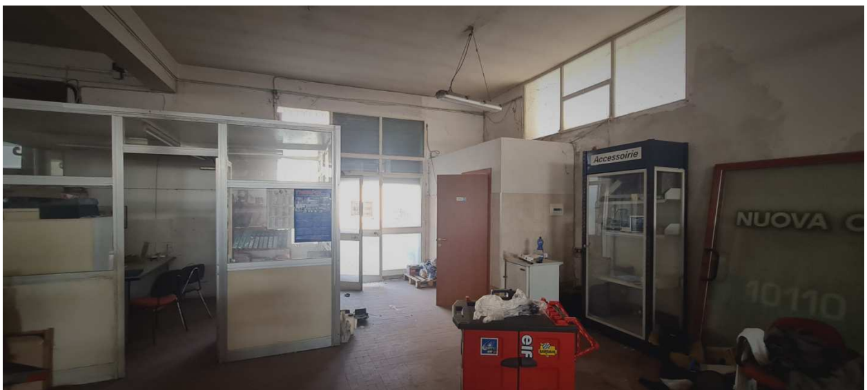
Figura 10 - Ingresso dell'immobile (sulla DX i servizi igienici)