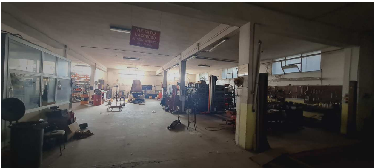
Figura 13 - Vista interna da altra angolazione