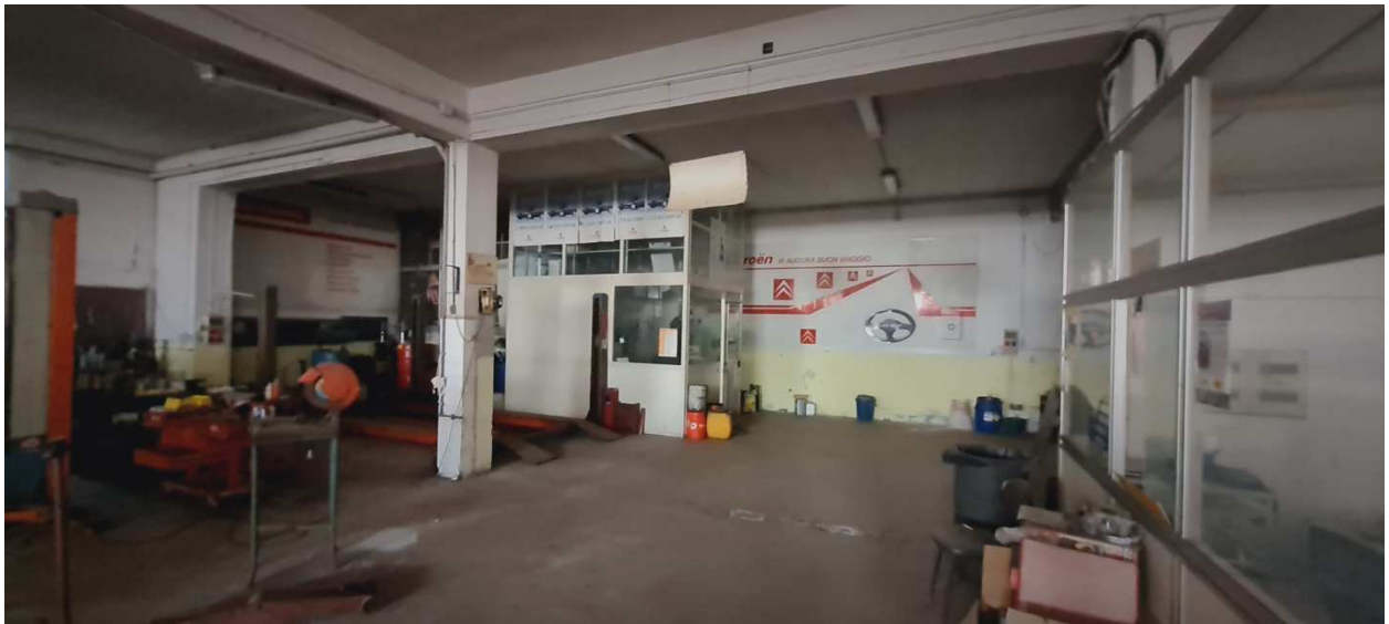
Figura 12 - Zona ufficio/archivio