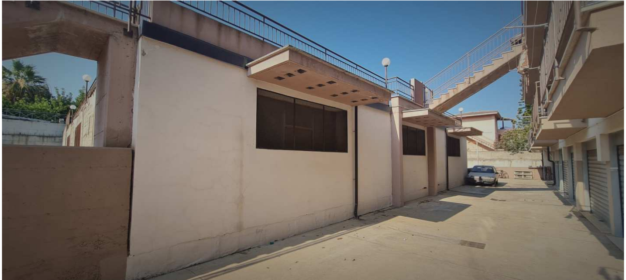
Figura 8 - Prospetto anteriore (parallelo a Viale Salerno)