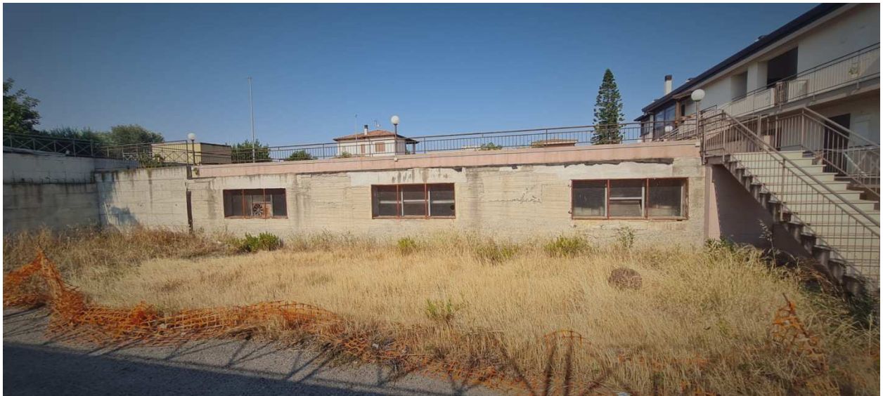
Figura 9 - Prospetto laterale sinistro