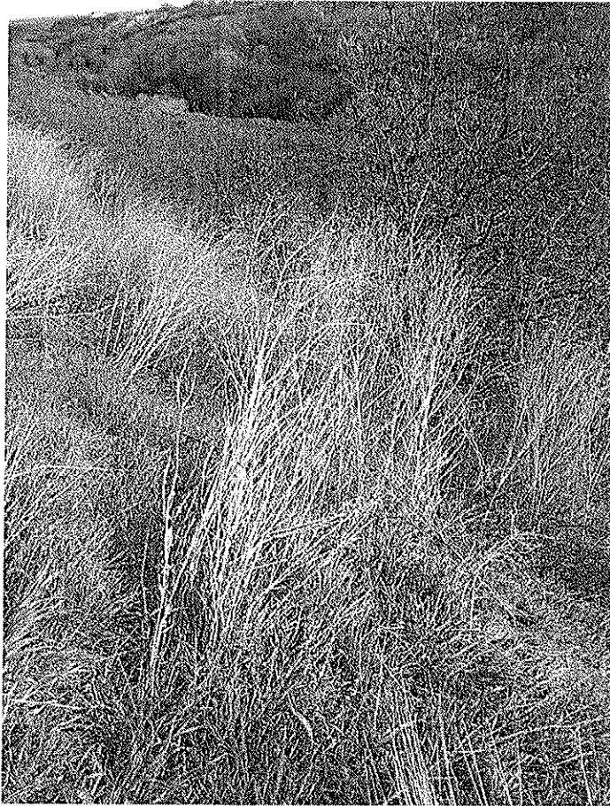
Particella foglio 13 n.12