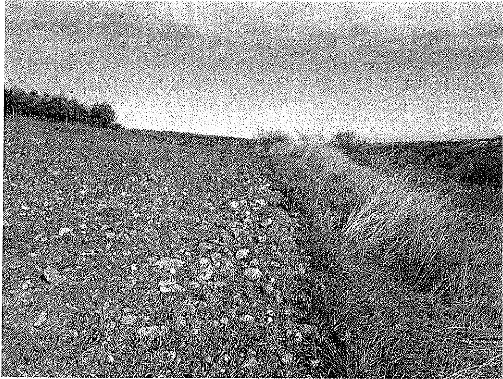
Particella foglio 13 n.11