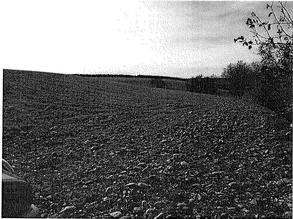
Particella foglio 13 n.11