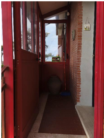
FOTO 3 - VISTA ESTERNA SU INGRESSO