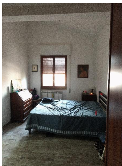
FOTO 5 - VISTA INTERNA ABITAZIONE