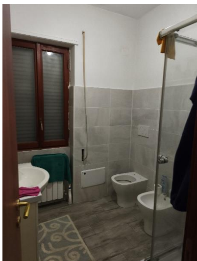
FOTO 6 - VISTA INTERNA ABITAZIONE