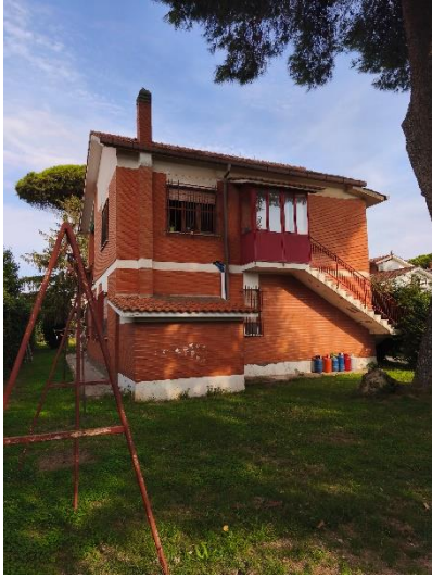
FOTO 1 -VISTA ESTERNA