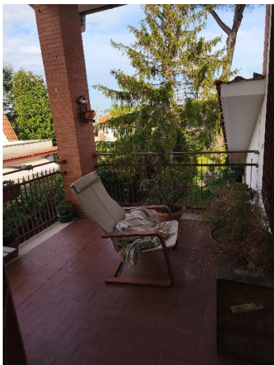
FOTO 4 - VISTA ESTERNA SU TERRAZZO