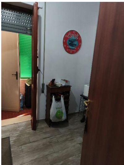
FOTO 7 -VISTA INTERNA ABITAZIONE