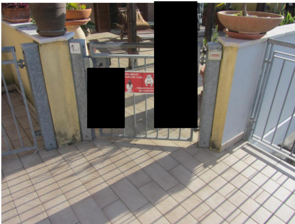
FOTO 1.13_scoperto esclusivo_frente