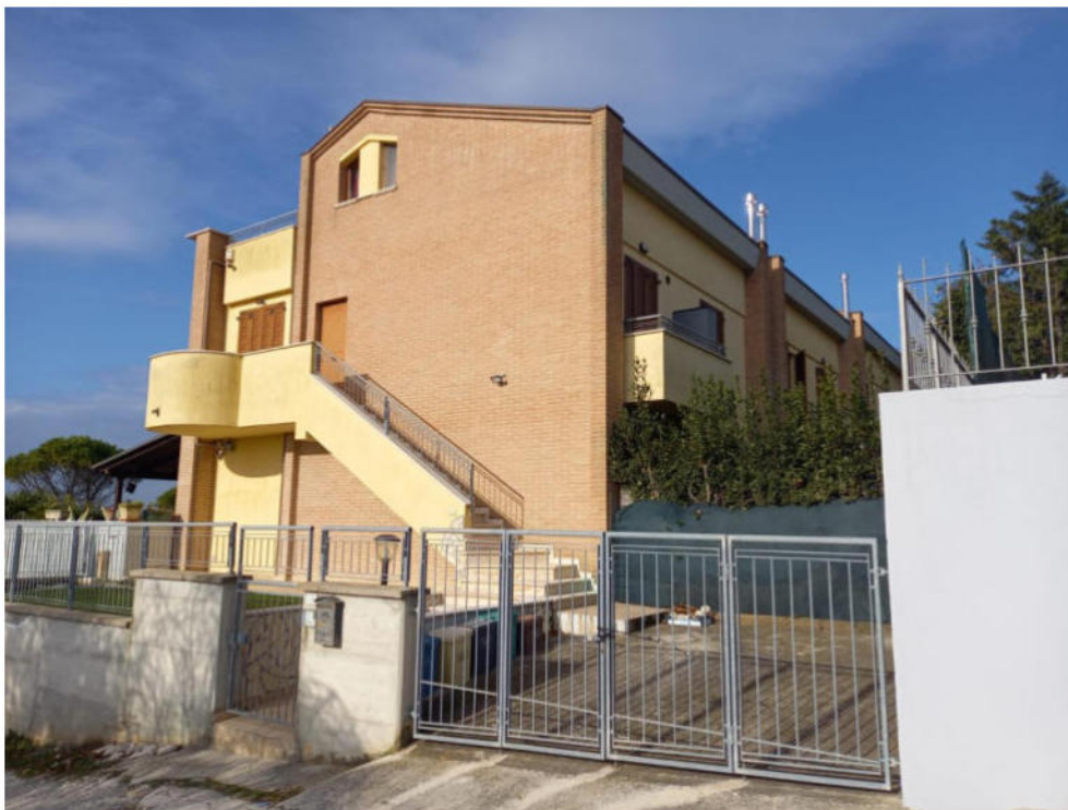
FOTO E.01_ Prospetto laterale/retro