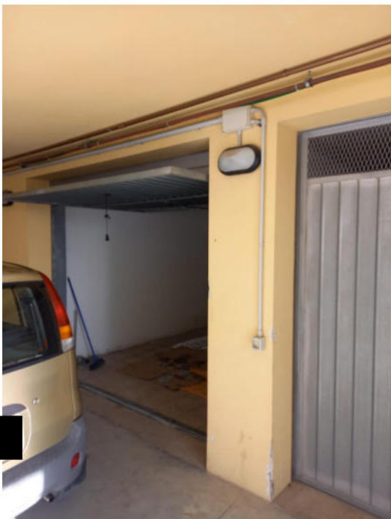
FOTO 1.20_accesso garage