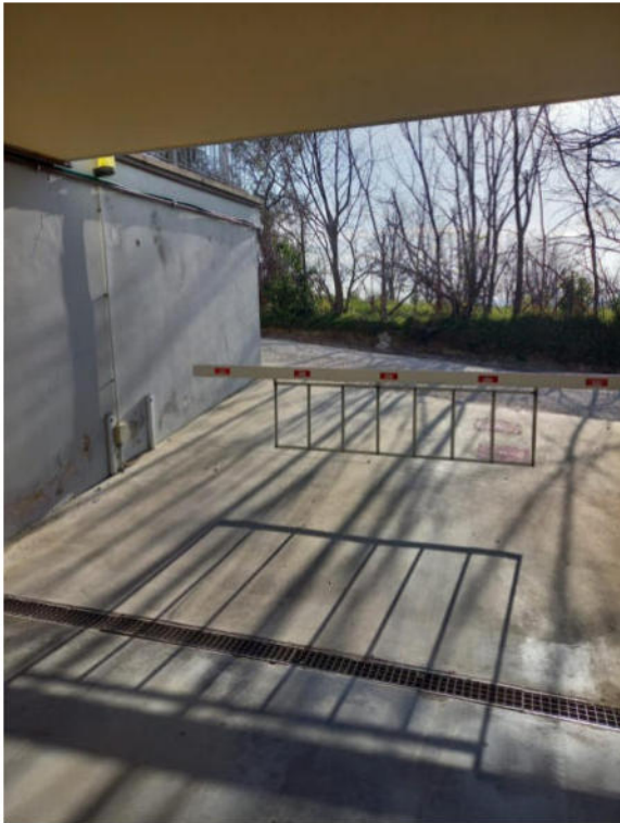
FOTO 1.19_accesso comune garage