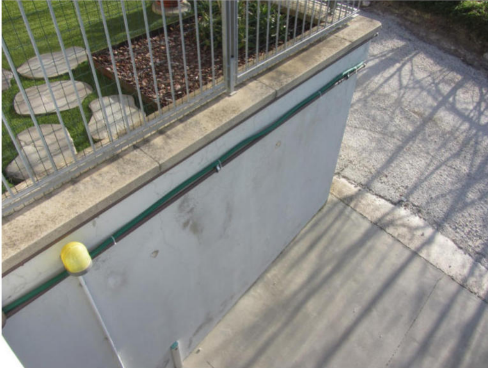
FOTO 1.25_tubo acqua calda