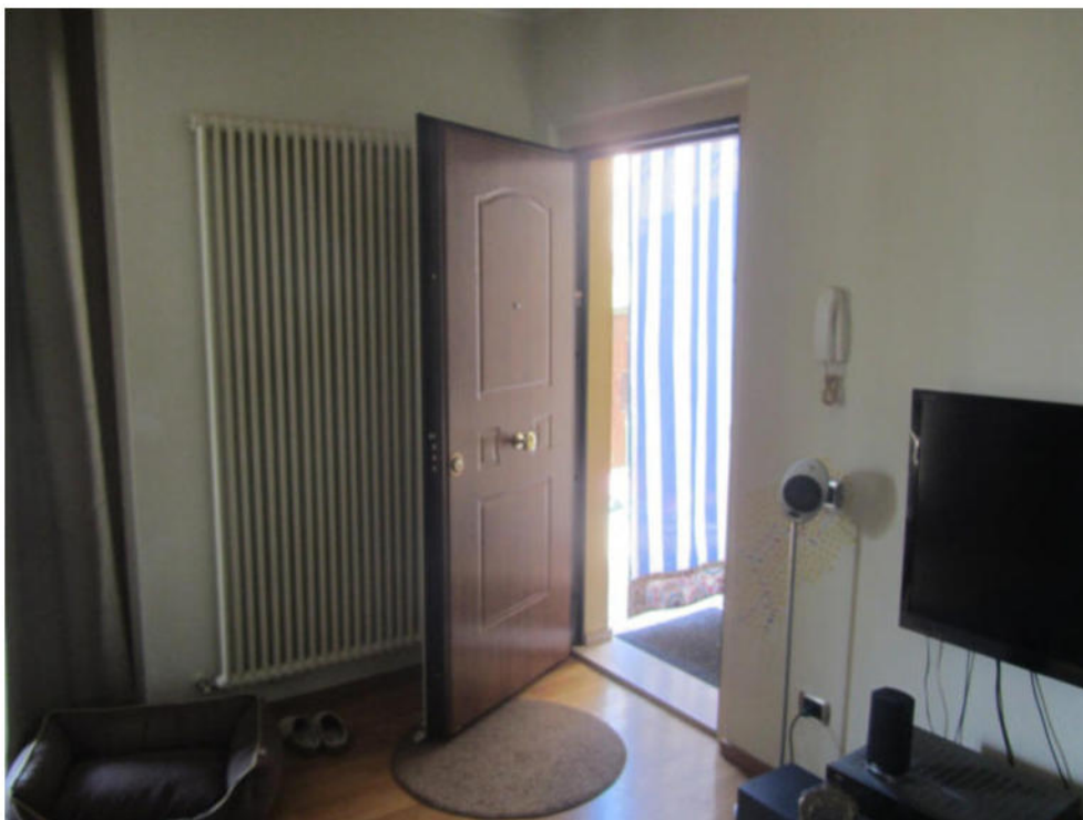
FOTO 1.01_porta d'ingresso