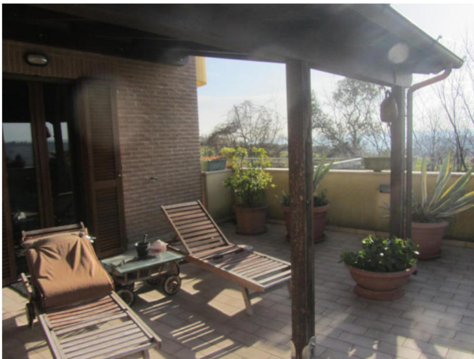
FOTO 1.15_scoperto esclusivo_frente