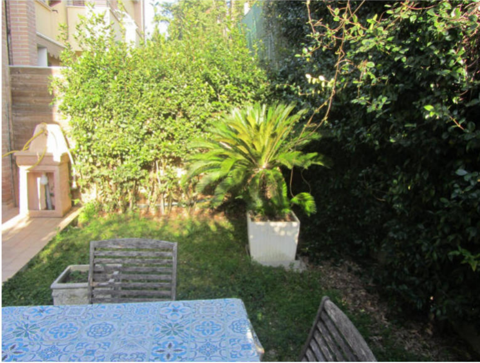
FOTO 1.17_scoperto esclusivo_retro