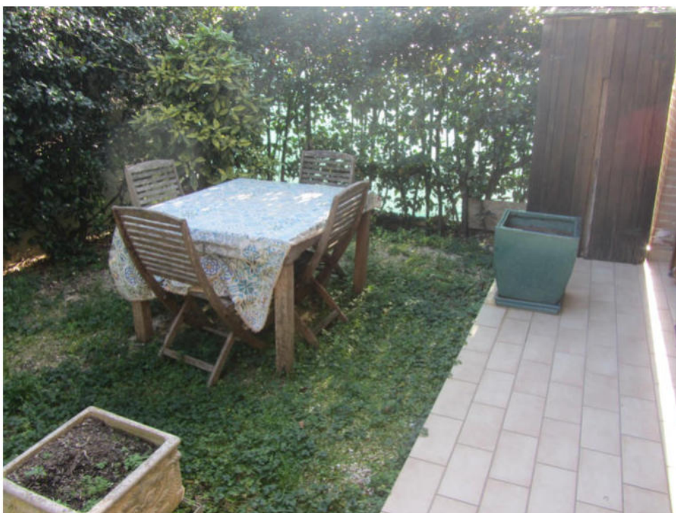
FOTO 1.16_scoperto esclusivo_retro