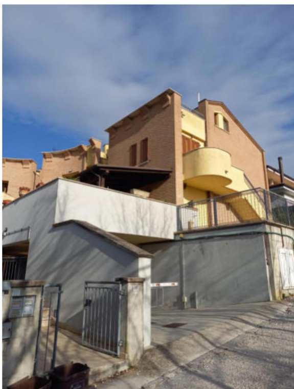
FOTO E.02_ Prospetto fronte/laterale