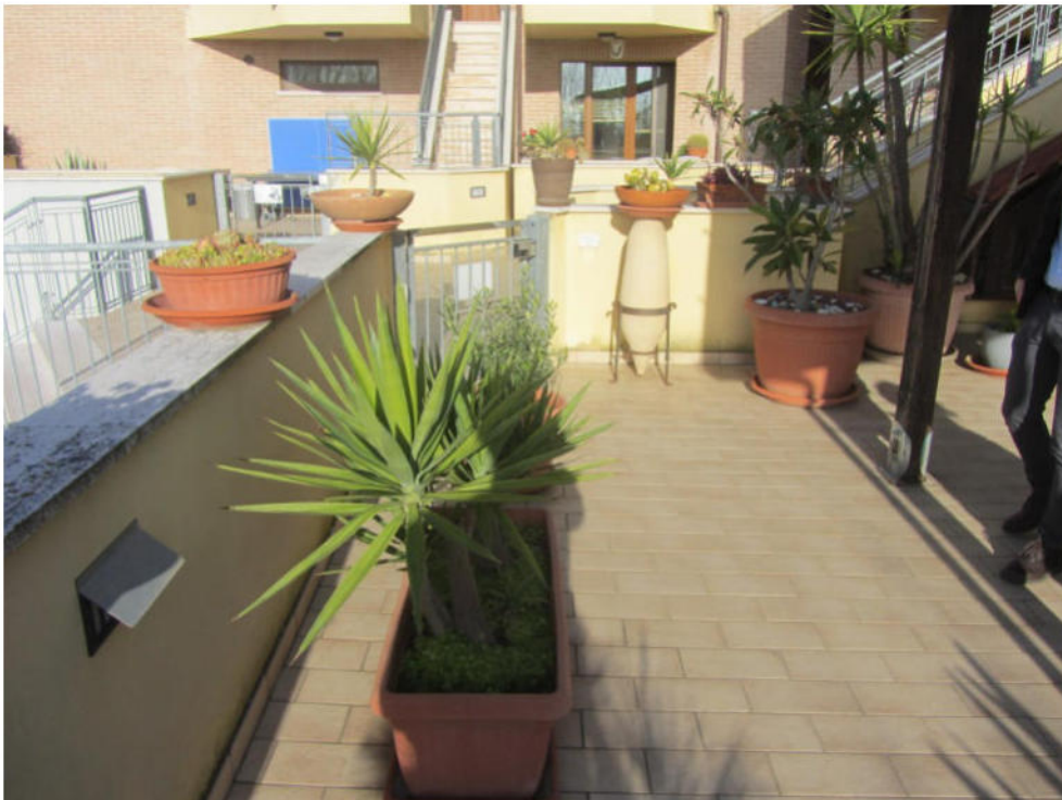
FOTO 1.12_scoperto esclusivo_frente