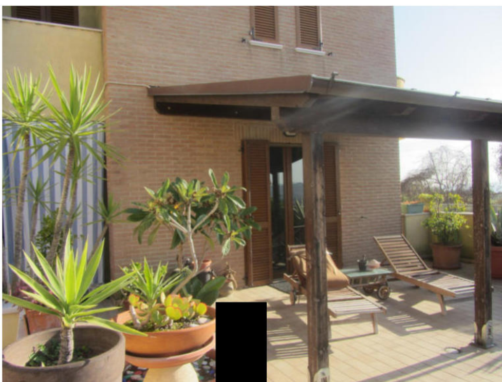
FOTO 1.14_scoperto esclusivo_frente