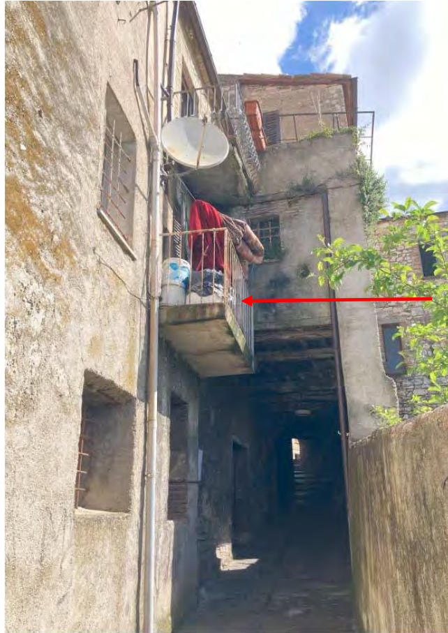
Foto 6 strada di accesso via Franco Storelli