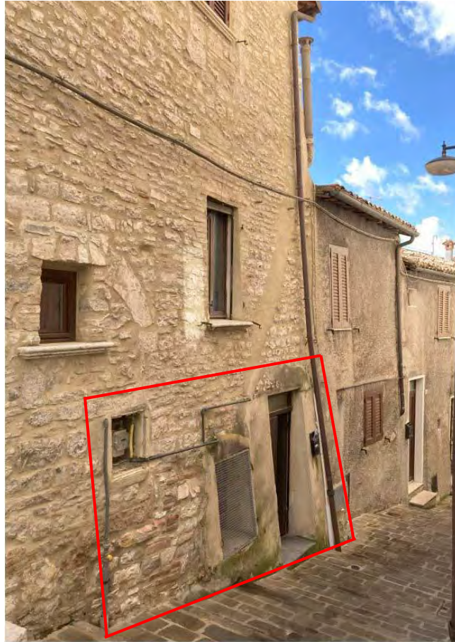
Foto 2 ingresso