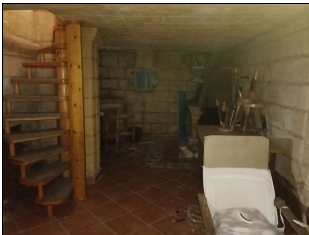
Fot. 2 – Piano interrato–