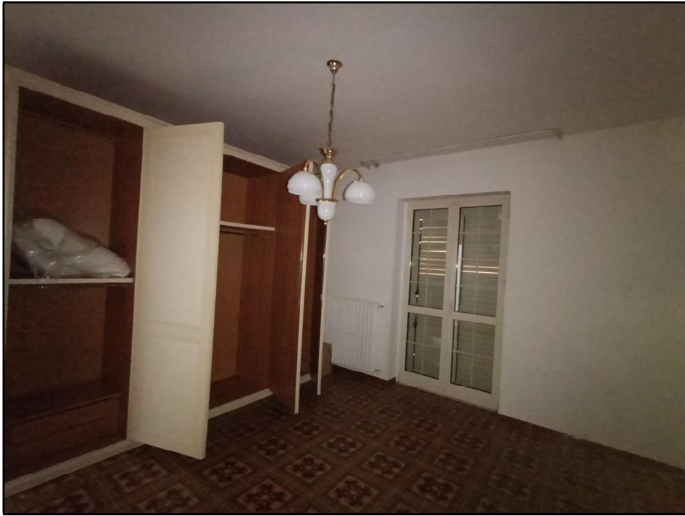
Fot. 9 – Piano primo: camera da letto –