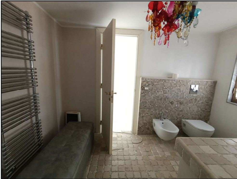
Fot. 11 – Piano secondo: bagno/lavanderia –