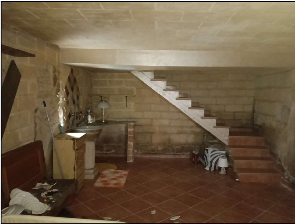
Fot. 3 – Piano interrato –