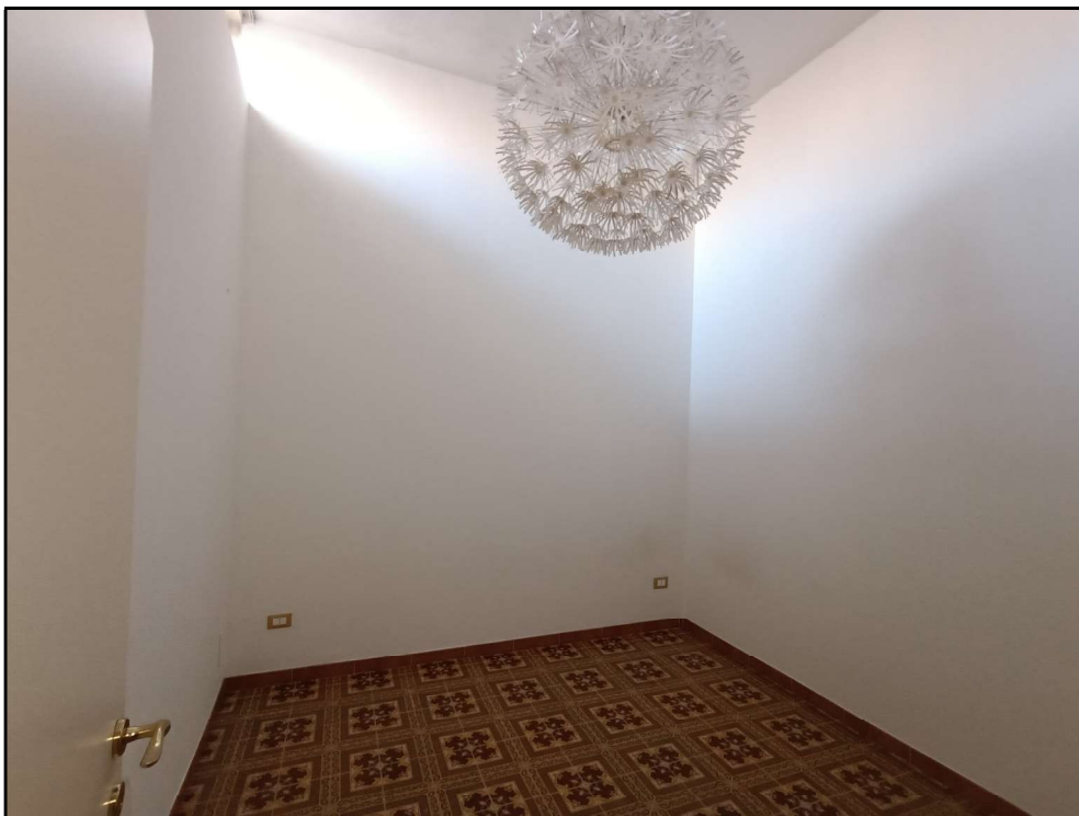
Fot. 8 – Piano primo: camera da letto –