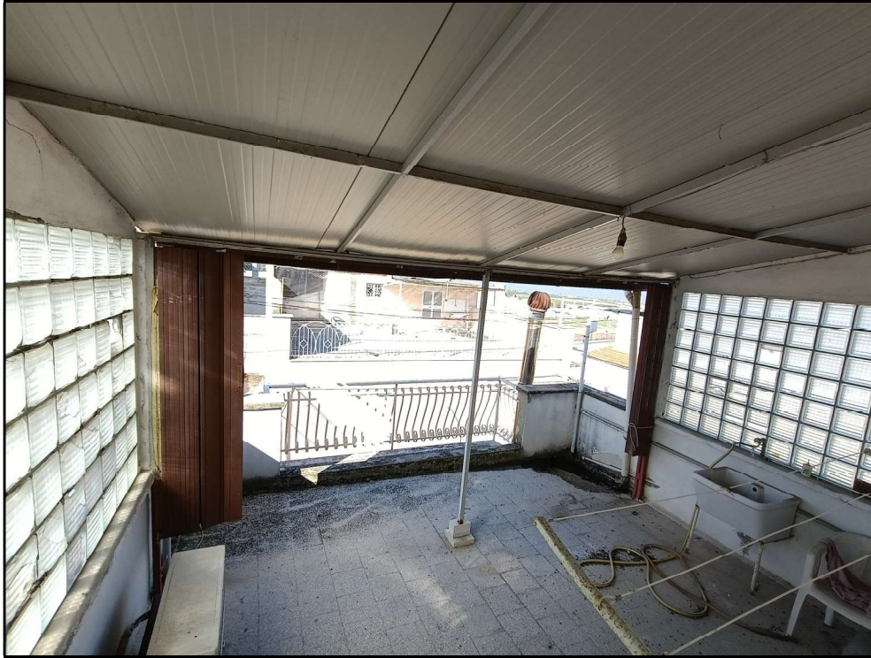
Fot. 13 – Piano secondo: terrazzo –

Canosa di Puglia, li 21/07/2025 – 20/10/2025