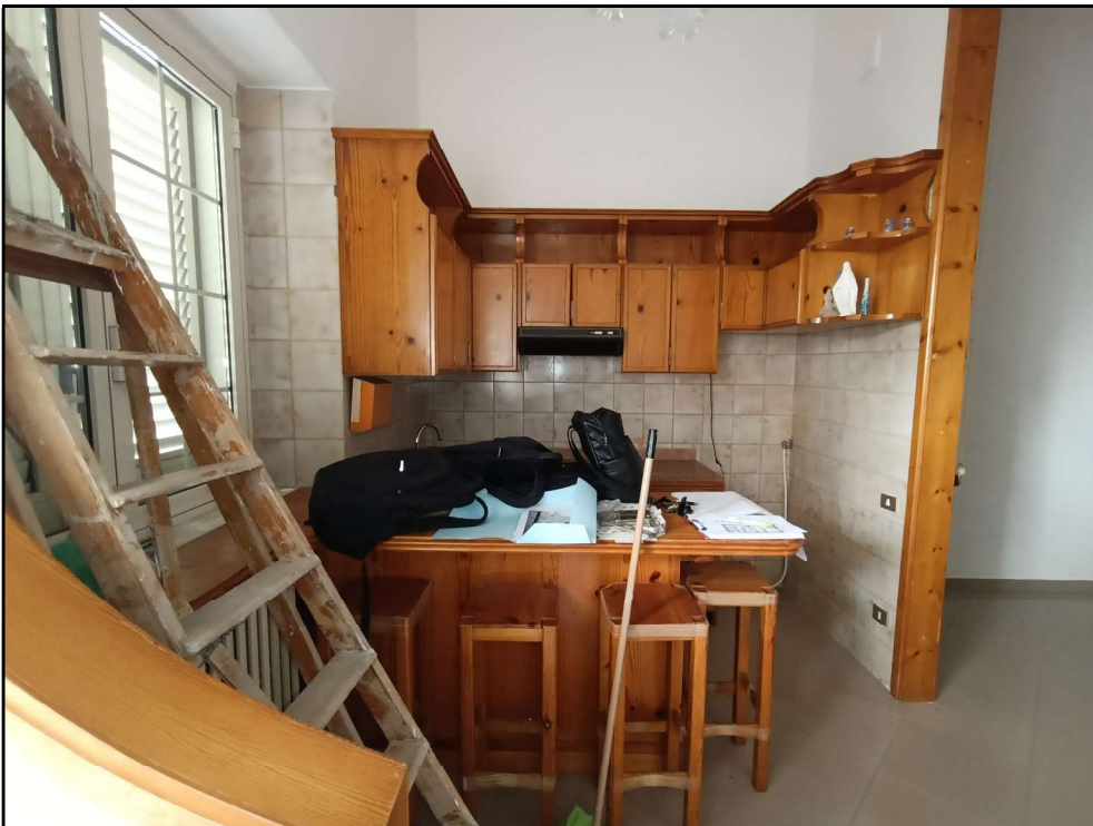
Fot. 4 – Piano terra: cucina –