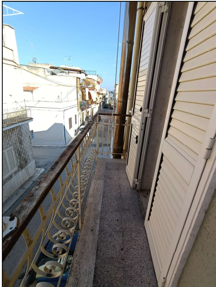
Fot. 10 – Piano primo: balcone –