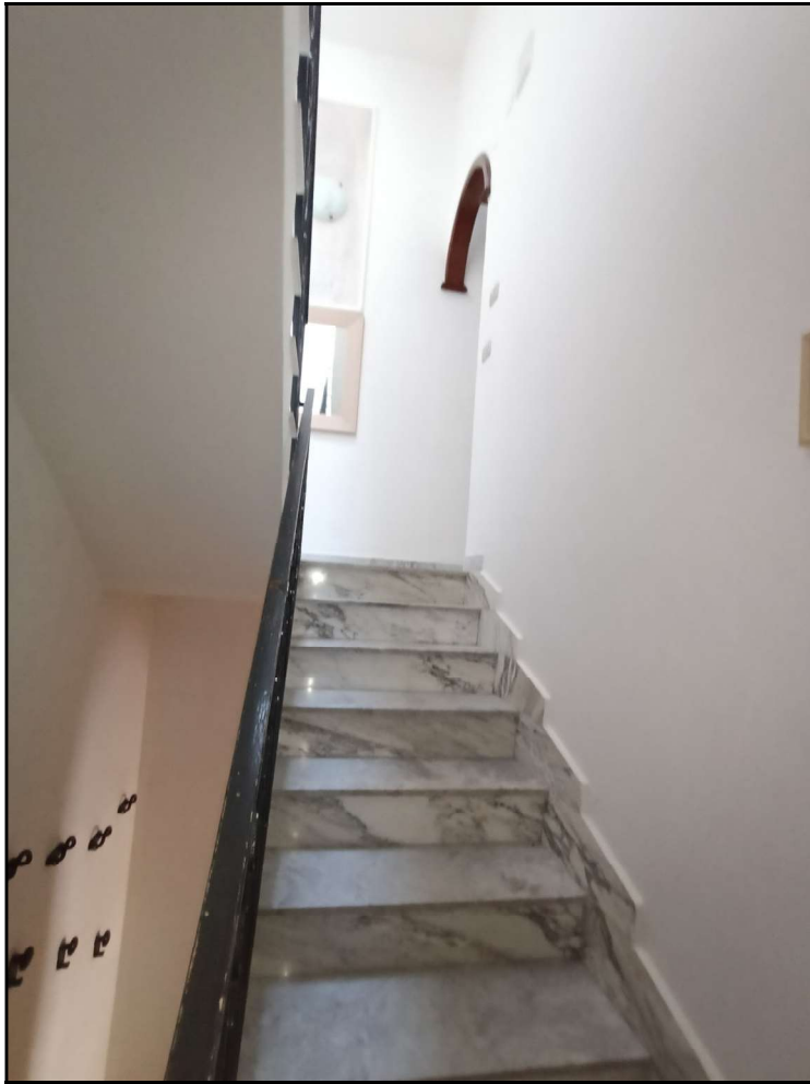
Fot. 7 – Vano scala interno –