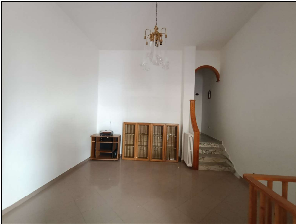
Fot. 5 – Piano terra: soggiorno –