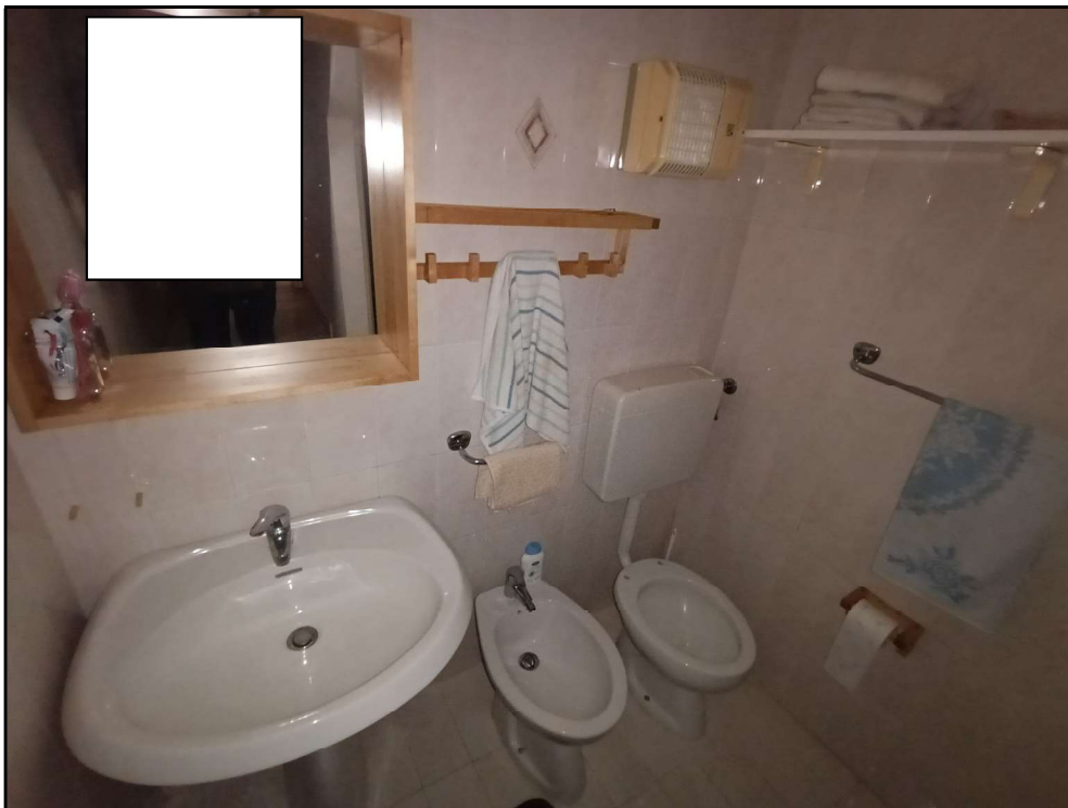
Fot. 6 – Piano terra: bagno –