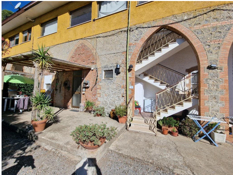
Foto 1- ingresso locale