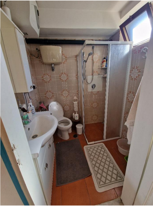
Foto 3- interno bagno