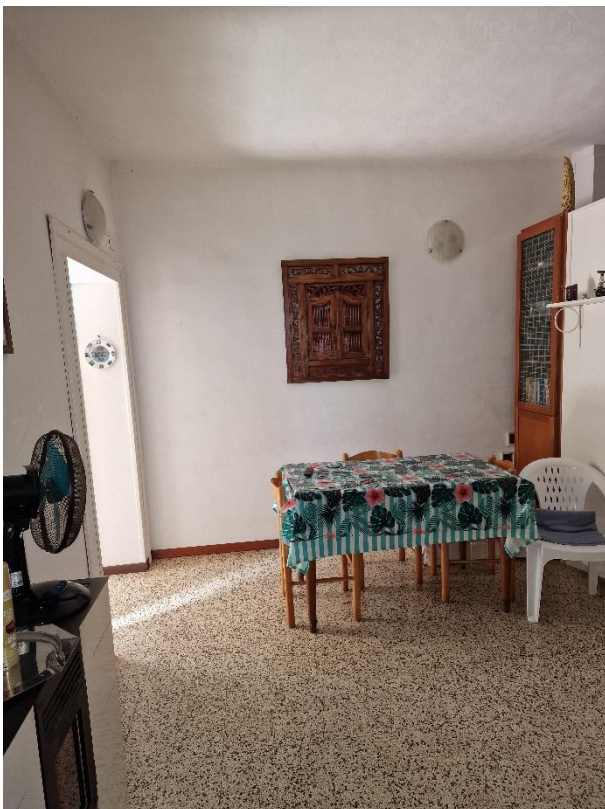
Foto 2- zona pranzo-soggiorno