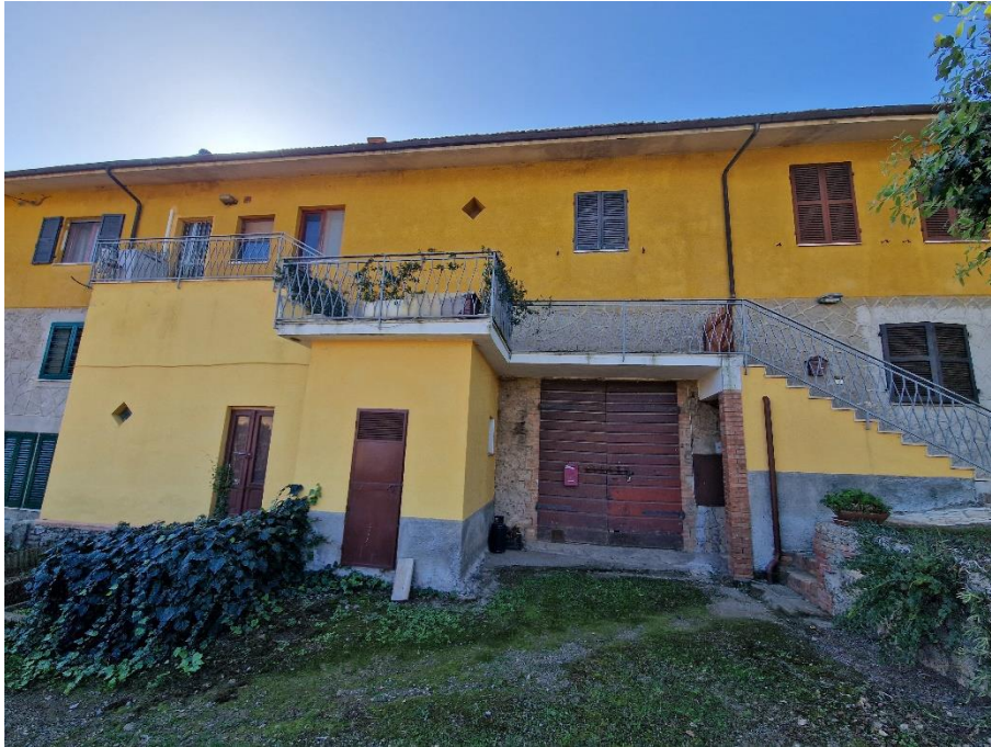
Foto 1- ingresso locale e corte frontistante