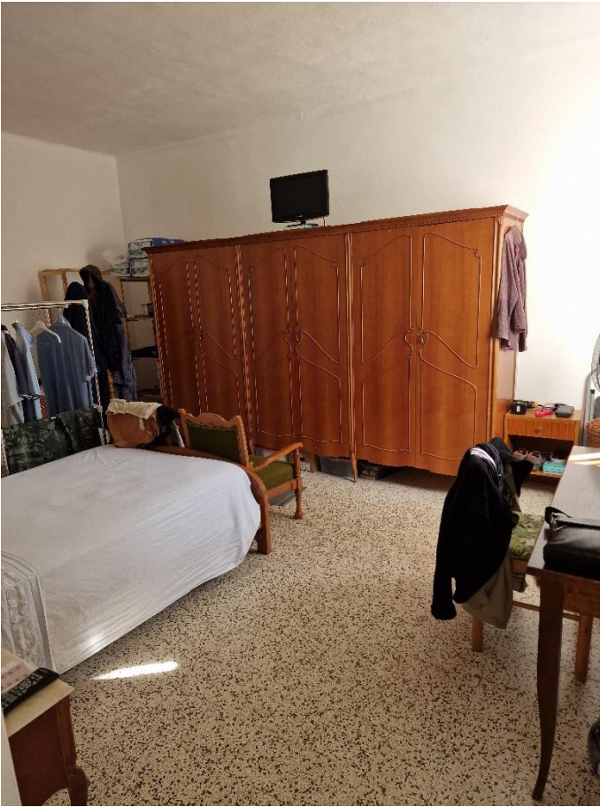
Foto 5- interno camera