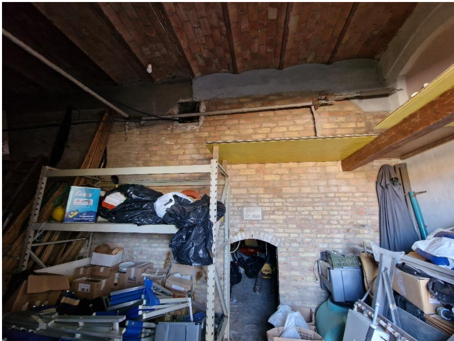
Foto 2- interno magazzino con accesso alla seconda stanza