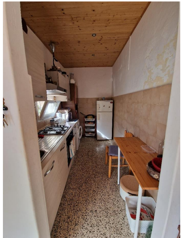
Foto 4- cucina