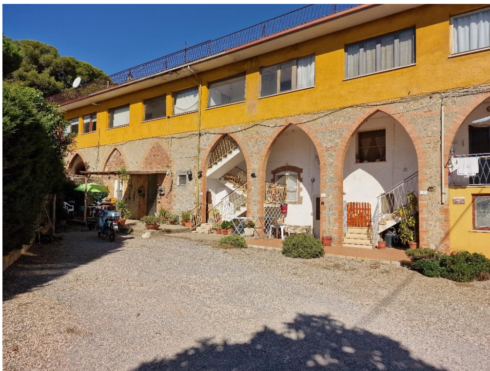
Foto 1 – vista scala di accesso al piano primo e corte di pertinenza