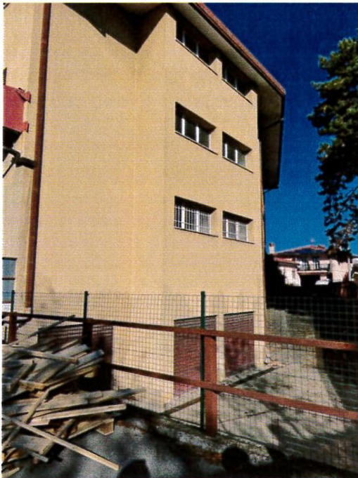
vista lato est del fabbricato pignorato, della rampa di discesa e degli accessi al piano seminterrato