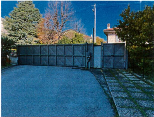
vista dal cortile dell'accesso promiscuo