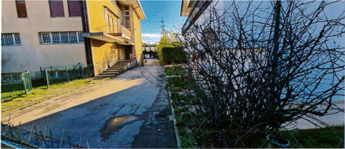
Particolare del passaggio promiscuo e dell'accesso pedonale