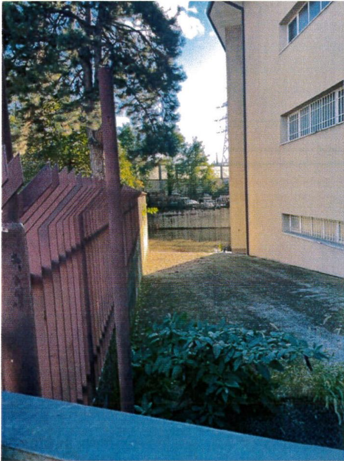
vista del lato est del fabbricato e della rampa di discesa dal cancello carrabile posto ad est