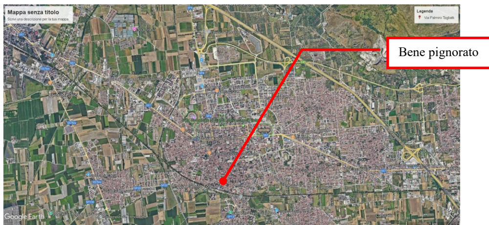
Figura 7 Collocazione del bene pignorato nel contesto urbano del Comune di Santa Maria Capua Vetere

Il contesto in cui sorge il fabbricato a cui appartiene il posto auto scoperto al piano terra è residenziale, ovvero ricade in prossimità della stazione ferroviaria di Santa Maria Capua Vetere a ridosso del centro; inoltre, dista circa tre chilometri dall'autostrada A1 e dalla SS 7 bis (Figura 7).