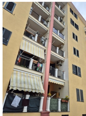
Figura 9 facciata sud del fabbricato a cui appartiene l'immobile pignorato