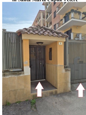
Figura 6 accesso pedonale e carrabile al fabbricato del Condominio Parco Sirio in Santa Maria Capua Vetere