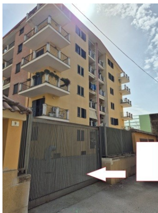
Figura 8 facciata ovest del fabbricato a cui appartiene l'immobile pignorato con accesso carrabile dal vicolo Togliatti

Il LOTTO N.4 è composto dal posto auto scoperto al piano terra [all. n. 54] (Figure 8 - 13).