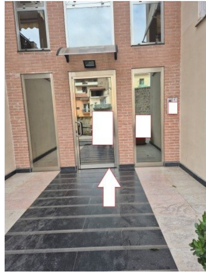
Figura 11 accesso al vano scala