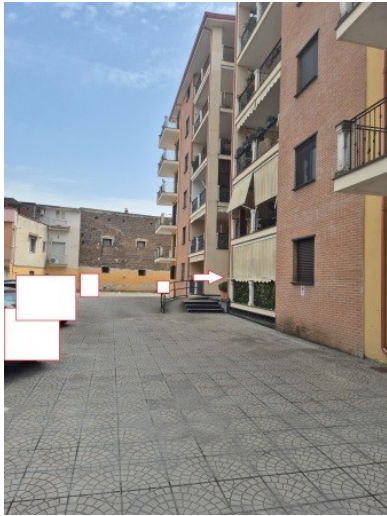
Figura 10 cortile comune con accesso al vano scala