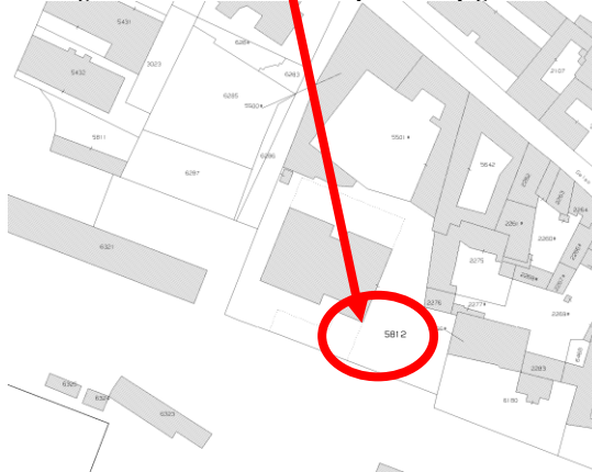
Figura 2 Mappa catastale del foglio 14 del Comune di Santa Maria Capua Vetere con l'individuazione della particella pignorata

Ai fini della vendita, per rendere il bene composto dal posto auto scoperto al piano terra maggiormente appetibile sul mercato, si è formato il LOTTO N.4 , avendo riscontrato la carenza di tali immobili nella zona residenziale di Santa Maria Capua Vetere, prospiciente la stazione ferroviaria.