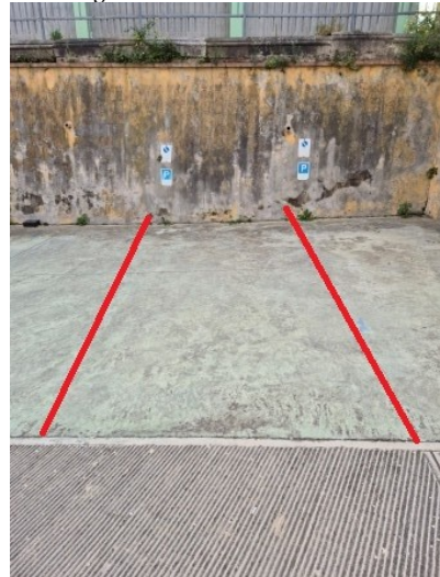
Figura 13 posto auto scoperto

Dalla planimetria [all. n. 55] del LOTTO N.4 è stato possibile dedurre la superficie del posto auto scoperto al piano terra pari a 15,00 mq (Figura 14):