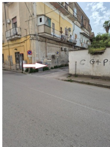
Figura 4 accesso al vicolo Togliatti da via Palmiro Togliatti in Santa Maria Capua Vetere