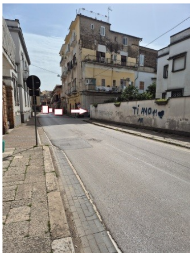
Figura 3 accesso al vicolo Togliatti da via Palmiro Togliatti in Santa Maria Capua Vetere

Il LOTTO N.4 è costituito dal posto auto scoperto al piano terra, con accesso dal cortile comune mediante i civici n.9 e n.11 del vicolo Togliatti in Santa Maria Capua Vetere; pertanto, il LOTTO N.4 è accessibile dai mezzi rotabili (Figure 3 - 6).