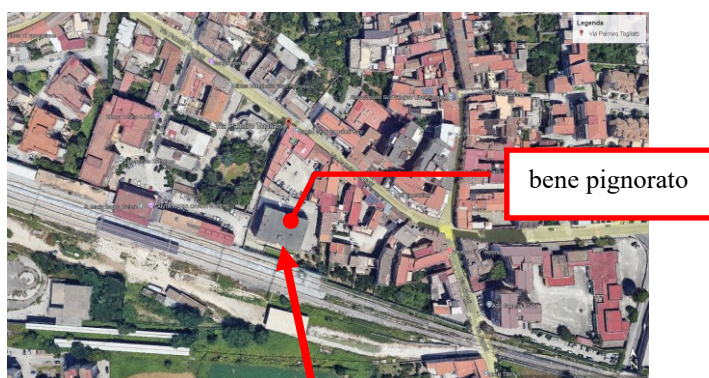
Figura 1 Localizzazione della particella pignorata

Inoltre, a seguito della sovrapposizione [all. n. 6] tra la foto satellitare e la mappa catastale elaborata dalla SOGEI [all. n. 7] , è stata riportata l'individuazione del bene oggetto del pignoramento (Figure 1 e 2).