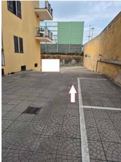
Figura 12 cortile comune per accesso al posto auto scoperto