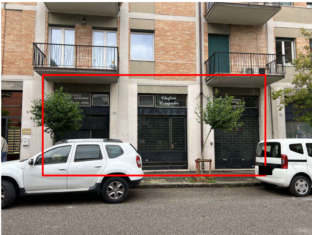
VERANDE DEL LOCALE COMMERCIALE

Tribunale di Verona E.I. n. 202/2023 R.E.