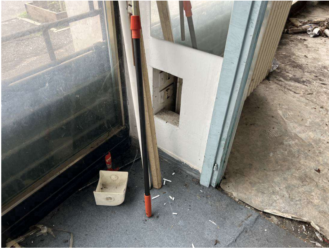
CONDIZIONE PAVIMENTO NEL LOCALE COMMERCIALE