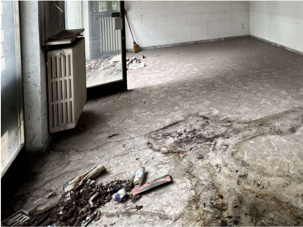
CONDIZIONE PAVIMENTO NEL LOCALE COMMERCIALE