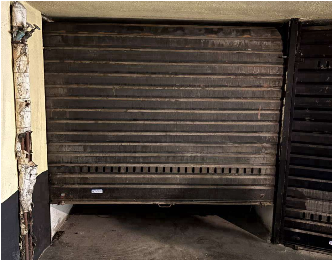
ACCESSO AL GARAGE – SERRANDA DANNEGGIATA