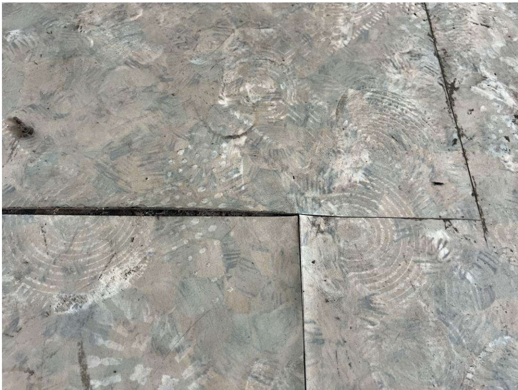
CONDIZIONE PAVIMENTO NEL LOCALE COMMERCIALE