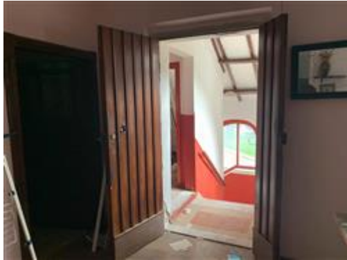
Portone di ingresso