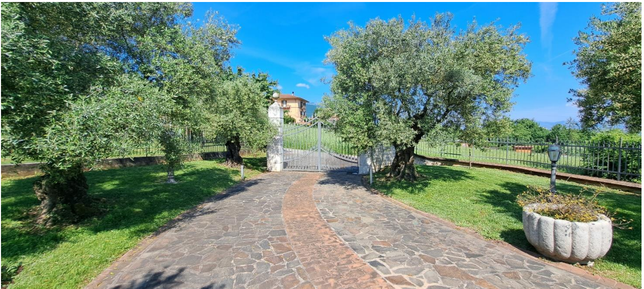
FG. 20 – PART. 413 – CECCANO (FR) – BENE N°3