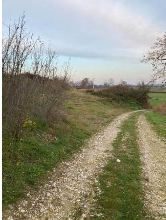
CAPEZZAGNA DI ACCESSO AI TERRENI