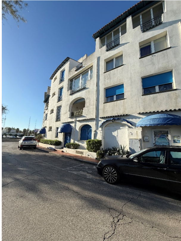
Foto – Esterno