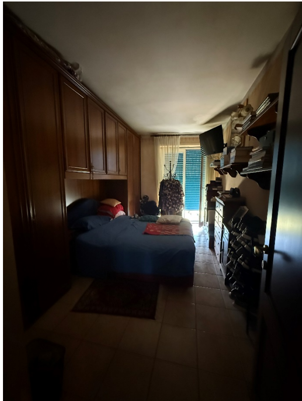
Foto – Camera