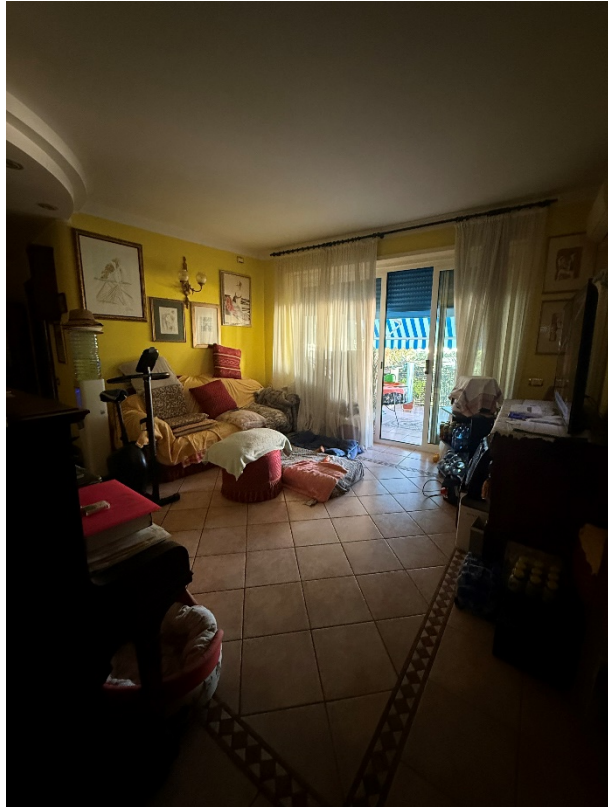
Foto – Soggiorno