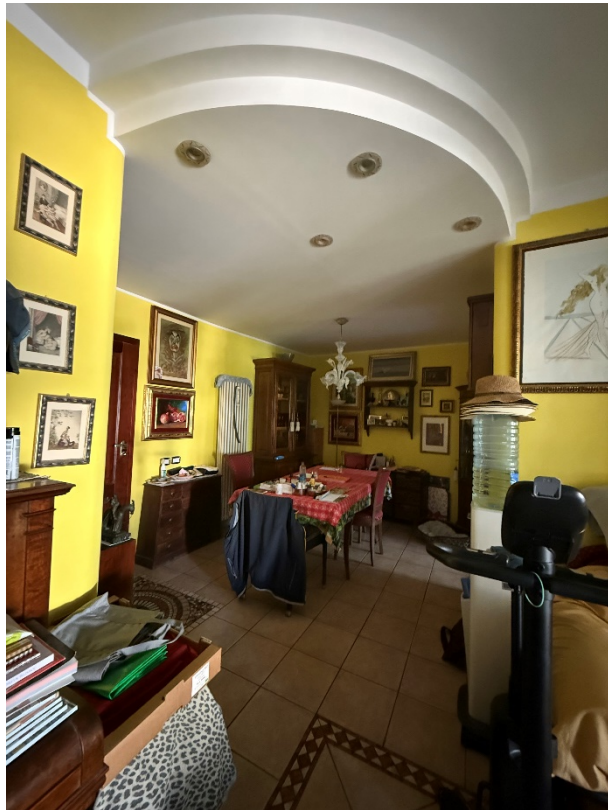
Foto – Ingresso