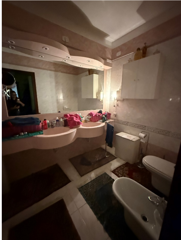
Foto – Bagno