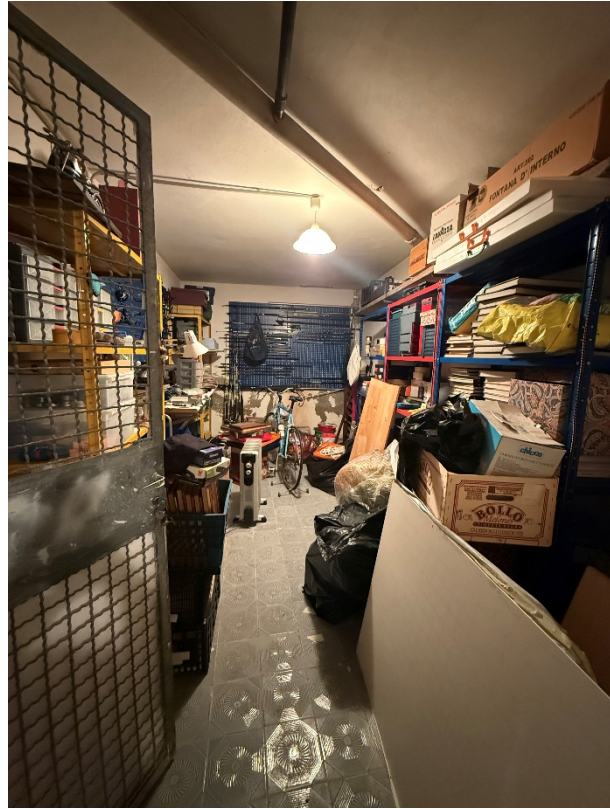
Foto – Cantina