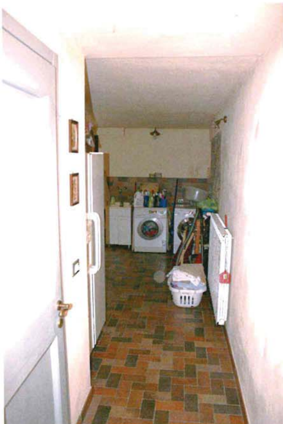
Lavanderia nella cantina 1