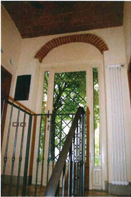
Ingresso al PT dal resede Sud