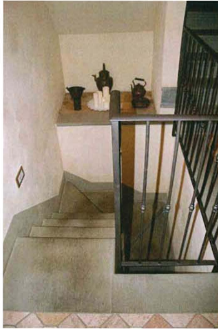
Scala interna di collegamento dal PS al PT