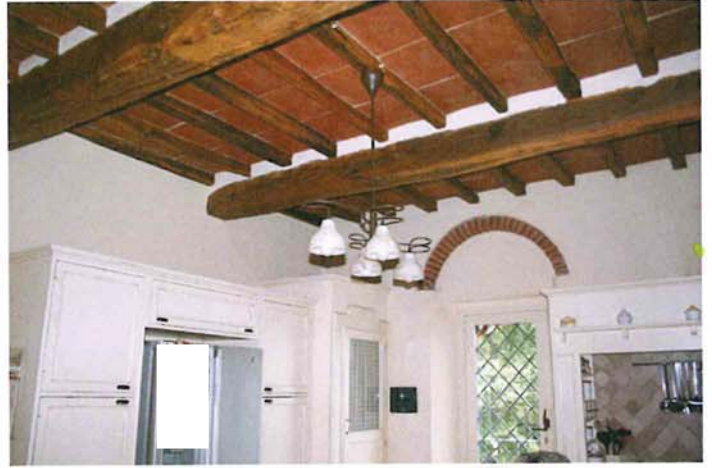
Cucina- porta di accesso dalla scala del resede Est