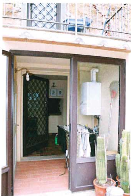
Accesso dal resede