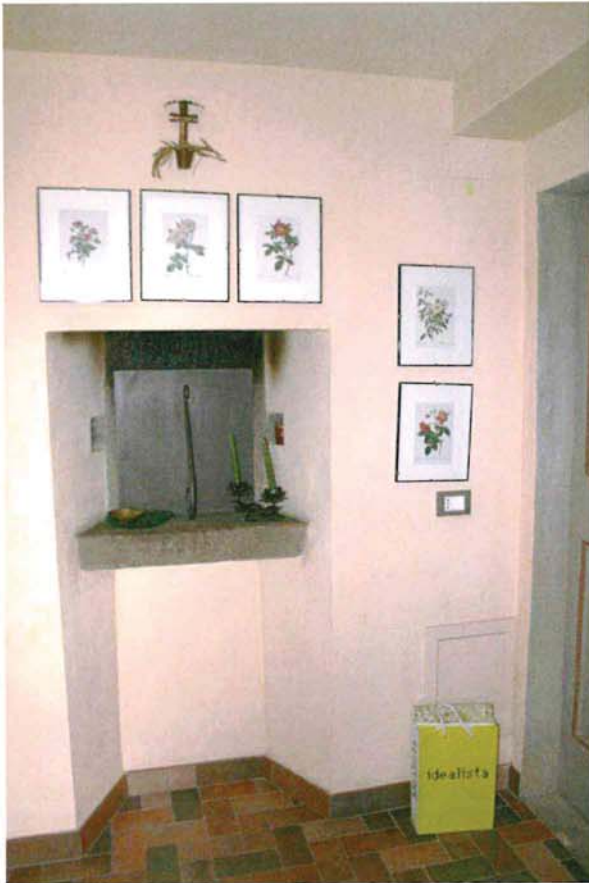
Forno nella cantina 1