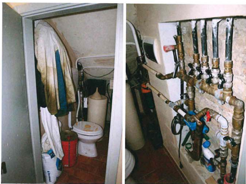
Vano tecnico nel sottoscala