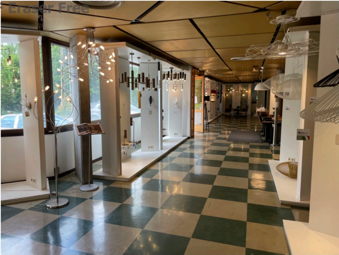
8 - Mostra piano T - sub. 6