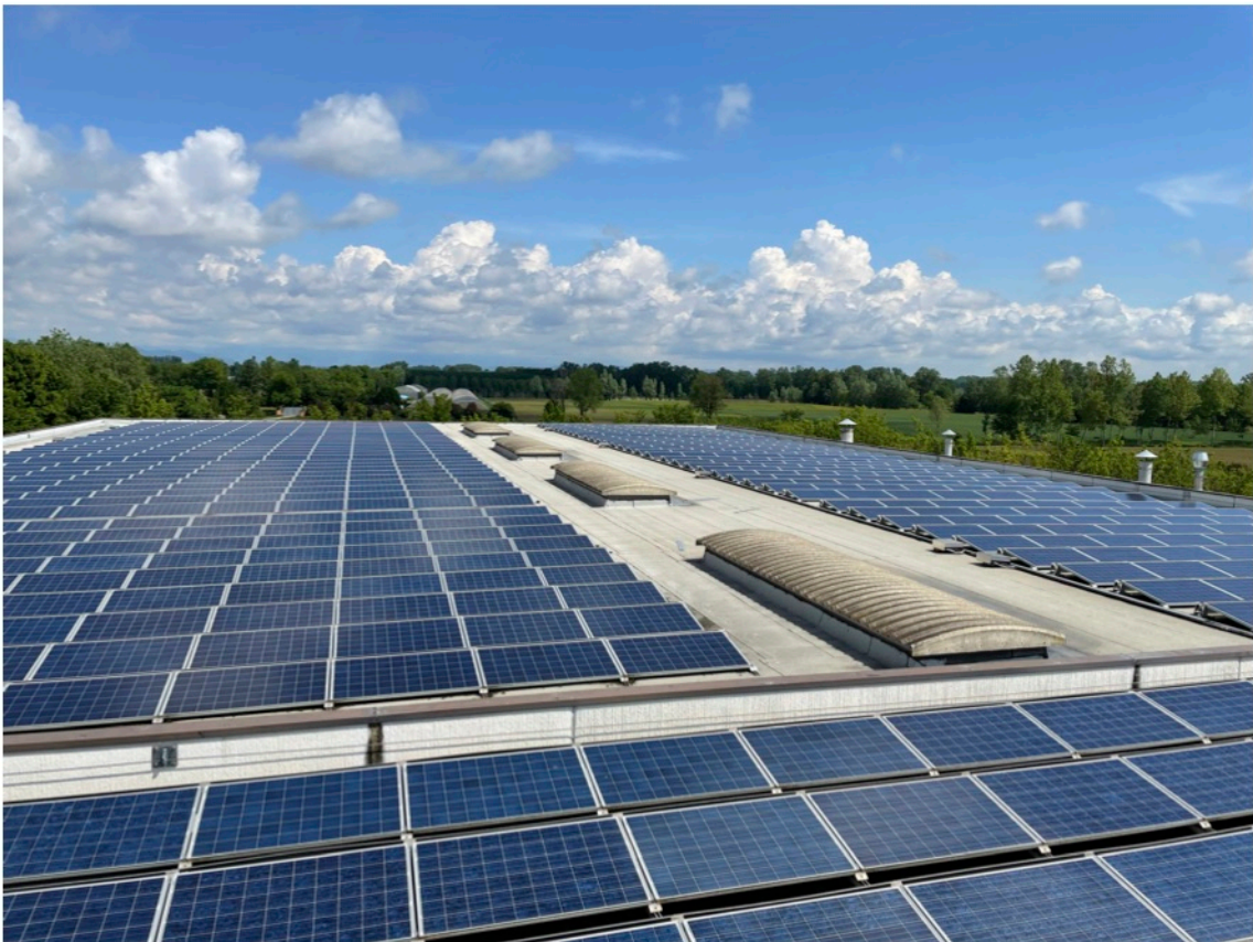
7 - Impianto fotovoltaico