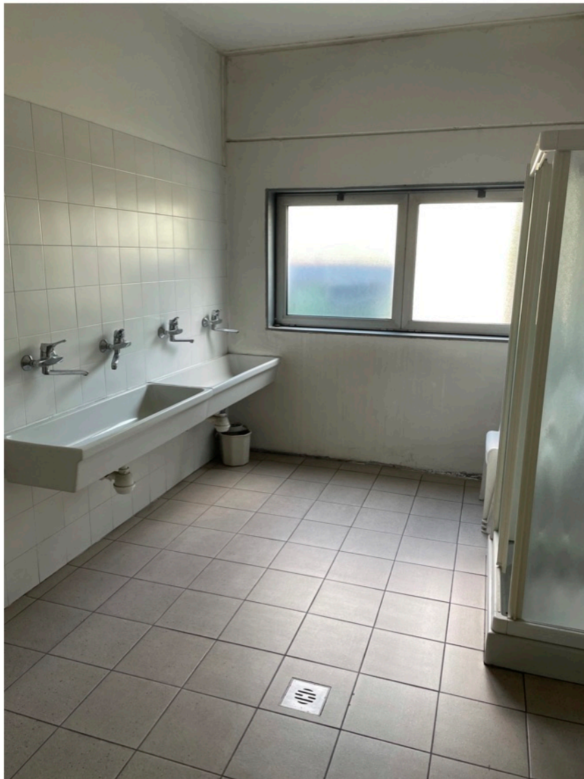
15 - Spogliatoi - sub. 5