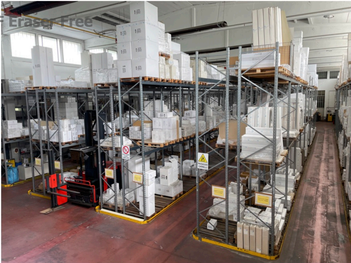
10 - Magazzino - sub. 6