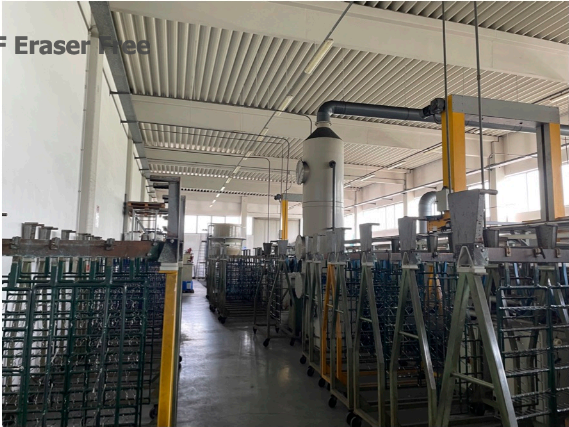
14 - Galvanica - sub. 5