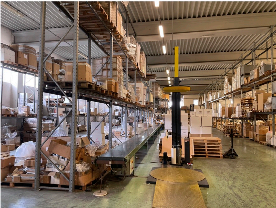
13 - Assemblaggio e imballaggio - sub. 5