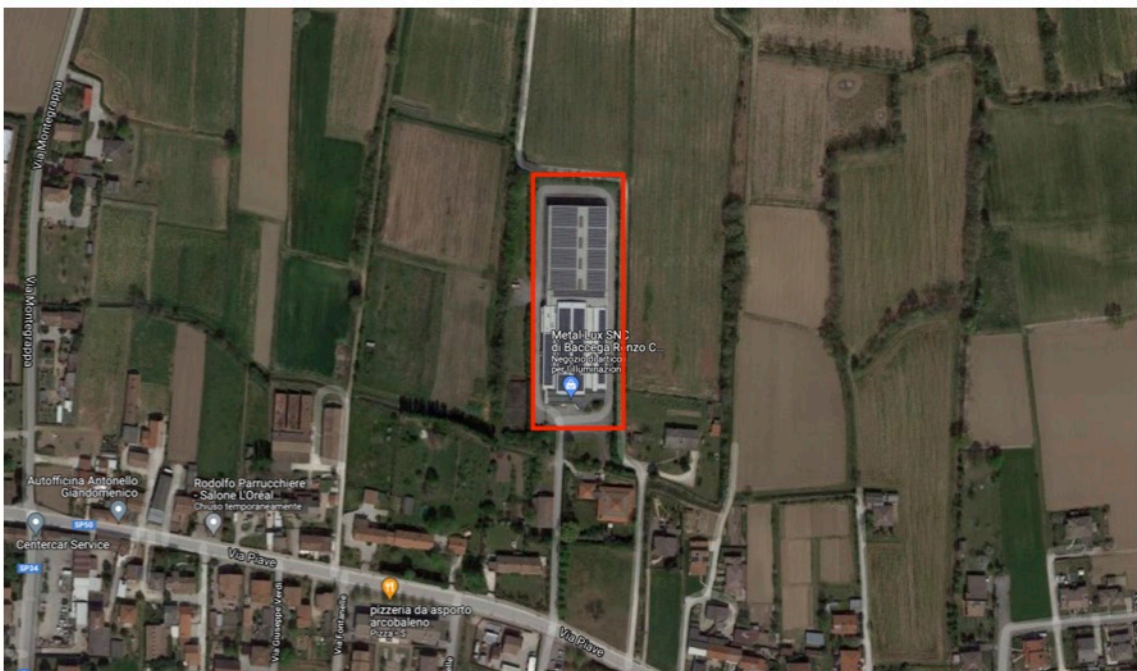
3 - Vista aerea