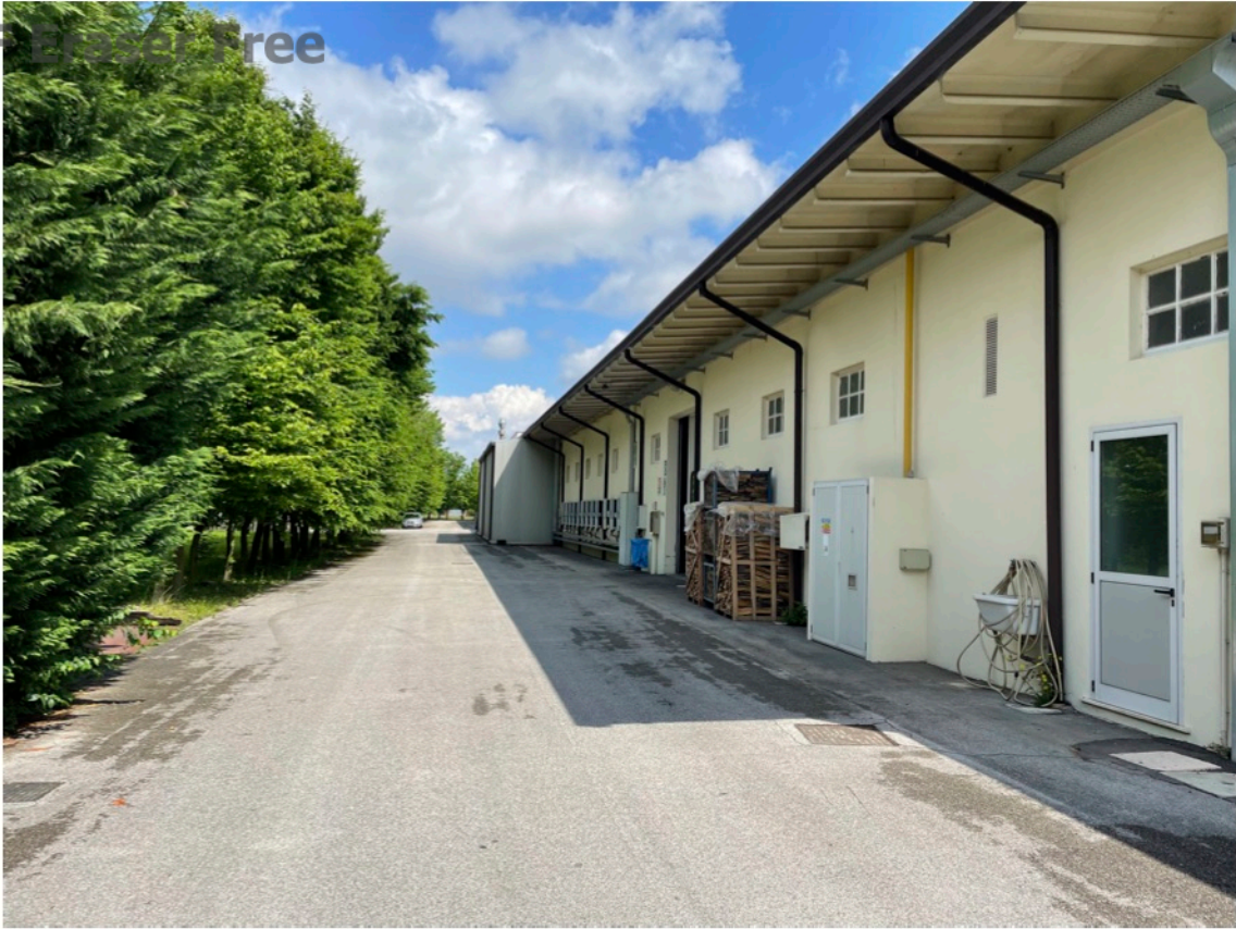
6 - Vista lato ovest