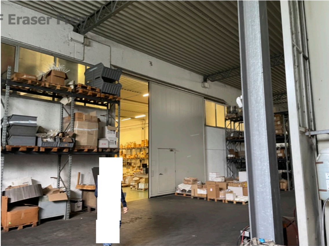
12 - Disimpegno - sub. 6