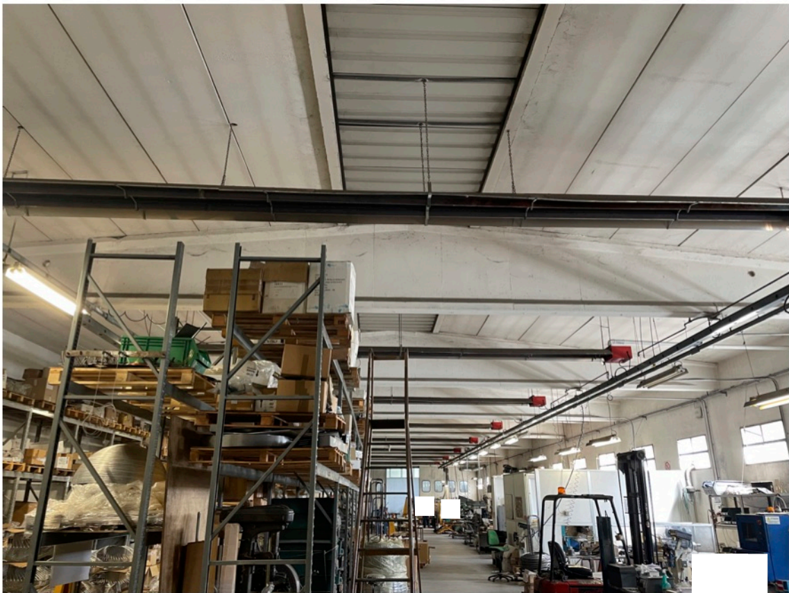
11 - Laboratorio - sub. 6