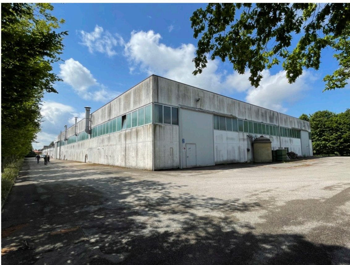
5 - Vista lati nord/est