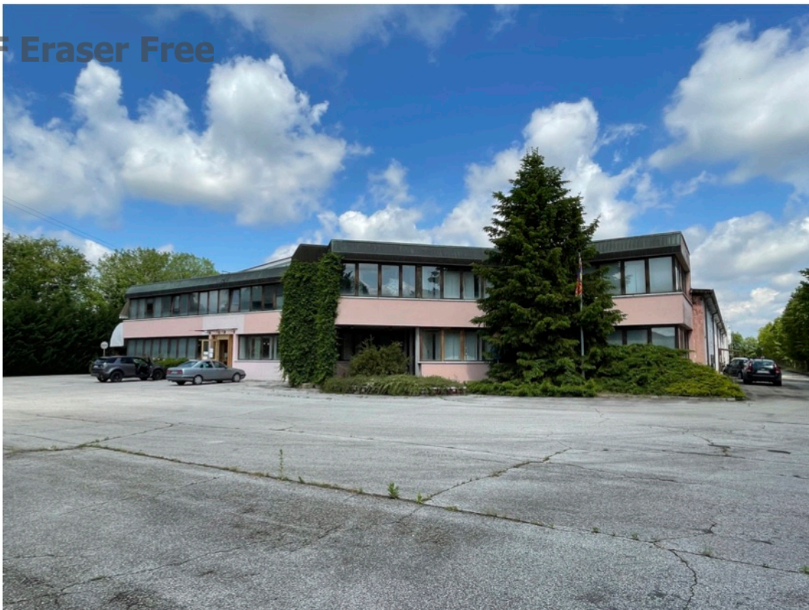
4 - Vista lati sud/est