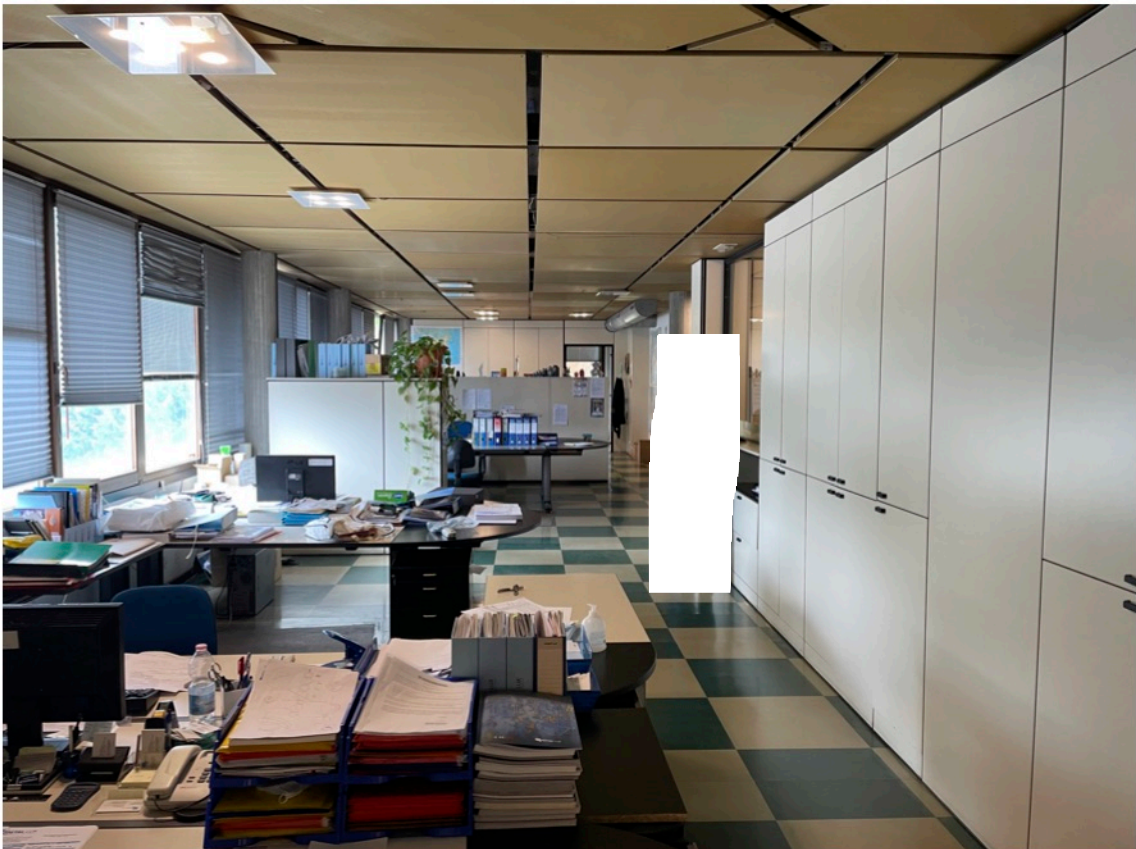
9 - Uffici piano 1° - sub. 6