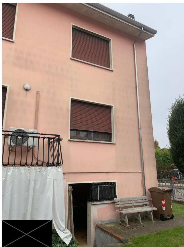
vista 3 retro abitazione